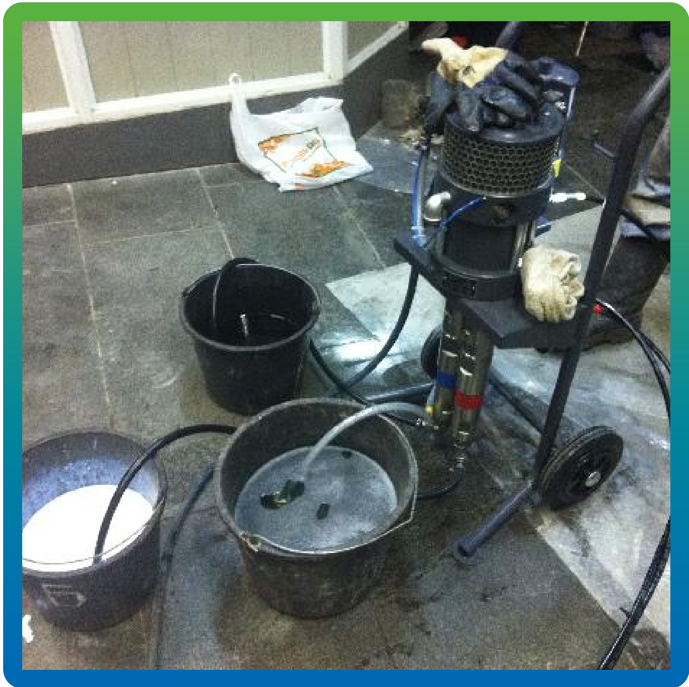
Пневматический 2К Насос БМ 1425 и акрилатный гель Манокрил Гель Р