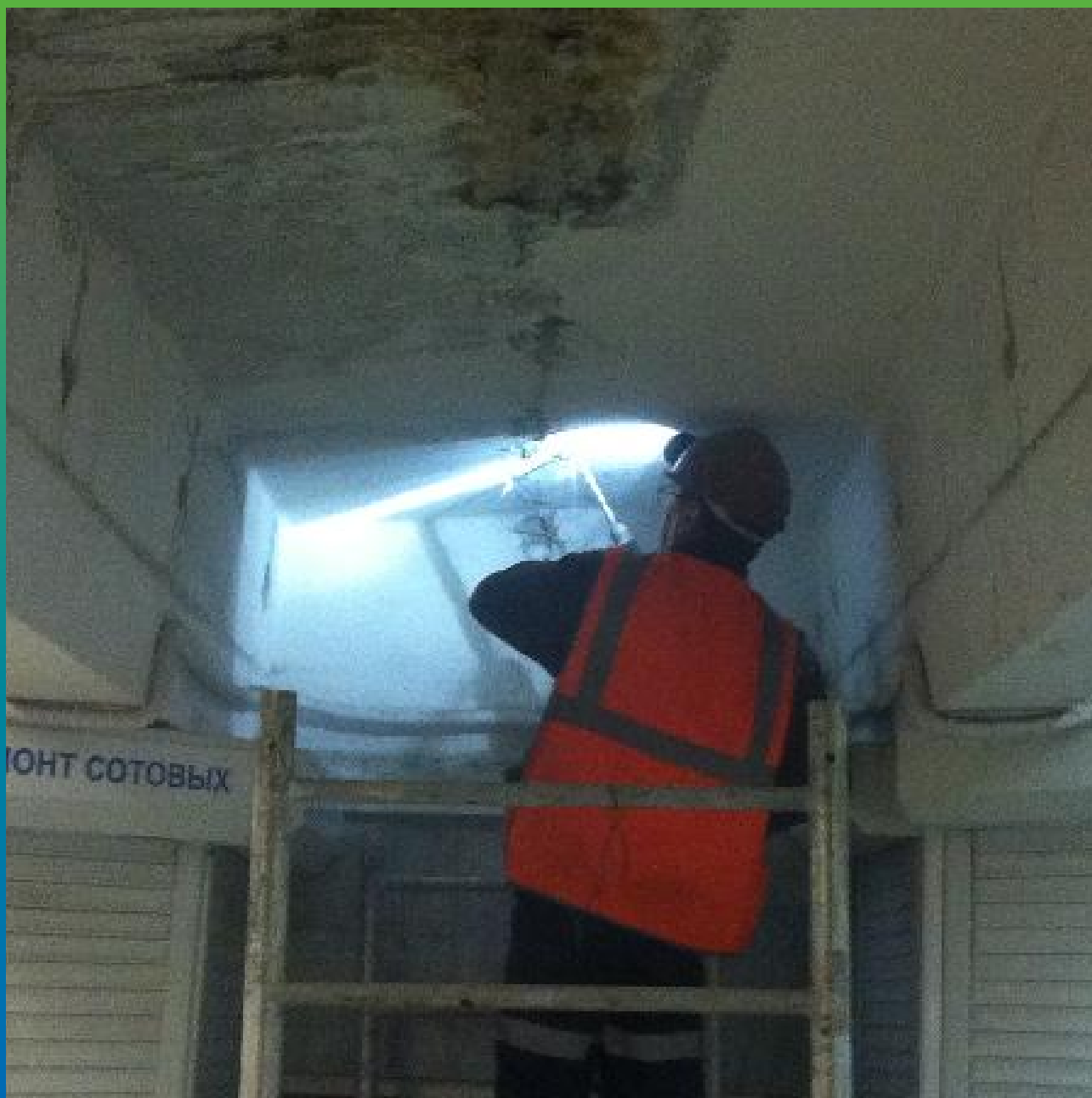
Бурение шпуров под пакера