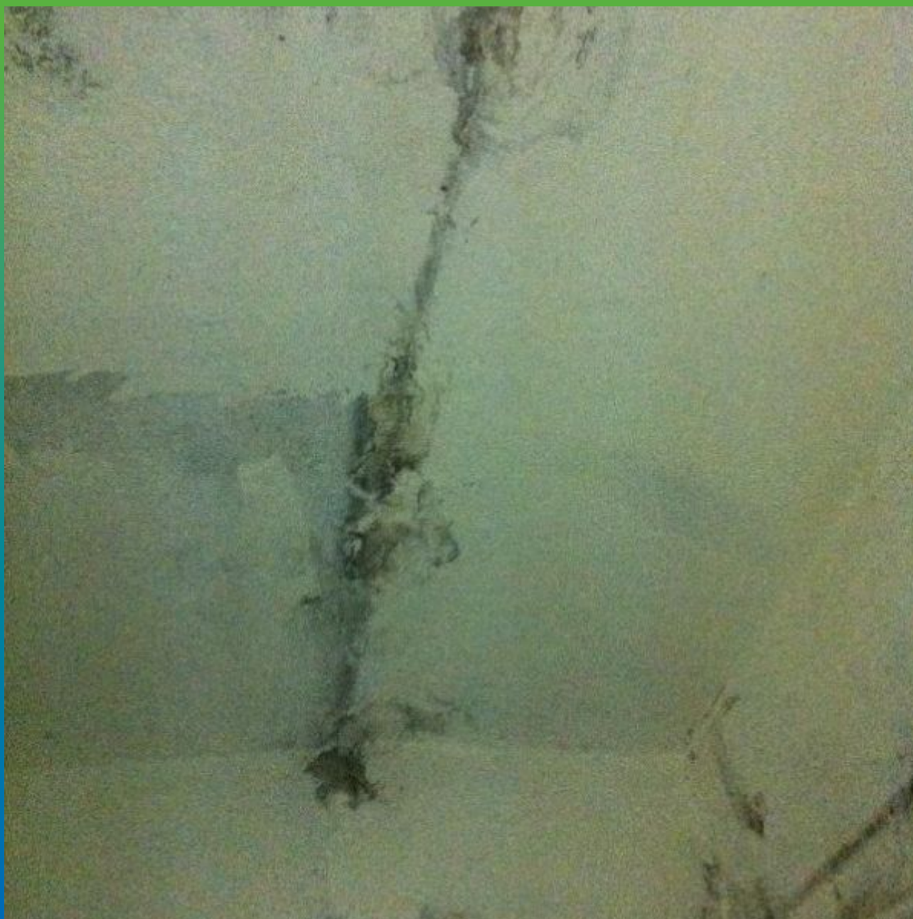
Первоначальный вид рабочего шва