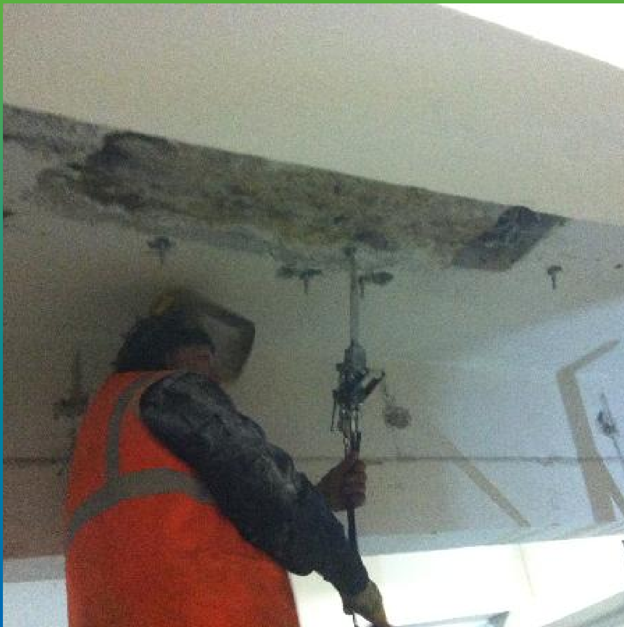
Инъектирование рабочего шва акрилатным гелем Манокрил Гель Р