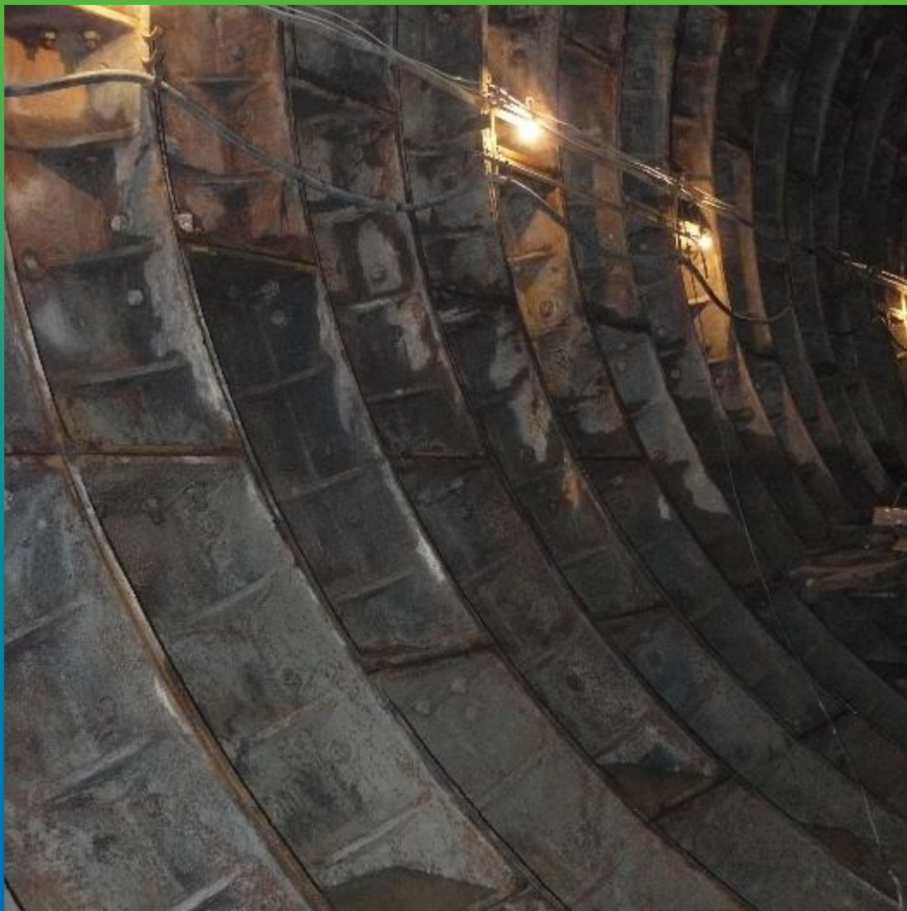
Герметизированные швы тоннеля метрополитена. Общий вид