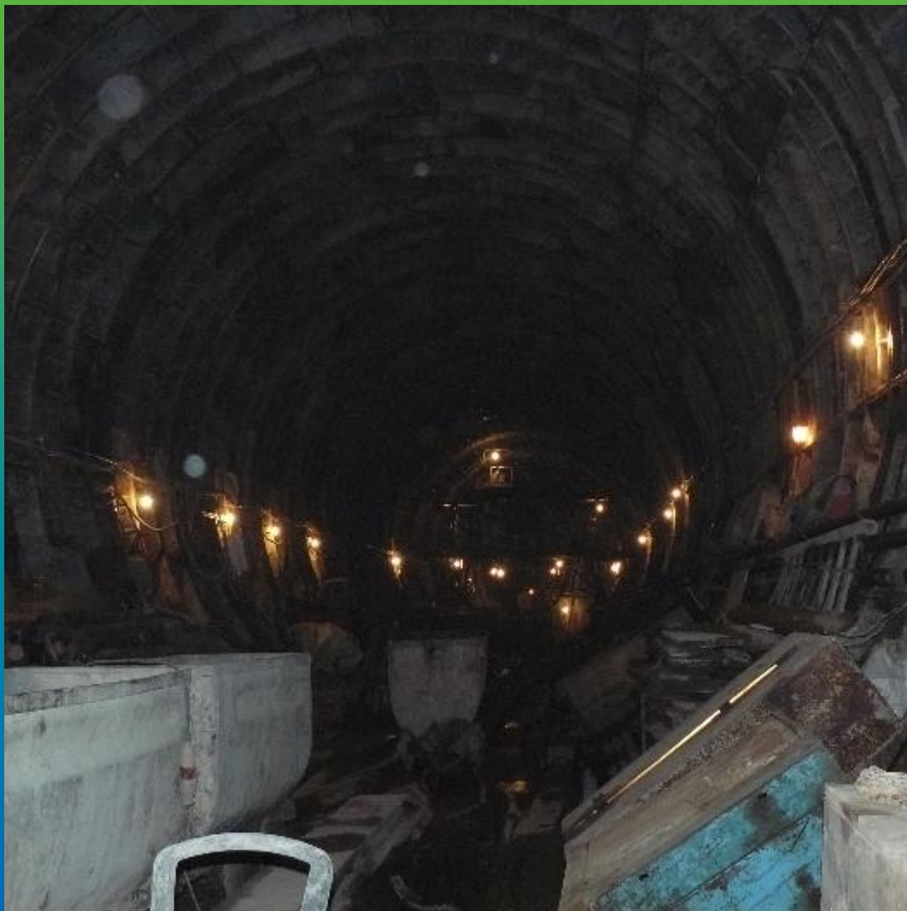
Общий вид ремонтного участка