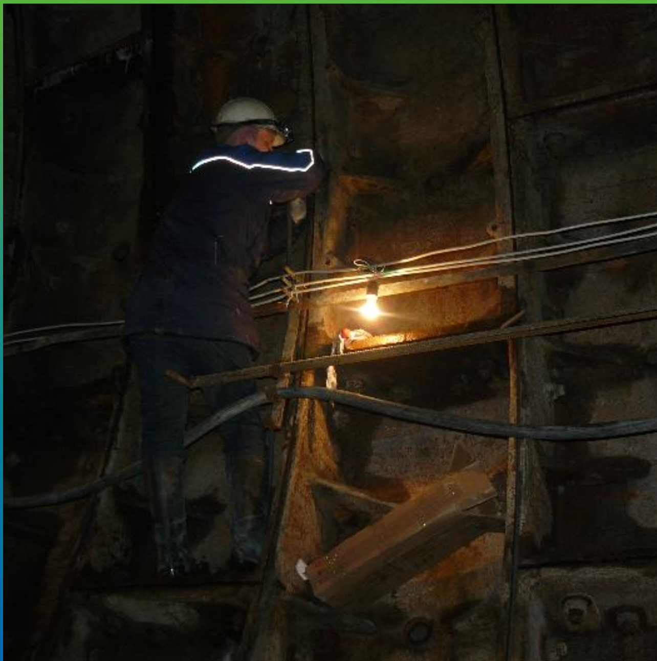
Очистка швов тьюбинга от грязи артефактов