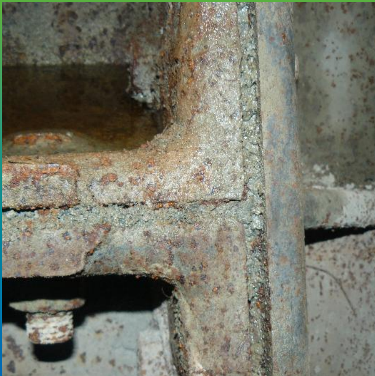
Швы чугунных тубингов. Частный вид