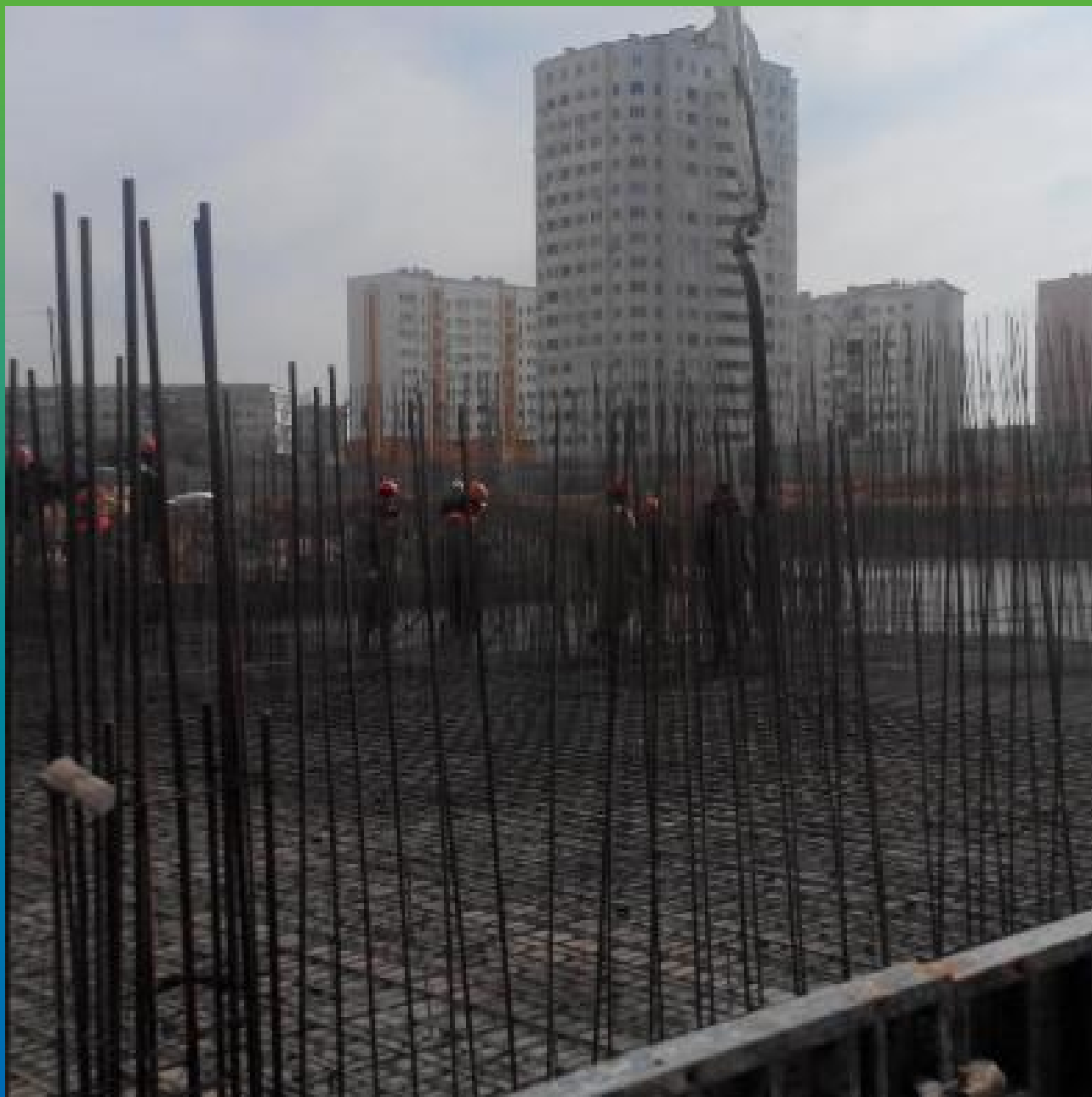
Отливка фундаментной плиты