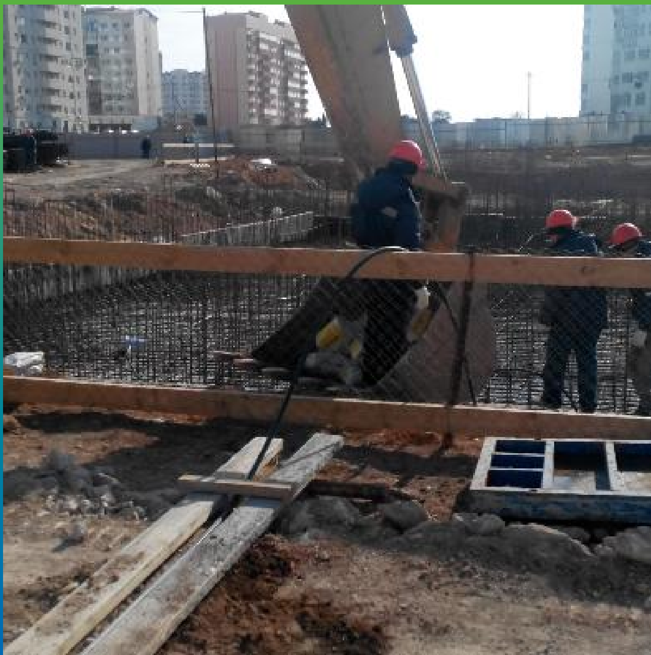
Распределение материала Стармекс Сил по бетонной подготовке