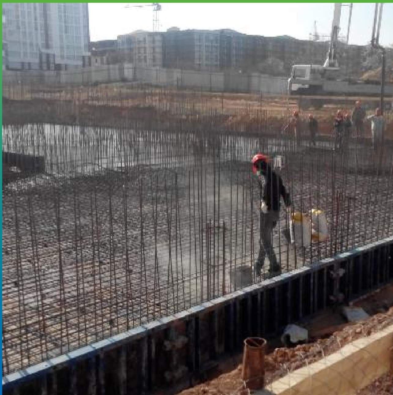
Просыпка Стармекс Сил на бетонную подготовку, гидроизоляция фундаментной плиты