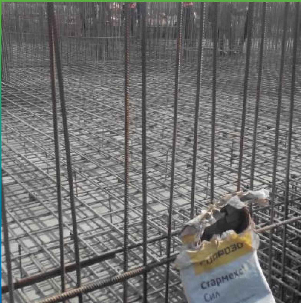
Вид просыпанной гидроизоляции Стармекс Сил