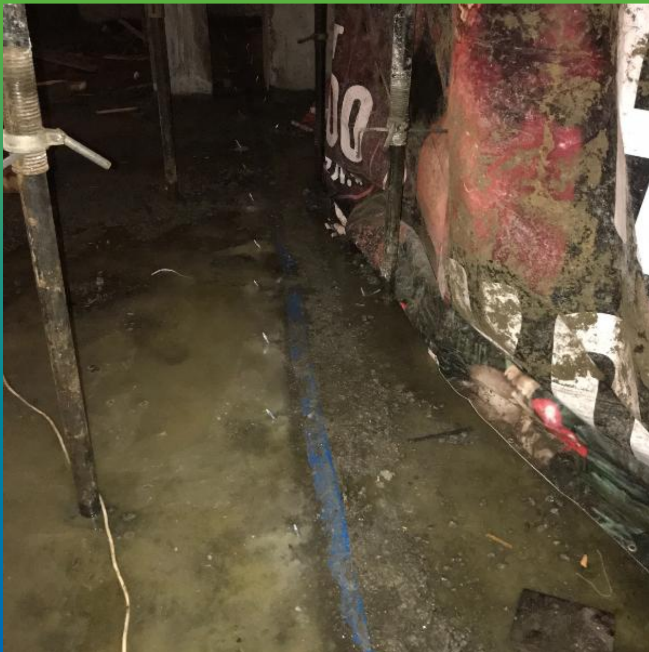
Пакеры, установленные для инъектирования