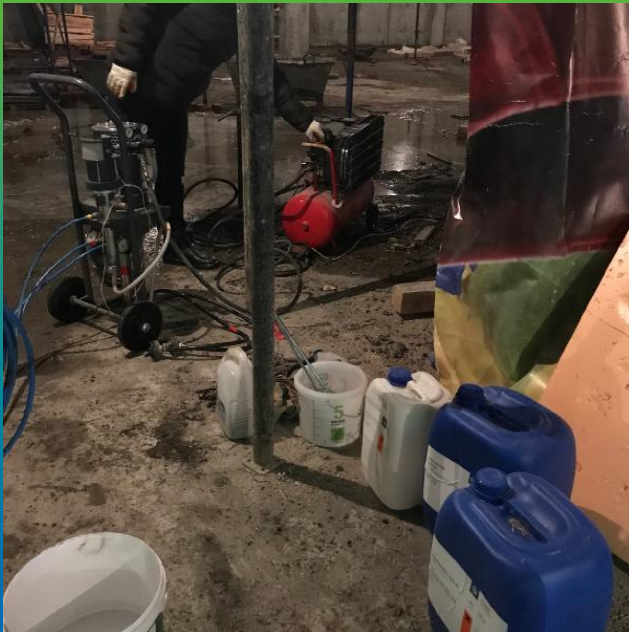
Насос БМ 1425 и Манокрил Гель на объекте