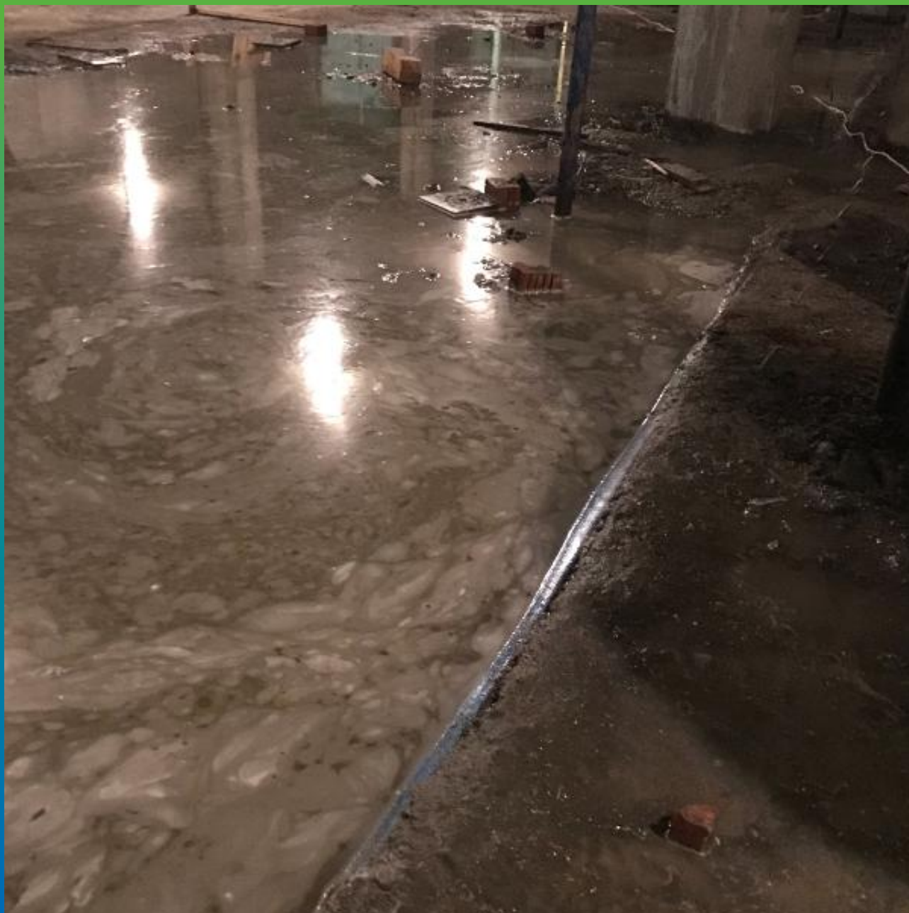
Деформационный шов с гидрошпонкой, давшей сбой