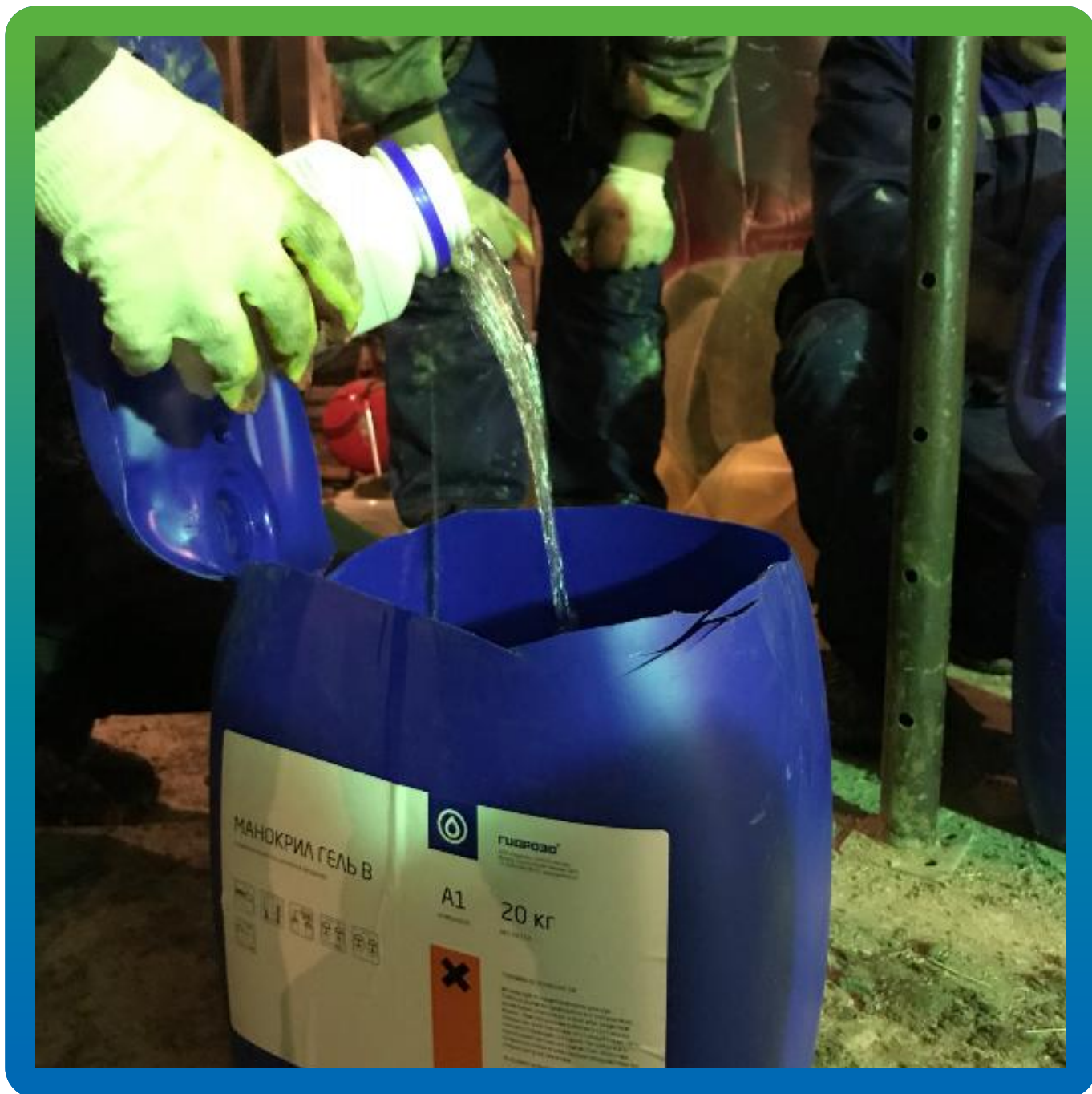
Приготовление состава Манокрил Гель