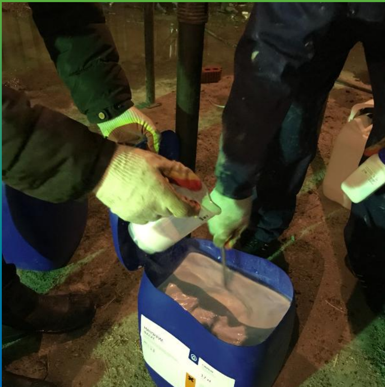
Приготовление состава Манокрил Флекс