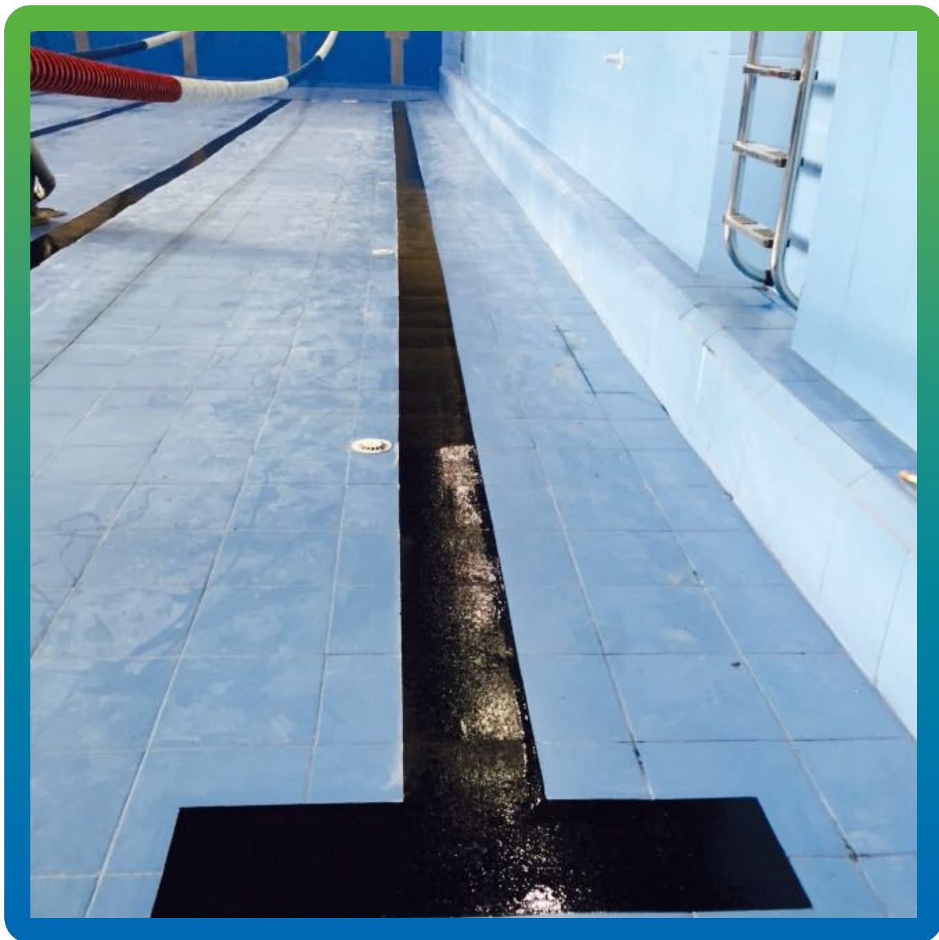
Вид нанесенного состава