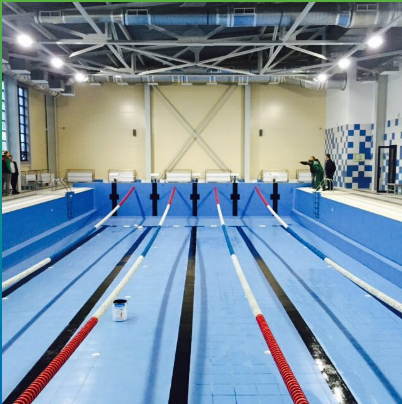
Общий вид разметки