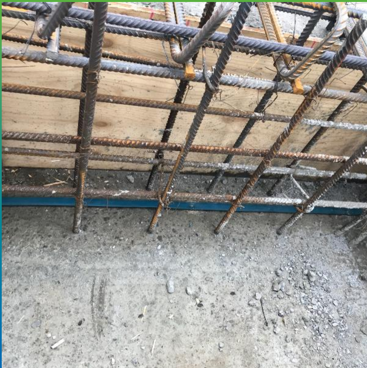
Монтированный профиль Манодил Свелл ХК 2507-АД