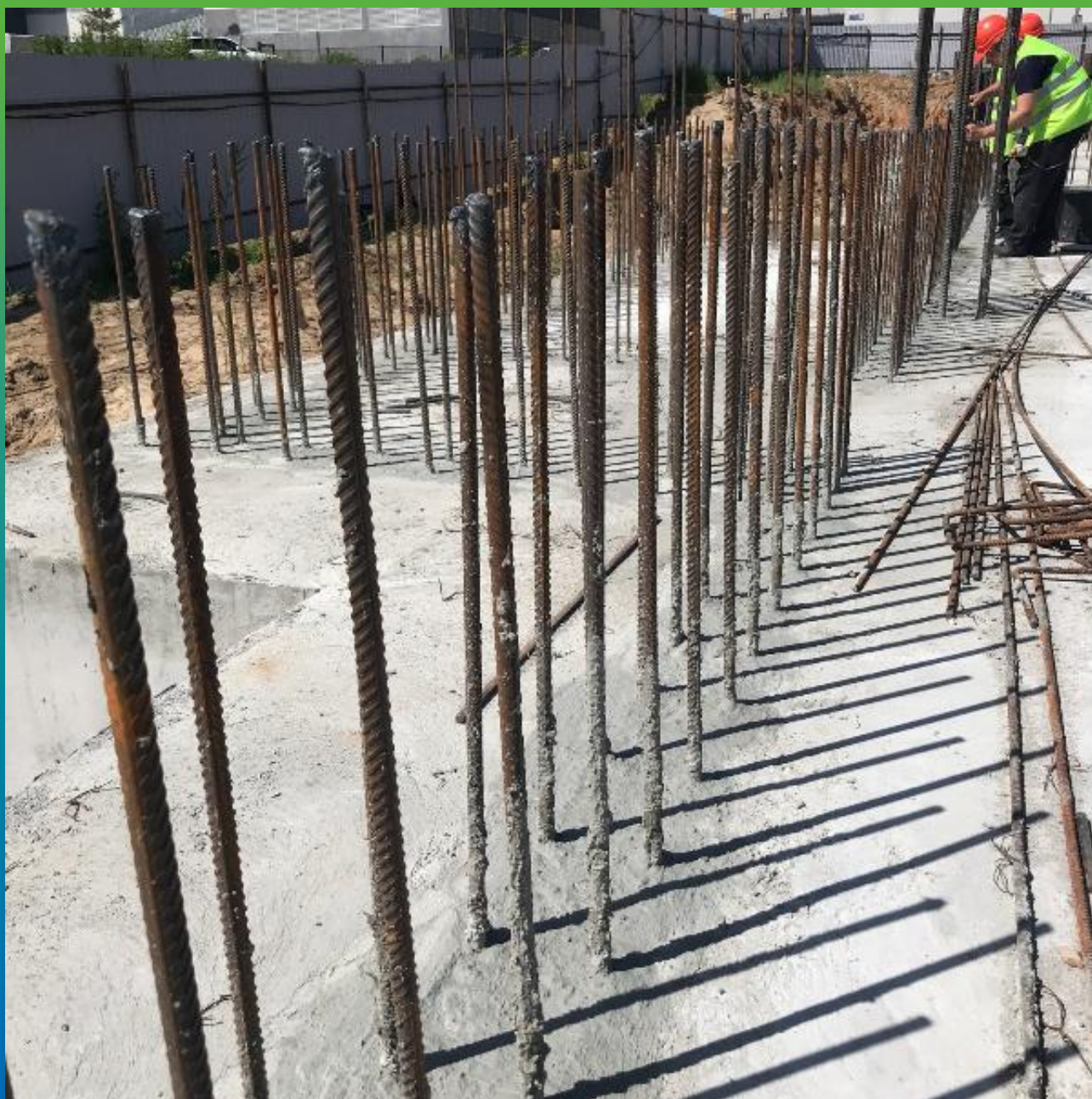
"Холодный шов" с нанесенной гидроизоляцией Стармекс Сил