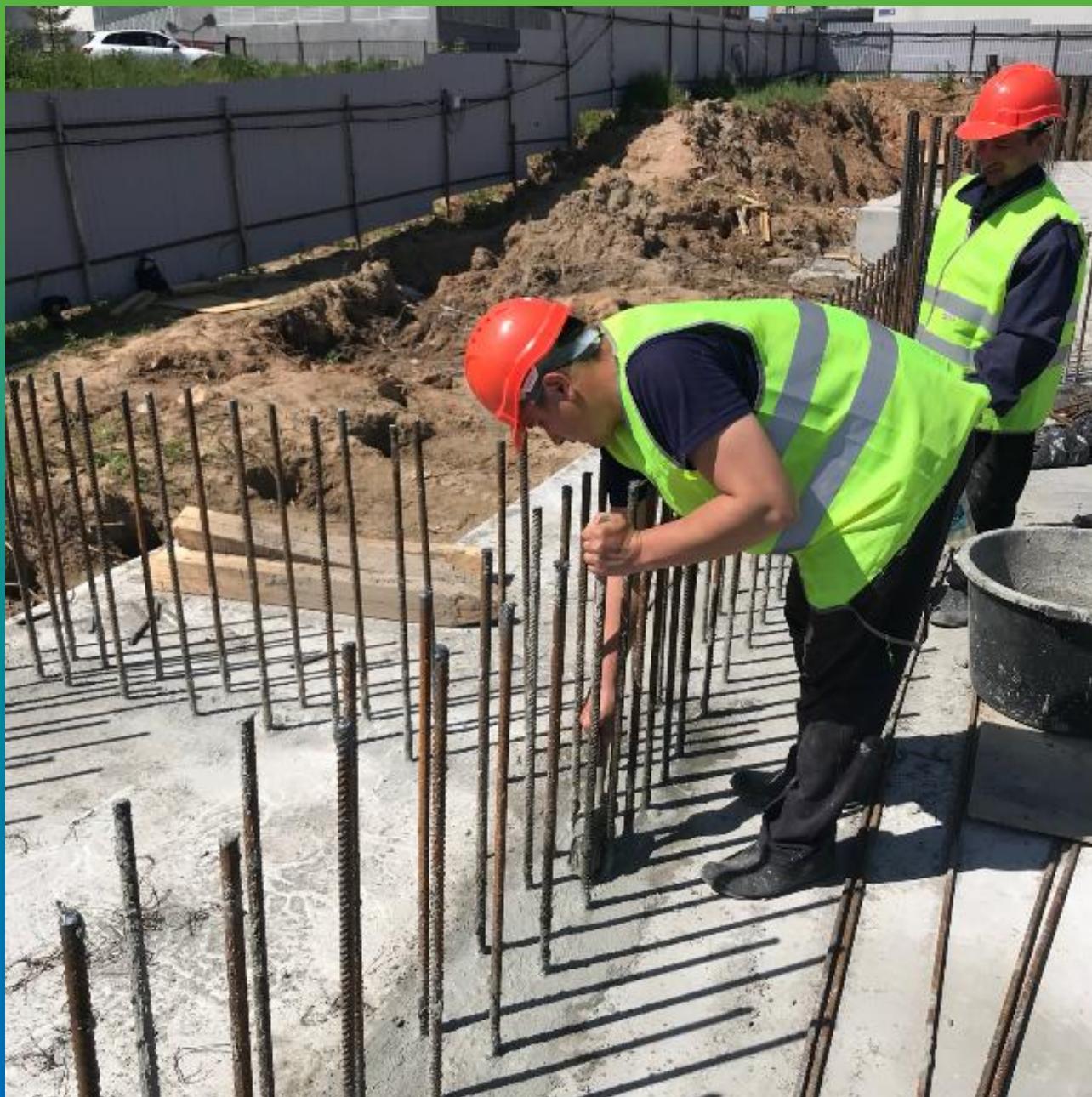
Обмазка "холодного шва" составом Стармекс Сил