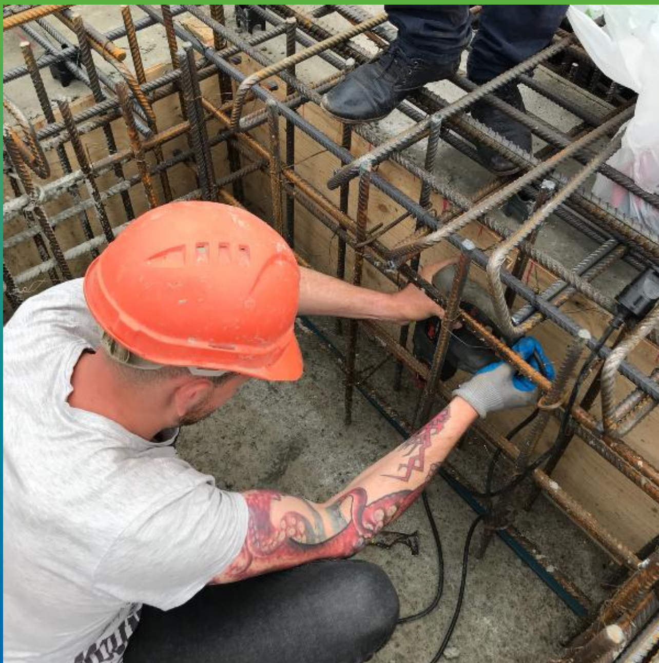
Монтаж профиля Манодил Свелл ХК 2507-Ад в "холодные швы" прямков