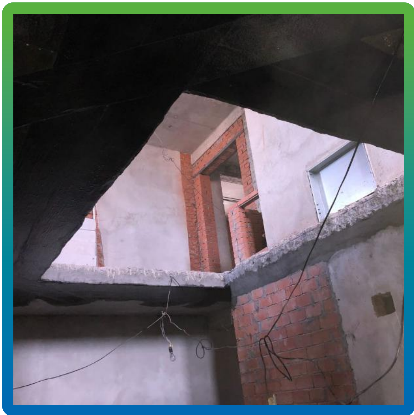
Монтированная система усиления Армошел