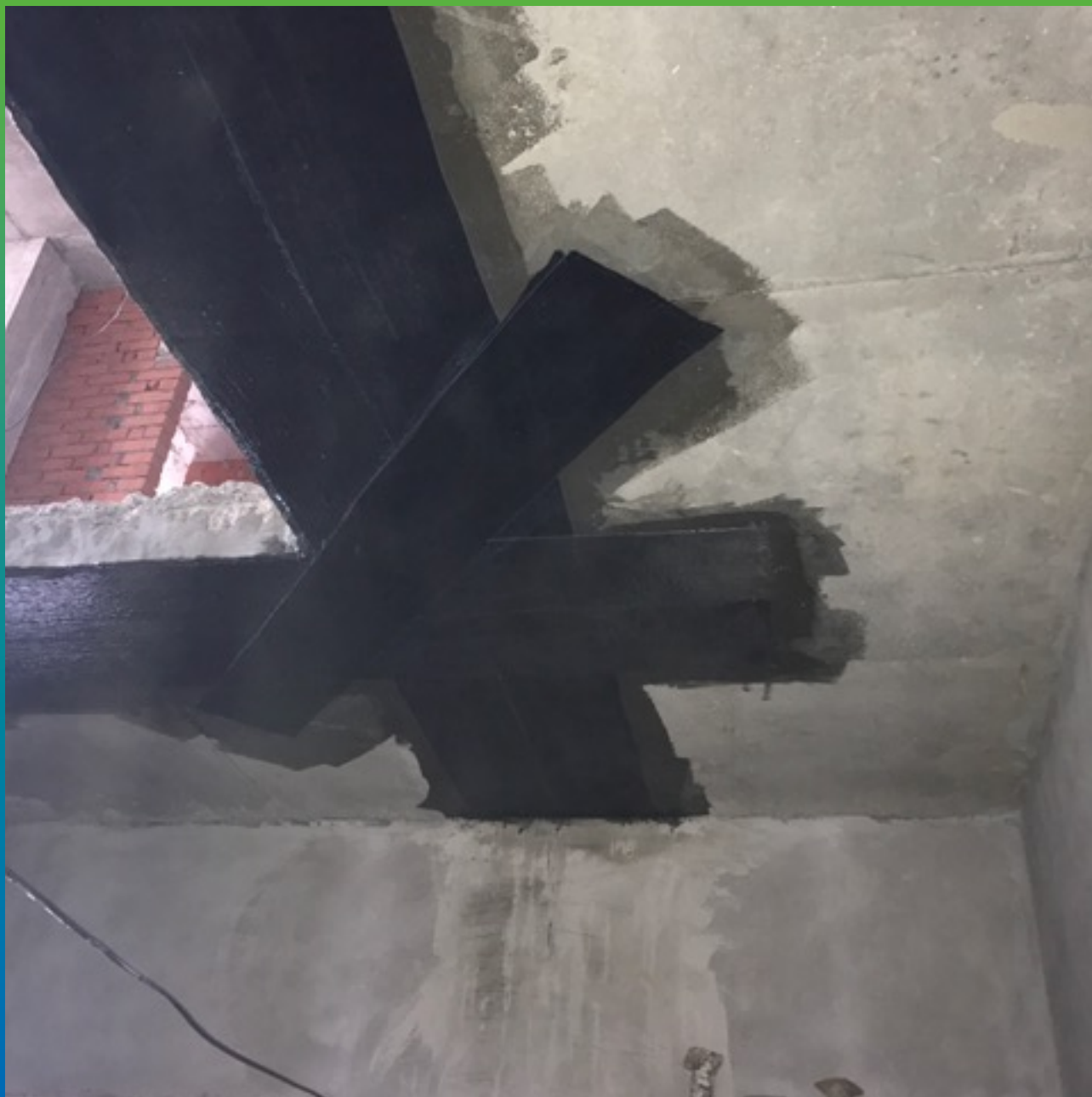
Монтированная система усиления Армошел