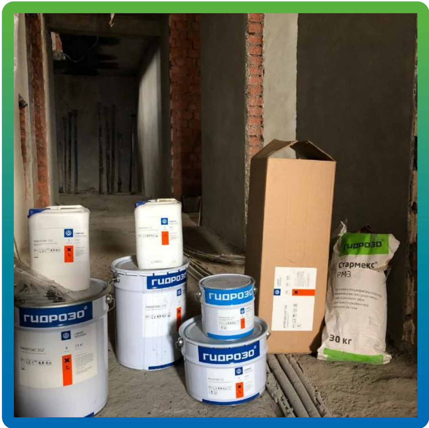
Материал на объекте