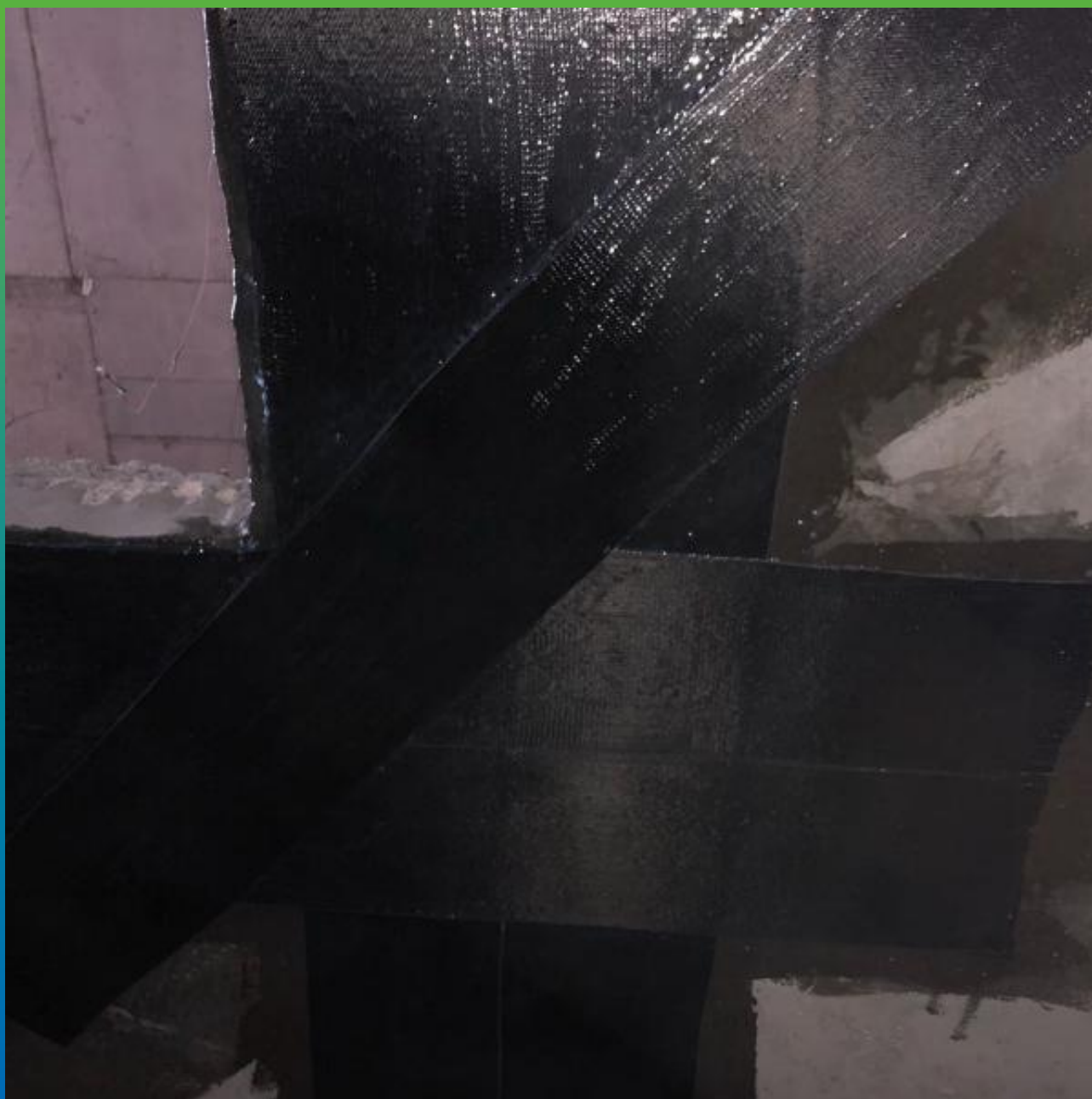
Монтируемая система усиления Армошел