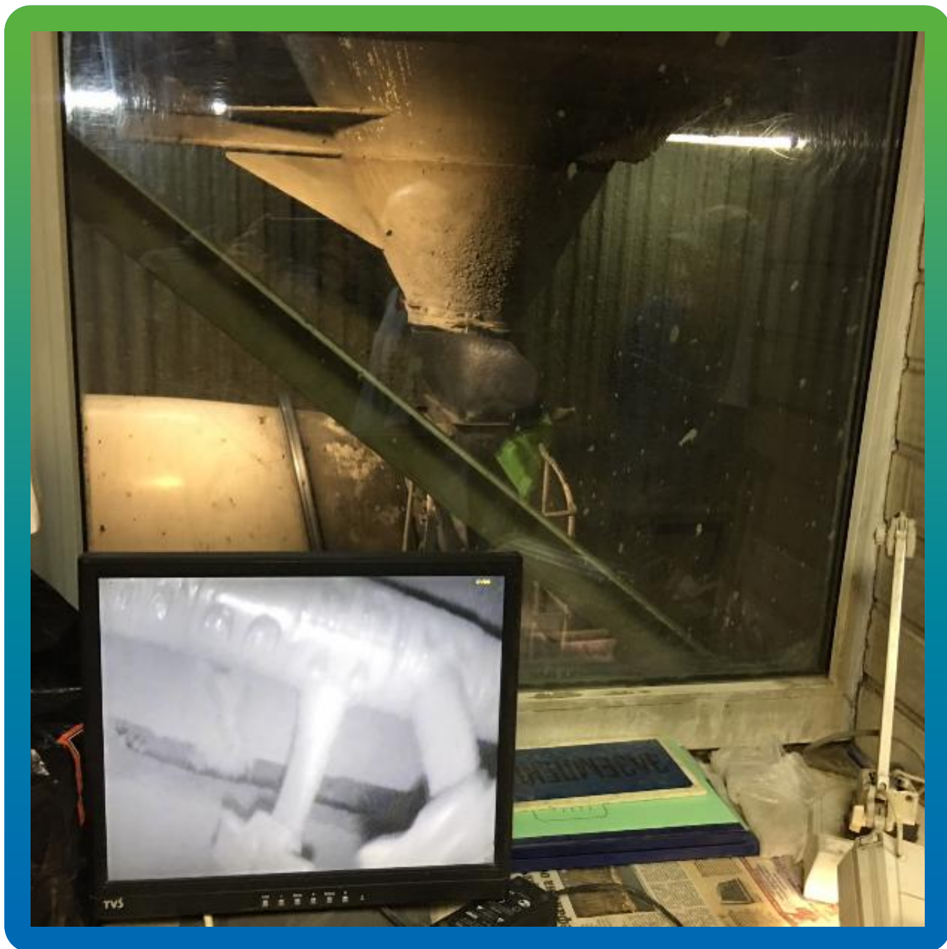
Выгрузка бетонной смеси в автобетоносмеситель