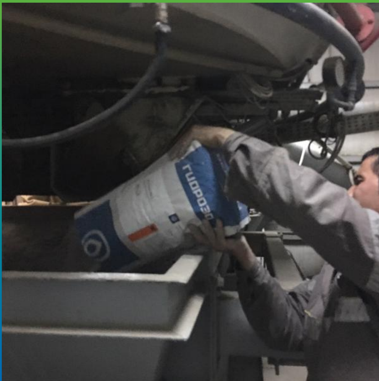
Введение добавок в бетонную смесь