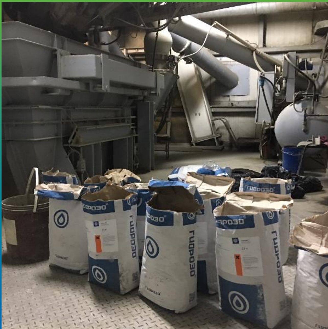
Добавки Реолен Адмикс и Реолен МКЗ на бетонном заводе