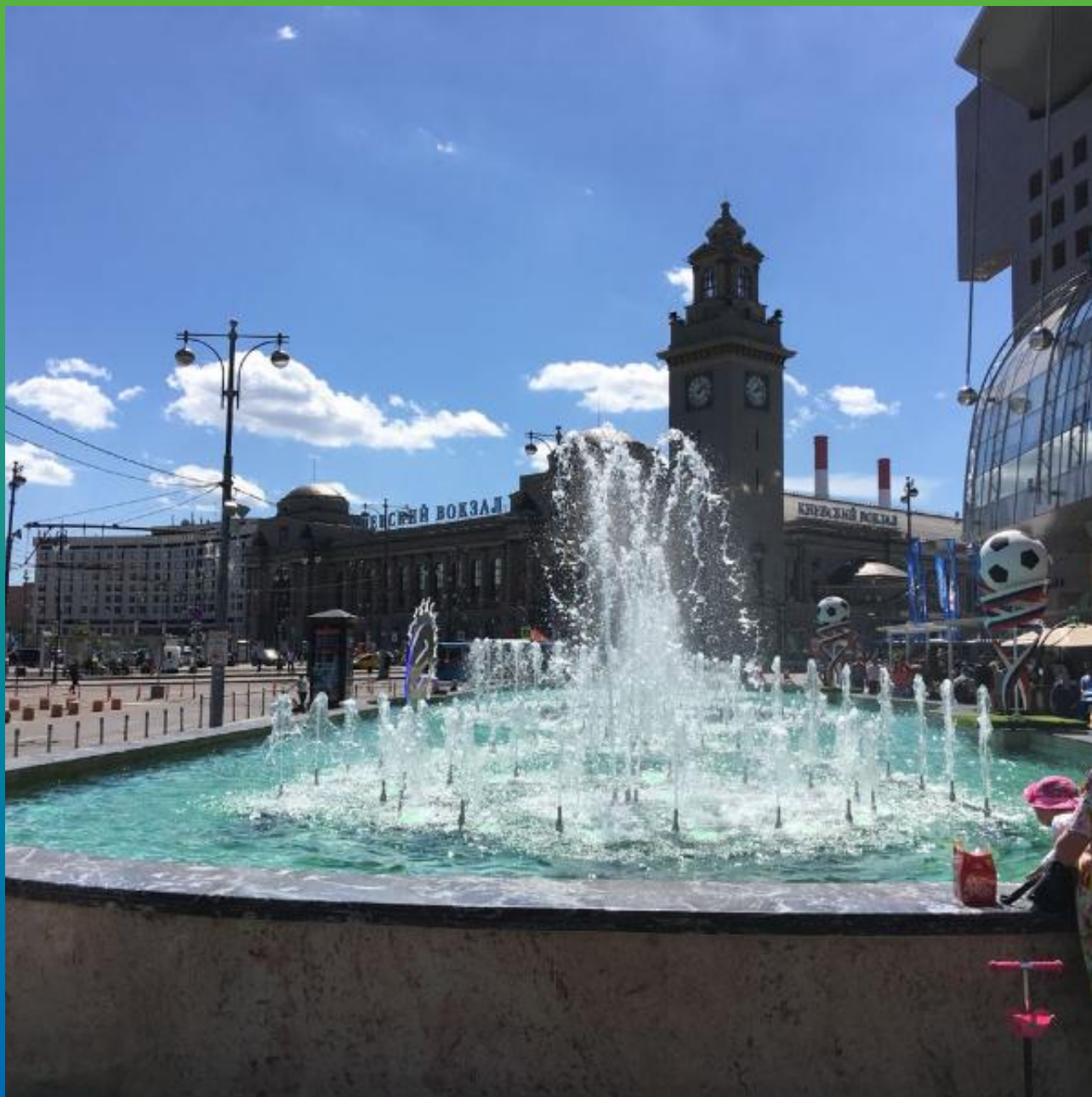
ФОНТАН ПЕРЕД ТЦ "ЕВРОПЕЙСКИЙ" НА КИЕВСКОЙ ПЛОЩАДИ