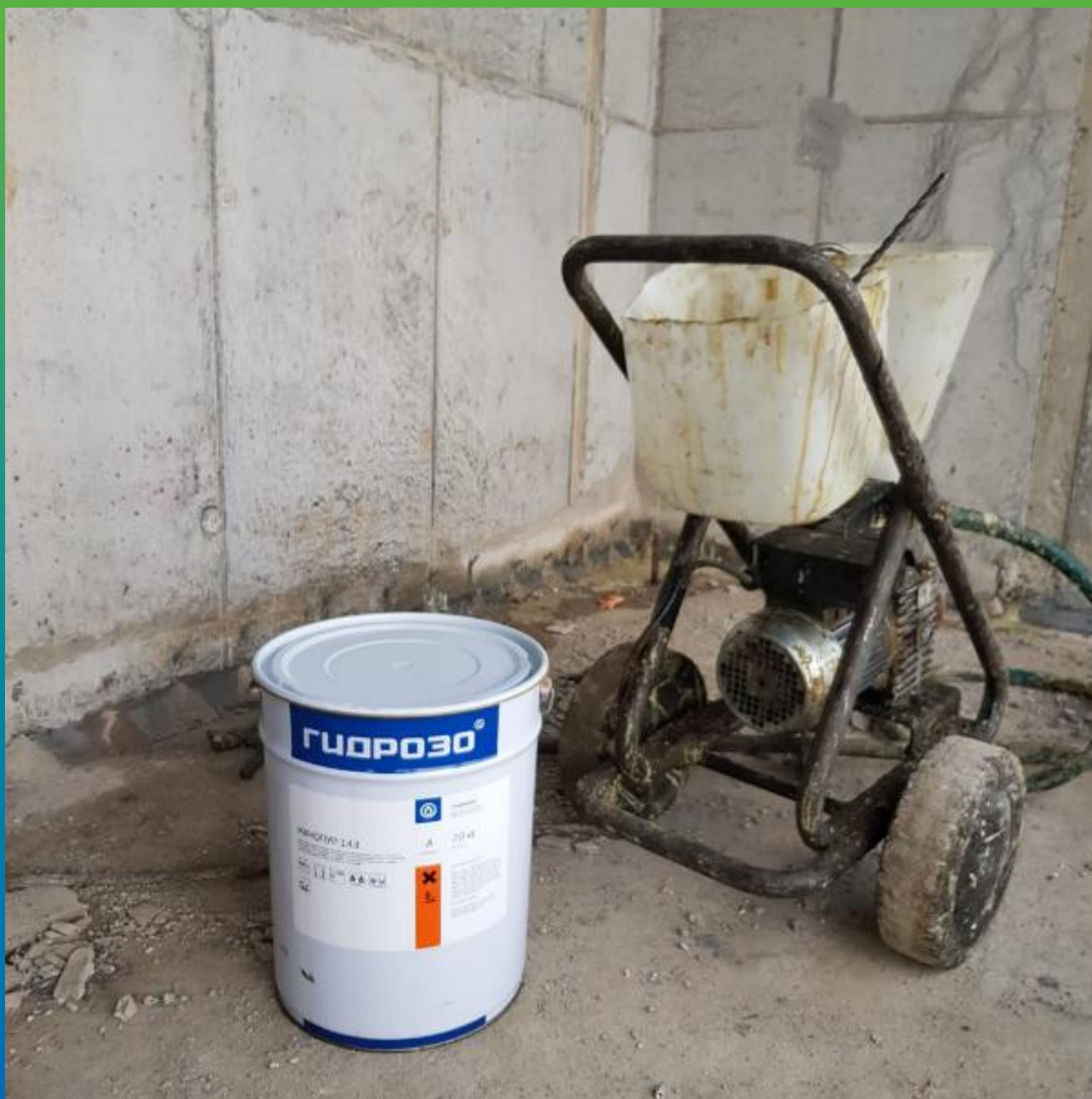
Выполнение работ. Инъекционный насос БМ 1200, Манопур 143, Стармекс РМЗ