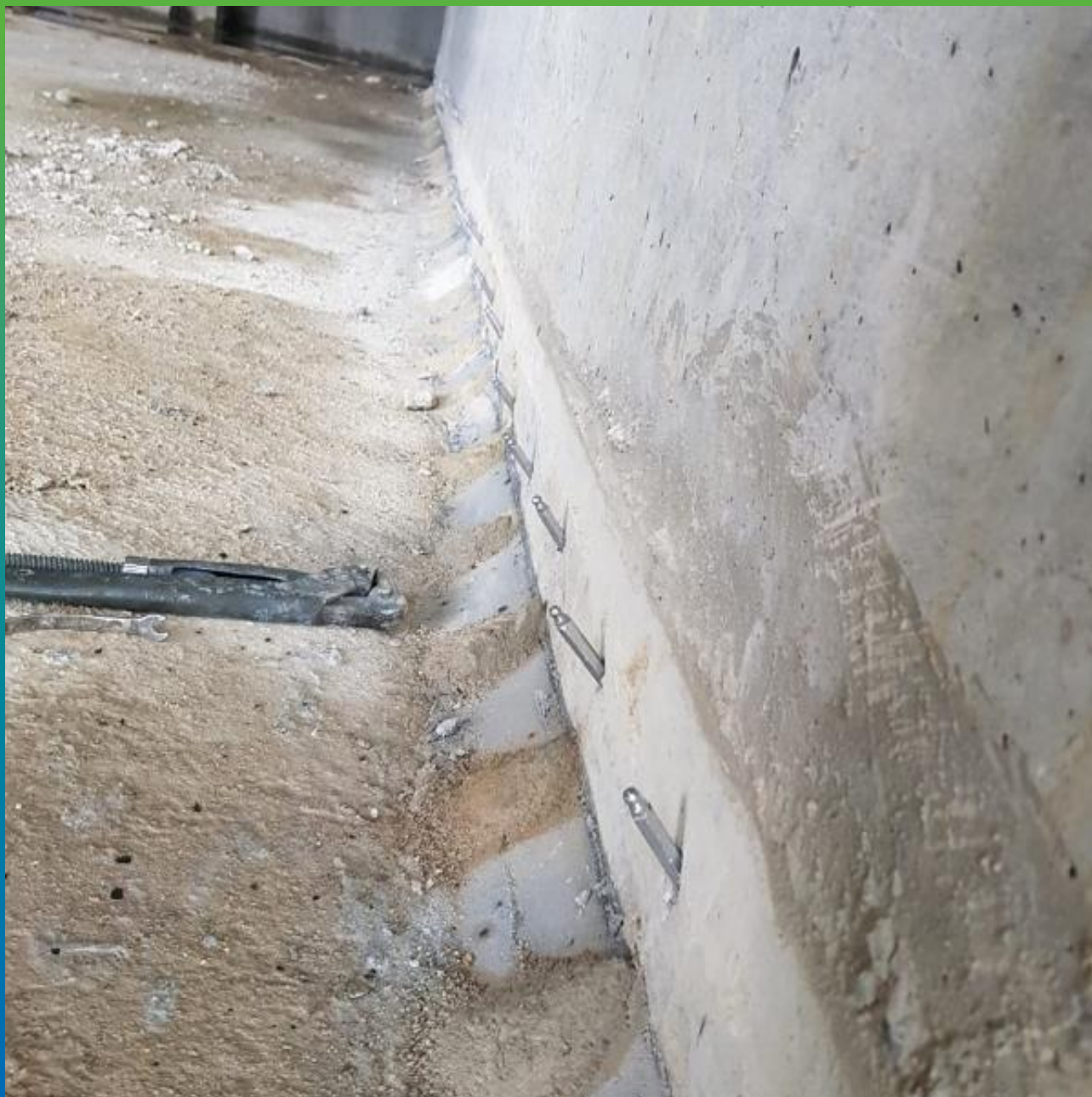
После окончания инъекционных работ