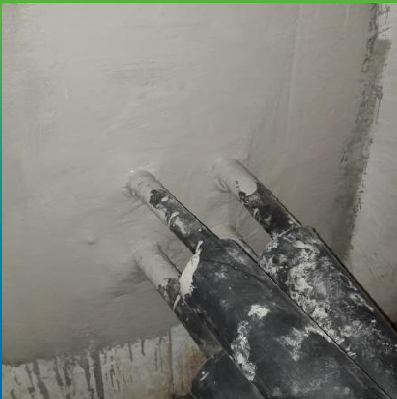
Финишный вид узла после гидроизоляции