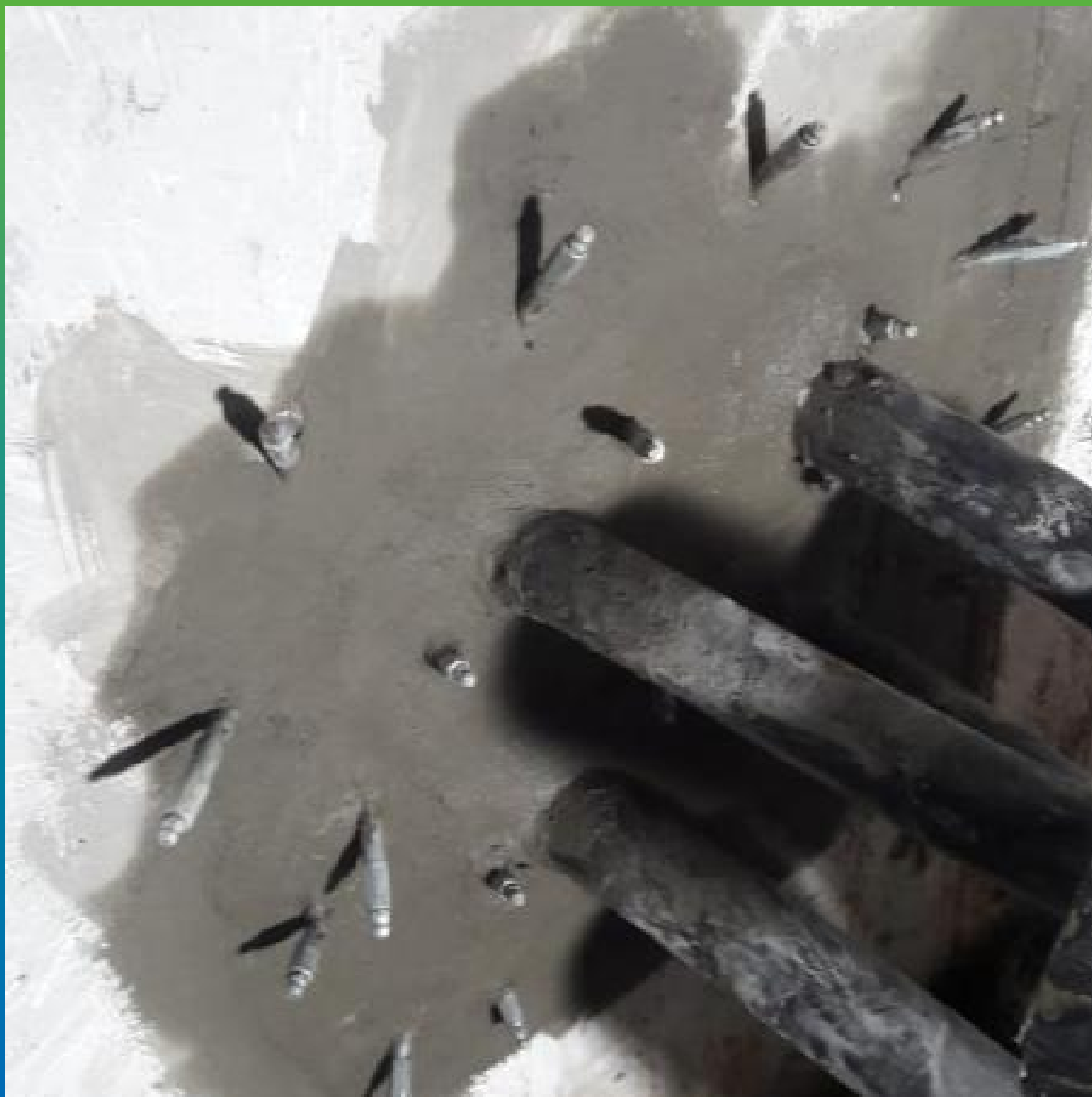
Зачеканка Стармекс РМ 3 и инъектирование Манопур 143