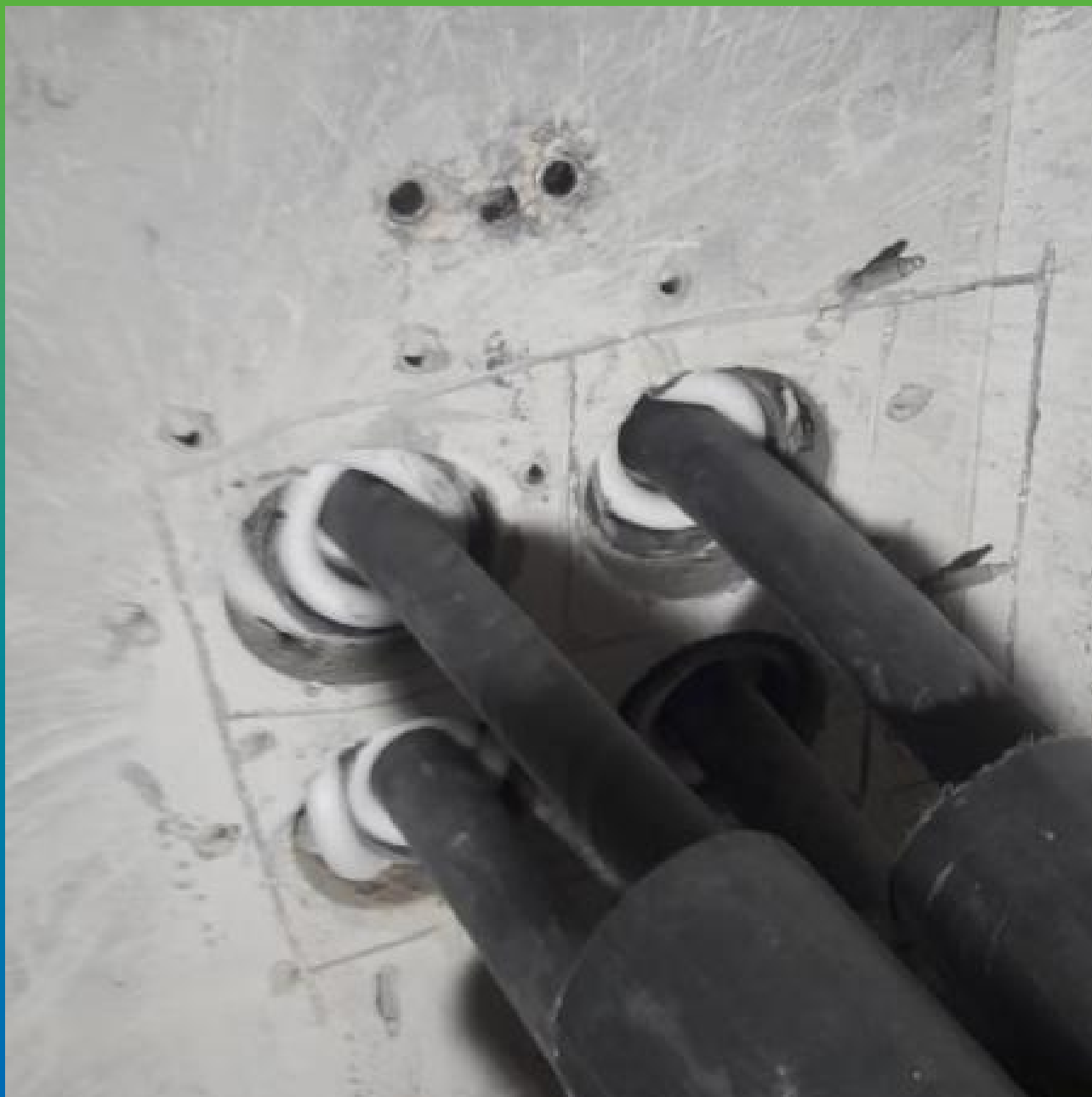
Нанесение герметика Витрафин бонд