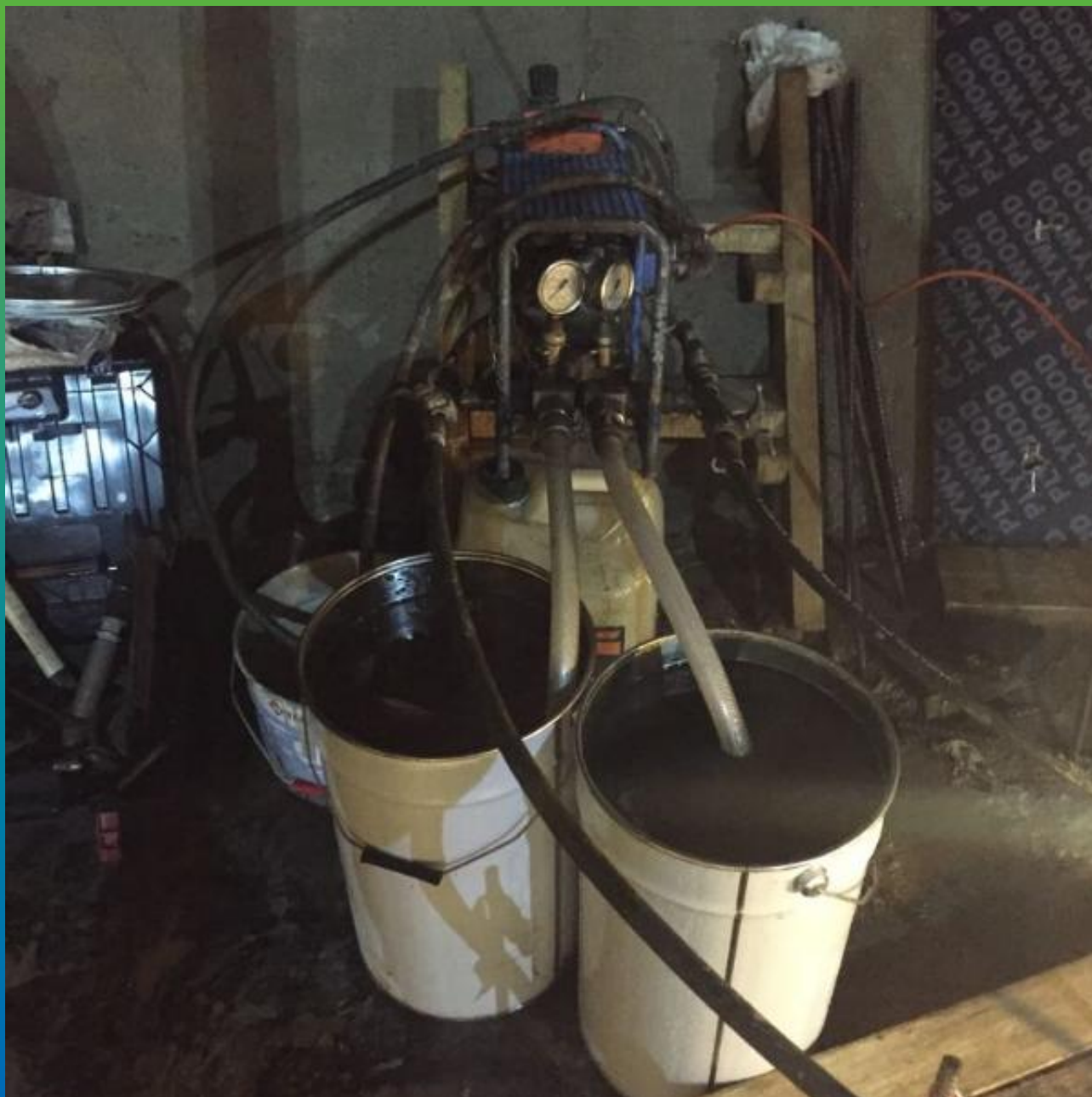
Инъекционный насос БМ 1429 и Манопур 125