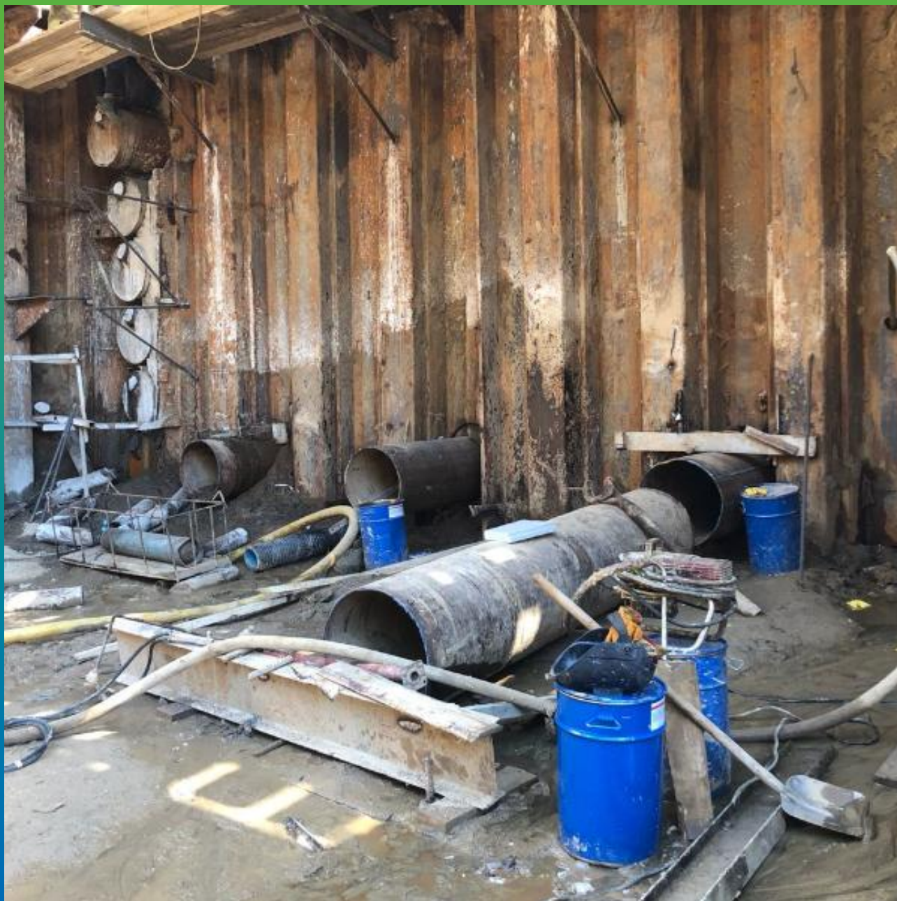
Протечка вокруг гильзы