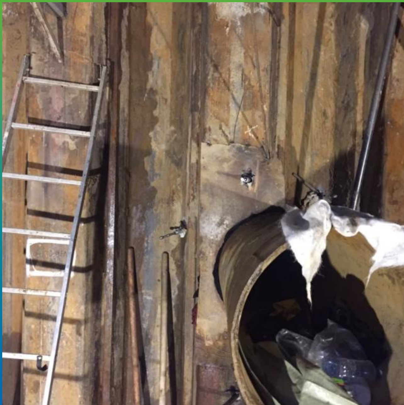
Общий вид после работы