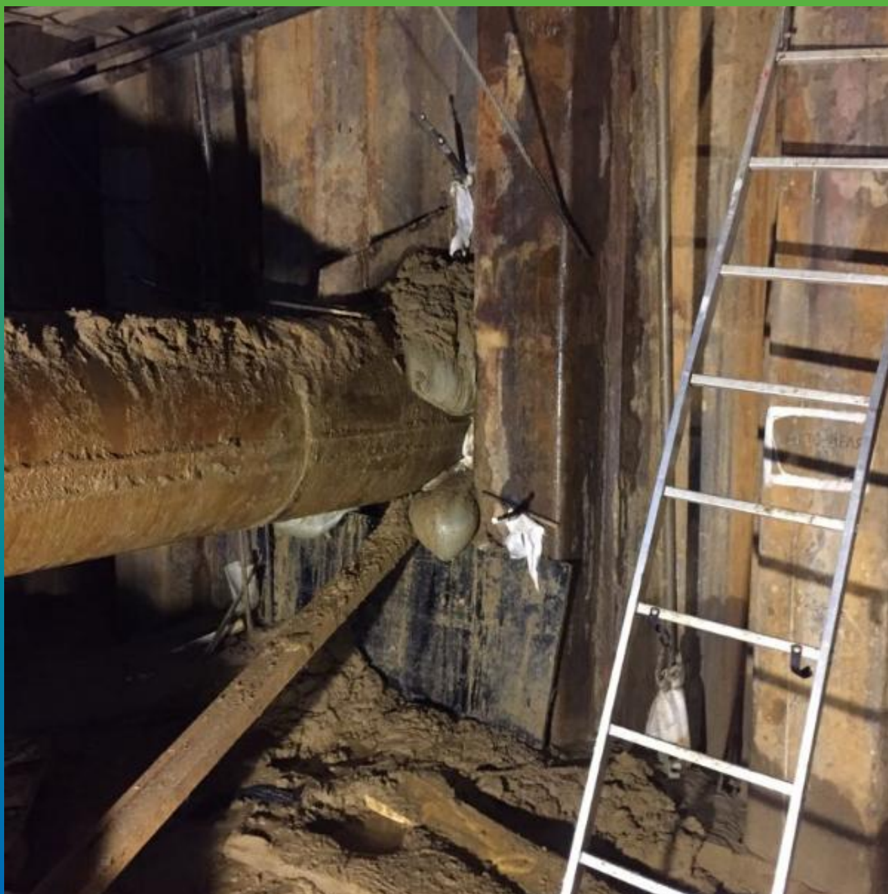
Общий вид после выполнения работ