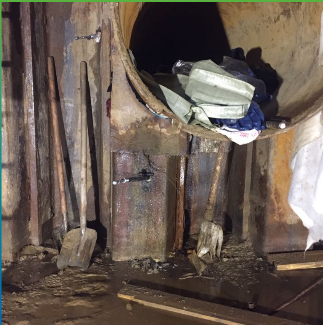
установка пакеров вокруг гильзы