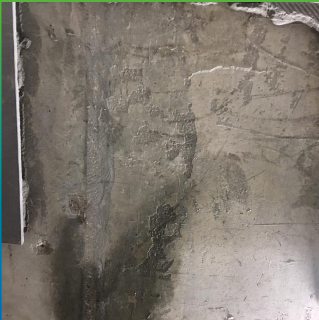
Текущая трещина на входной группе в станцию метро