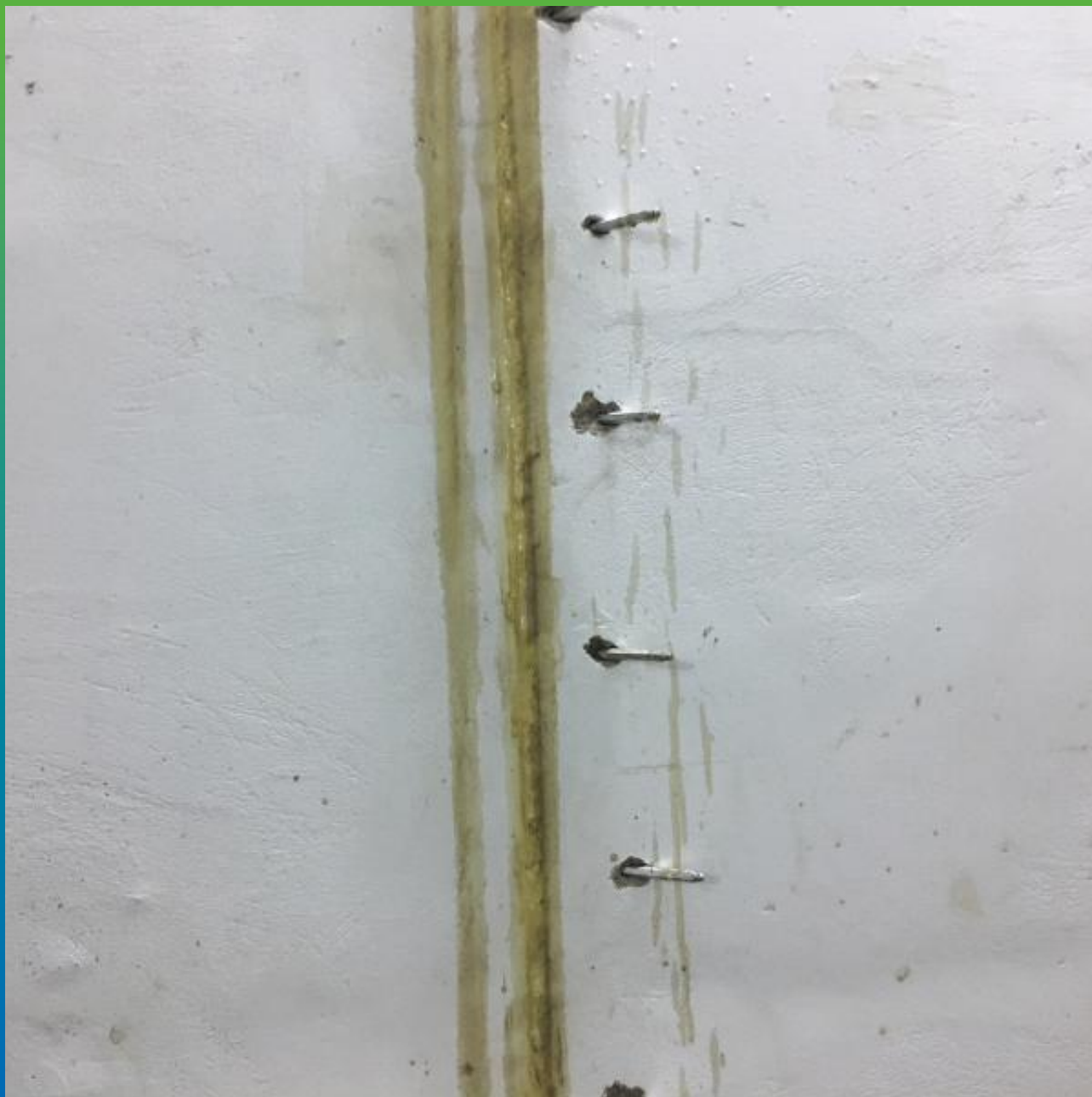
Вид проинъектированного шва