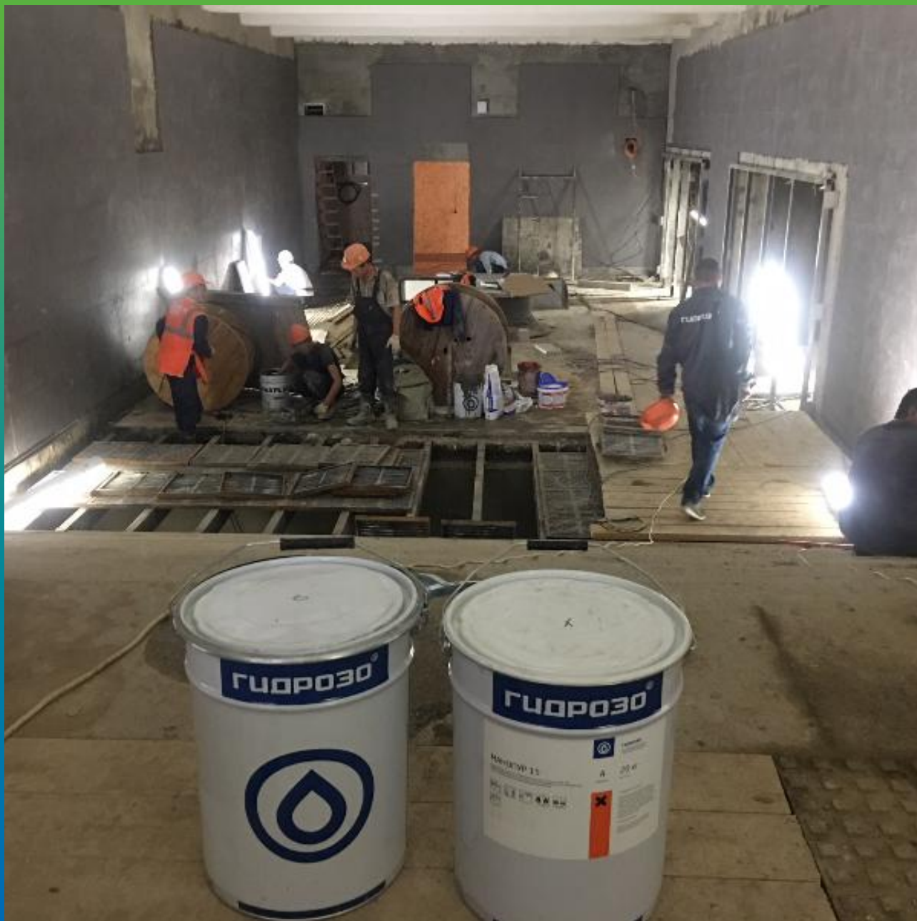
Материал Гидрозо на объекте