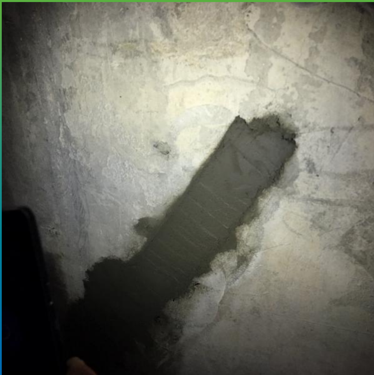
Зачеканенная трещина Стармекс РМЗ