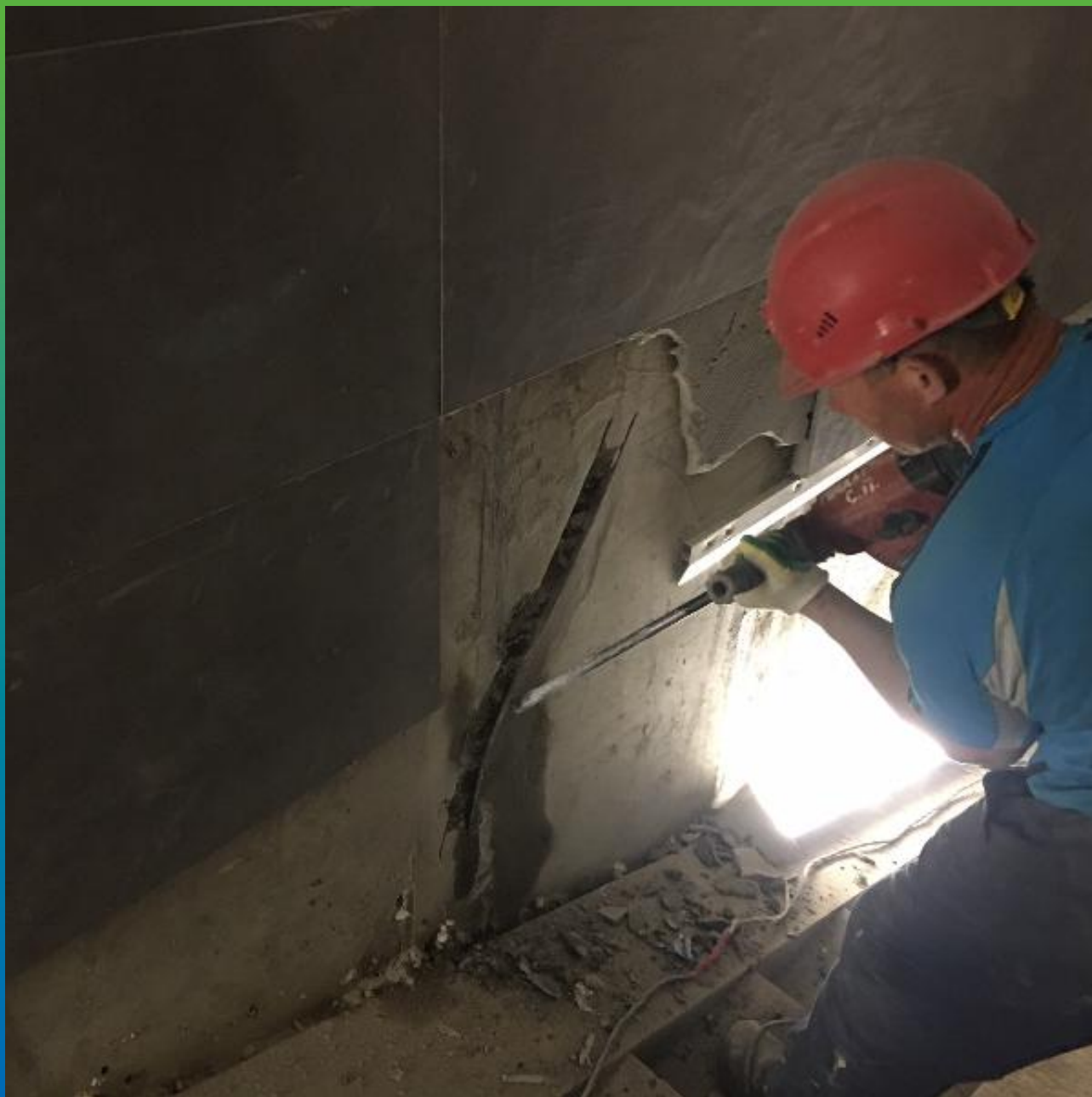
Расшивка текущей трещины