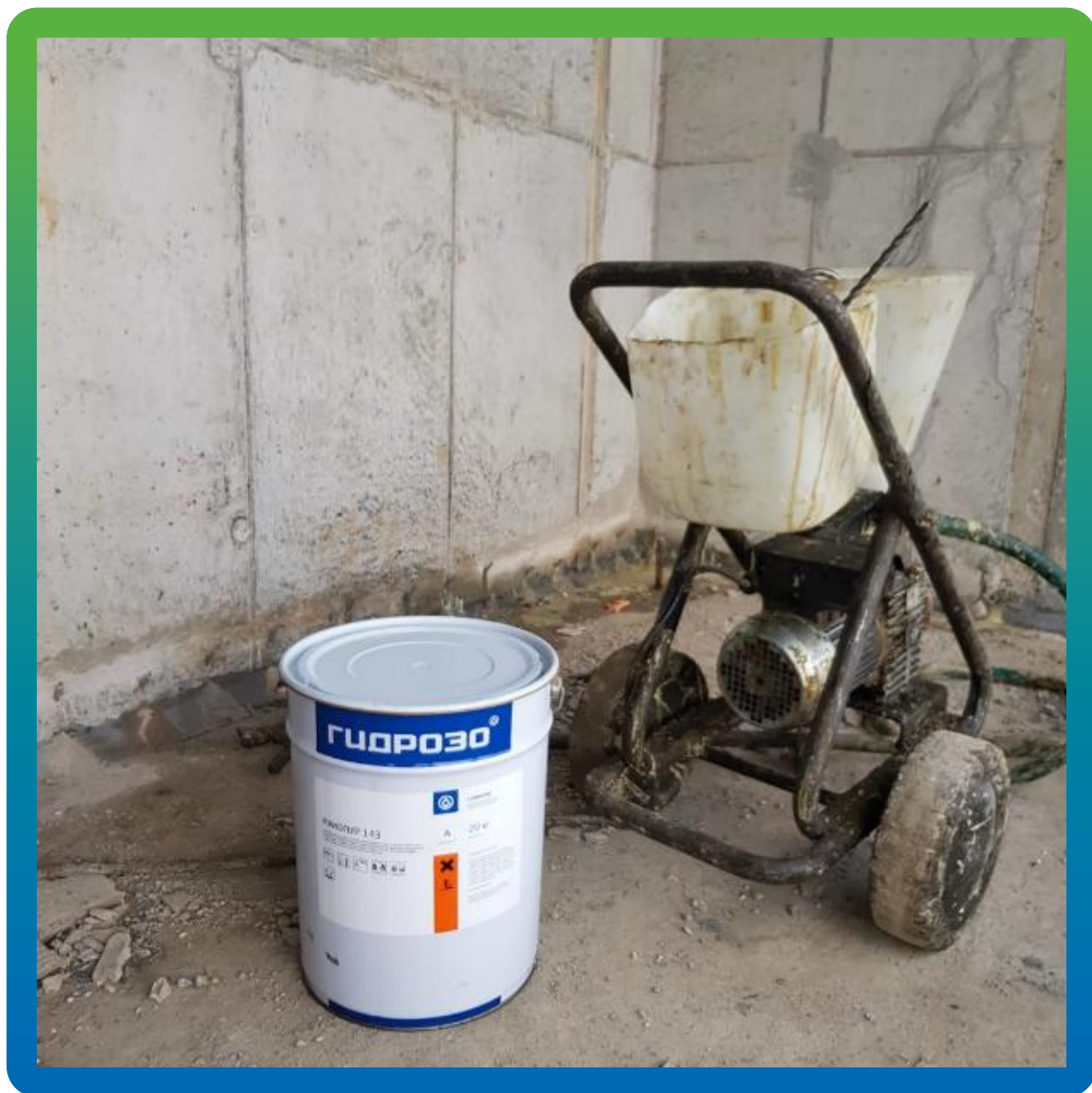
Инъекционный насос БМ 1200 и Манопур 143