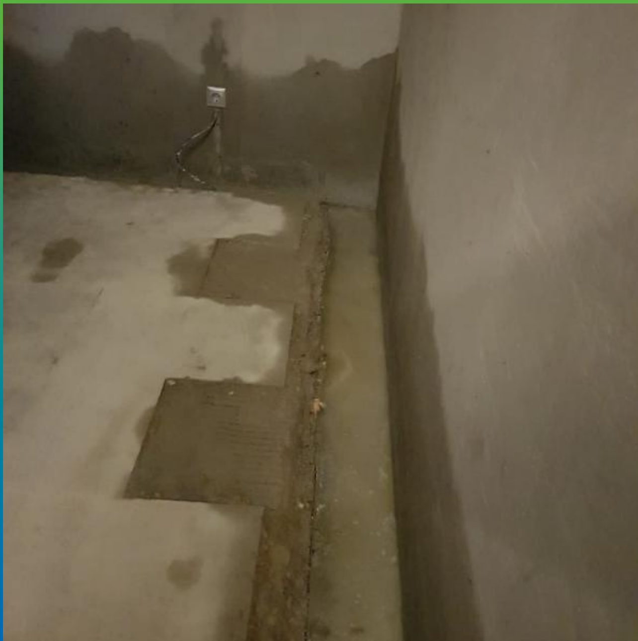
Внешний вид шва до инъектирования