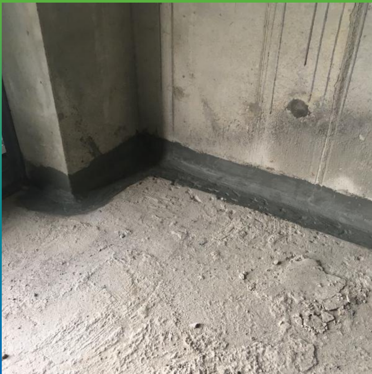
Внешний вид проинъектированного шва