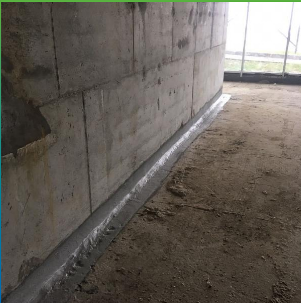
Внешний вид проинъектированного шва