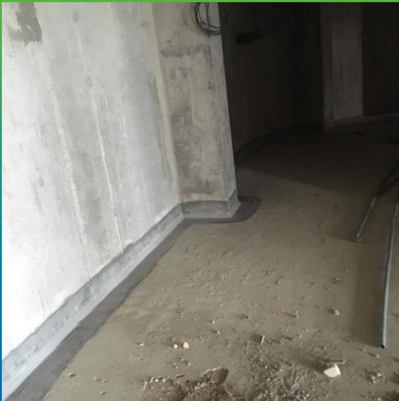
Внешний вид проинъектированного шва