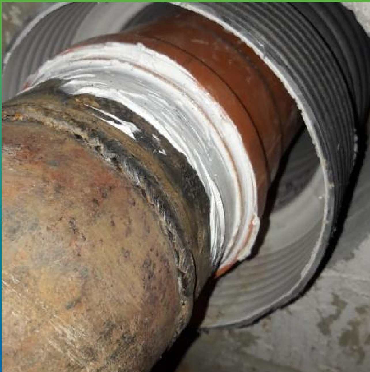
Гидроизоляции гильзы и примыкания Витрафин Флекс