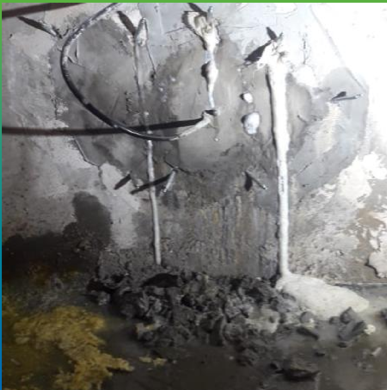
Инъектирование Манопур С