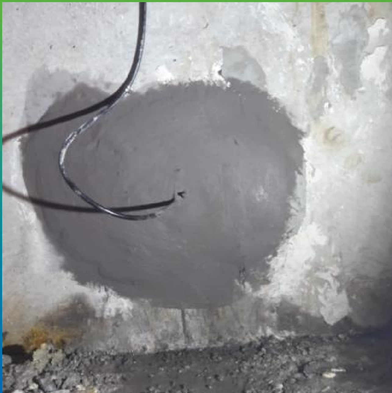
Вид после инъектирования