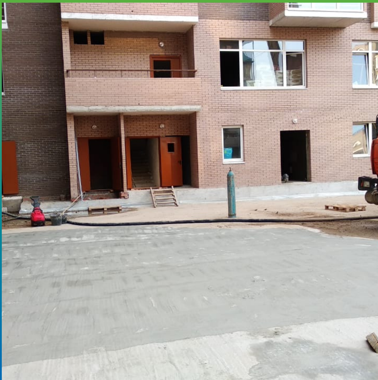
Нанесение Стармекс Сил по плите эксплуатируемой кровли