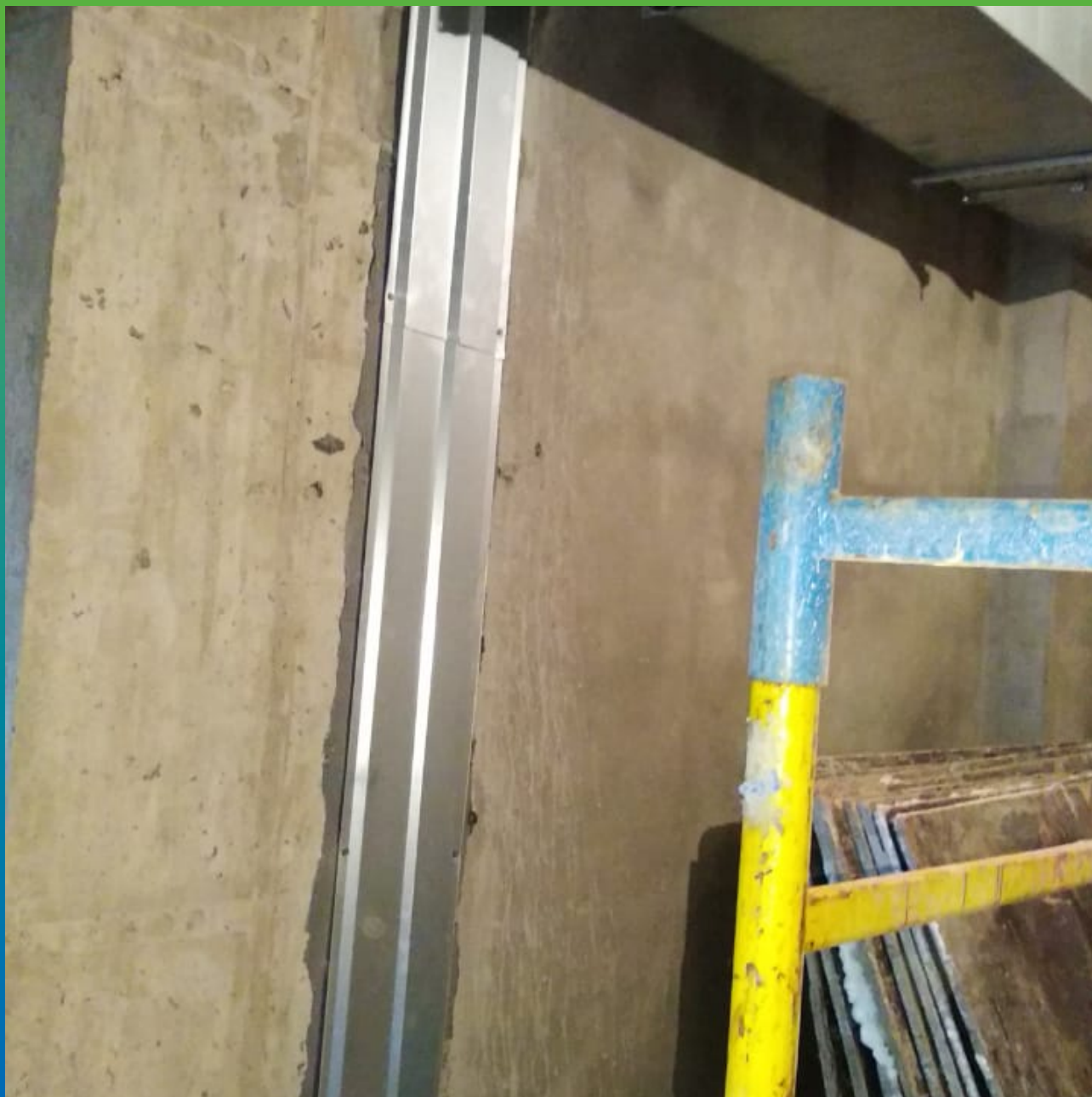
Защита эластичной ленты Манодил Про фасонным изделием