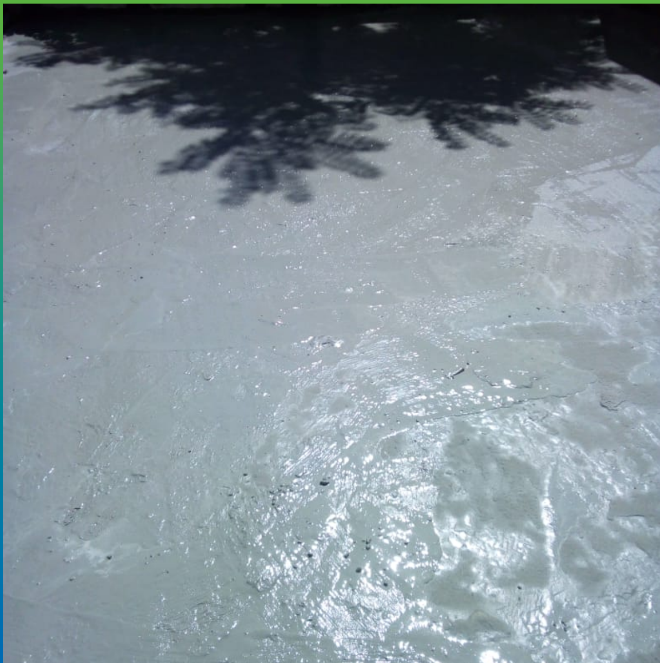
Покрытие осмотического действия Стармекс Сил, нанесенное по плите