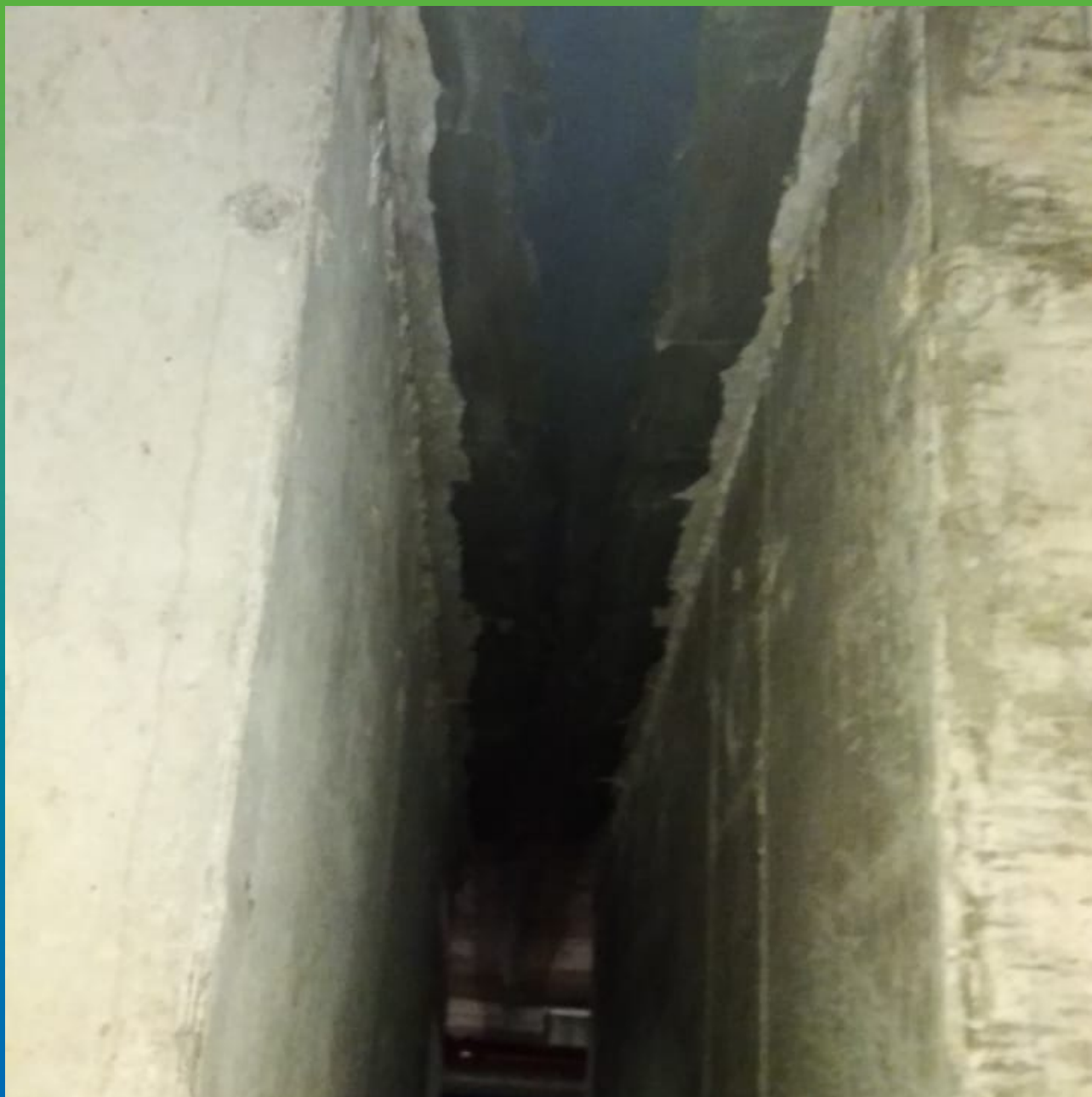
Деформационный шов по потолку, выполненный Манопокс 331 + Манодил Про