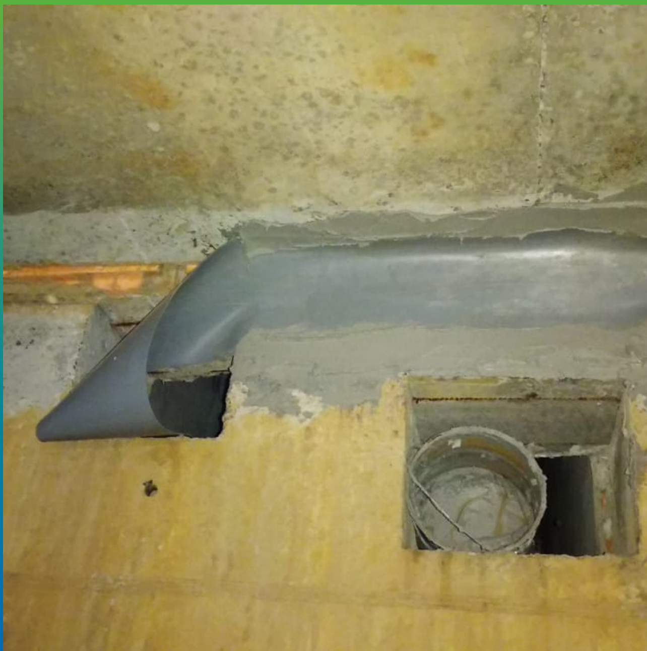
Приклеивание ленты Манодил Про на клей Манопокс 331