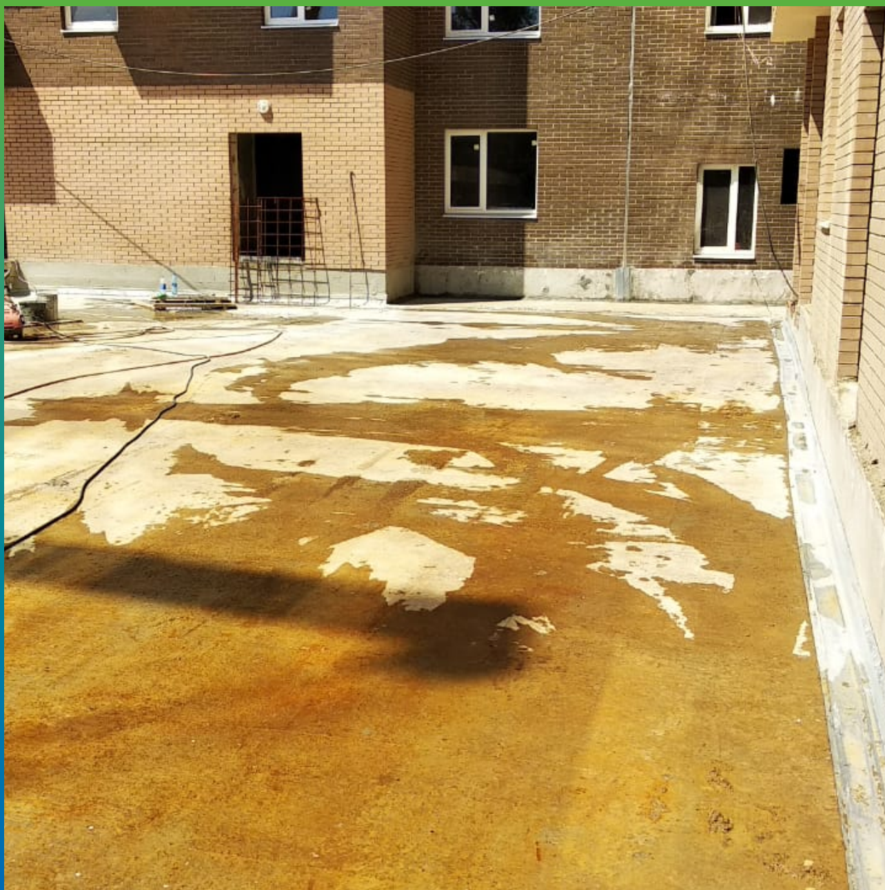
Увлажнение поверхности плиты перед нанесением гидроизоляции