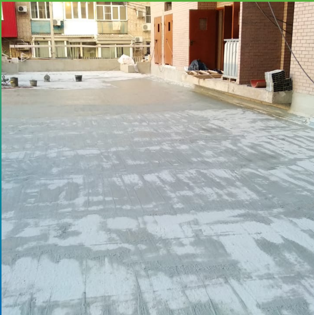
Стармекс Сил на эксплуатируемой кровле подземного паркинга