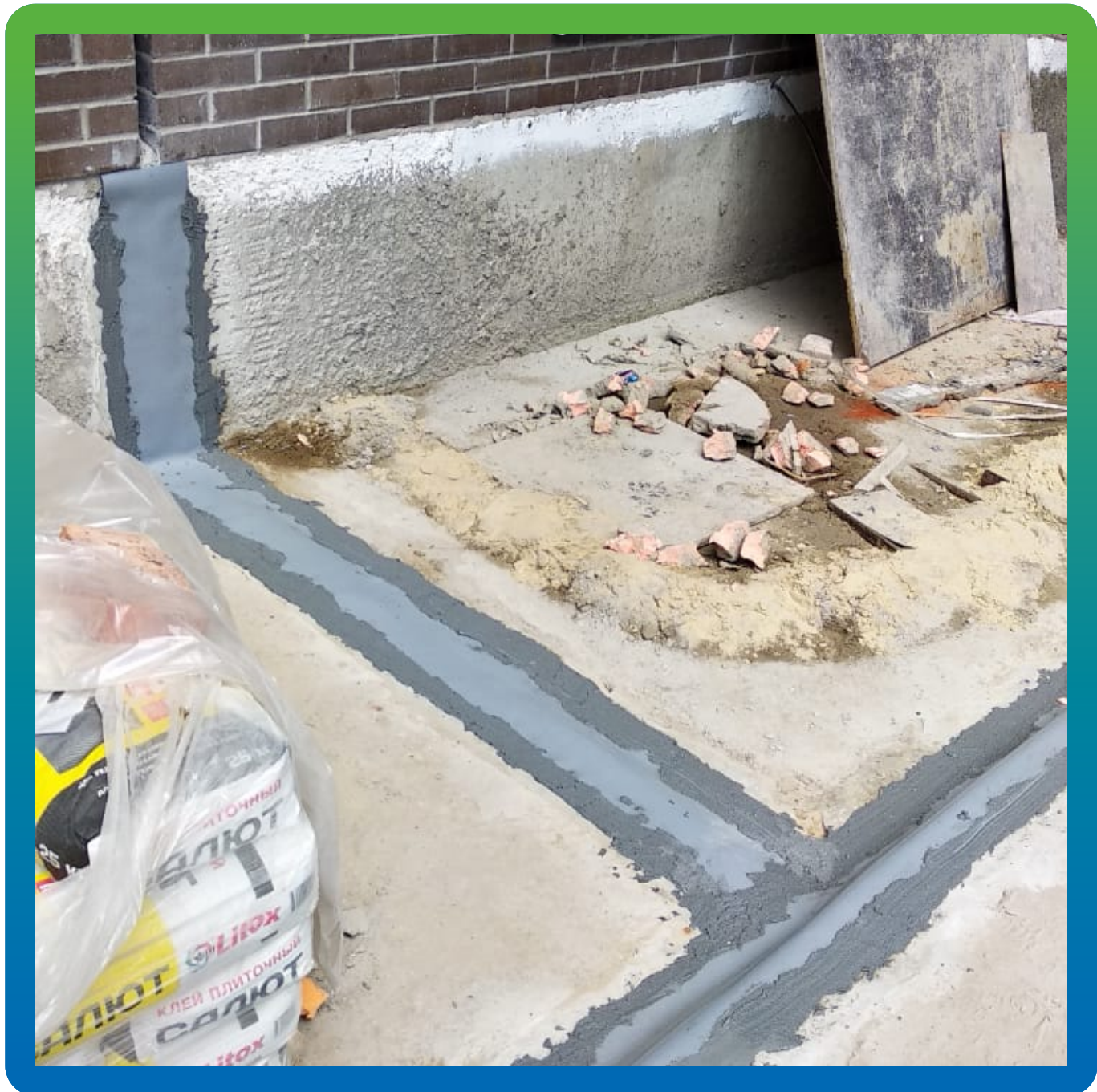
Выполненный деф. шов по плите материалами Манопокс 331 и Манодил Про