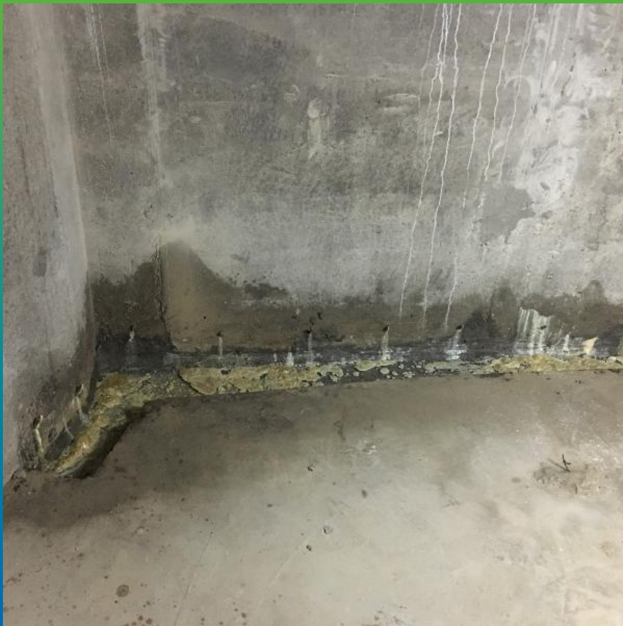
Вид прокаченного шва Манопур 143