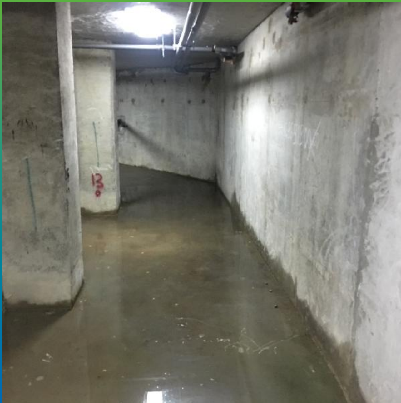
Вид подвального помещения с протечками