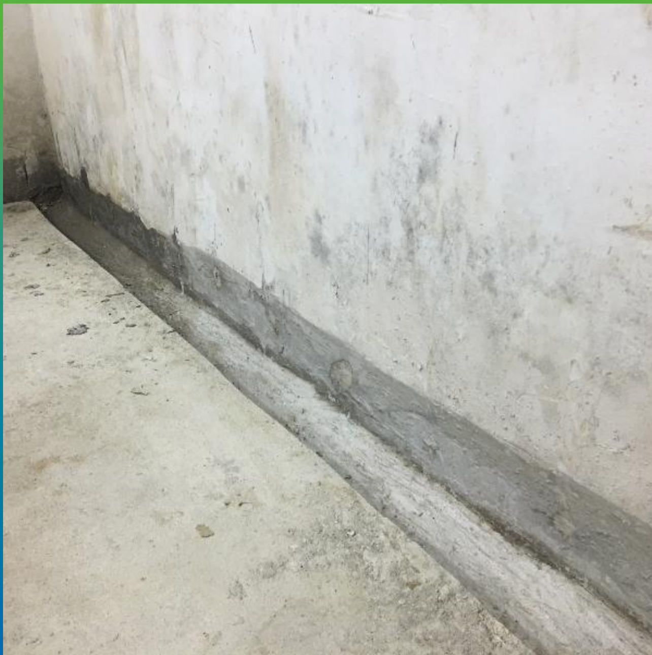
Вид прокаченного и заделанного холодного шва