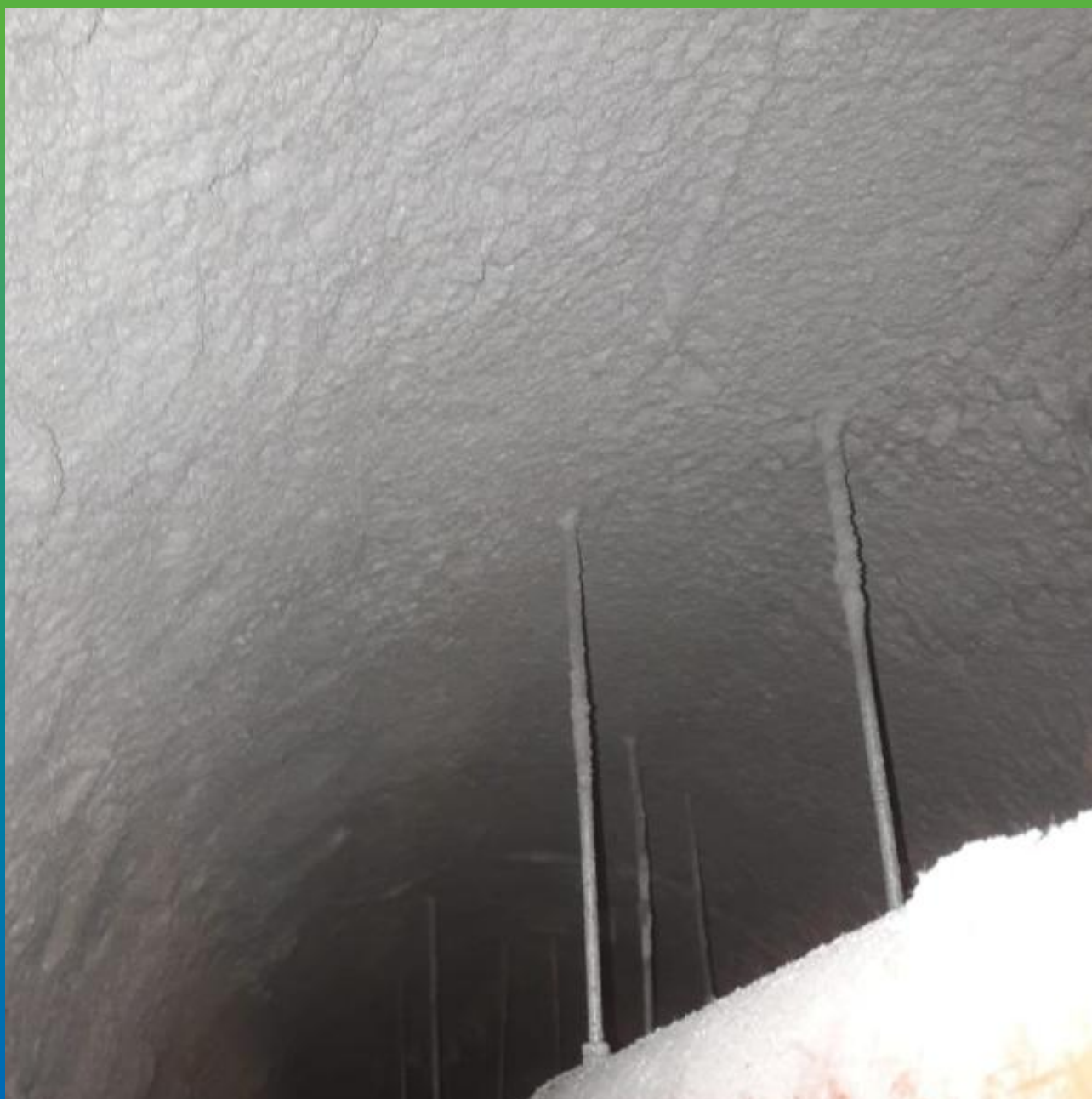
Вид нанесенной гидроизоляции Стармекс Сил Флекс