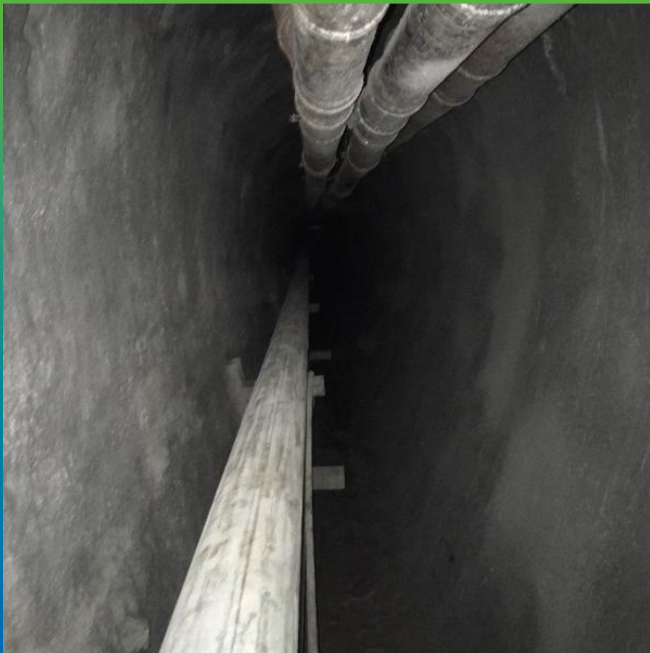
Вид объекта с нанесенной гидроизоляцией Стармекс Сил Флекс