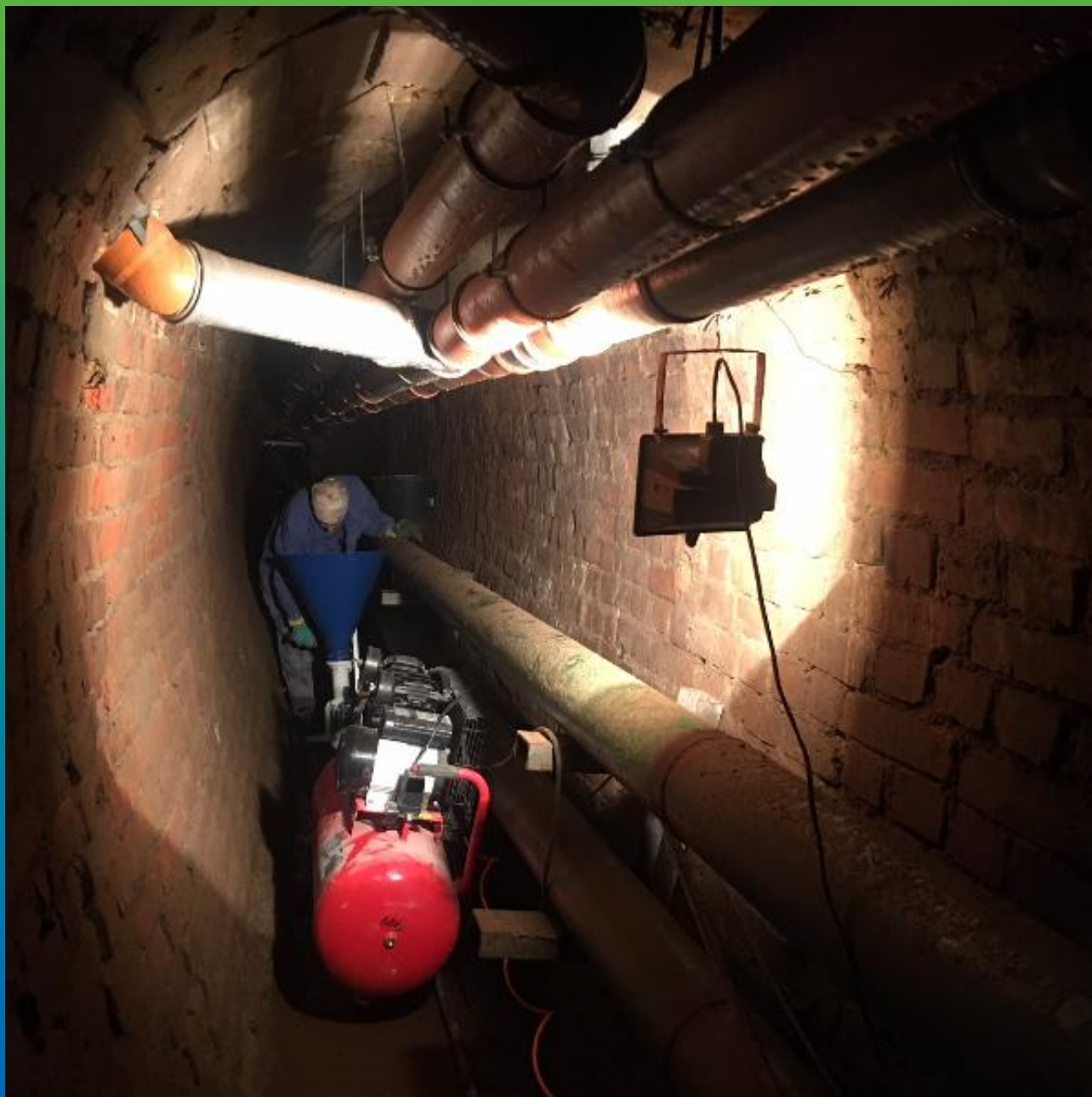
Рабочая установка для нанесения Стармекс РМЗ