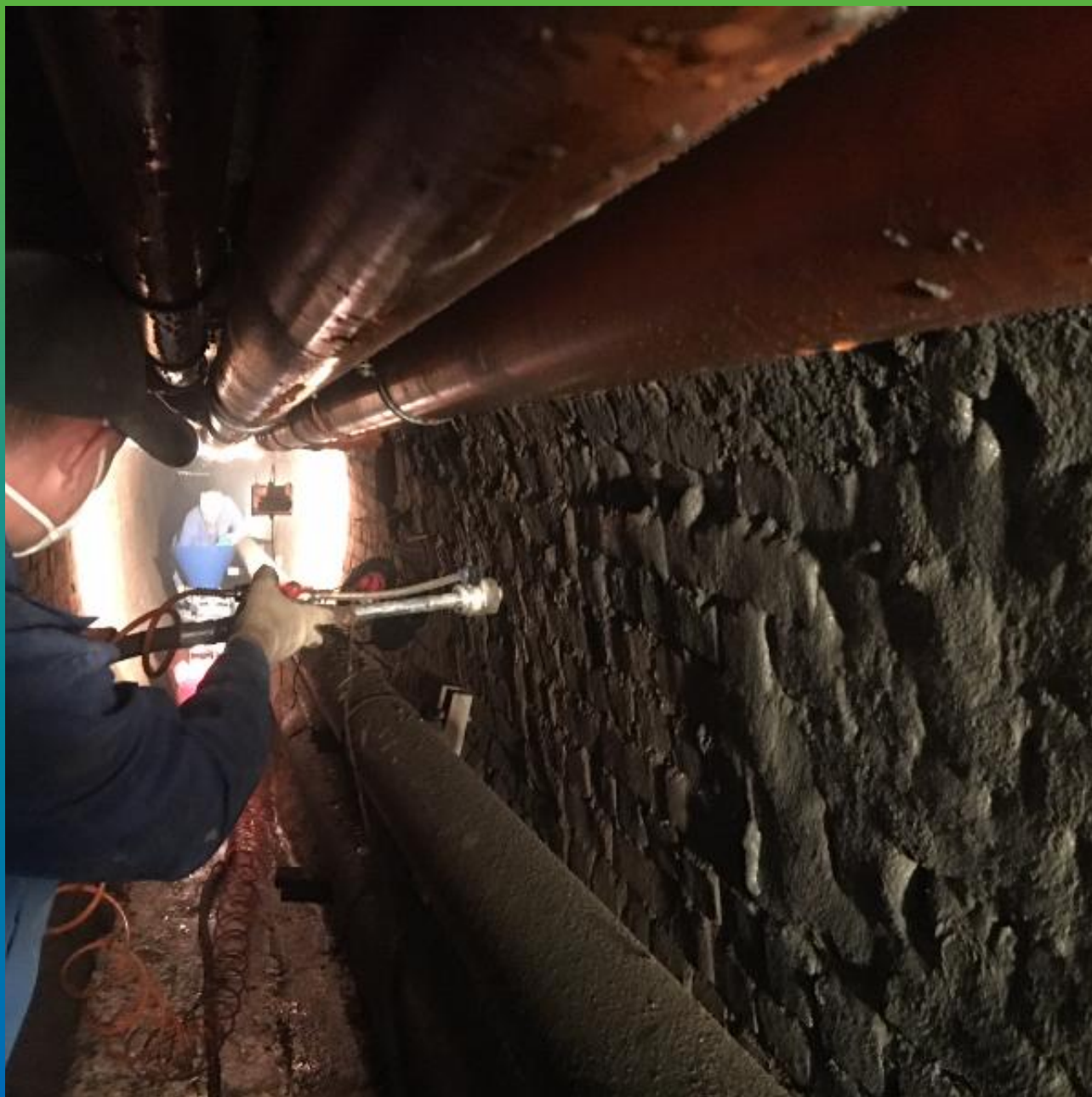
Нанесение Стармекс РМЗ механическим способом