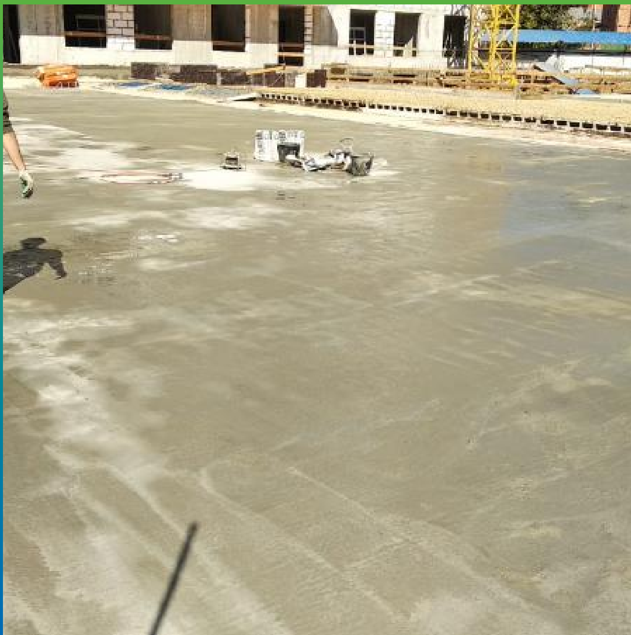
Плита перекрытия подземного паркинга