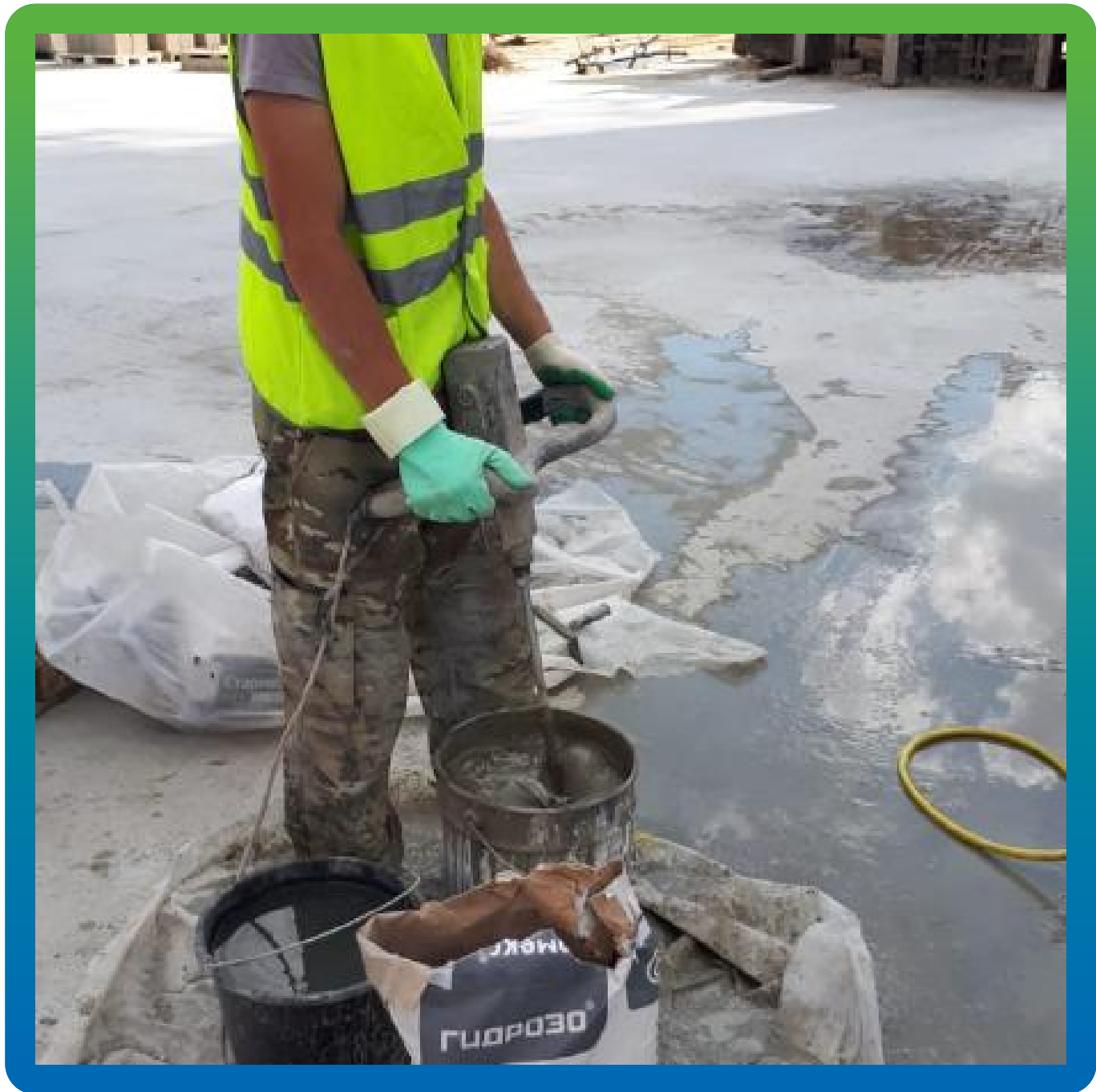
Приготовление гидроизоляционного состава Стармекс 111