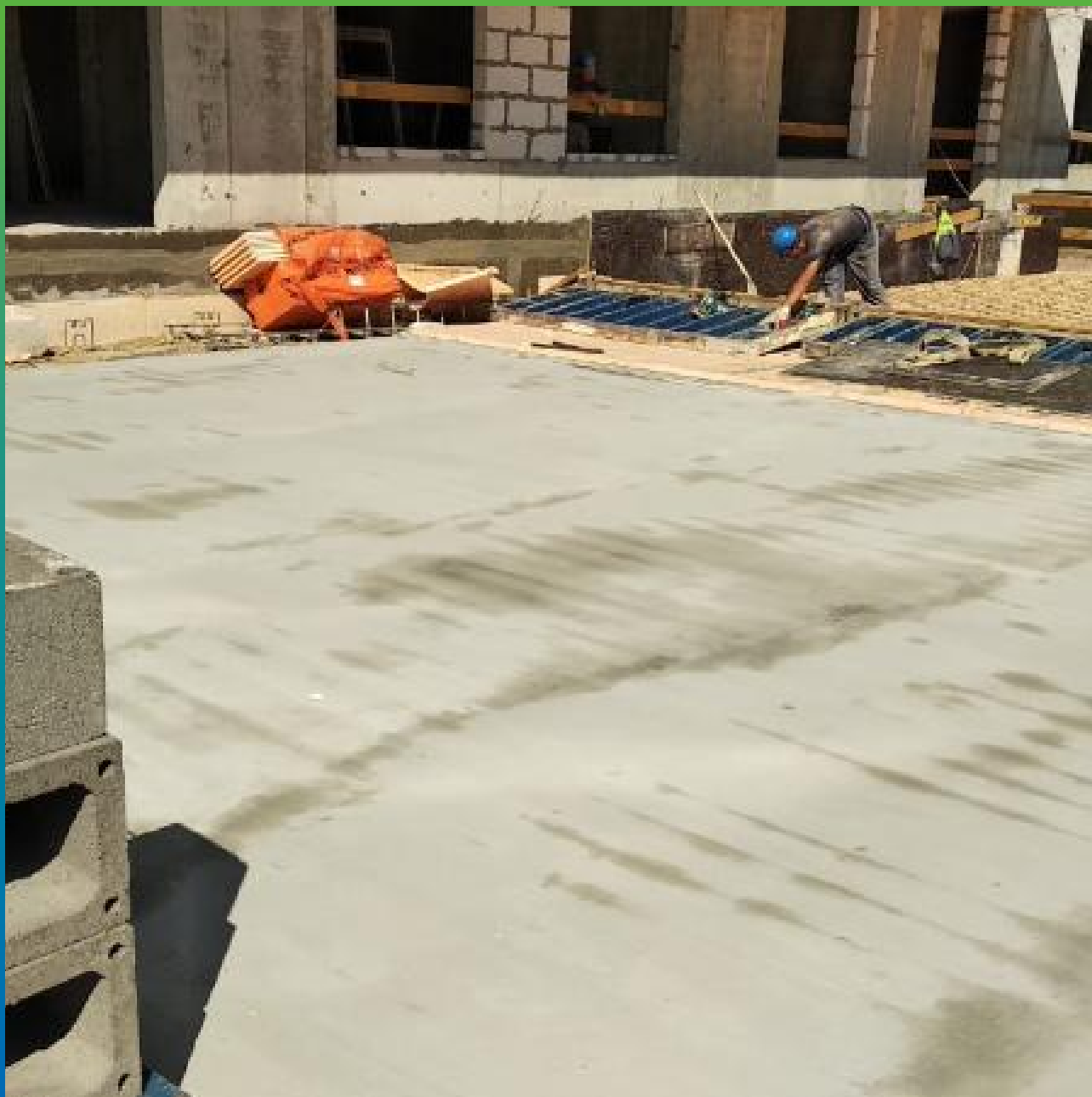
Финишный вид плиты покрытия подземного паркинга после нанесения состава Стармекс 111