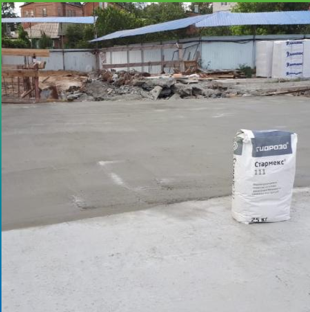
Процесс нанесения на плиту перекрытия