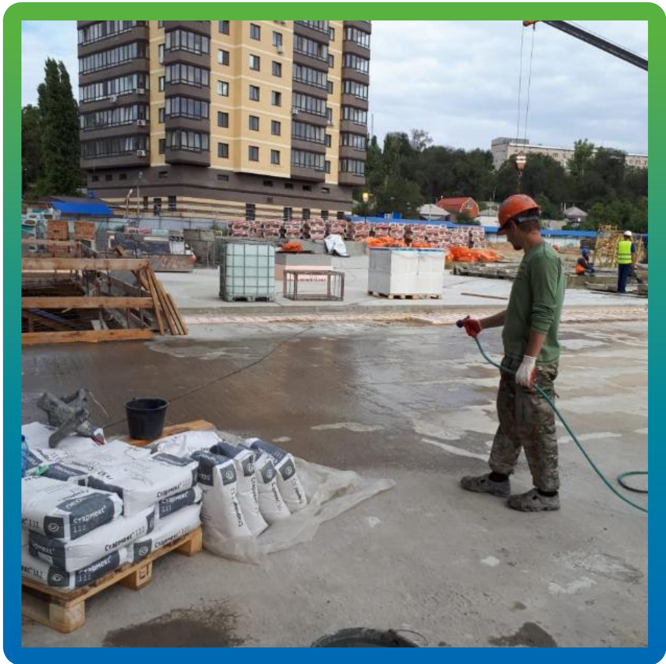
Увлажнение поверхности перед нанесением гидроизоляции