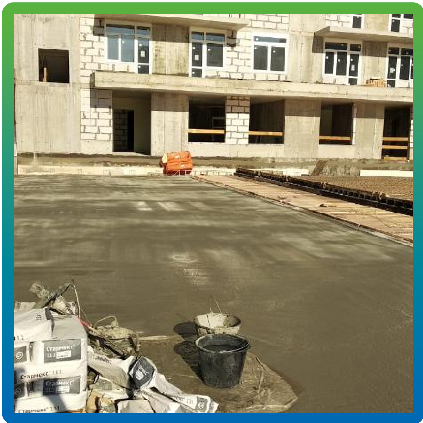
Обработанная гидроизоляцией Стармакс 111 поверхность плиты