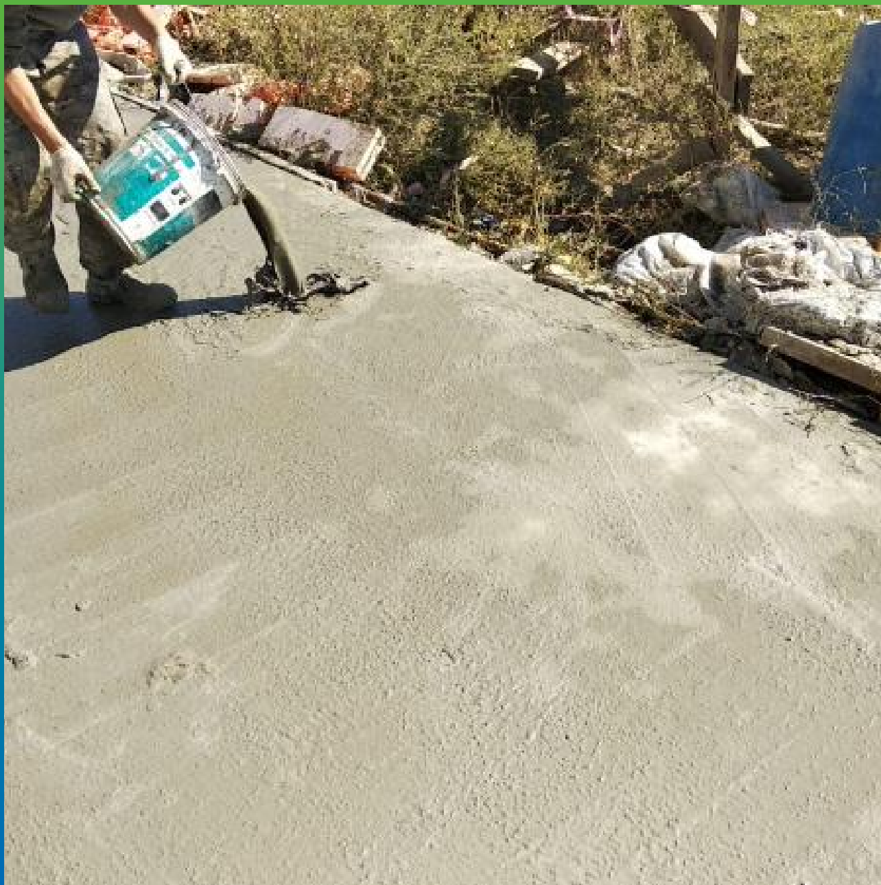
Процесс нанесения на плиту перекрытия