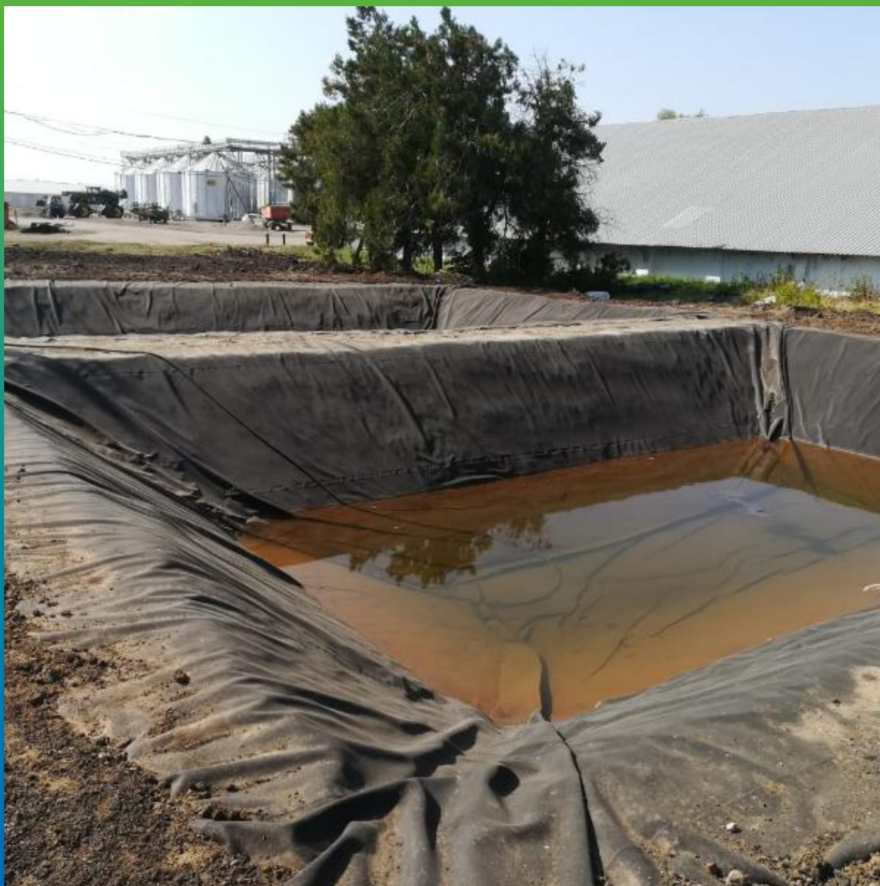
Финишный вид водоема