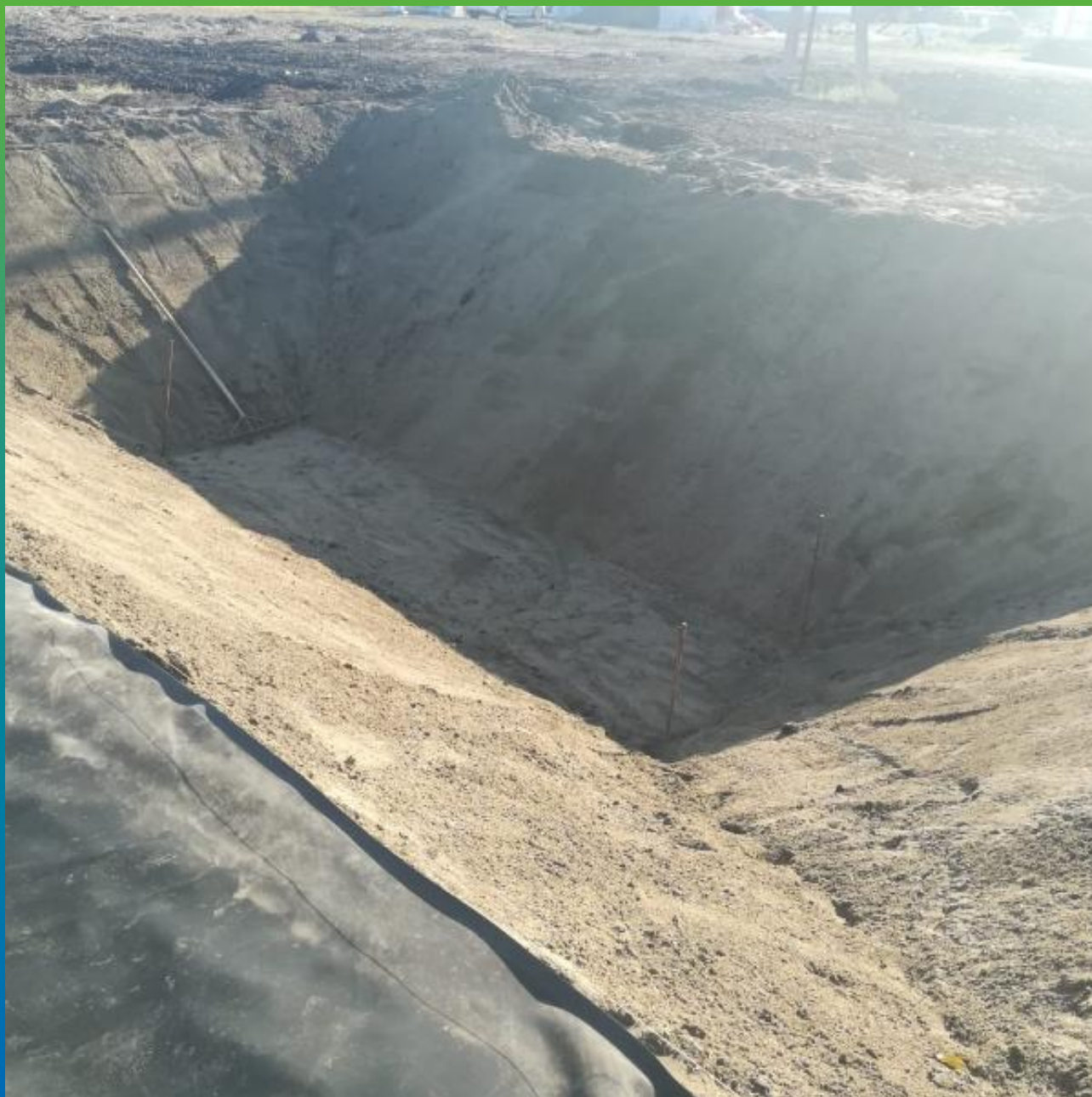
Присыпка песком по грунту водоема