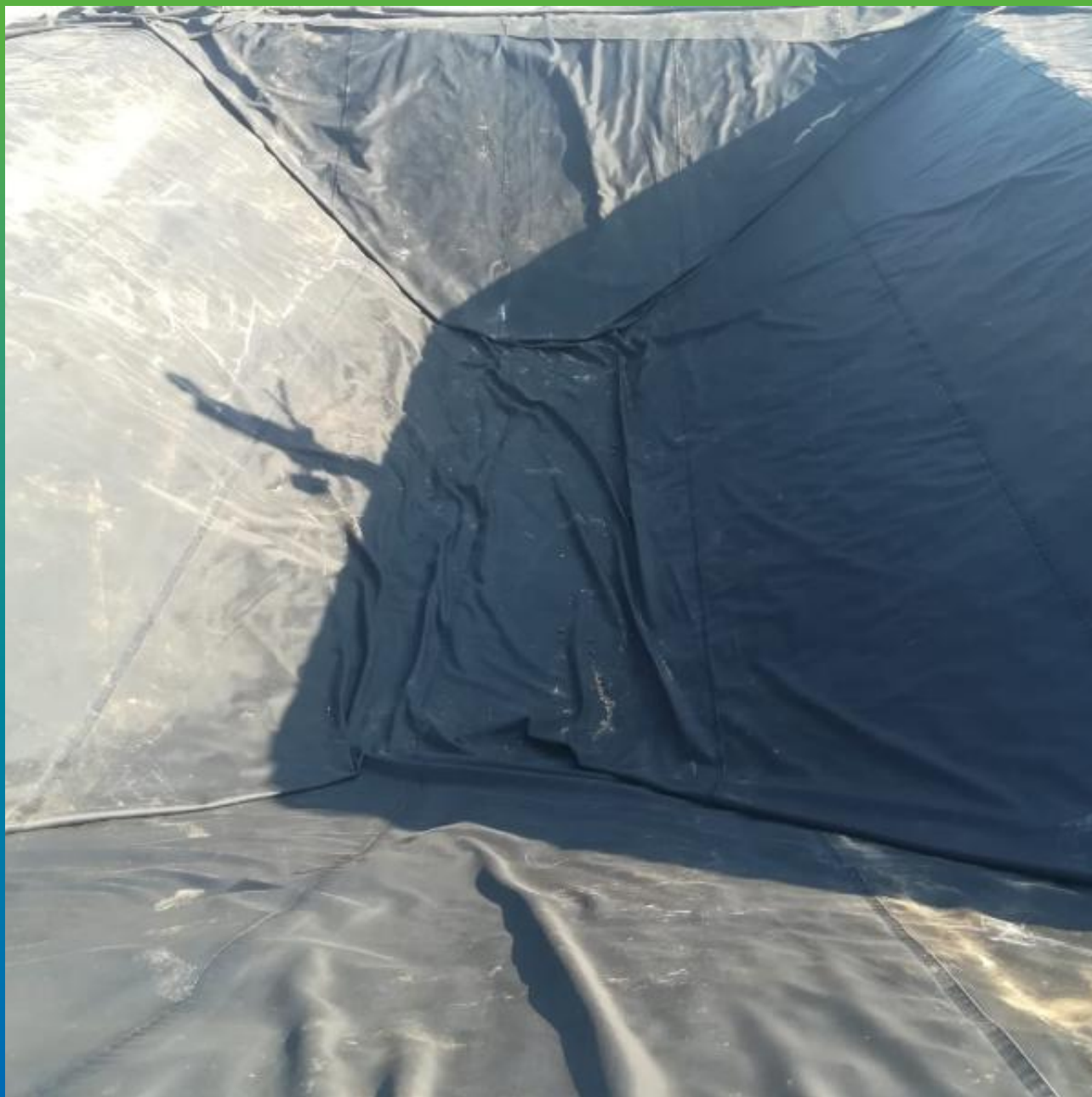
Цельносваренное полотно ЭПДМ Прелести СТ 1.2