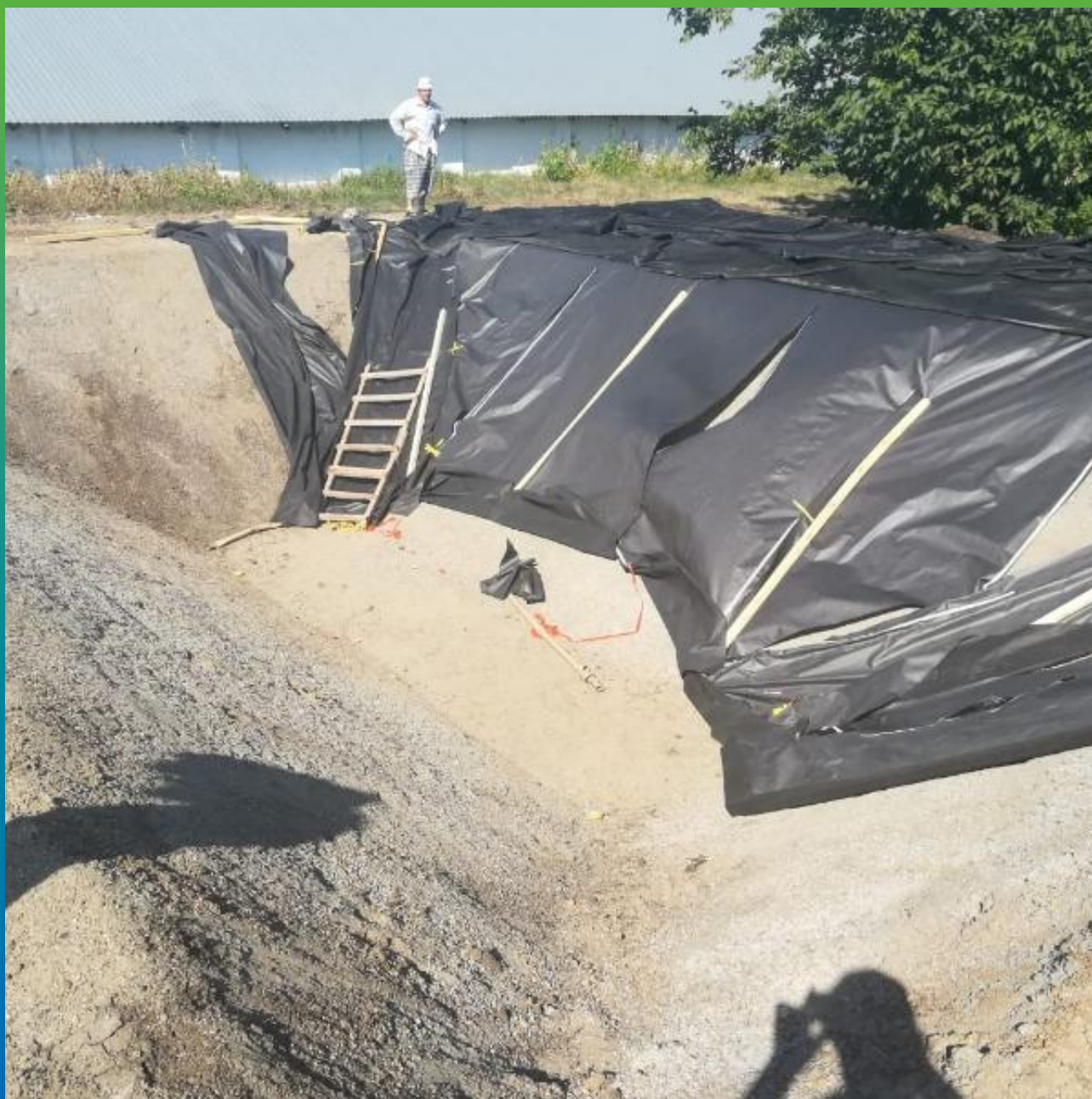
Укладка геотекстиля перед монтажом ЭПДМ-мембраны