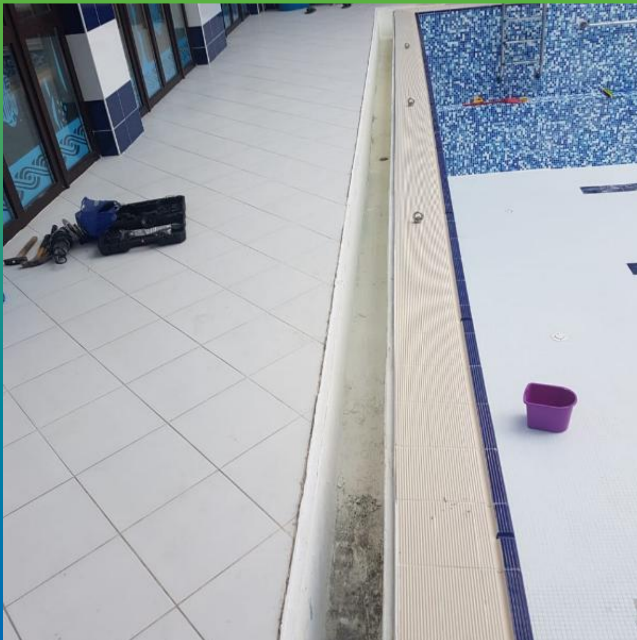
Вид лотка до ремонта