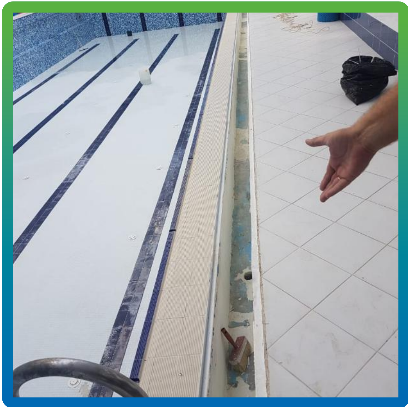
Вид лотка до ремонта