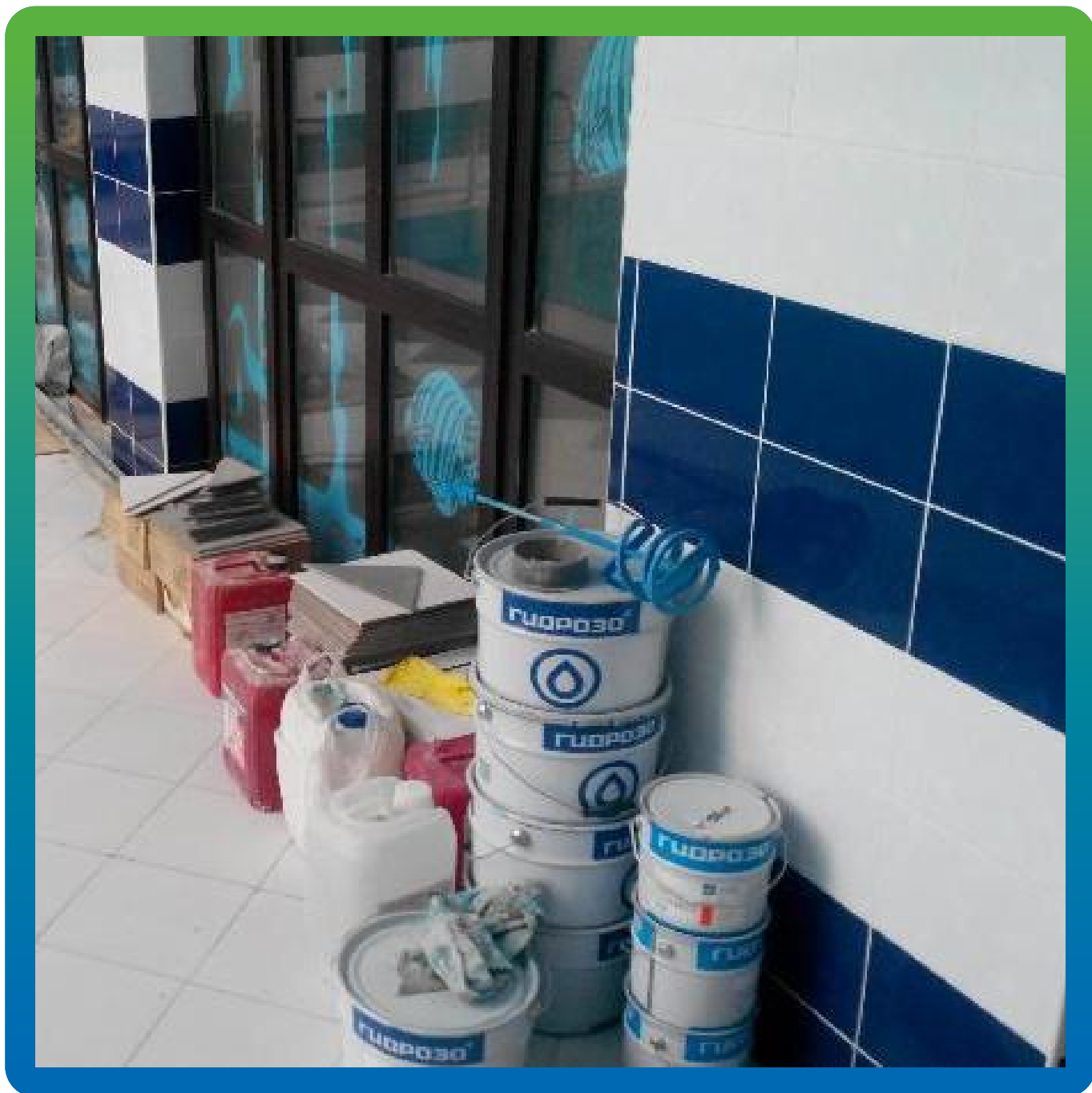
Материал Гидрозо на объекте