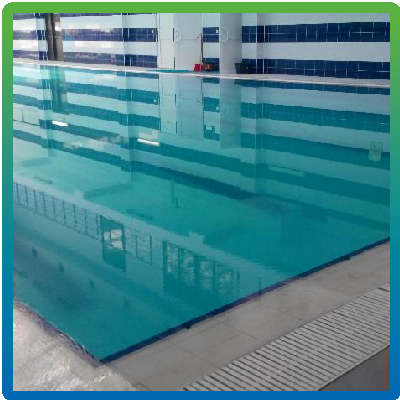
Гидроиспытания с заполненным бассейном