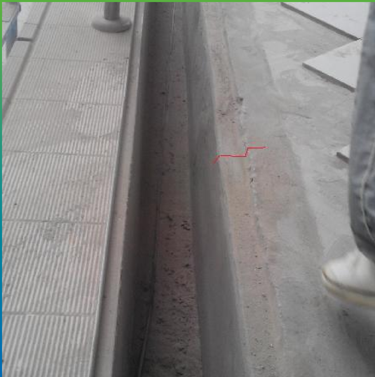
Подготовленный участок переливного лотка под нанесение ДенСтоп ПУ 227 Эластик