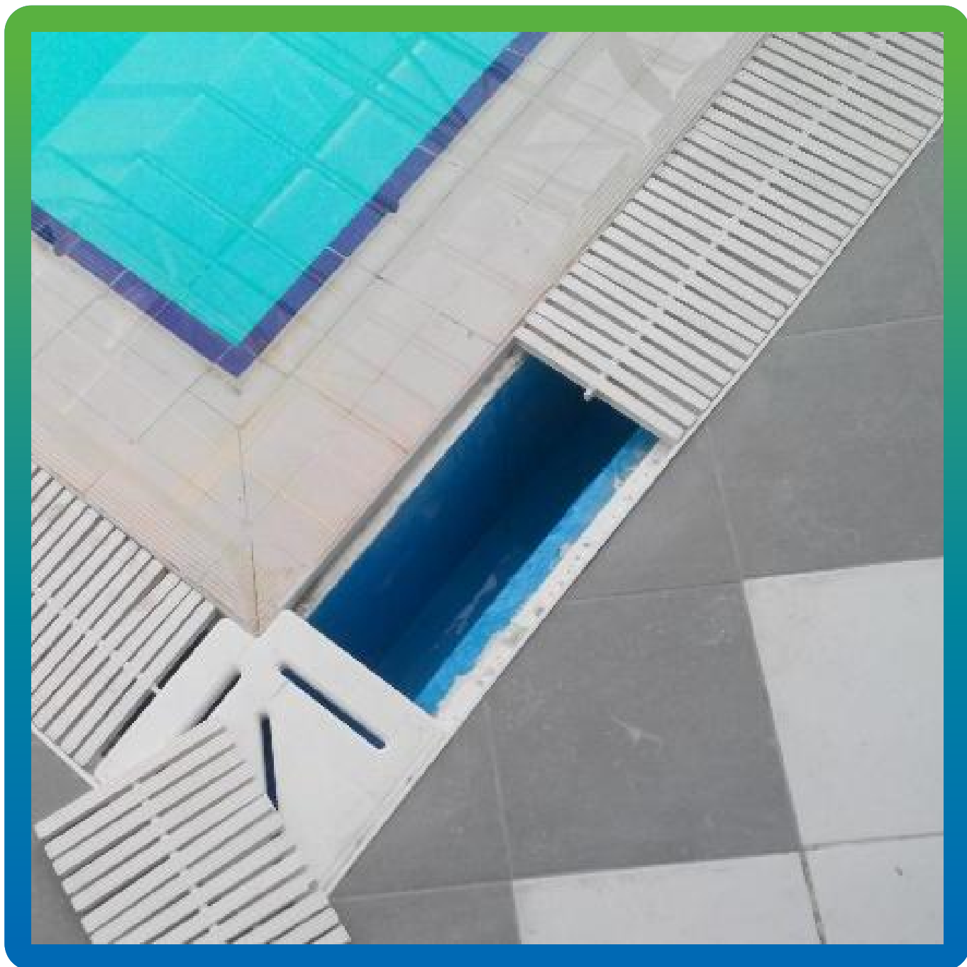
Вид лотка после нанесения ДенТоп ПУ 227 Эластик