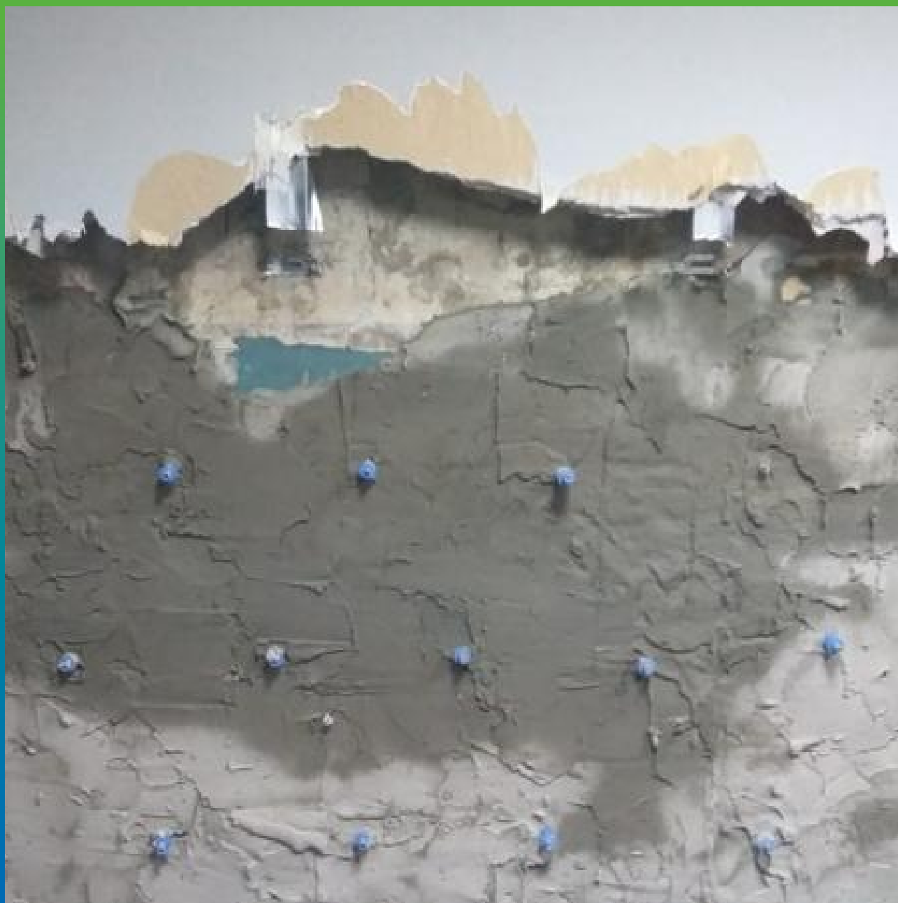
Вид после инъектирования Маноцем Гроут