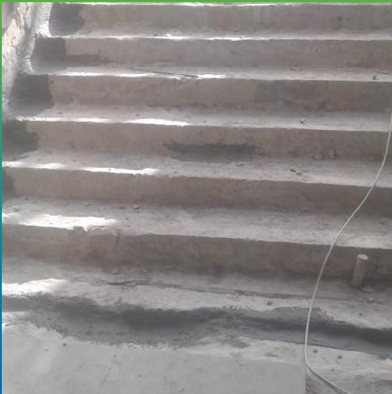
Ремонт и гидроизоляция шва примыкания Стармекс Сил Флекс, Стармекс РМЗ