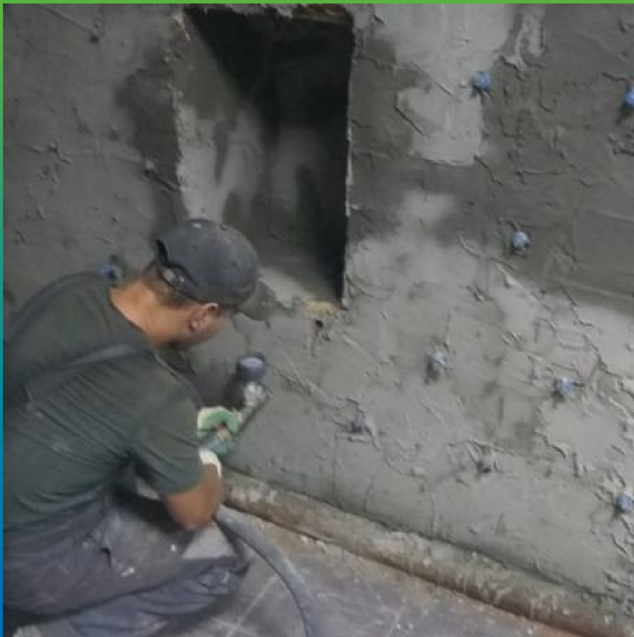
Инъектирование Маноцем Гроут