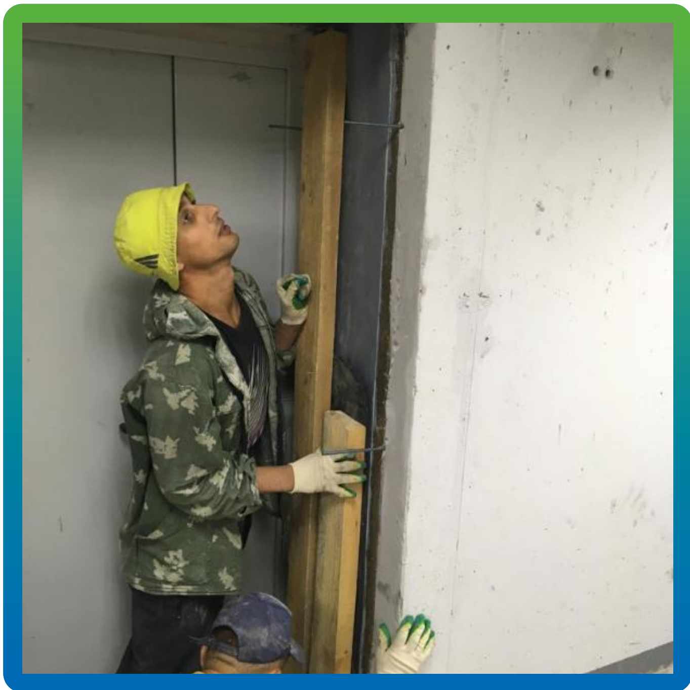
Гидроизоляция Манодил Про