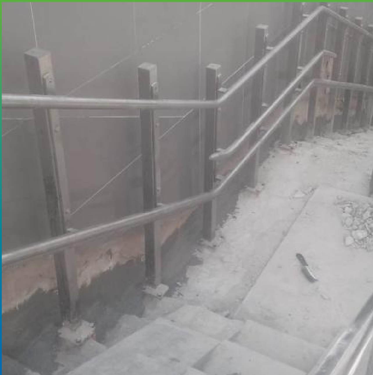
Ремонт и гидроизоляция шва примыкания Стармекс Сил Флекс, Стармекс РМЗ