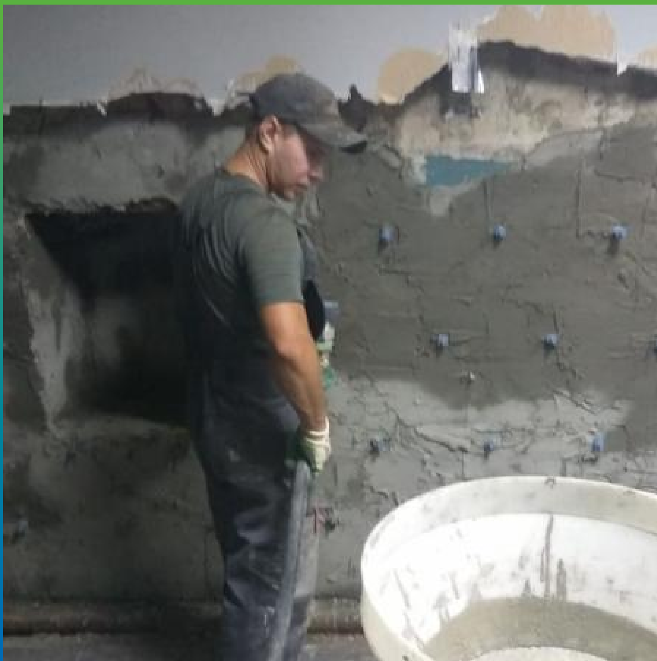
Инъектирование Маноцем Гроут