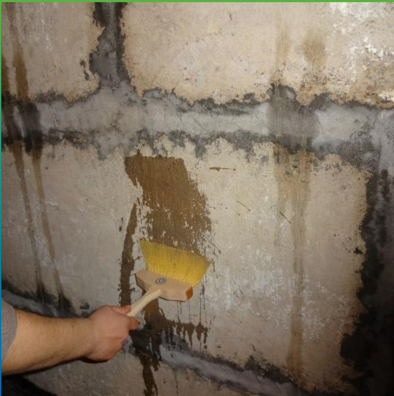
Увлажнение поверхности перед нанесением Стармекс Сил Флекс