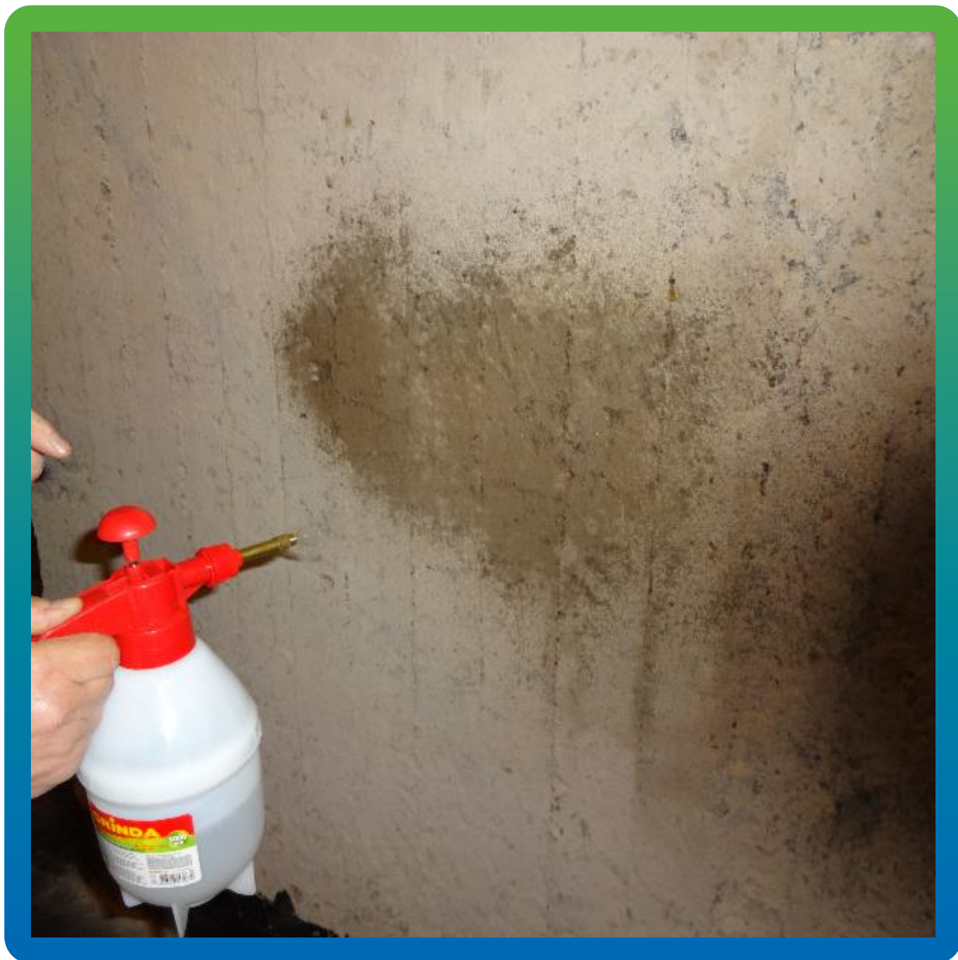
Нанесение противогрибкового состава Маноксан БФА