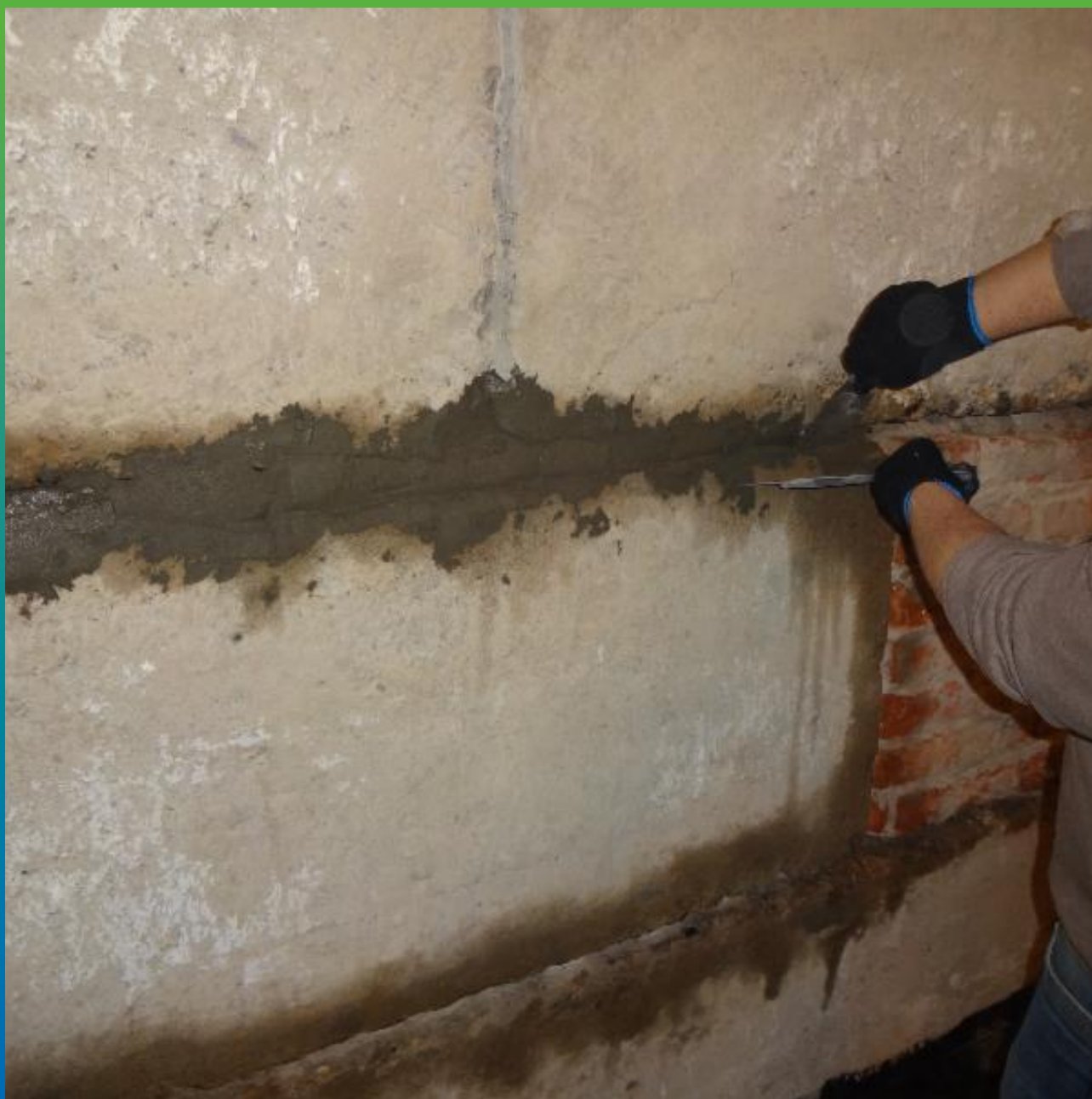
Ремонт швов ФБС ремонтным составом Стармекс РМЗ