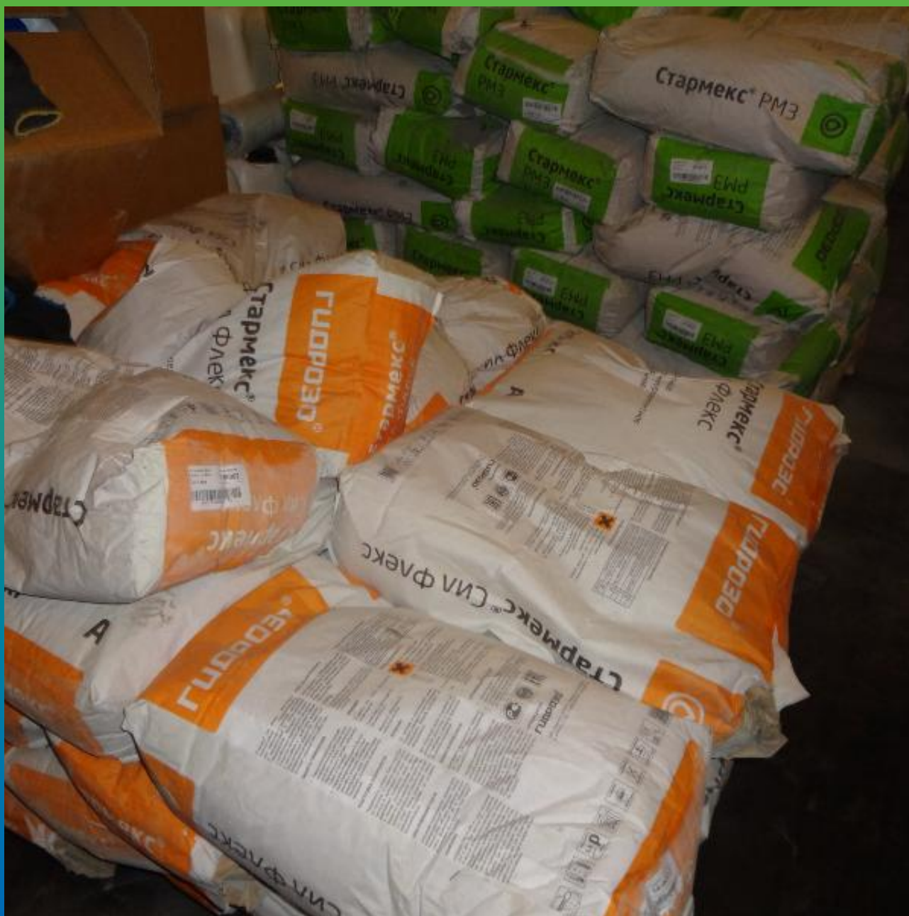
Материалы Гидрозо на объекте