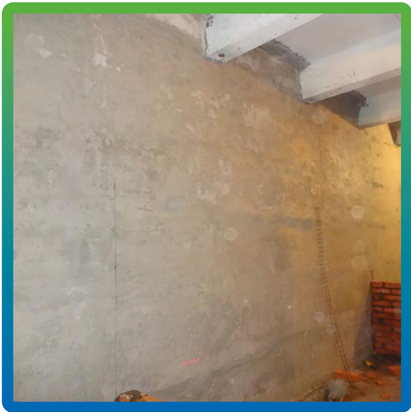
Вид объект после выполнения работ по ремонту и гидроизоляции