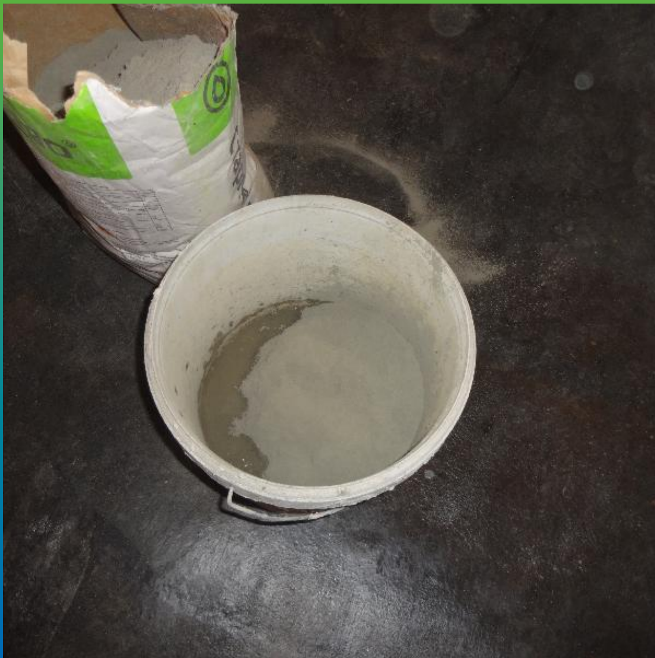
Затворение с водой ремонтного состава Стармекс РМЗ