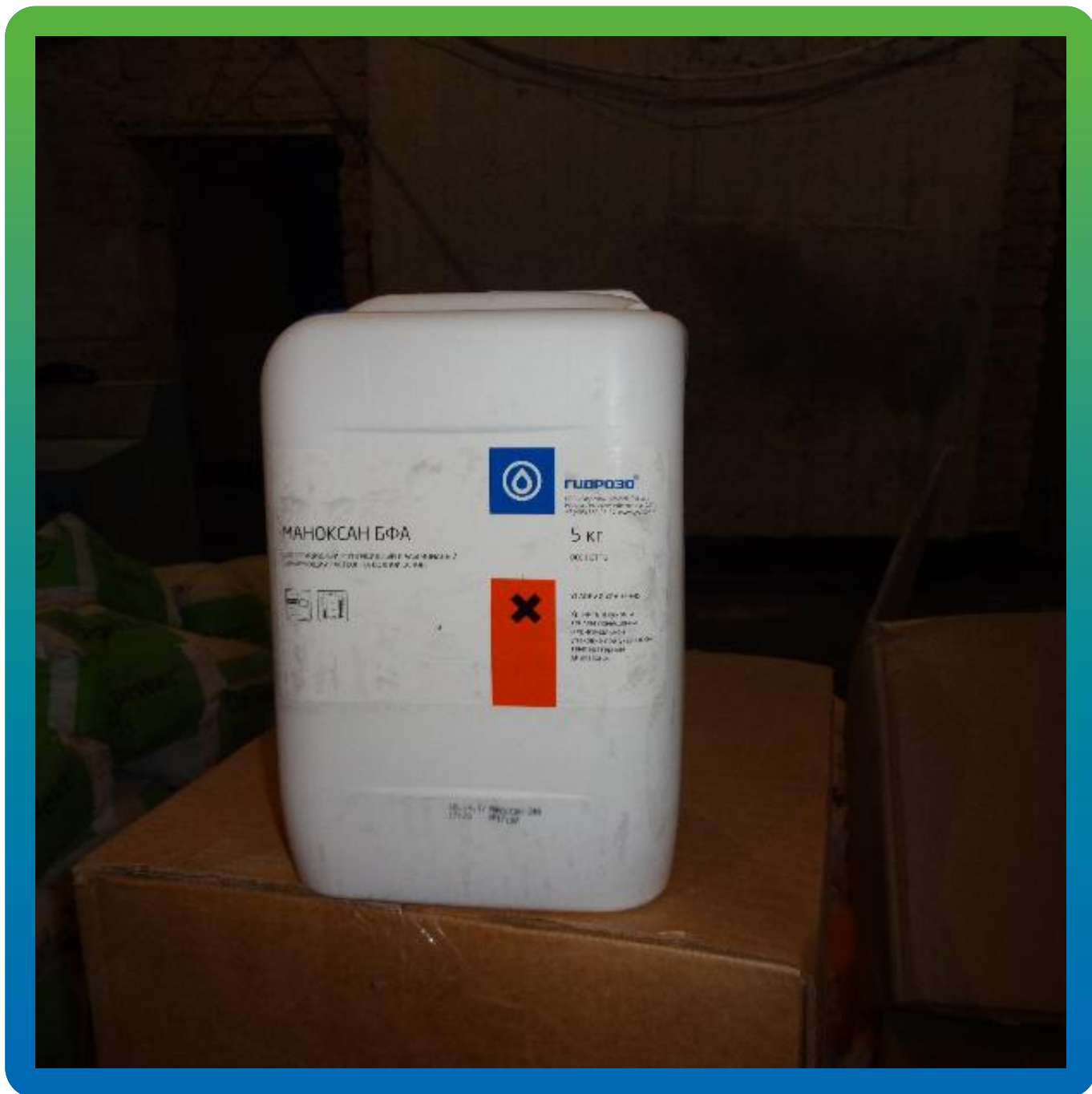
Нанесение противогрибкового состава Маноксан БФА