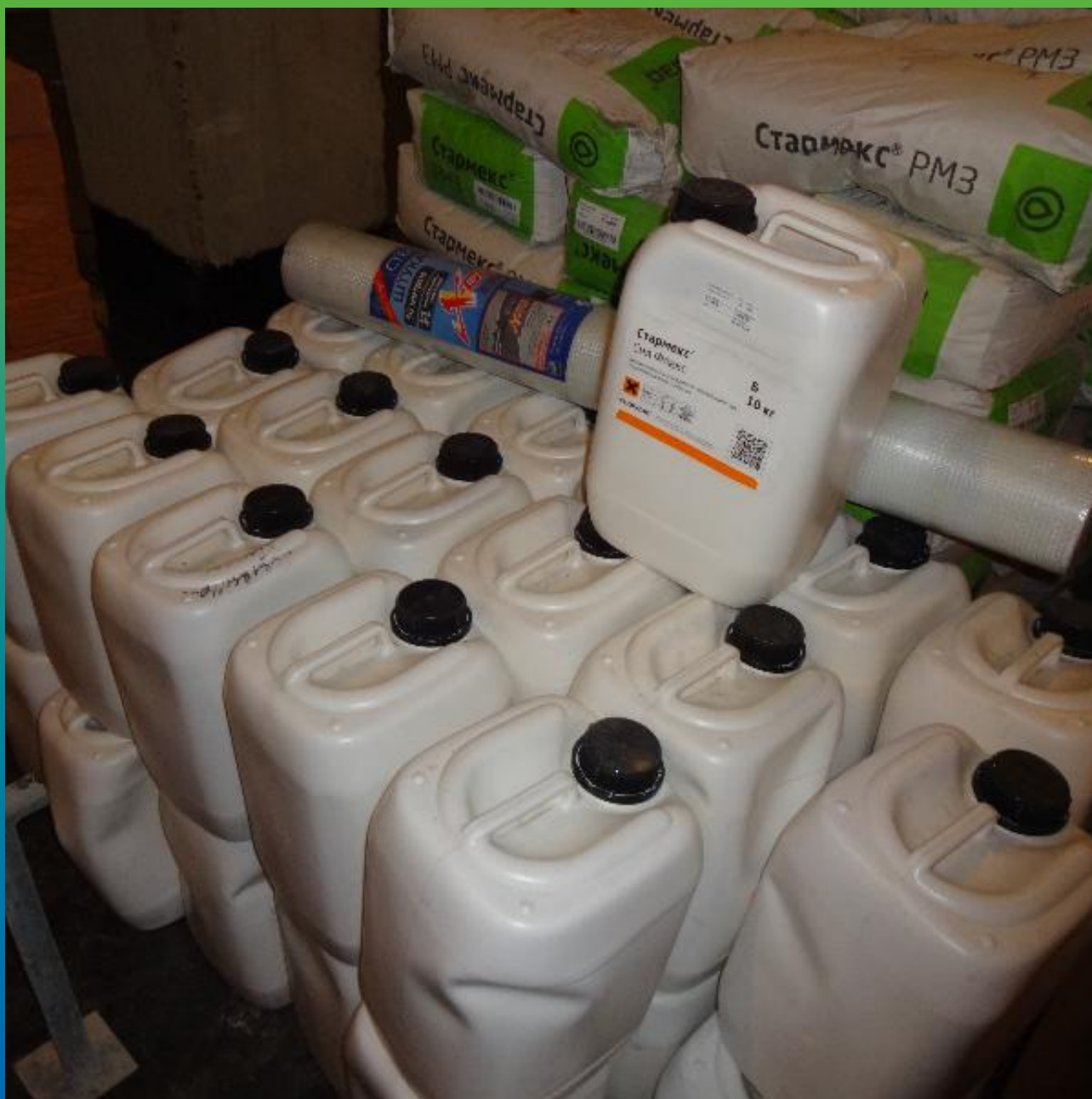
Материалы Гидрозо на объекте