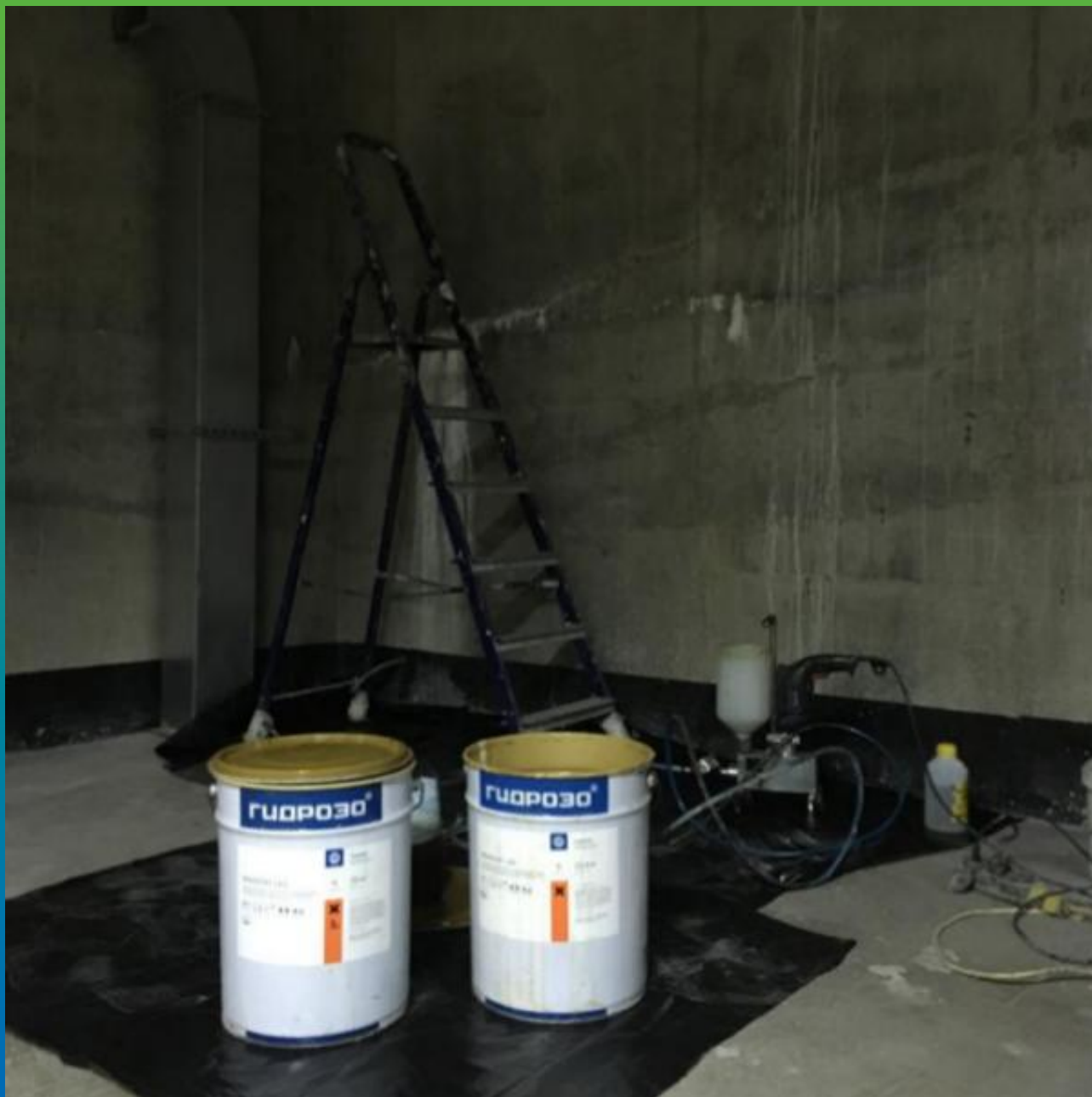
Инъектирование Манопур 143