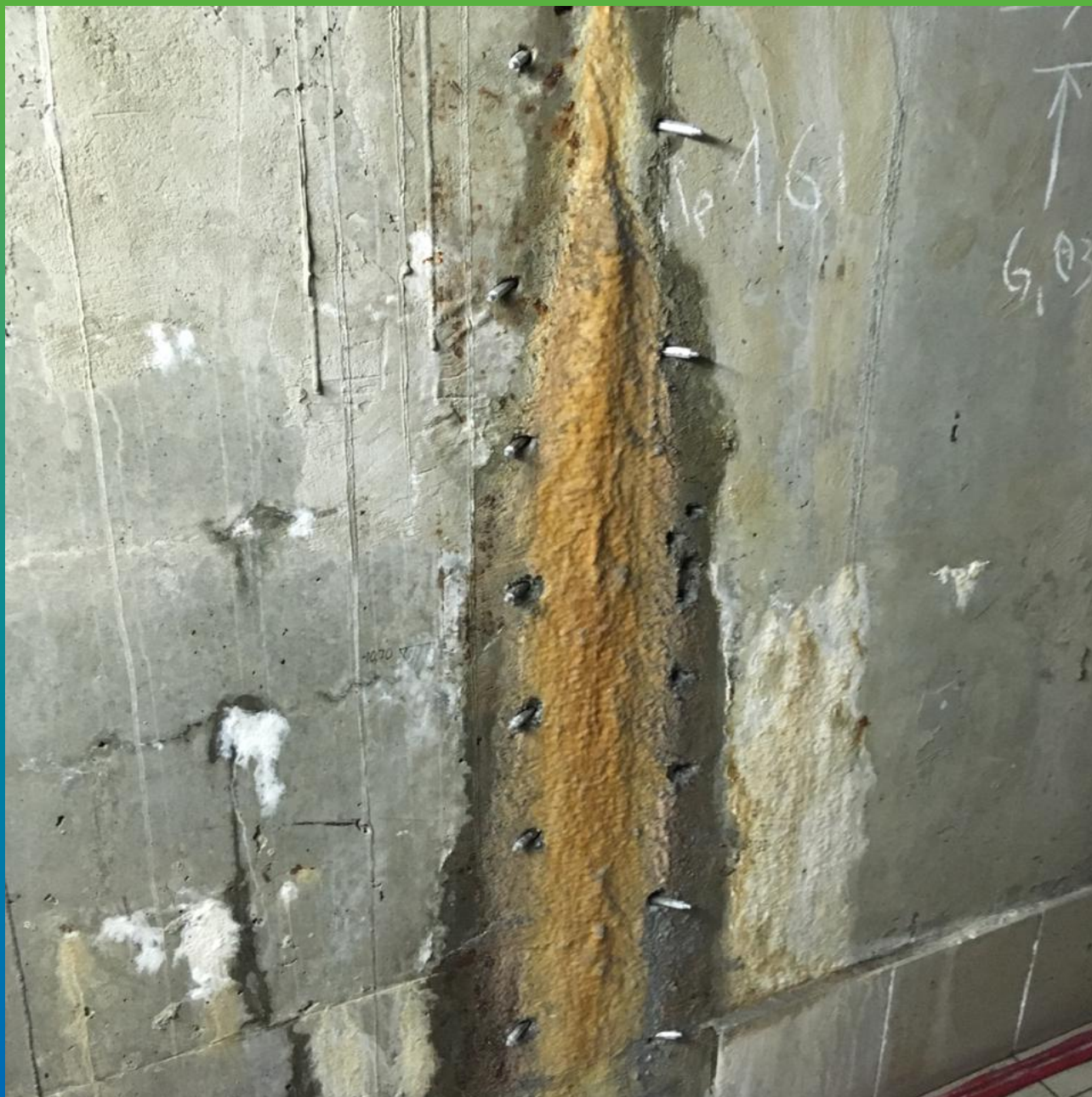
Проблемное место перед инъектирование Манопур 143