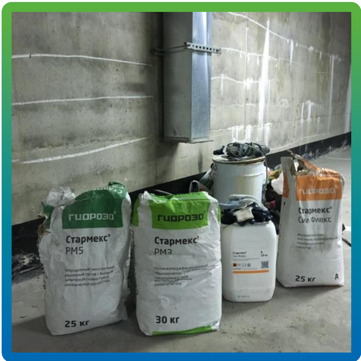
Материалы ООО Гидрозо