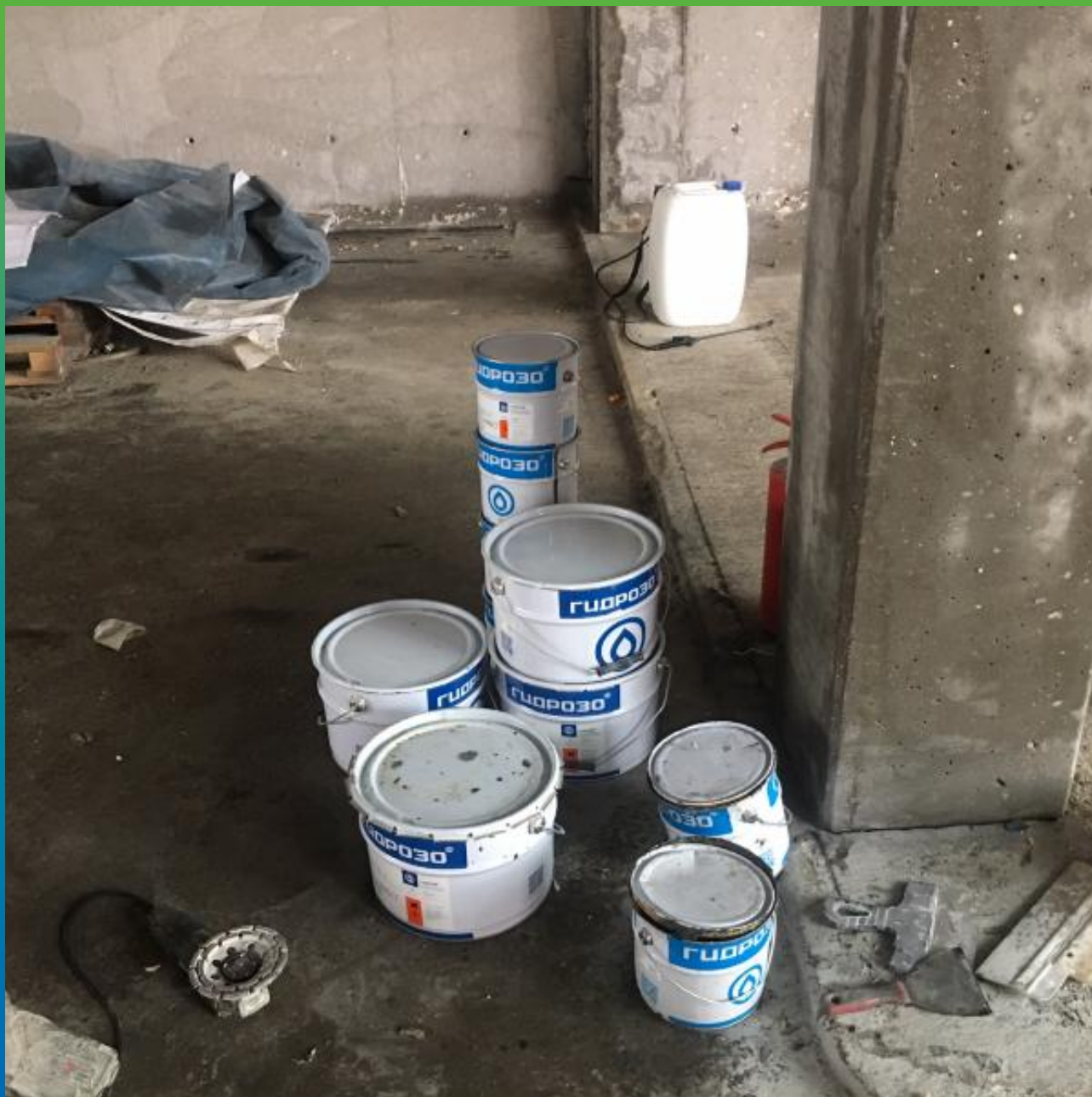
Материалы Гидрозо на объекте