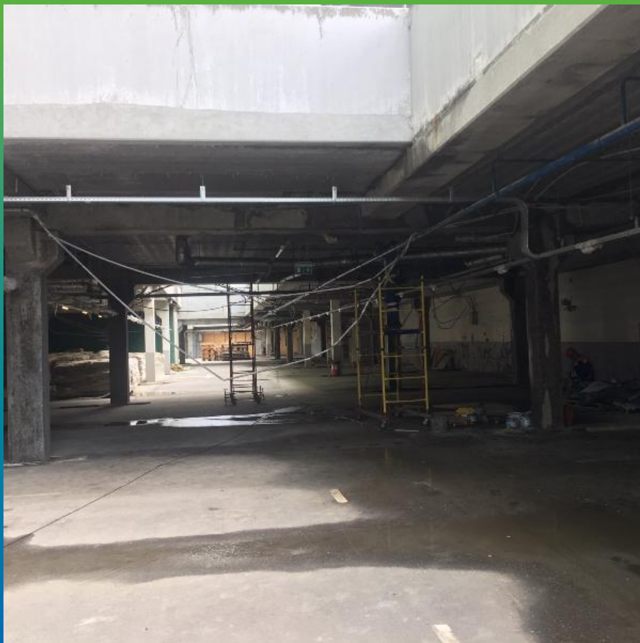
Вид парковки изнутри