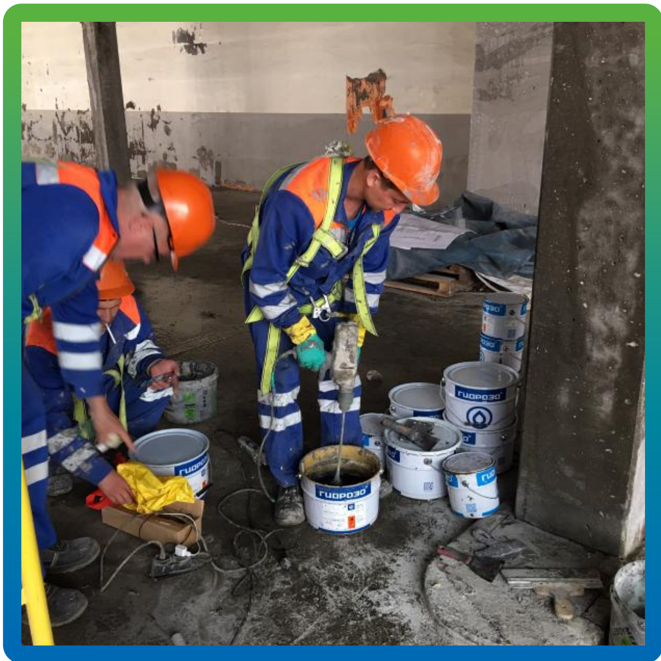
Приготовление материала Манопокс 331