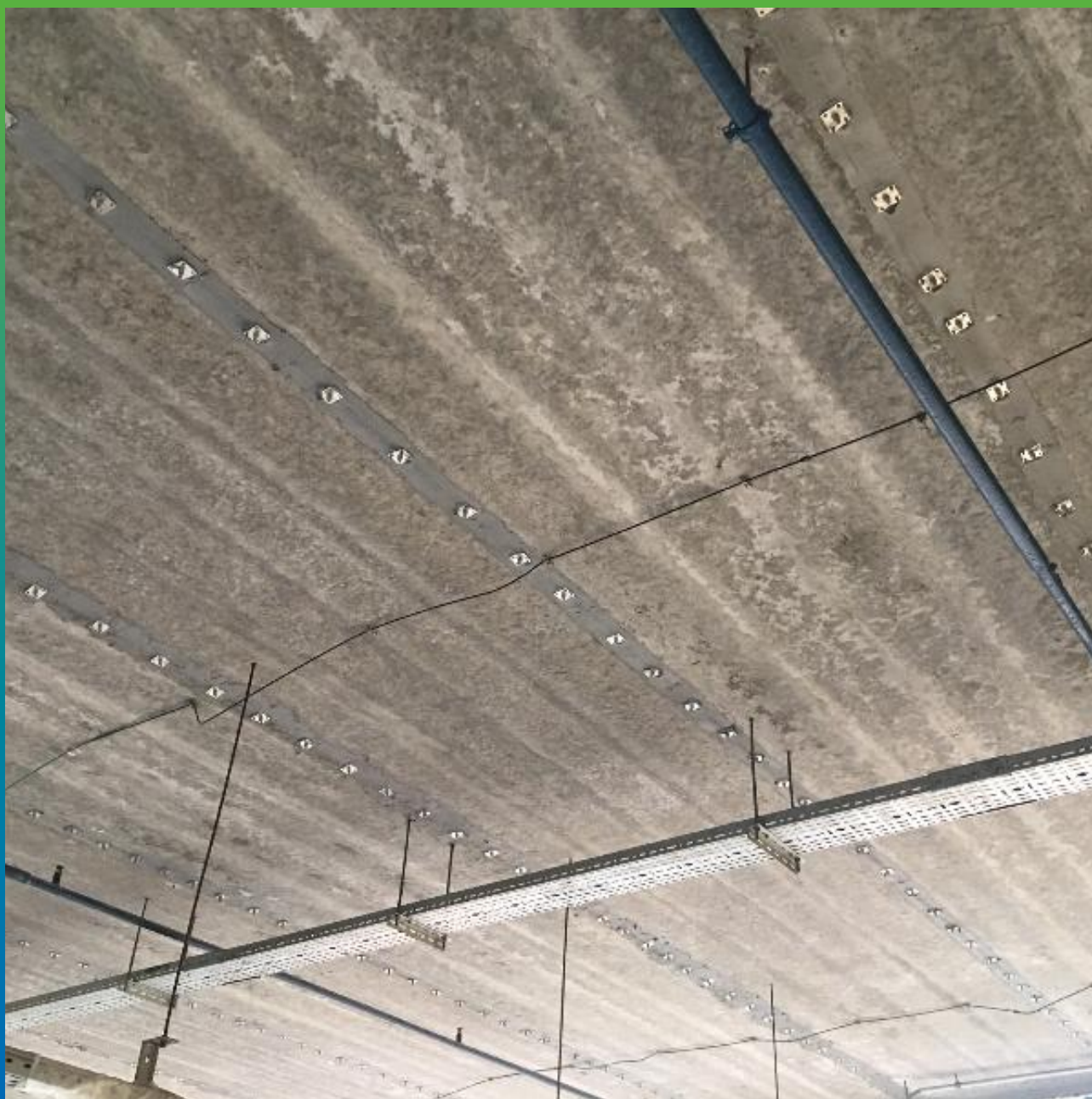
Вид швов с установленными пакерами БМ 0189 на клей Манопокс 331