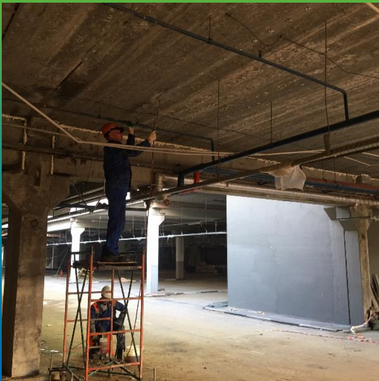
Инъектирование межплиточных швов перекрытия смолой Манопур 144