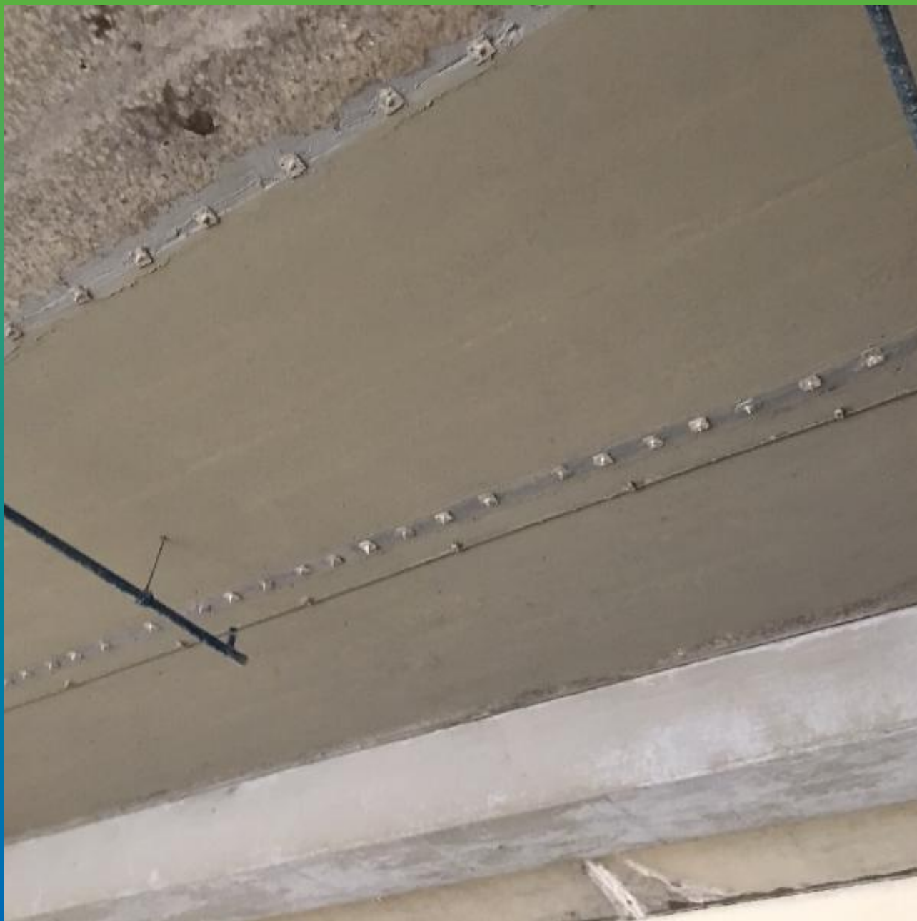
Гидроизоляция перекрытий эластичным материалом Стармекс Сил Флекс