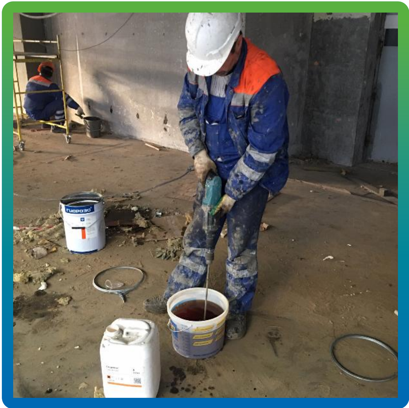
Приготовление инъекционной смолы Манопур 144