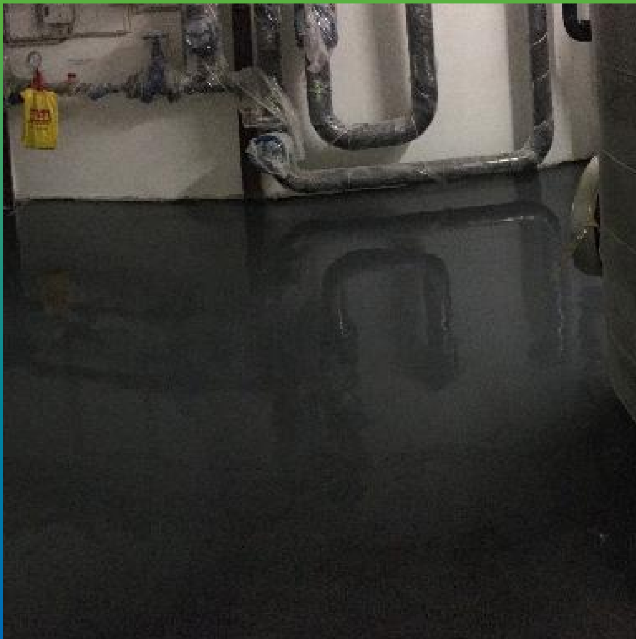
Вид пола с финишным покрытием ДенсТоп ПУ 730 УФ Колор