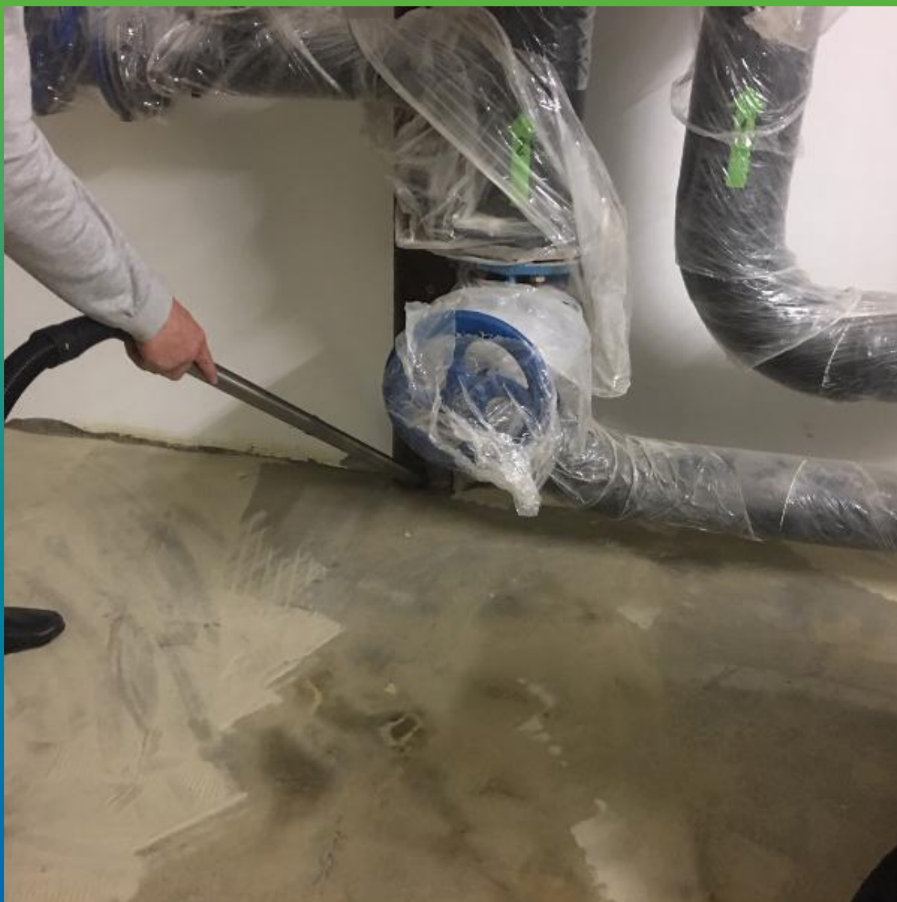
Очистка загрунтованного основания от лишнего песка ДенТоп Филлер