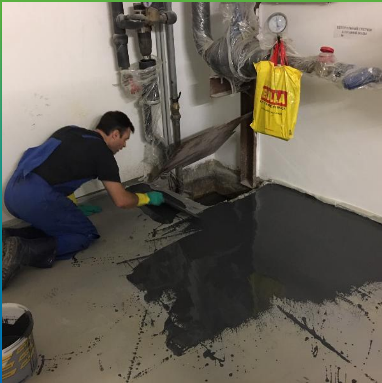
Укладка финишного покрытия ДенТоп ПУ 730 УФ Колор