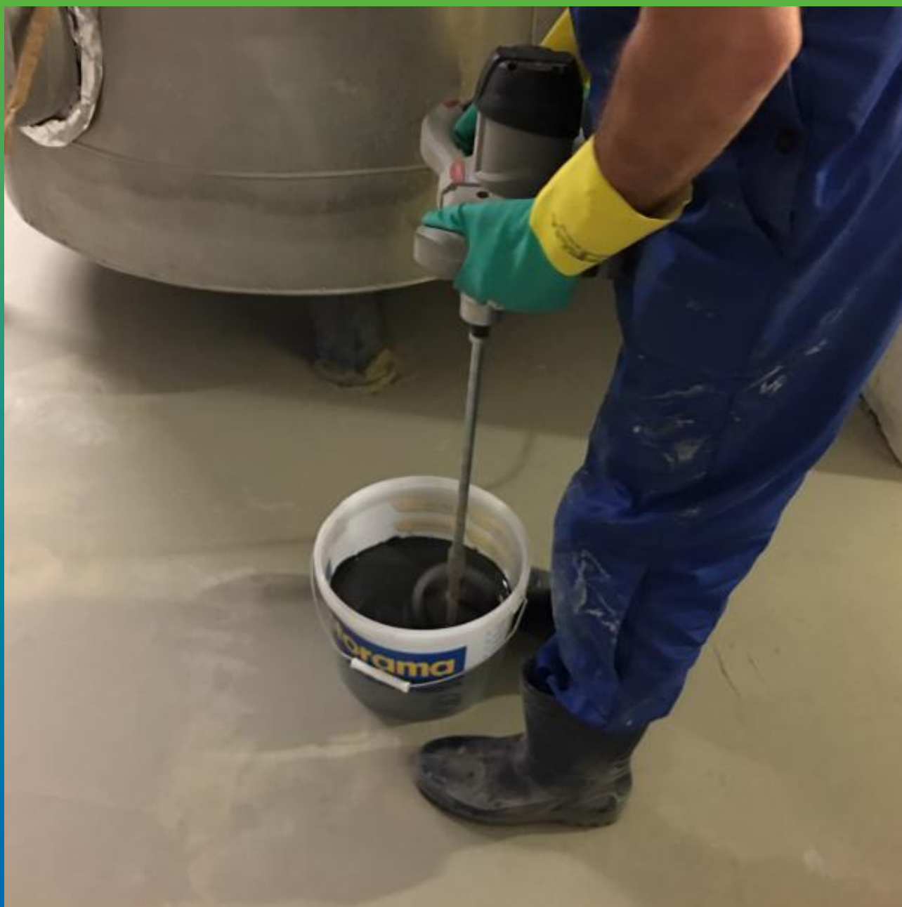
Приготовление материала ДенТоп ПУ 730 УФ Колор