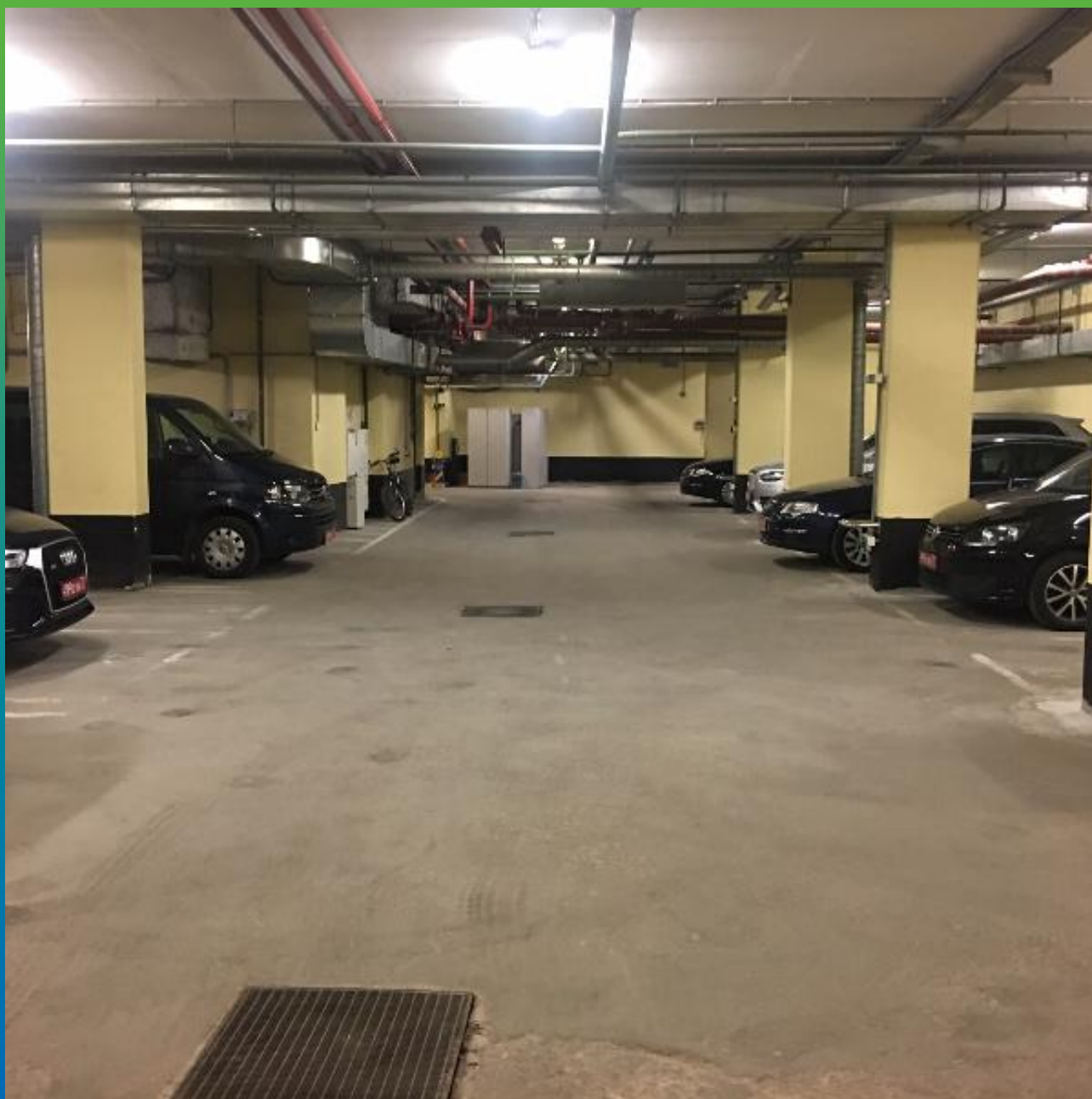
Вид объекта изнутри