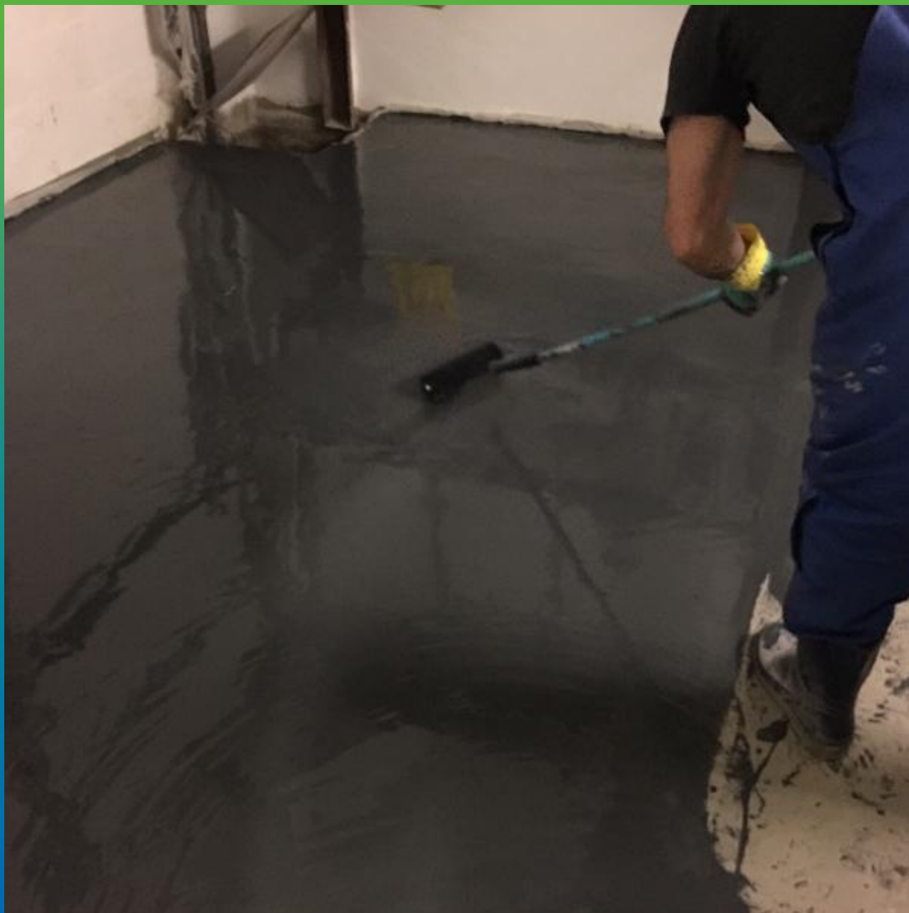
Обработка свежего покрытия игольчатым валиком