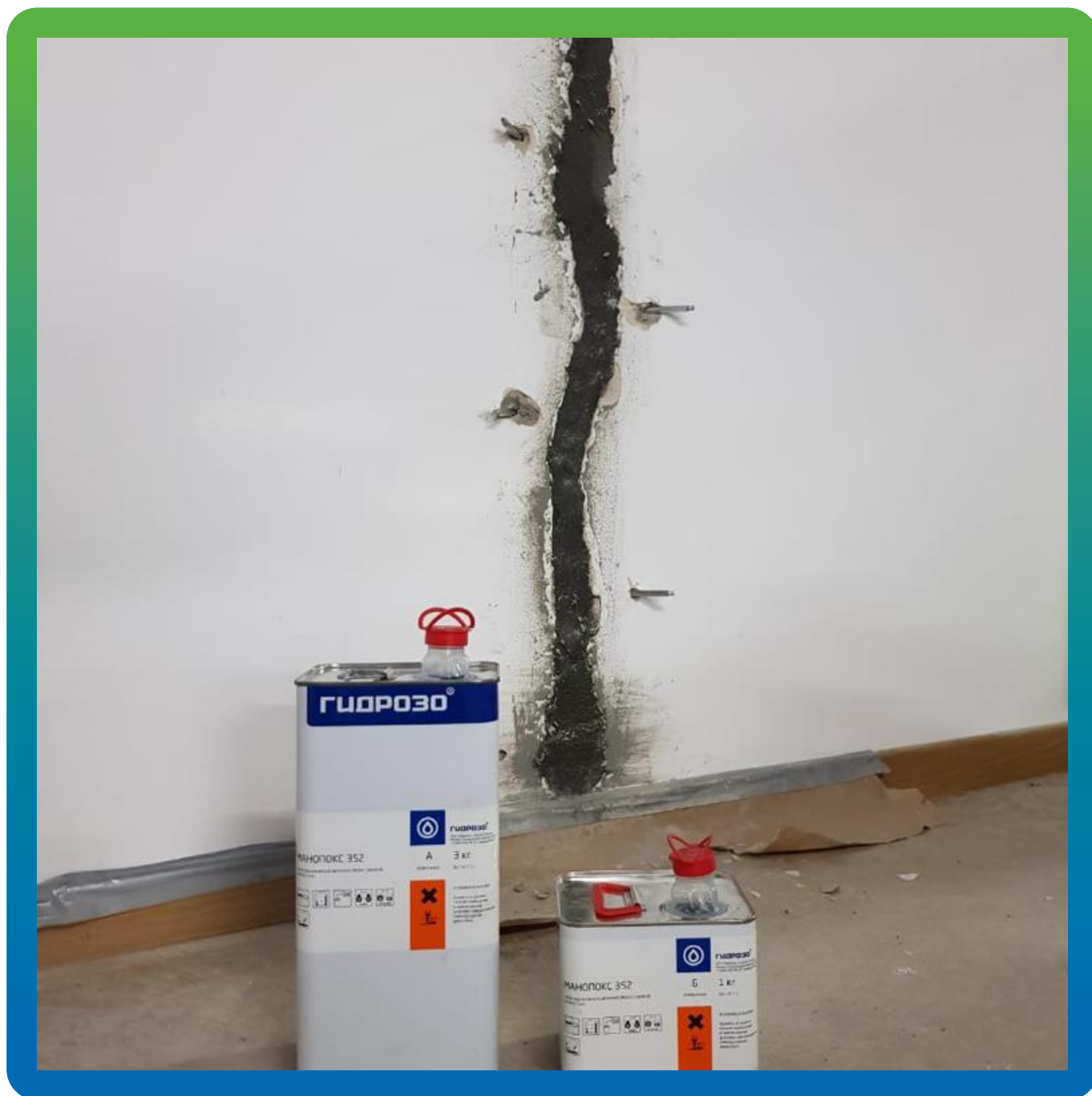
Подготовка к инъектированию Манопокс 352