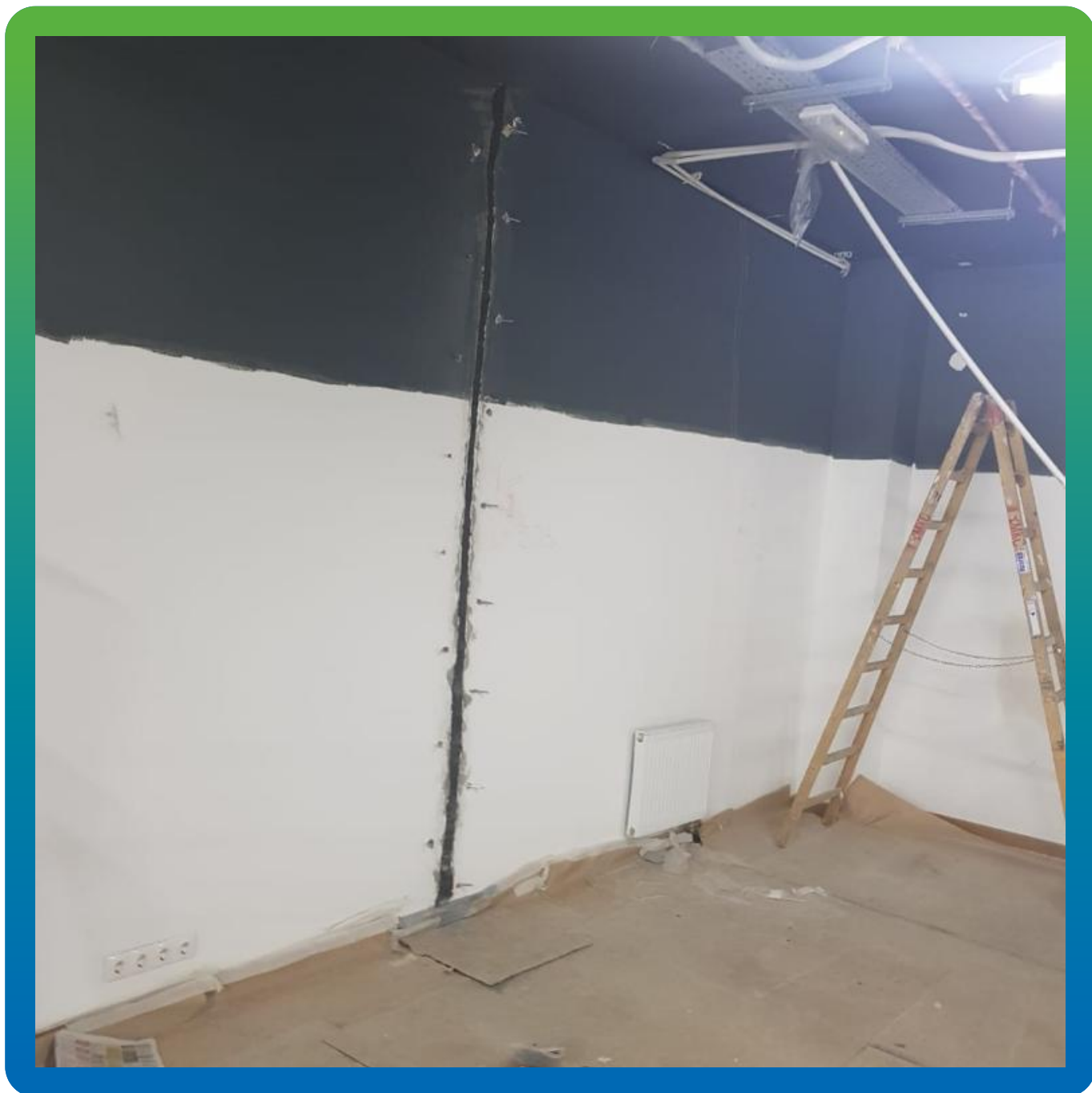
Финишный вид на шов после проведения инъекционных работ