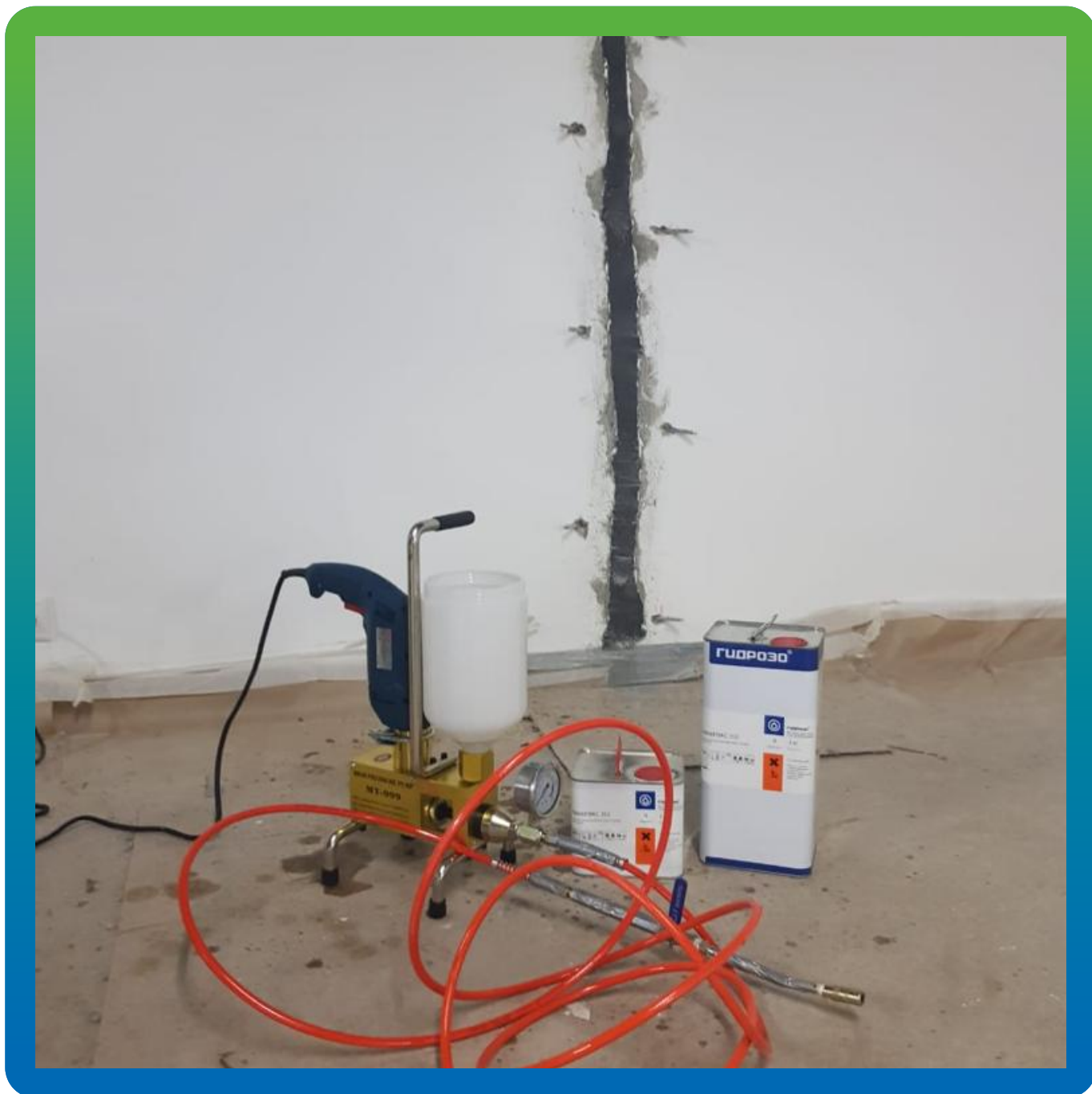
Манопокс 352 и инъекционный насос типа БМ 0401 перед началом работ