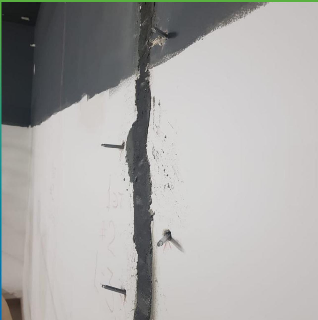
Подготовка к инъектированию Манопокс 352 ЛВ через пакеры БМ 1102 и заделка шва Стармекс РМЗ