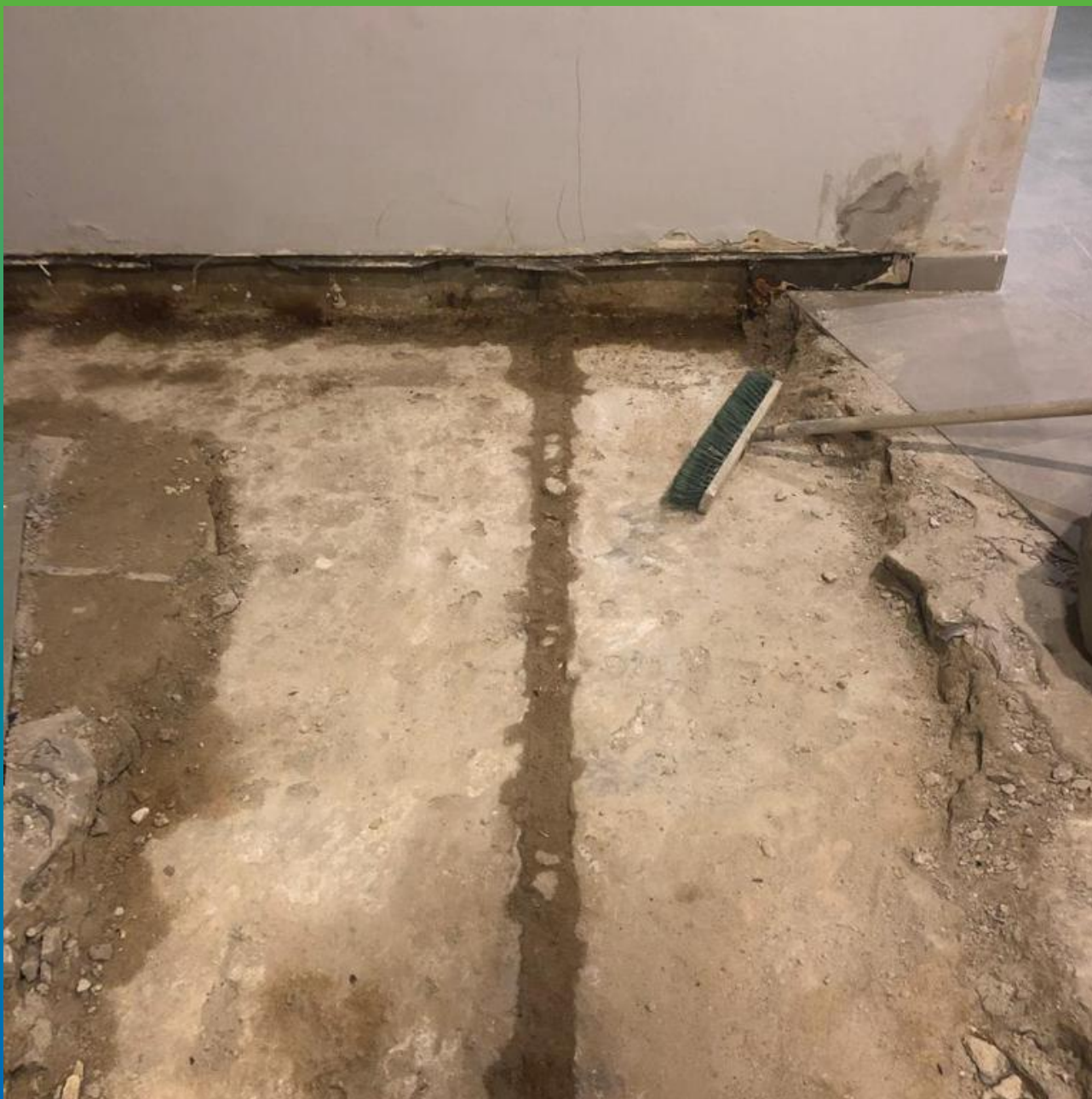
Проблемный участок - деформационный шов