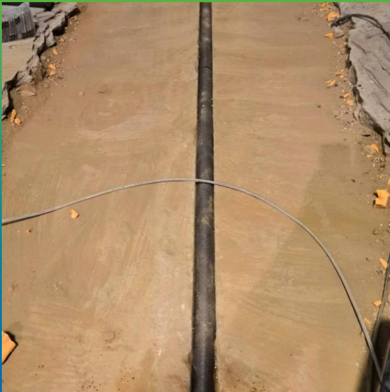
Установка профиля из вспененного полиэтилена