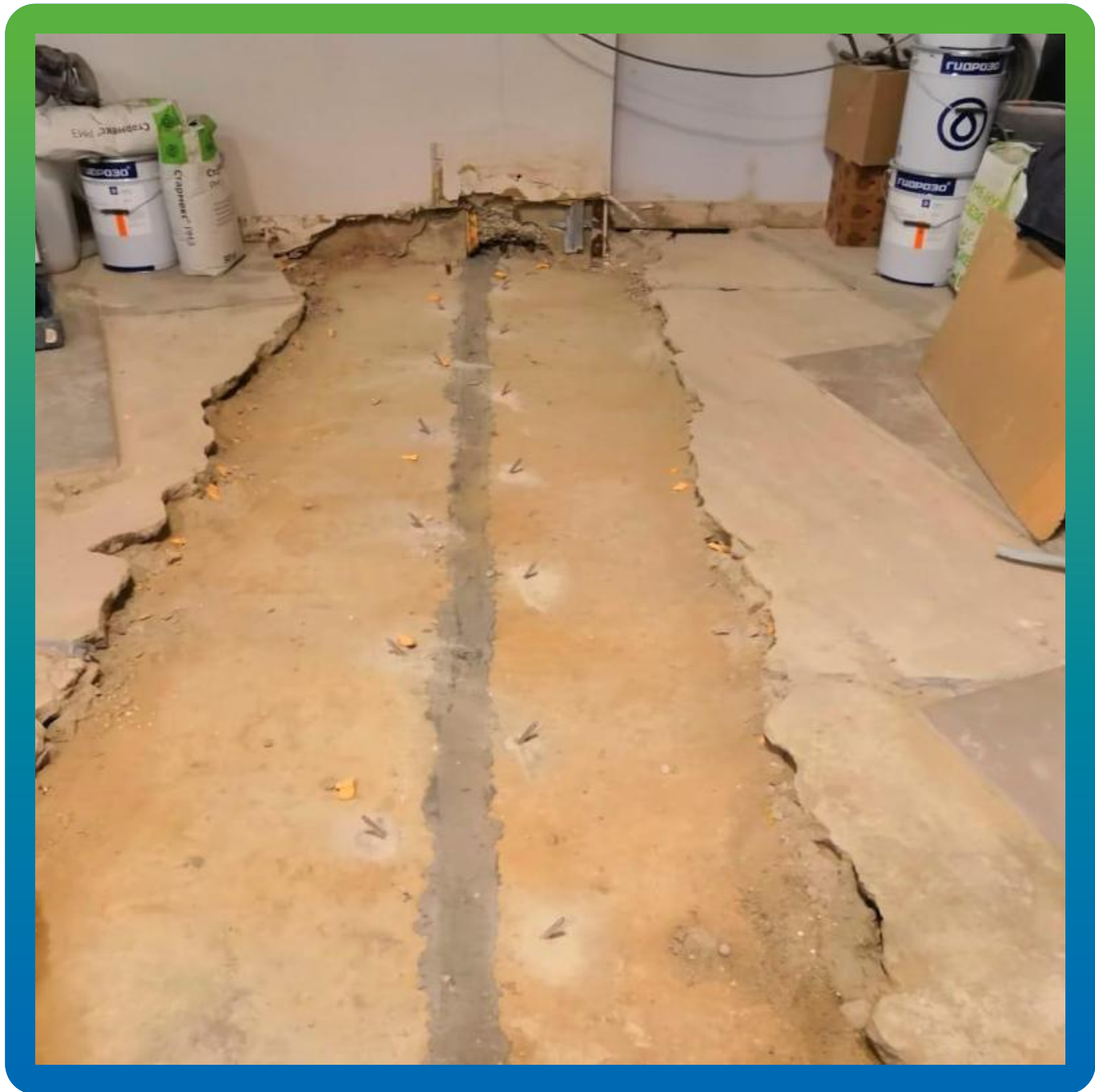
Итоговый вид после проведения инъекционных работ