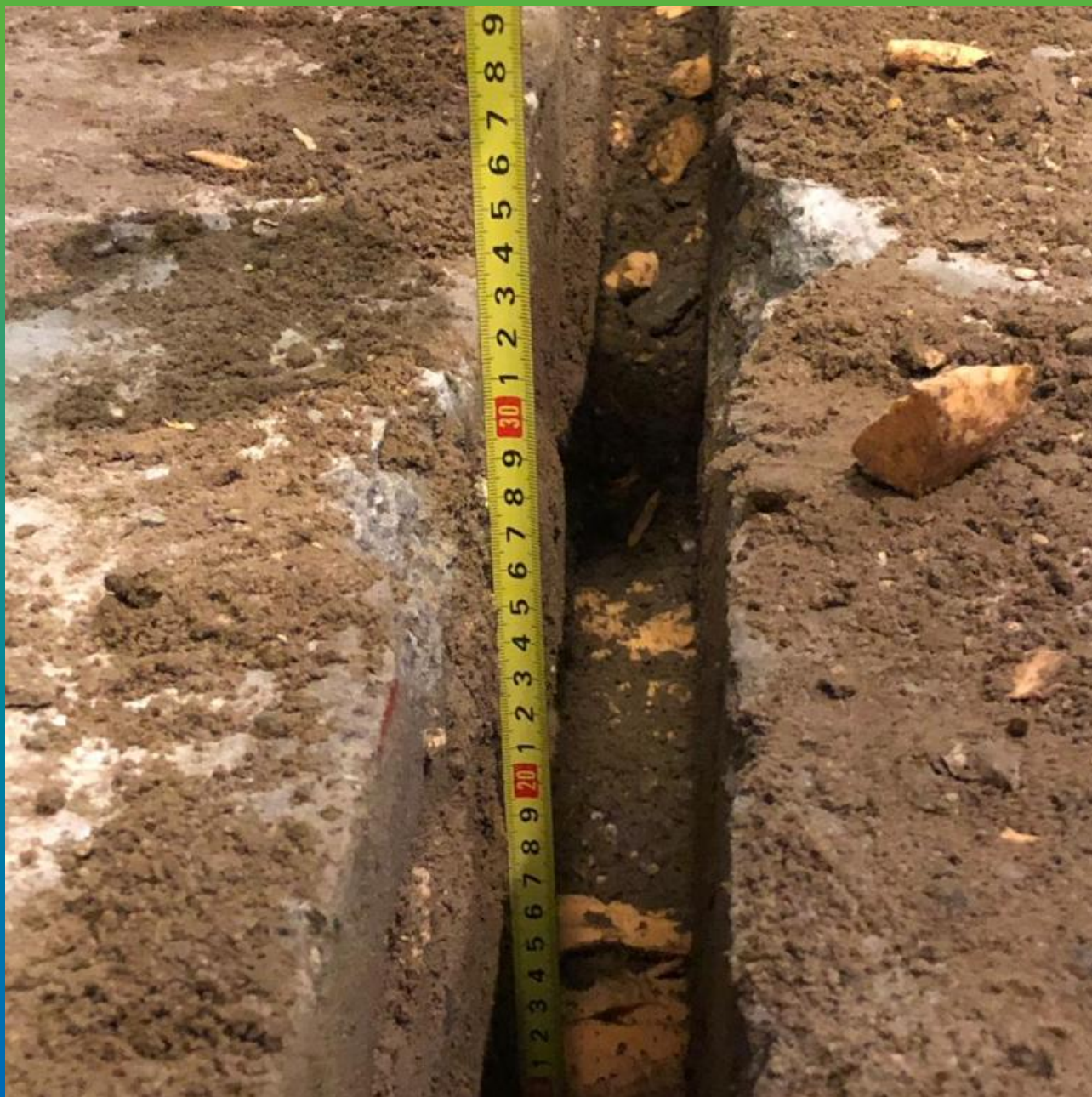
Очистка деформационного шва