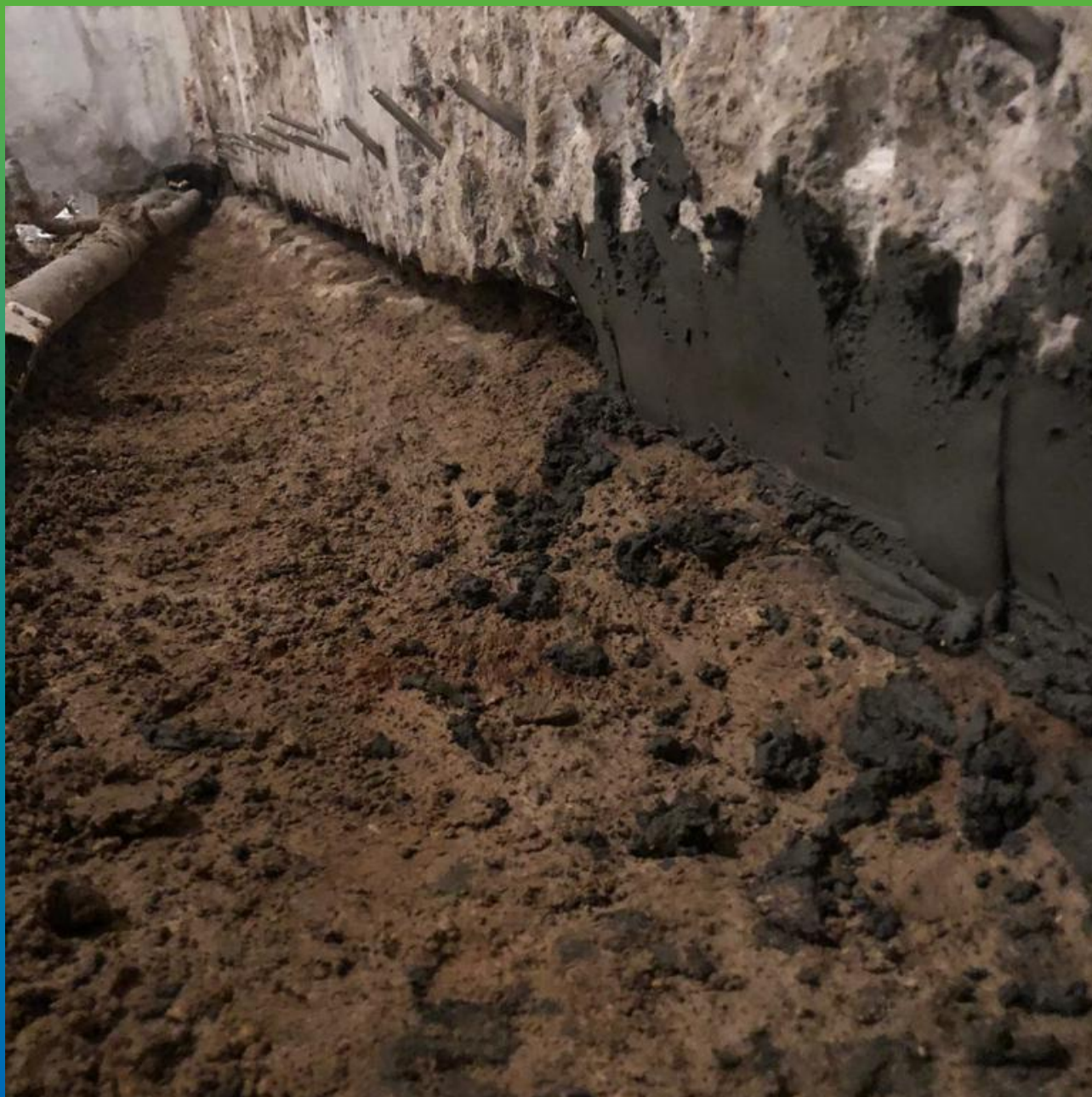
Установка пакеров БМ 1100, зачеканка примыкания Стармекс РМЗ.