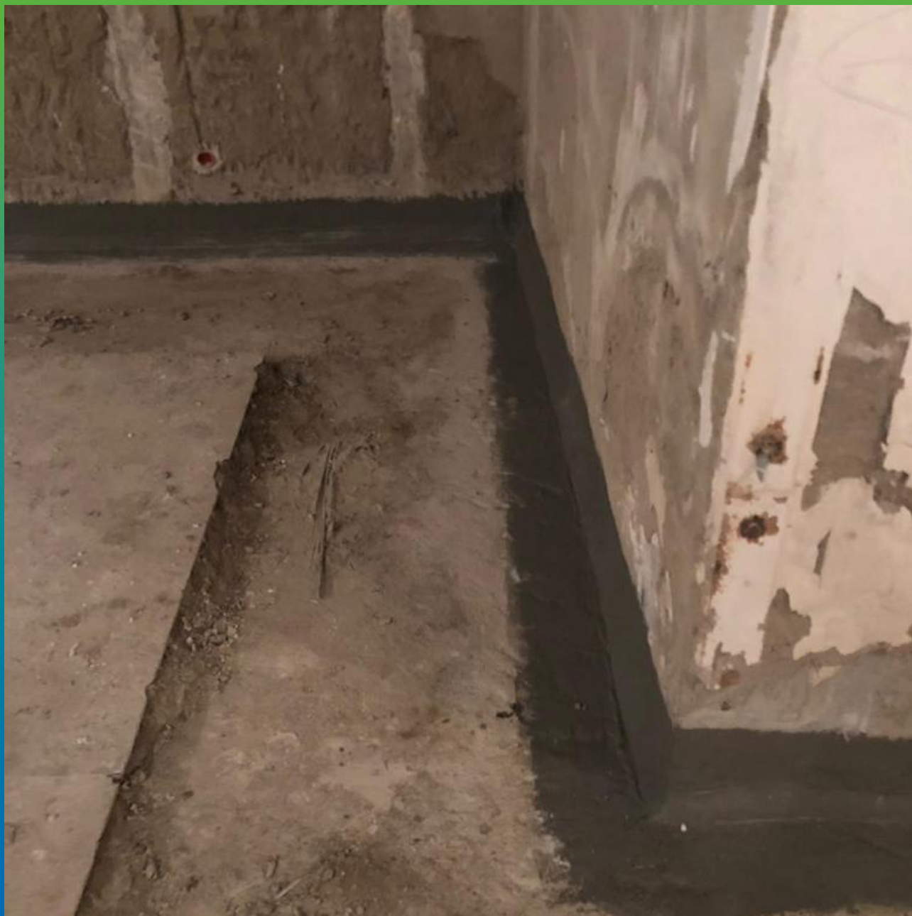
Вид после инъектирования Манопур 15 и Манопур 143