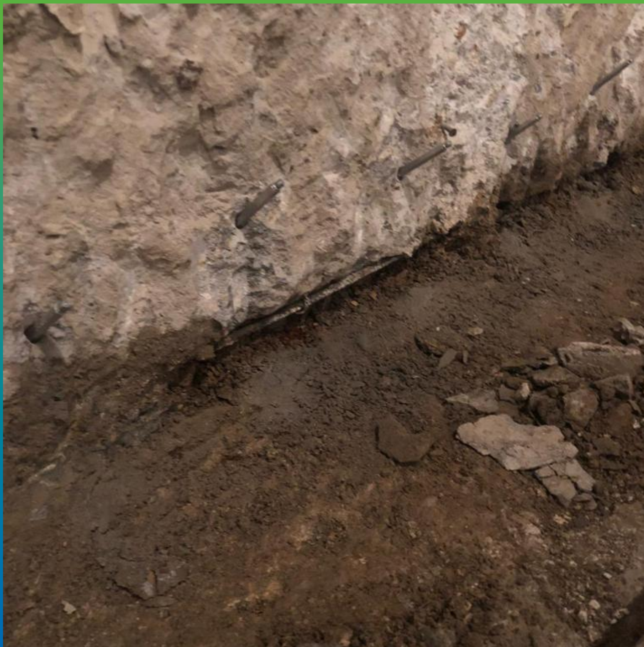
Подготовка примыкания к инъектированию.