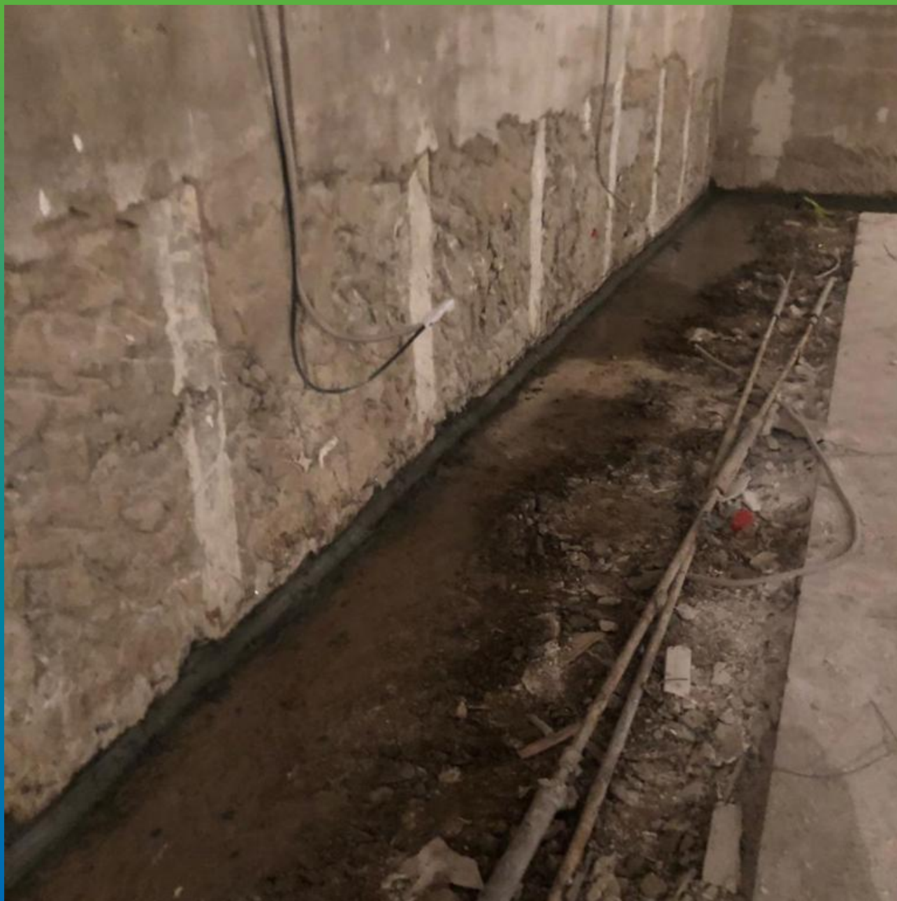
Вид перед инъектированием Манопур 15 с последующим инъектированием Манопур 143.