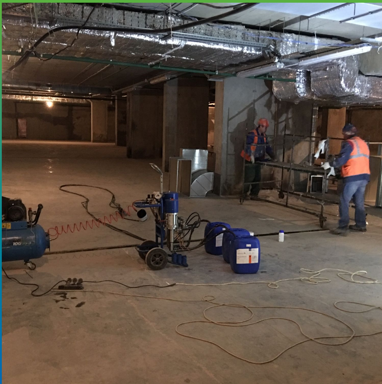
Подготовка рабочего места и оборудования для инъектирования