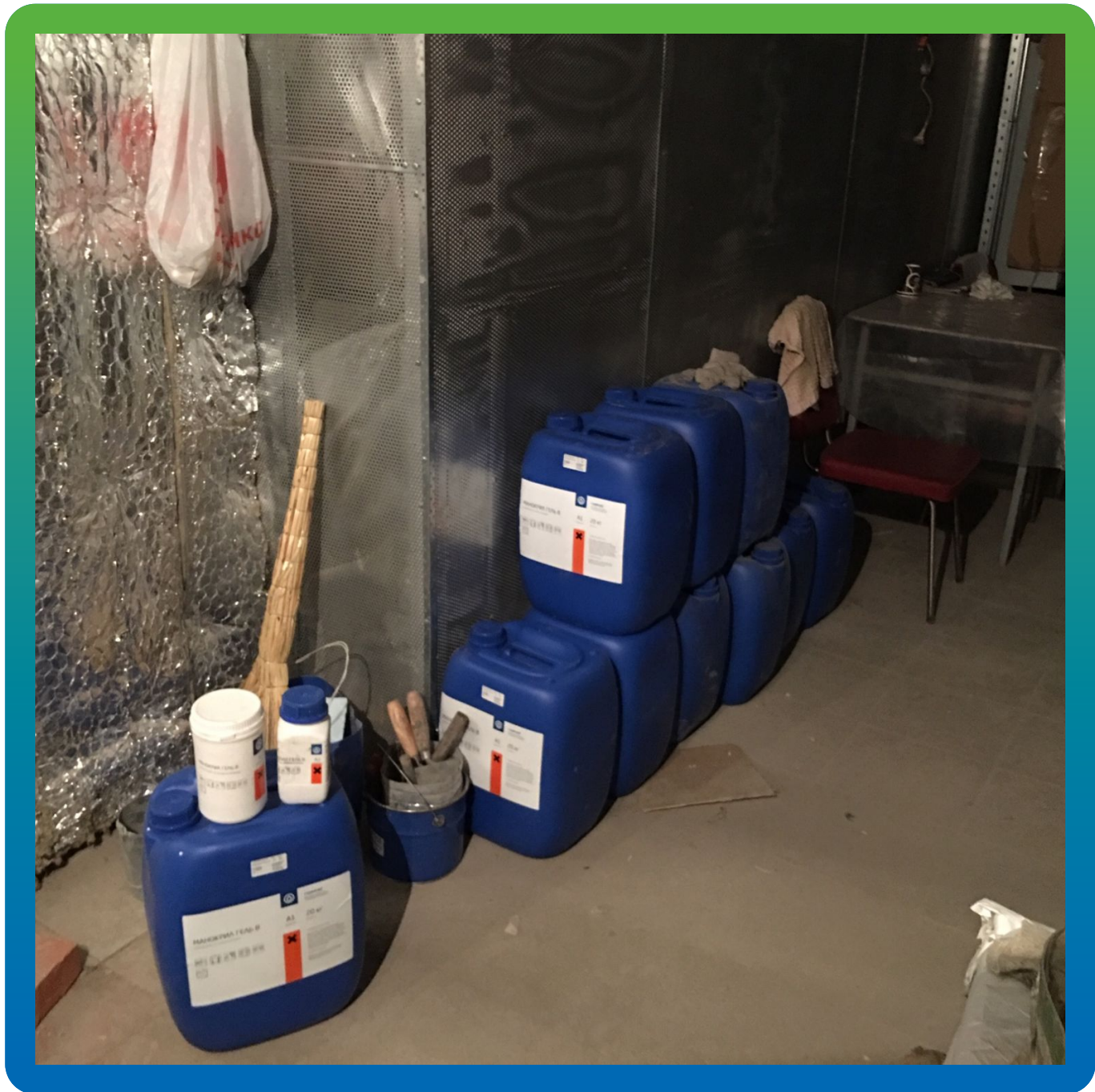
Материал Манокрил гель В на объекте