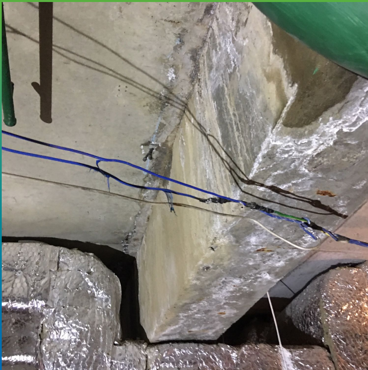
Установленные пакеры и подготовленный деформационный шов для инъектирования