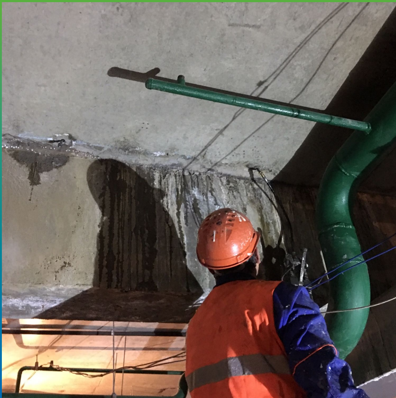
Инъектирование деформационного шва гелем Манокрил гель В