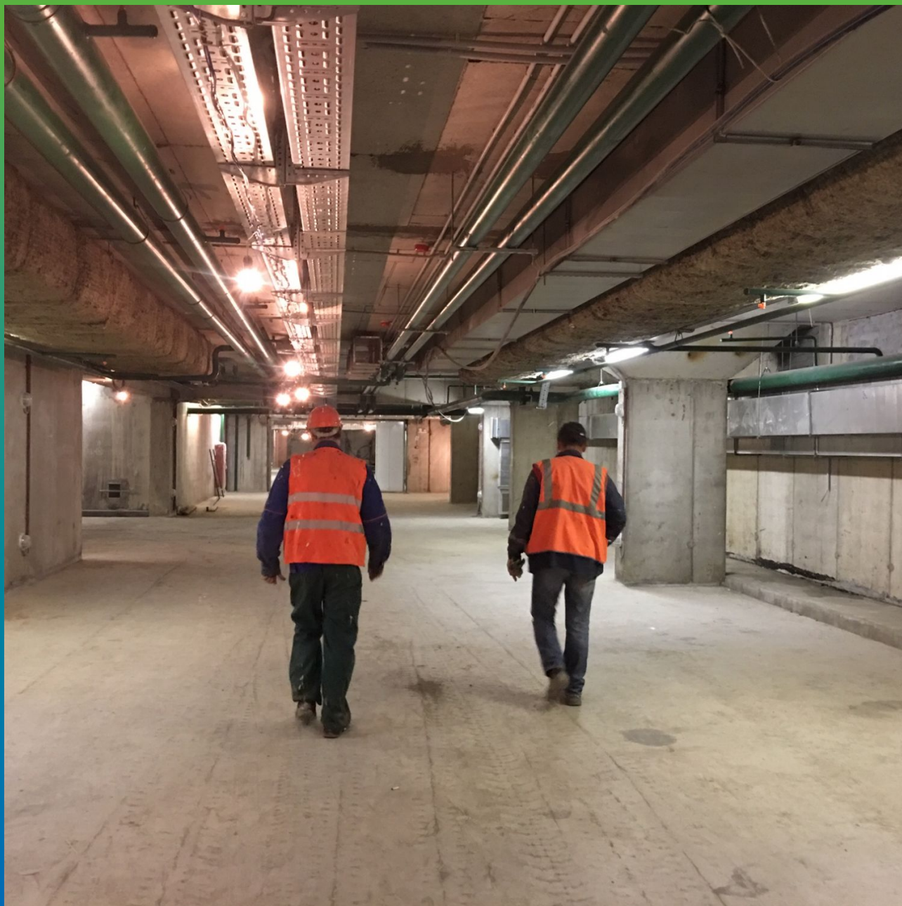
Вид паркинга изнутри