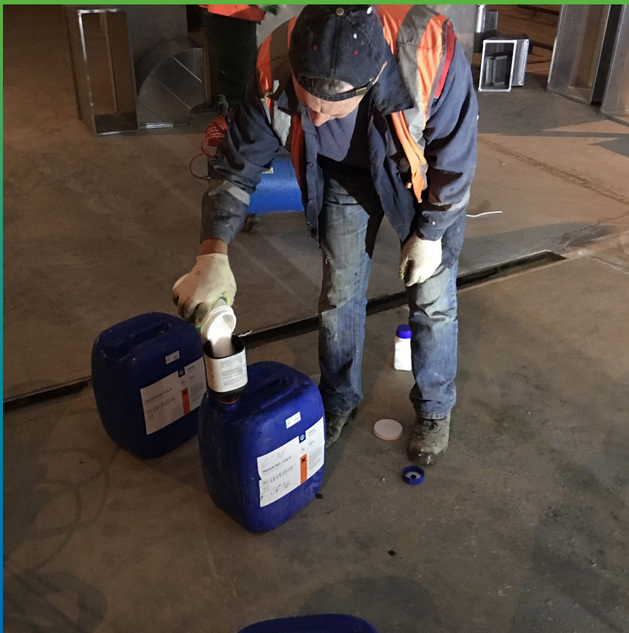
Смешивание компонентов материала