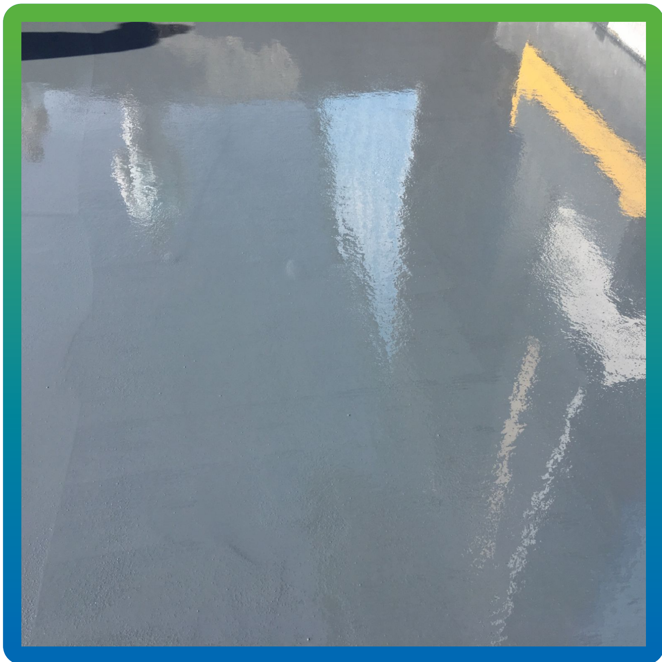
Вид свеженанесенного финишного покрытия Денстоп ПУ 730 УФ Колор