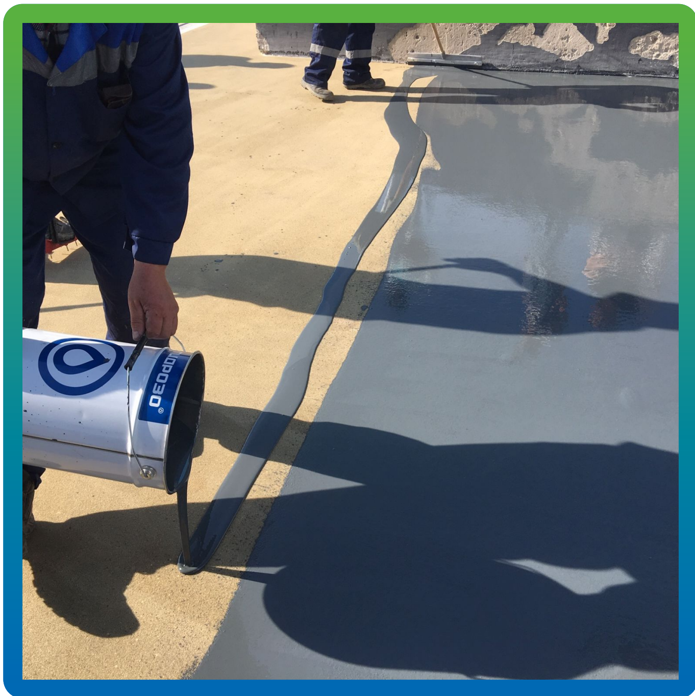
Распределение материала Денстоп ПУ 730 УФ Колор по площади