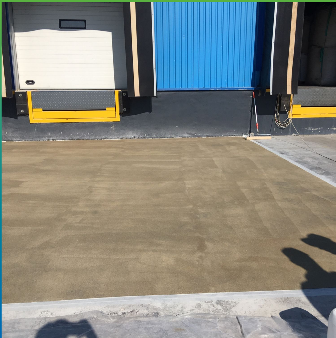
Подготовленное основание грунтовкой ДенсТоп ЭП 100 с песком ДенсТоп Филлер