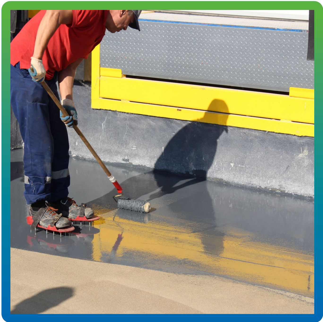
Прокатывание игольчатым валиком