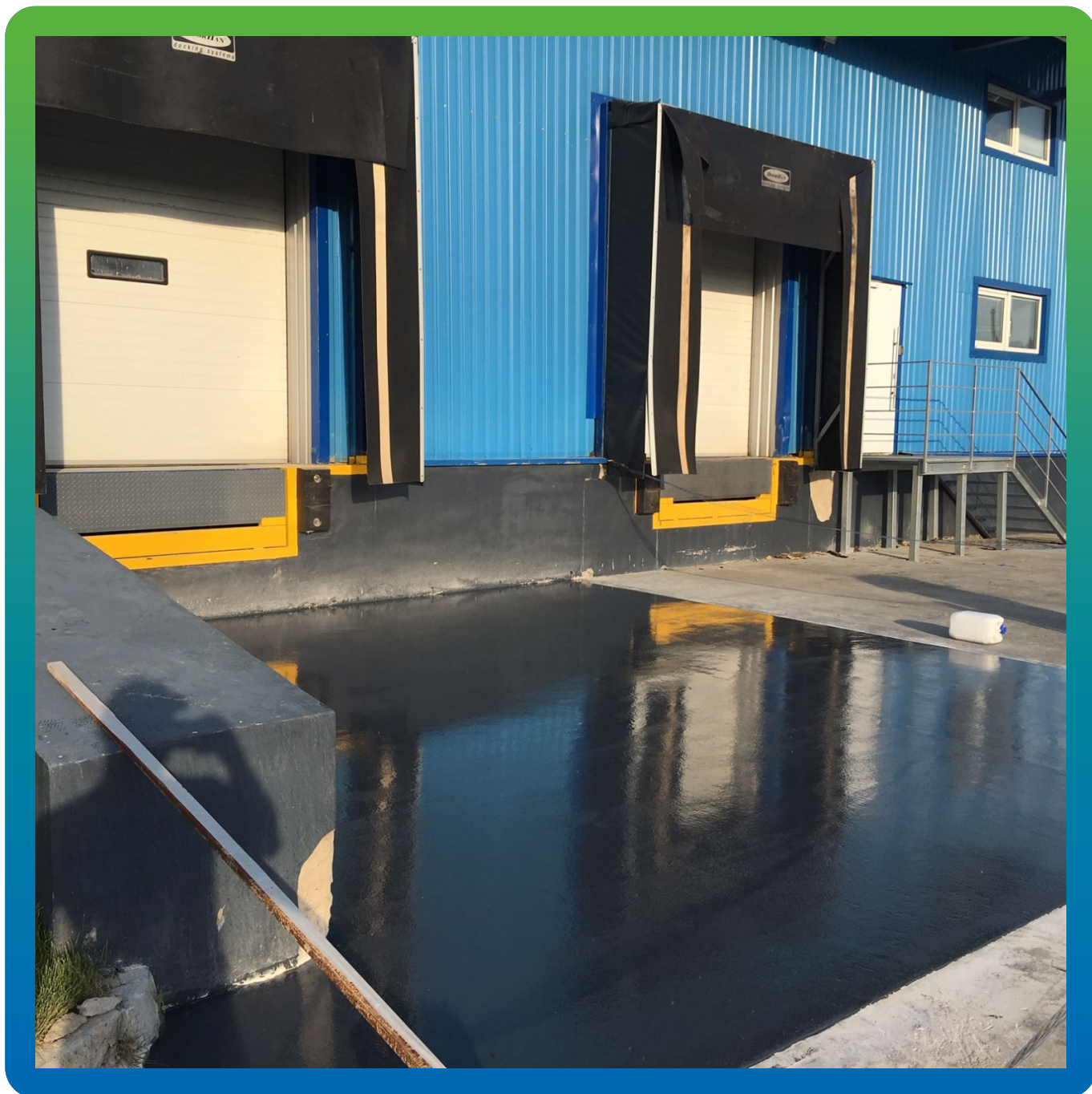
Вид отремонтированного участка