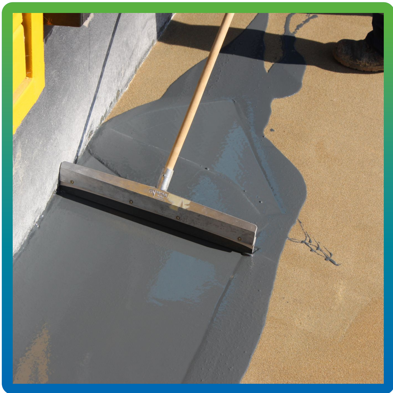
Нанесение материала Денстоп ПУ 730 УФ Колор раклей