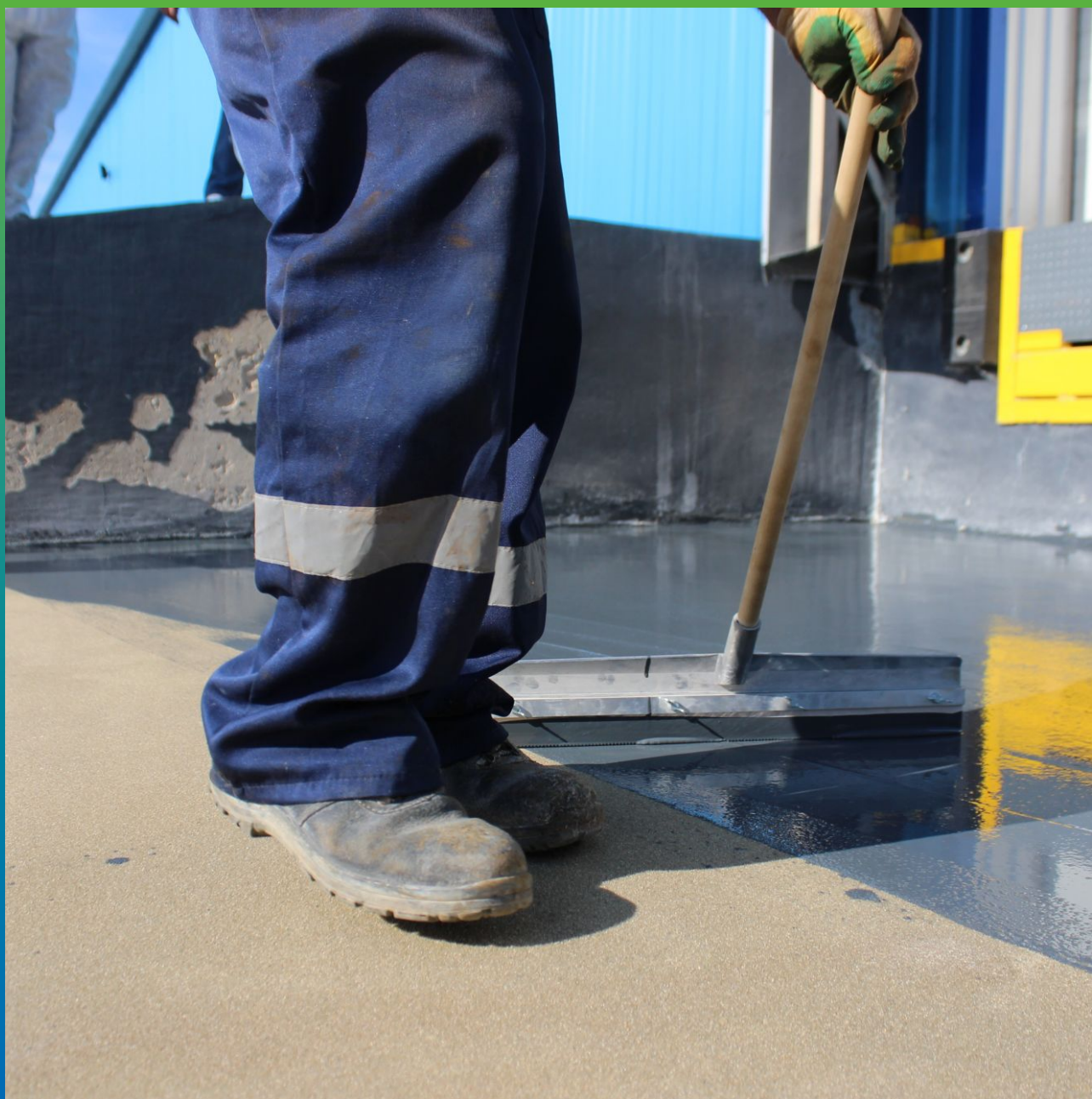
Нанесение материала Денстоп ПУ 730 УФ Колор раклея