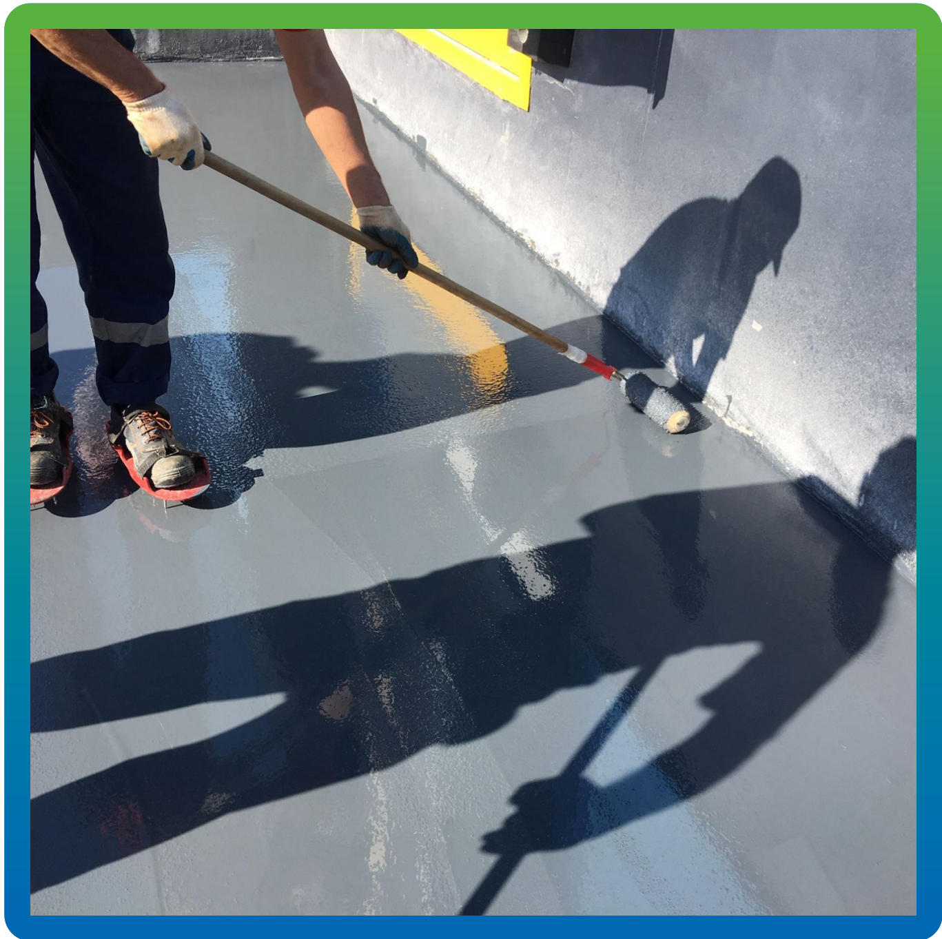
Прокатывание игольчатым валиком