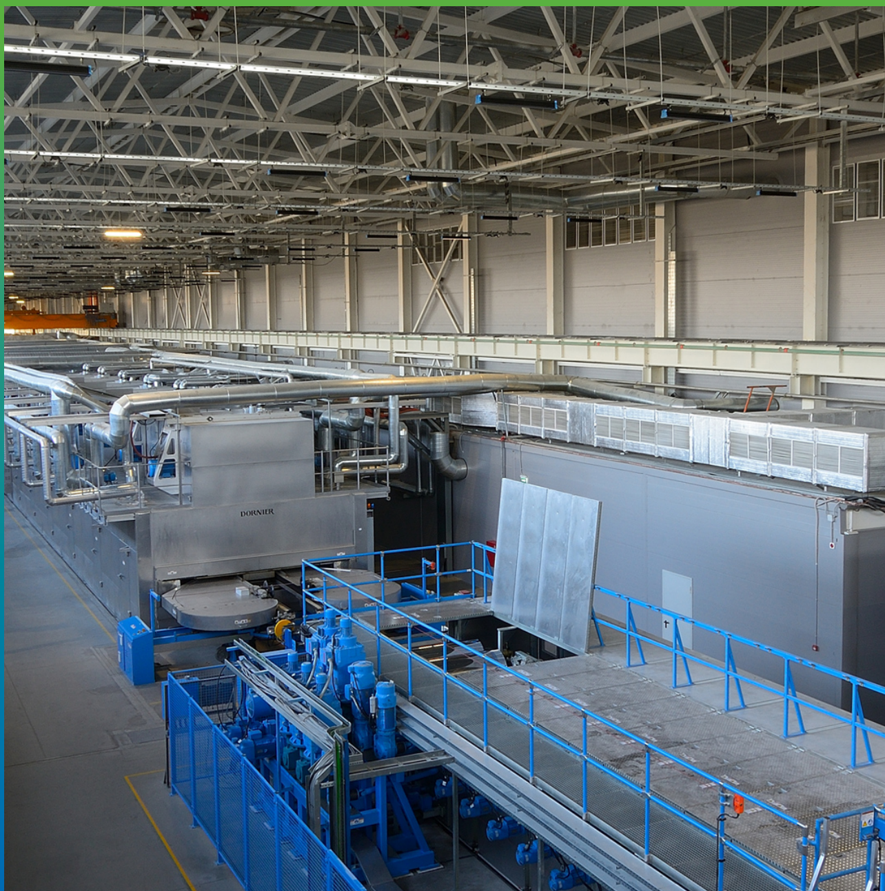
Общий вид цеха