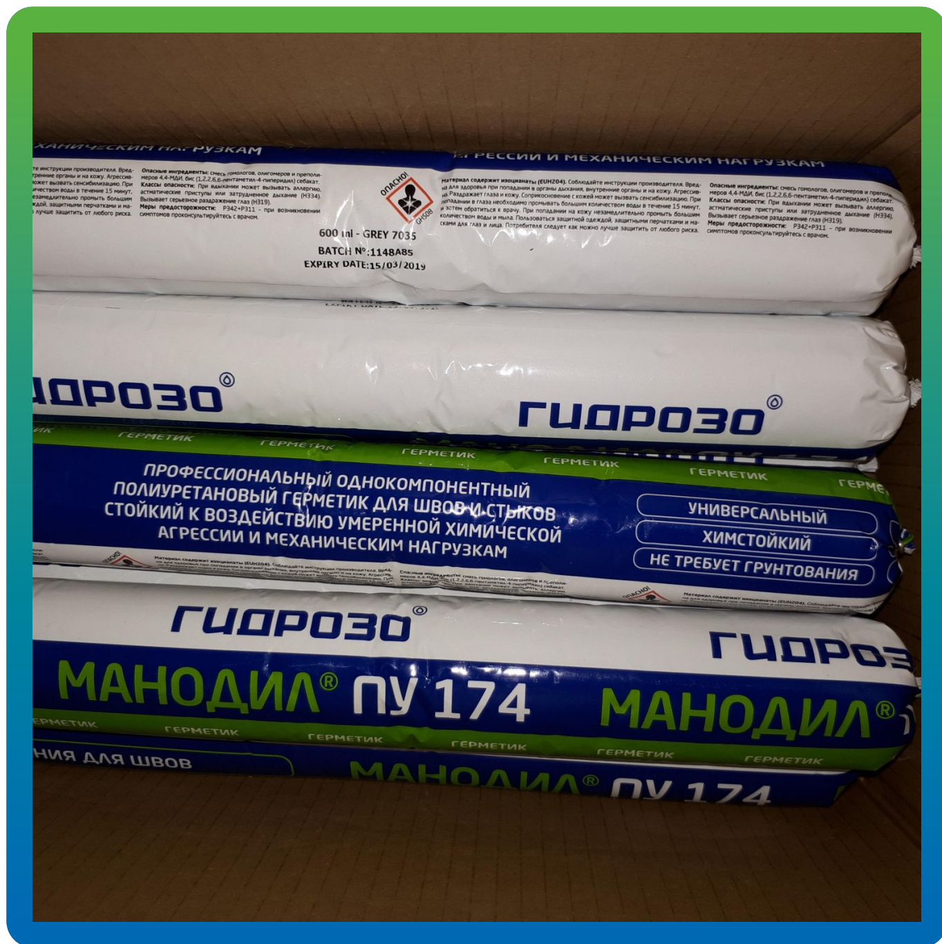
Универсальный полиуретановый герметик Манодил ПУ 174