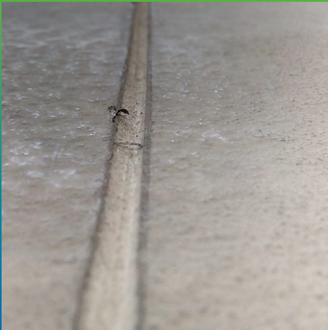
Финишный вид заполненного шва