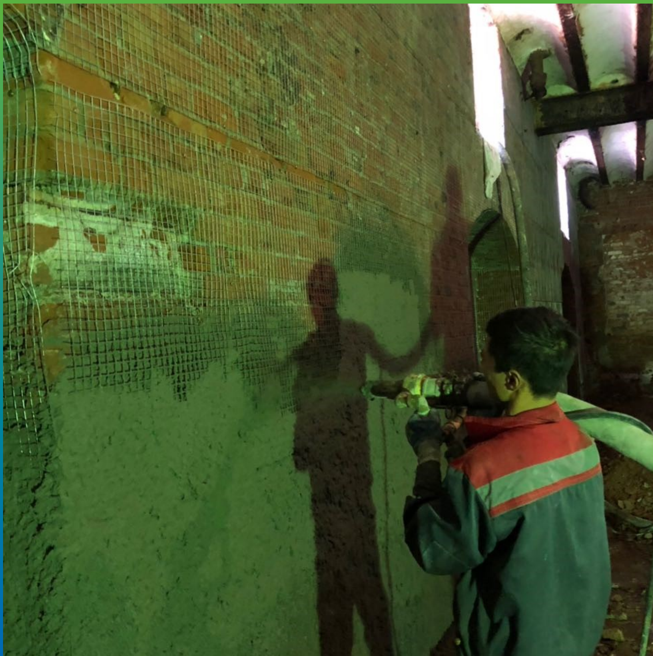
Нанесение Стармекс ТМ6