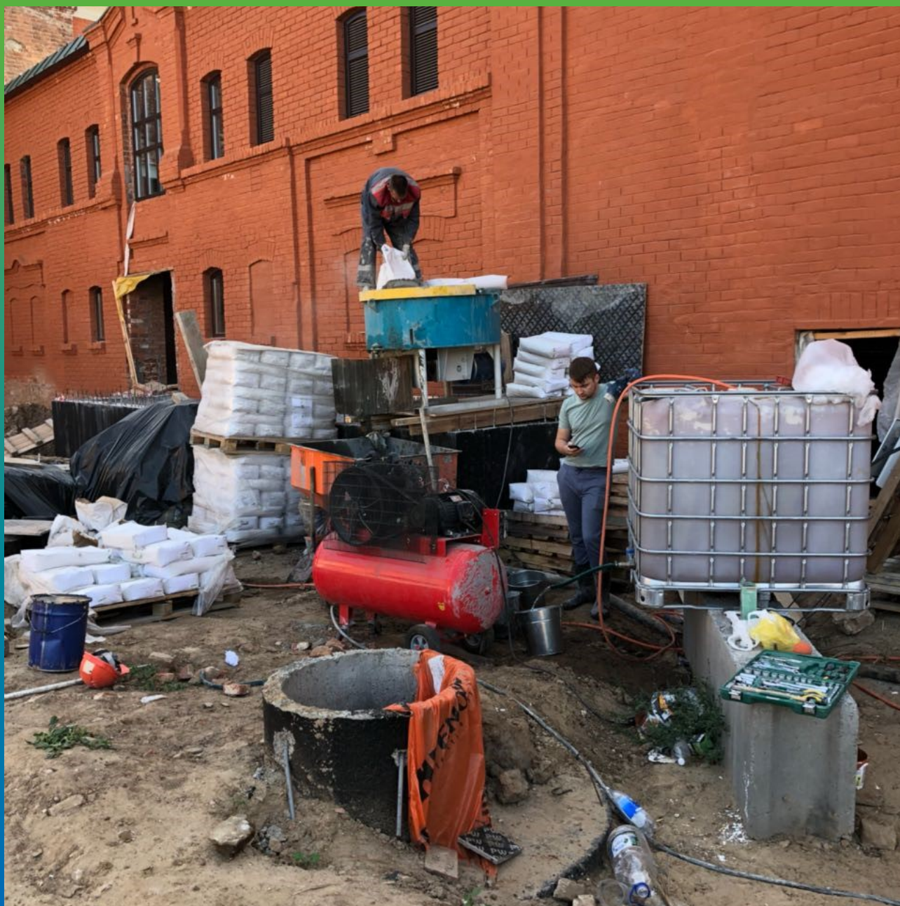
Замес состава для мокрого торкретирования Стармекс ТМ6