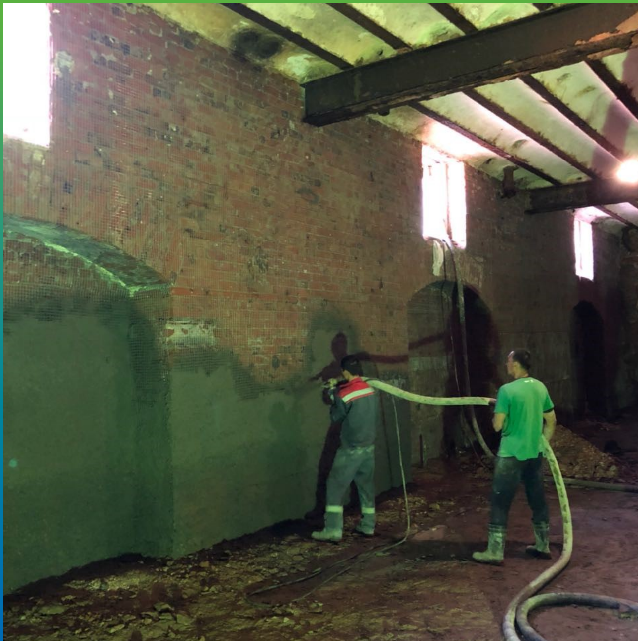
Нанесение Стармекс ТМ6