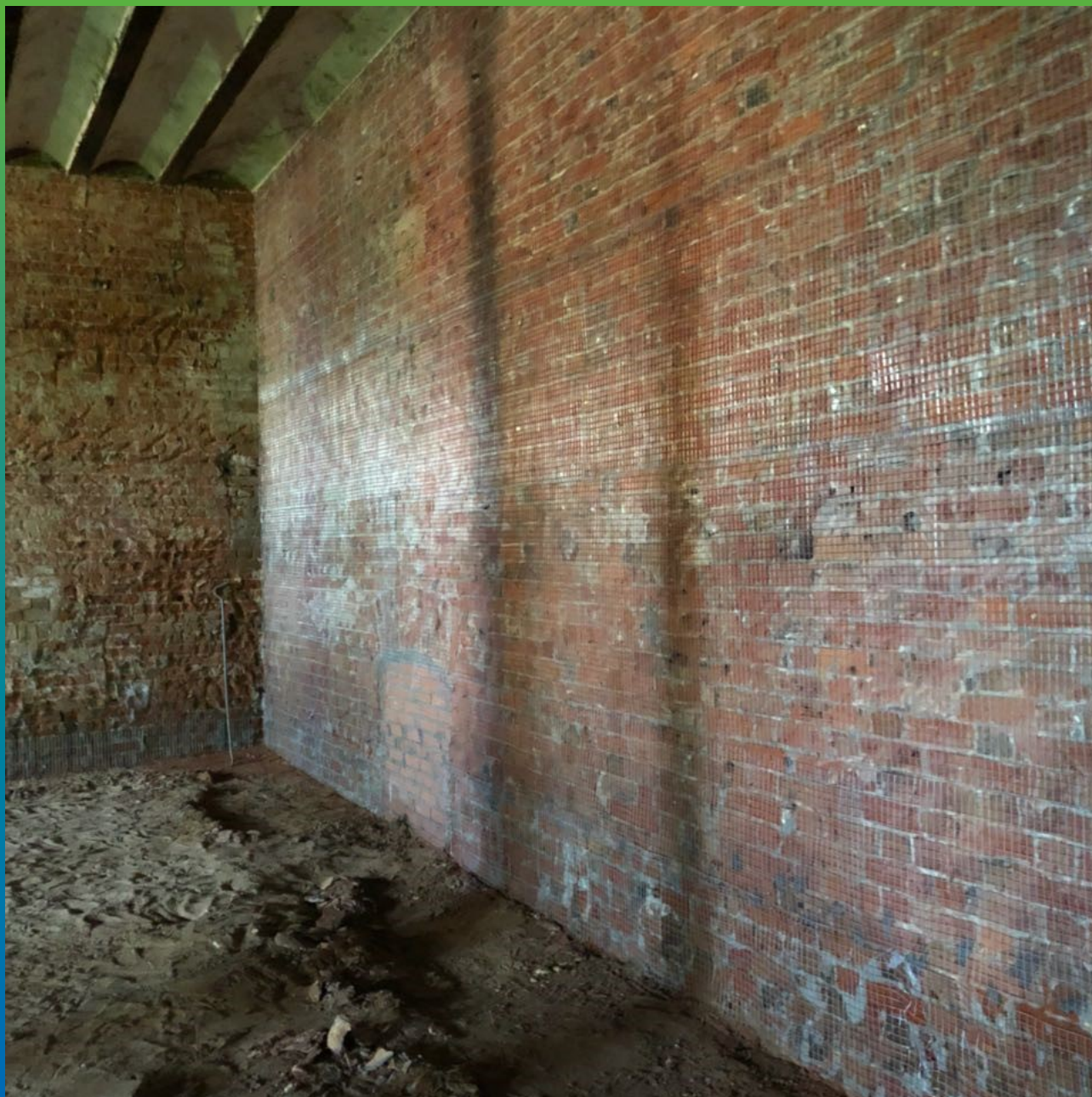
Подготовка стен к нанесению ремонтного состава механическим способом