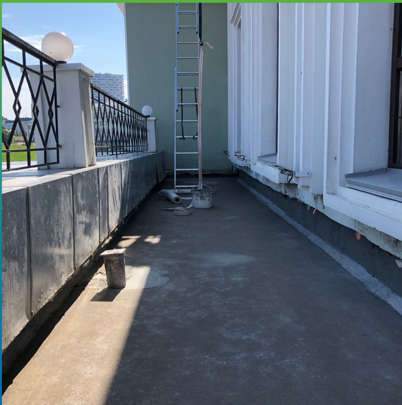
Подготовка поверхности к нанесению гидроизоляционного состава, устройство галтели