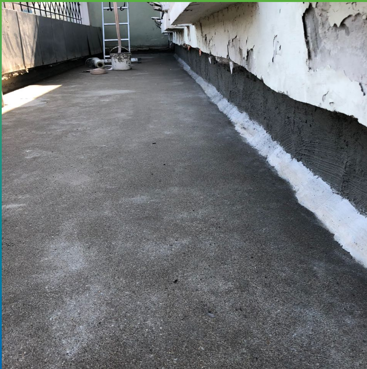
Подготовка поверхности к нанесению гидроизоляционного состава, устройство галтели