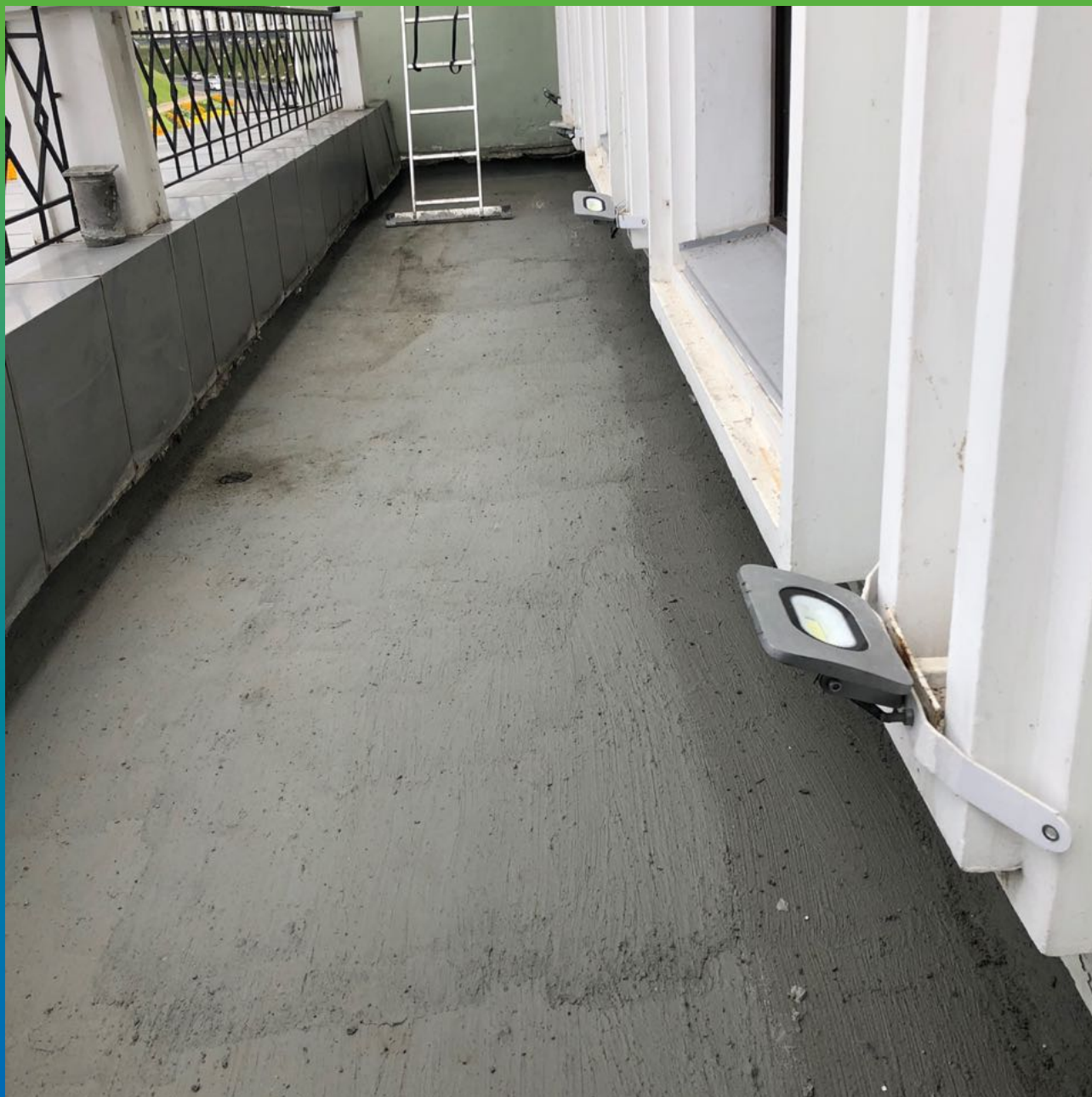
Открытая терраса с нанесенным гидроизоляционным материалом Стармекс Сил