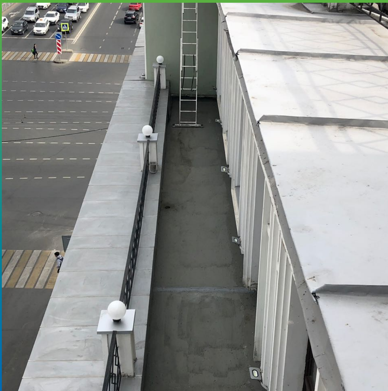
Открытая терраса с нанесенным гидроизоляционным материалом Стармекс Сил