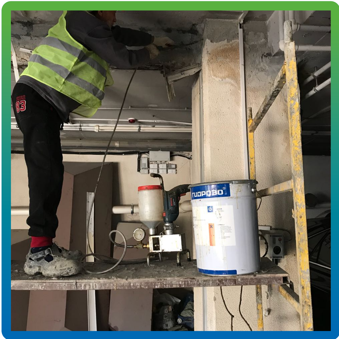
Инъектирование шва полиуретановым гелем Манопур С