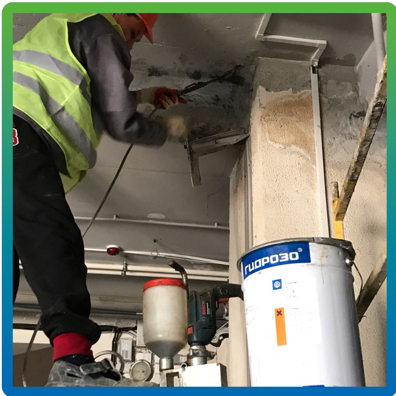
Инъектирование шва полиуретановым гелем Манопур С