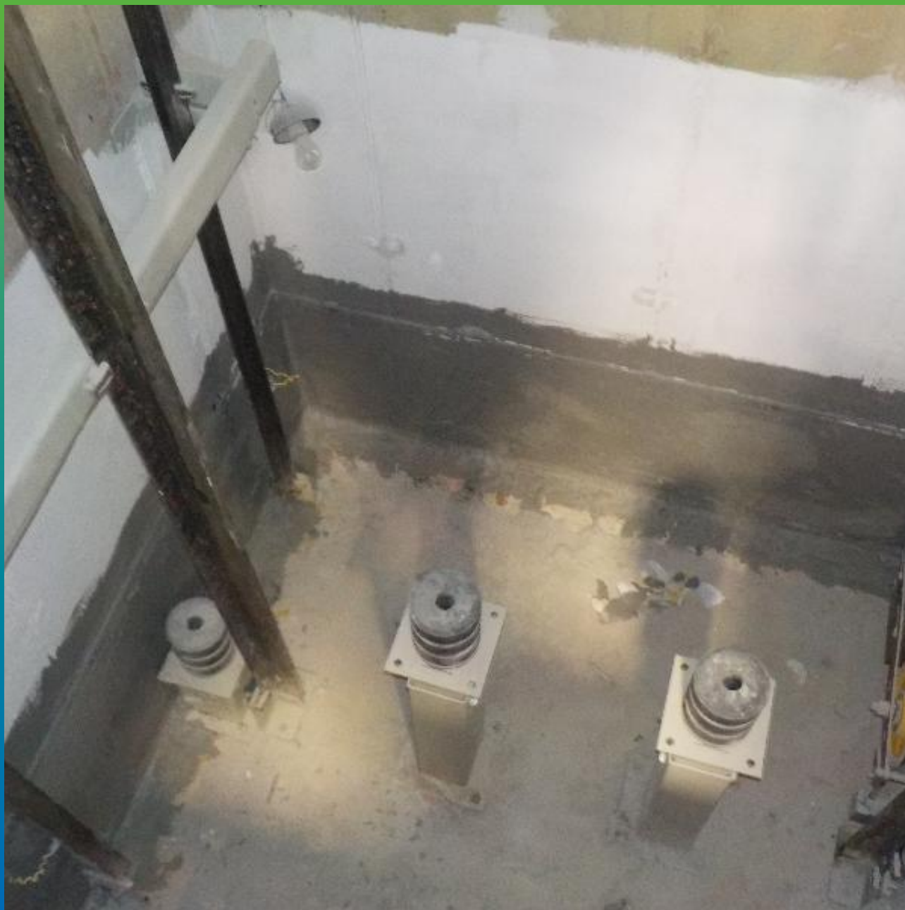
Отремонтированный и гидроизолированный приямок