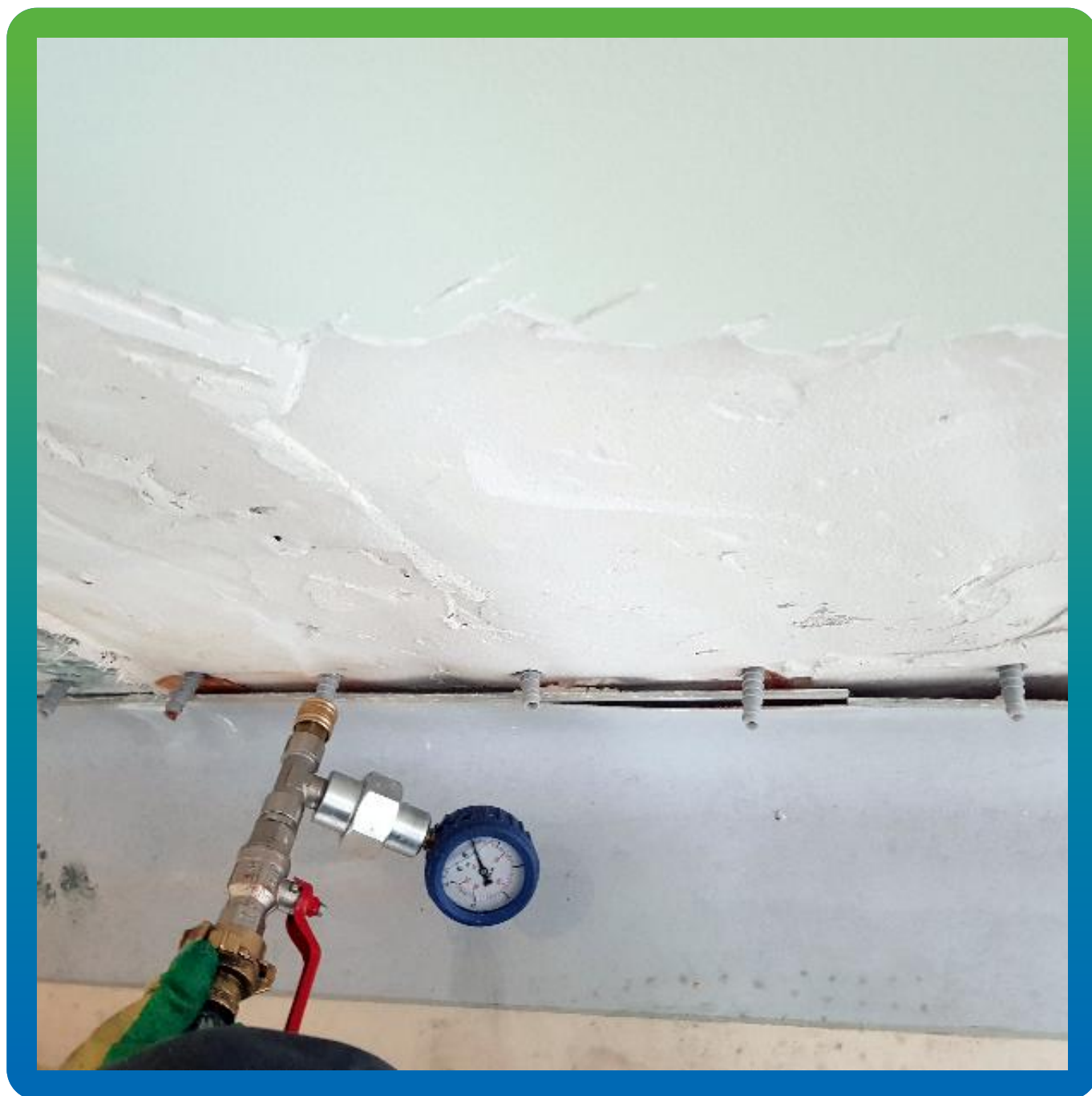
Инъектирование в пластиковые пакеры