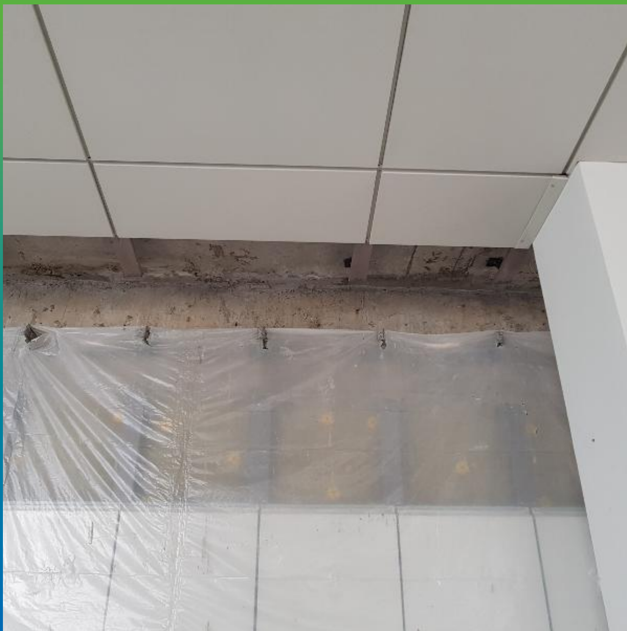
Примыкание плита стена