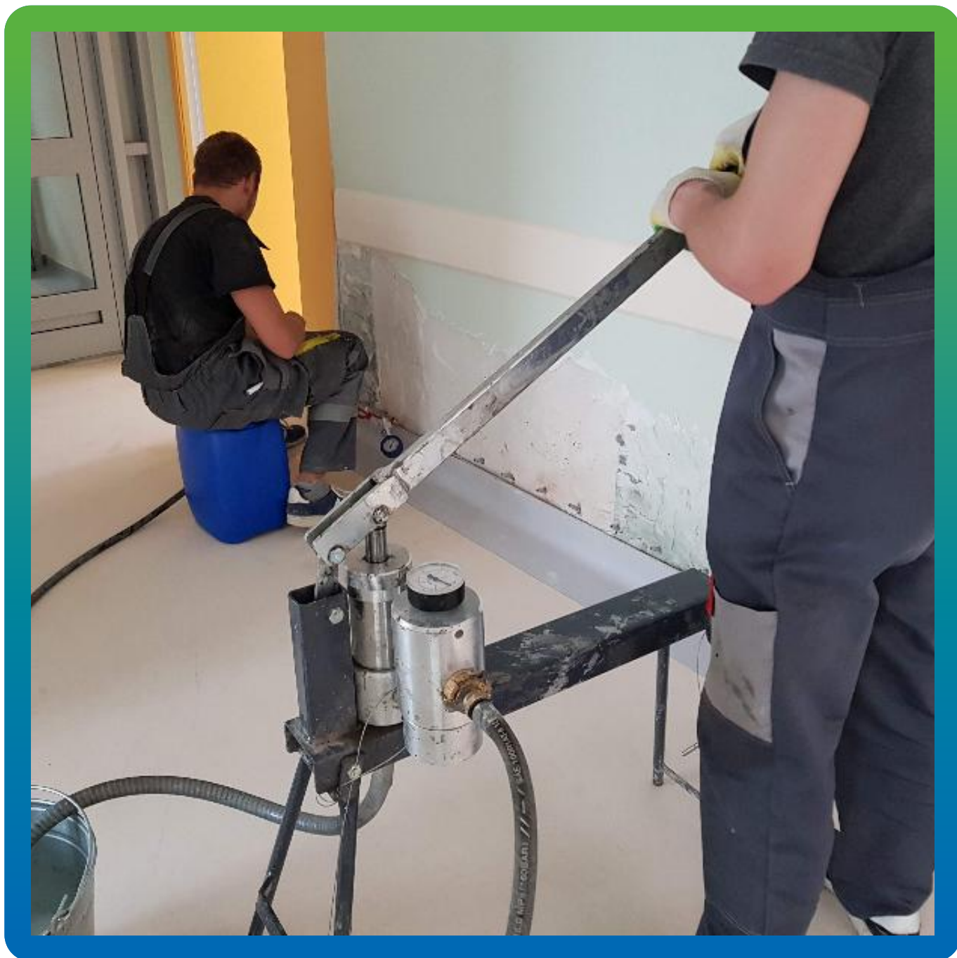
Инъектирование ручным насосом на треноге Манопур С