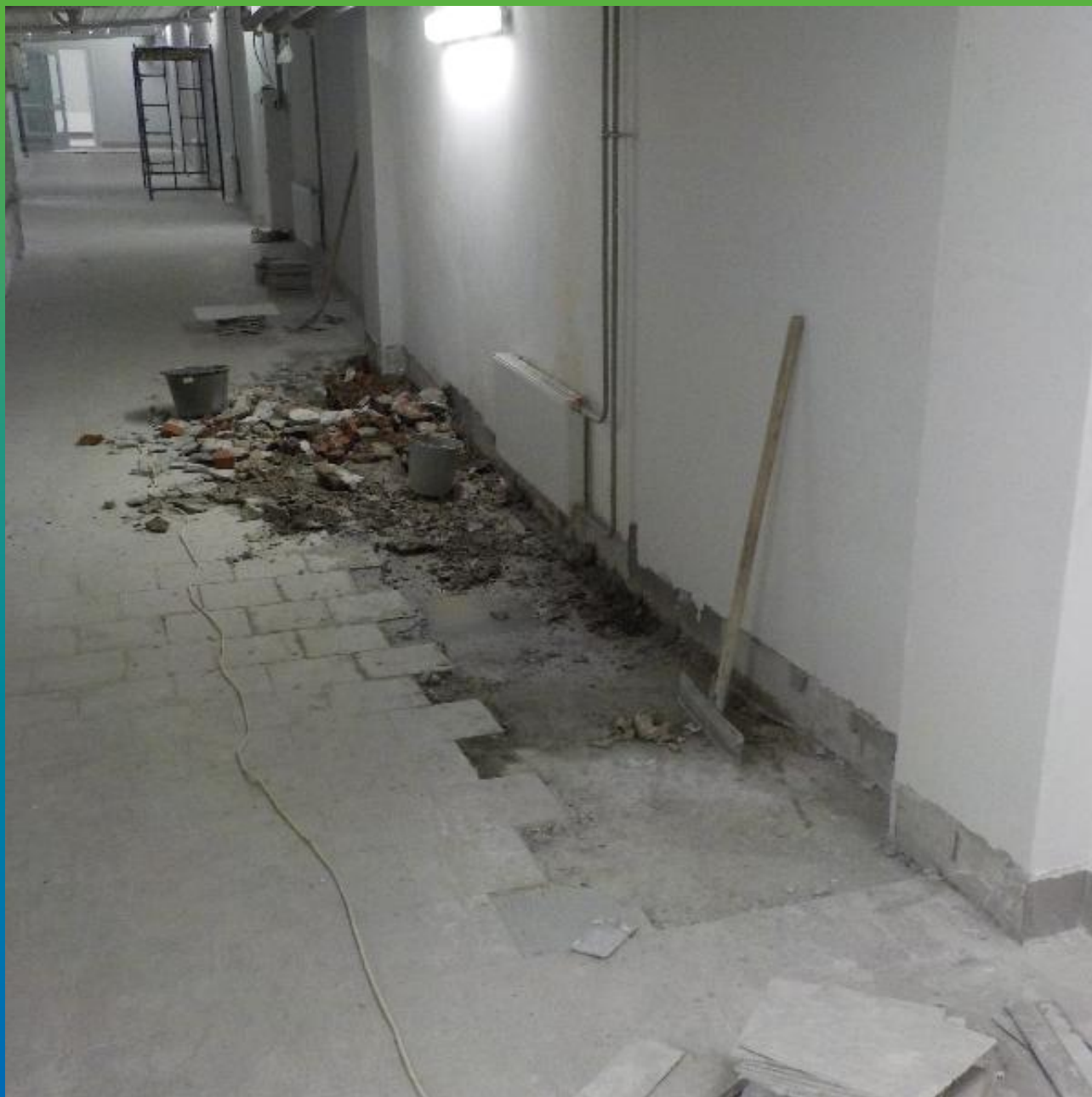
Подготовка примыкания стена пол