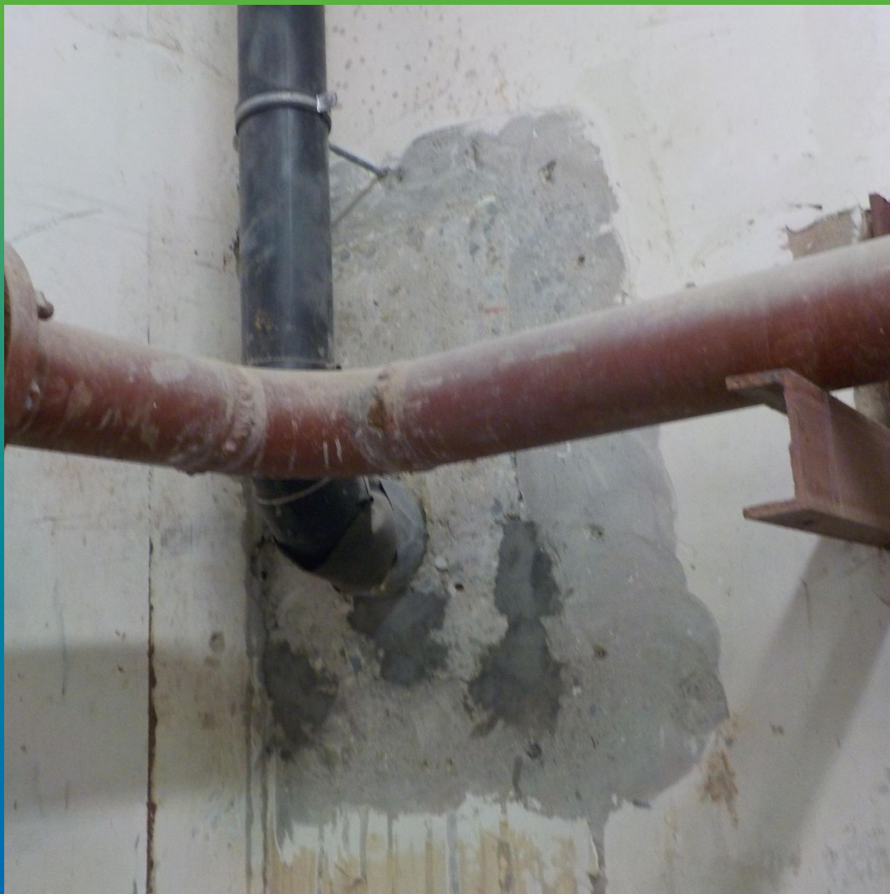
Герметизация входов коммуникаций