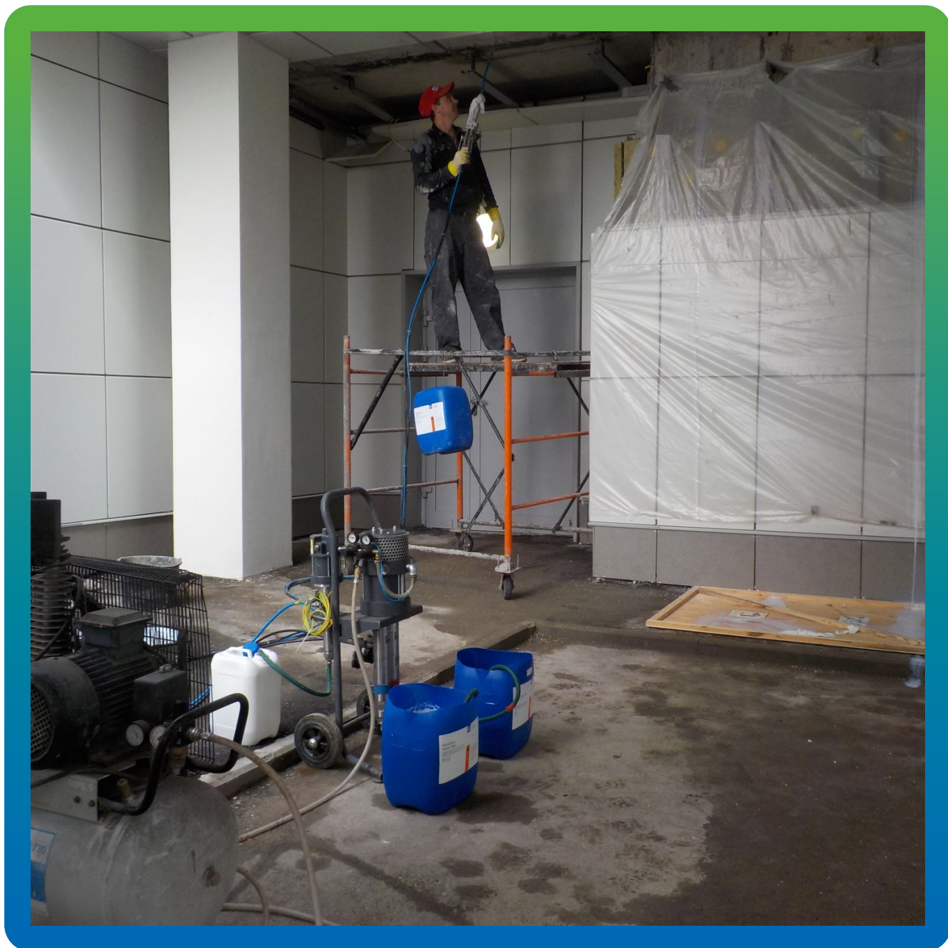
Инъектирование Манокрил Гель В