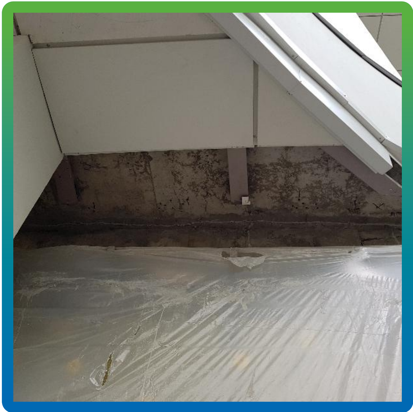
Примыкание плита стена