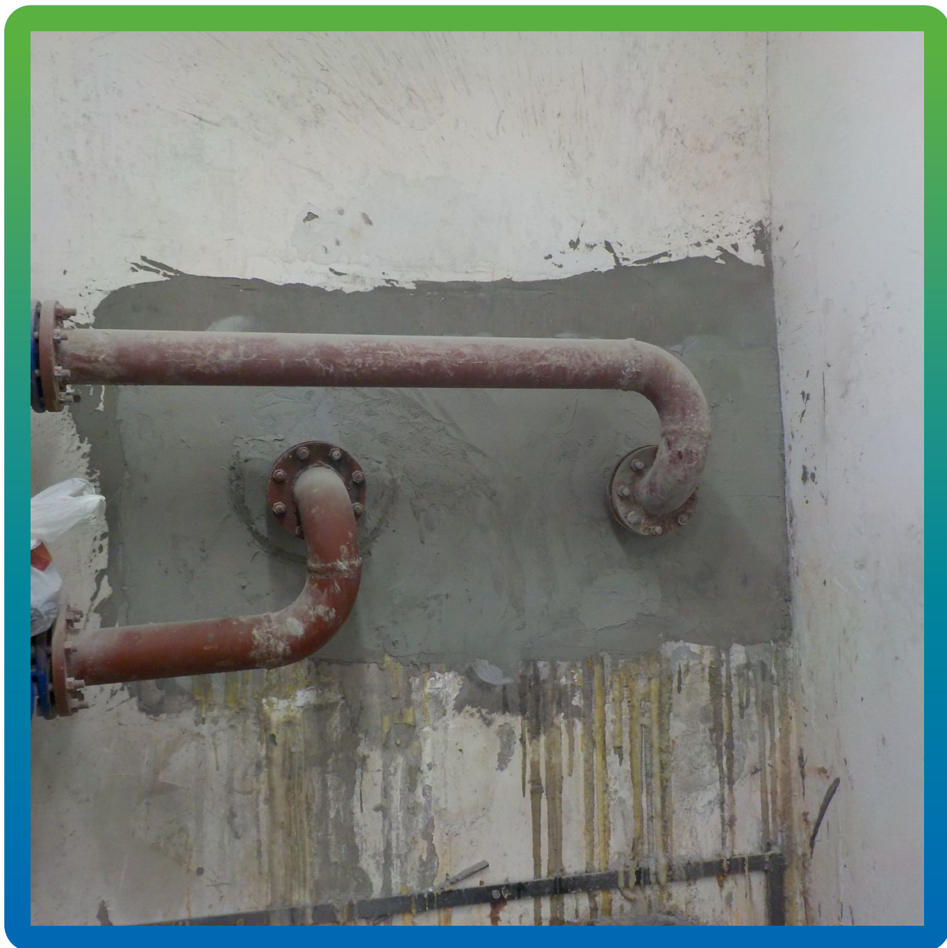
Гидроизоляция вводов коммуникаций