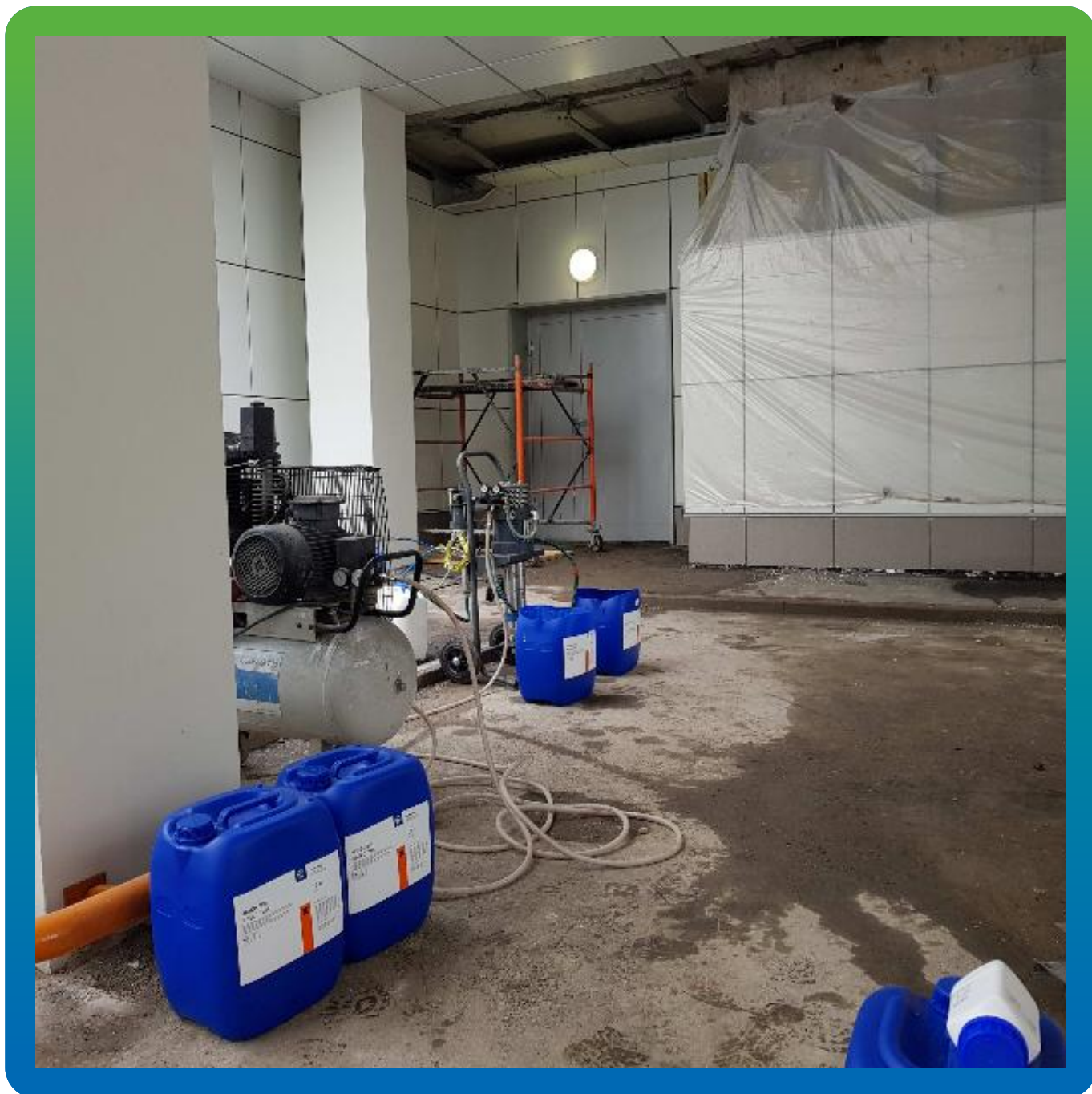
Акрилатные гели на объекте