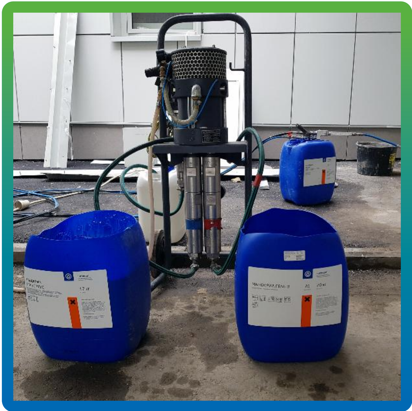
Манокрил Гель В и насос БМ 1425