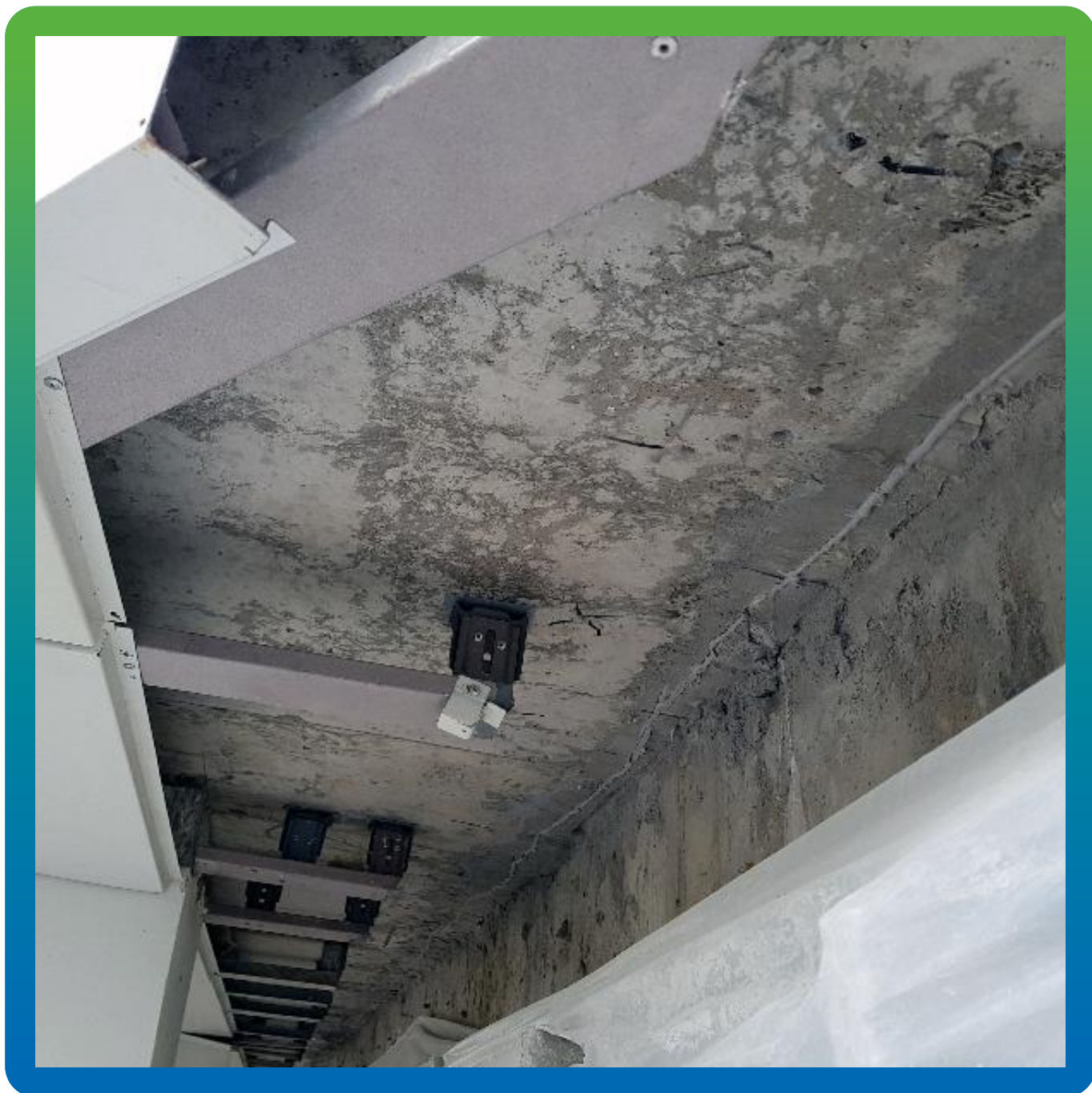
Подготовленная поверхность для инъектирования