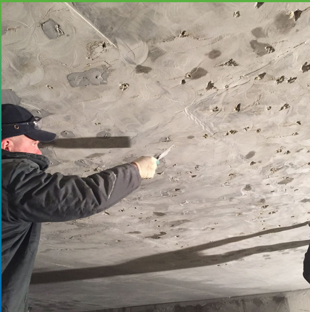
Подготовка поверхности плиты перекрытия