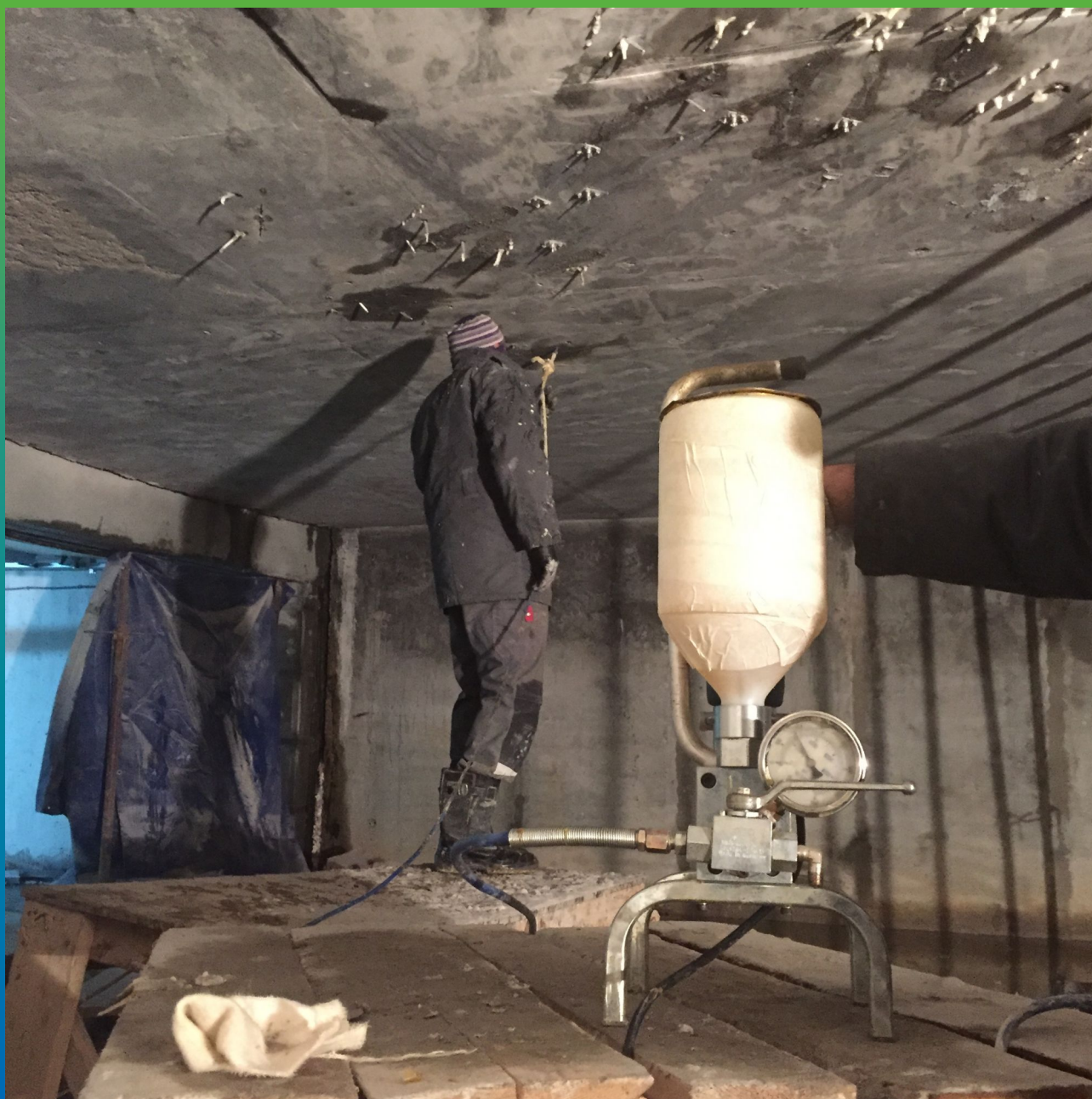
Инъектирование плиты перекрытия насосом БМ 0401