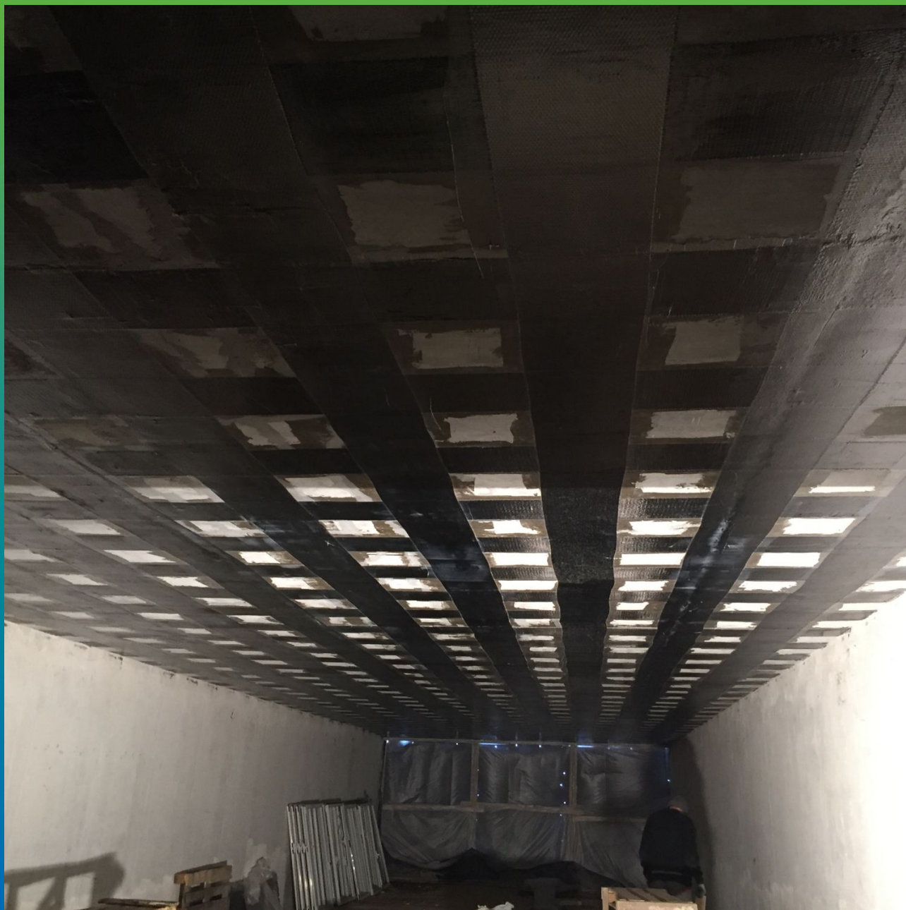
Усиленная плита перекрытия