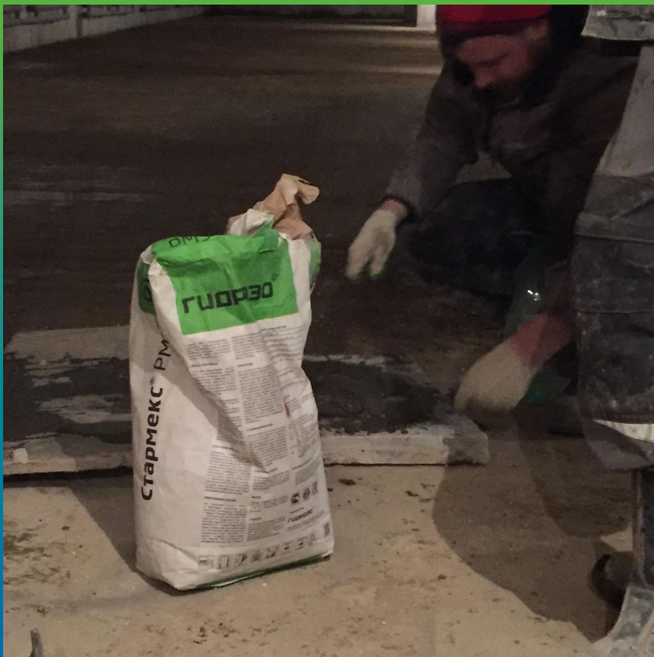
Ремонтный состав Стармекс РМ3