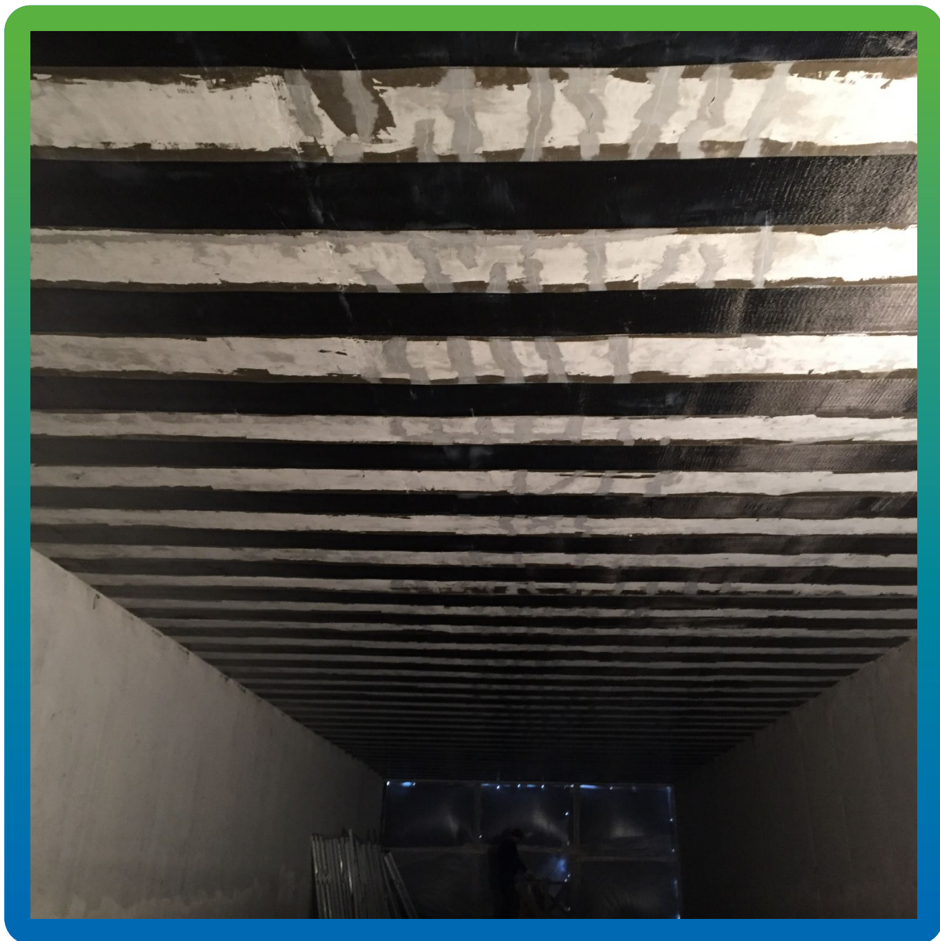
Усиление плиты перекрытия