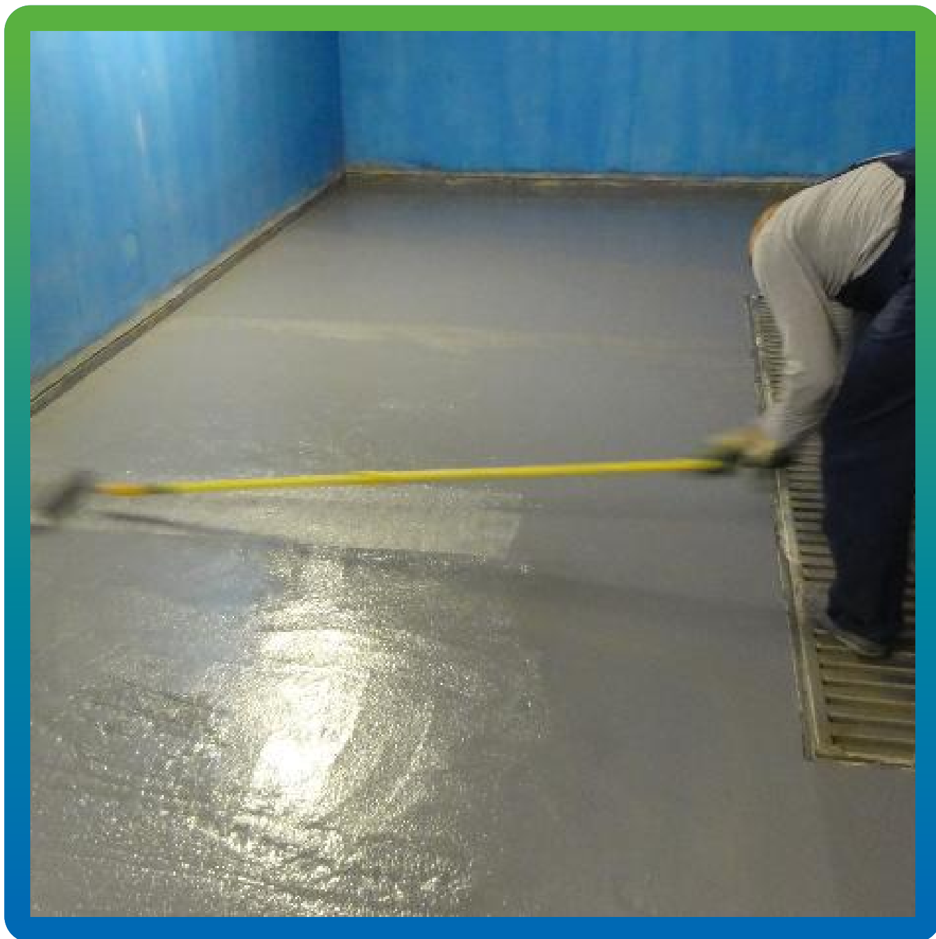
Прокатка велюровым валиком