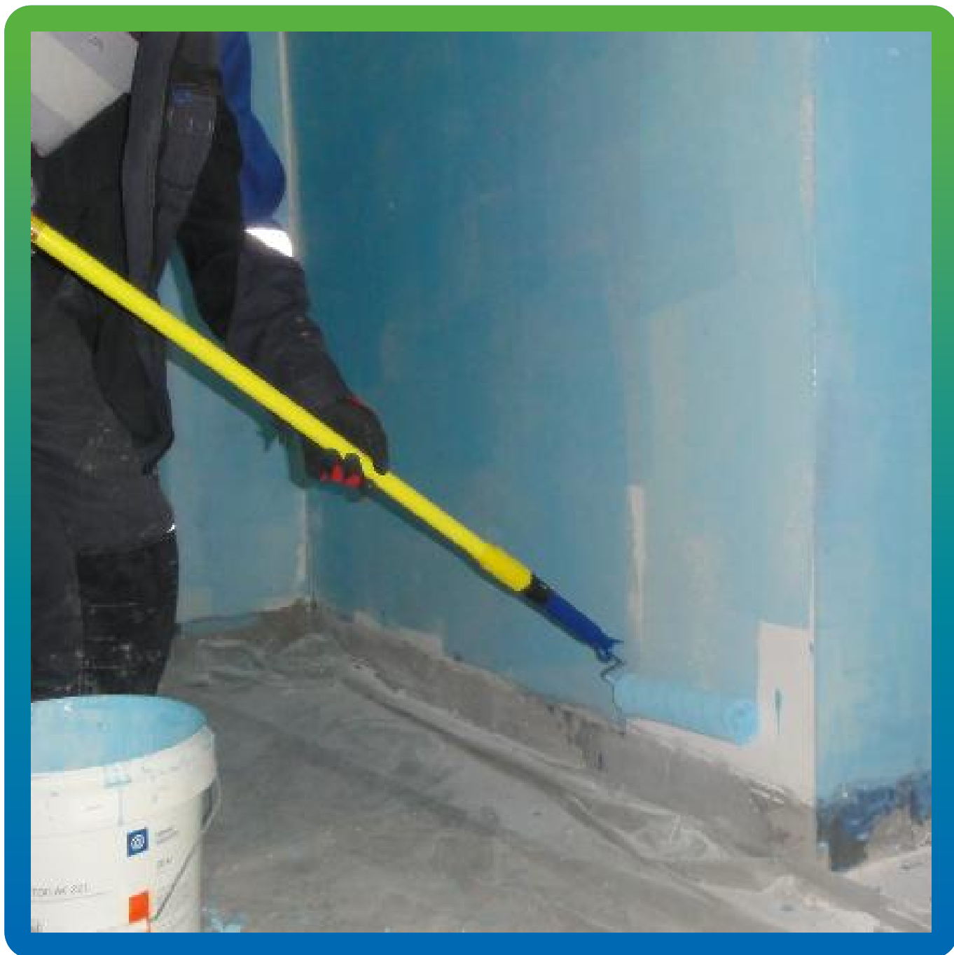
Нанесение ДенсТоп АК 221