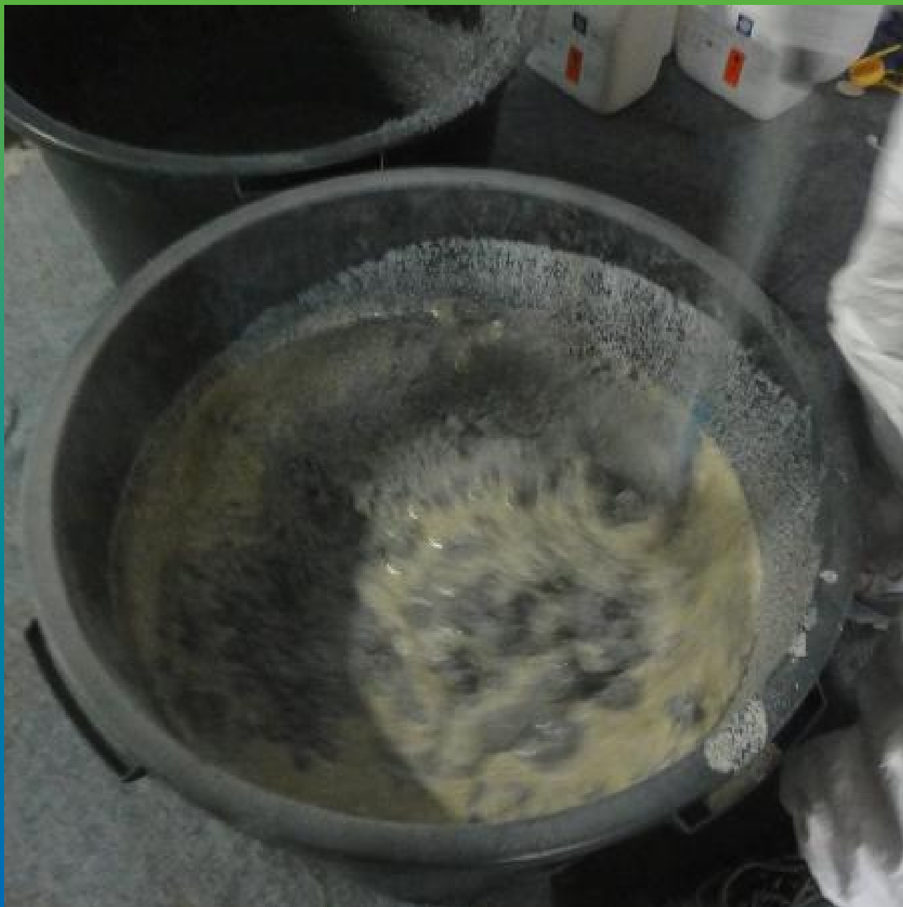
Затворение цемент-полиуретанового покрытия ДенсТоп ПМ605 Тровел