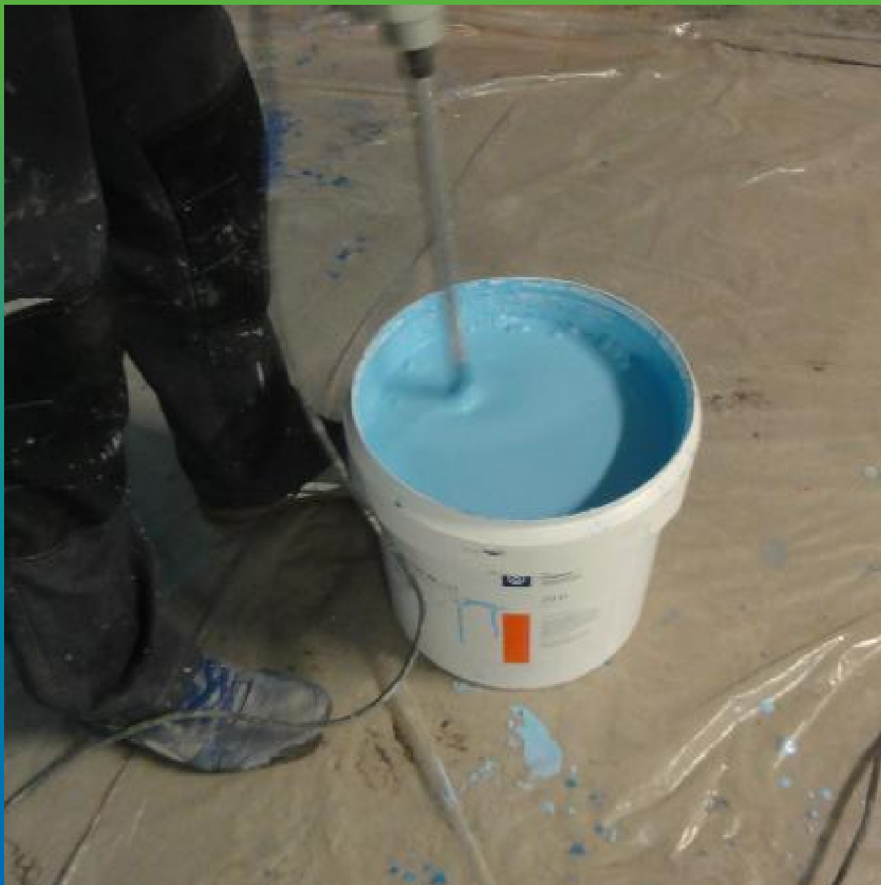
Перемешивание ДенТоп АК 221