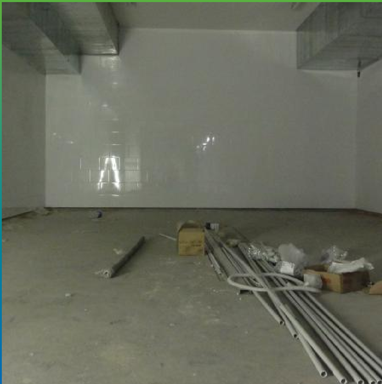
Финальный вид объекта