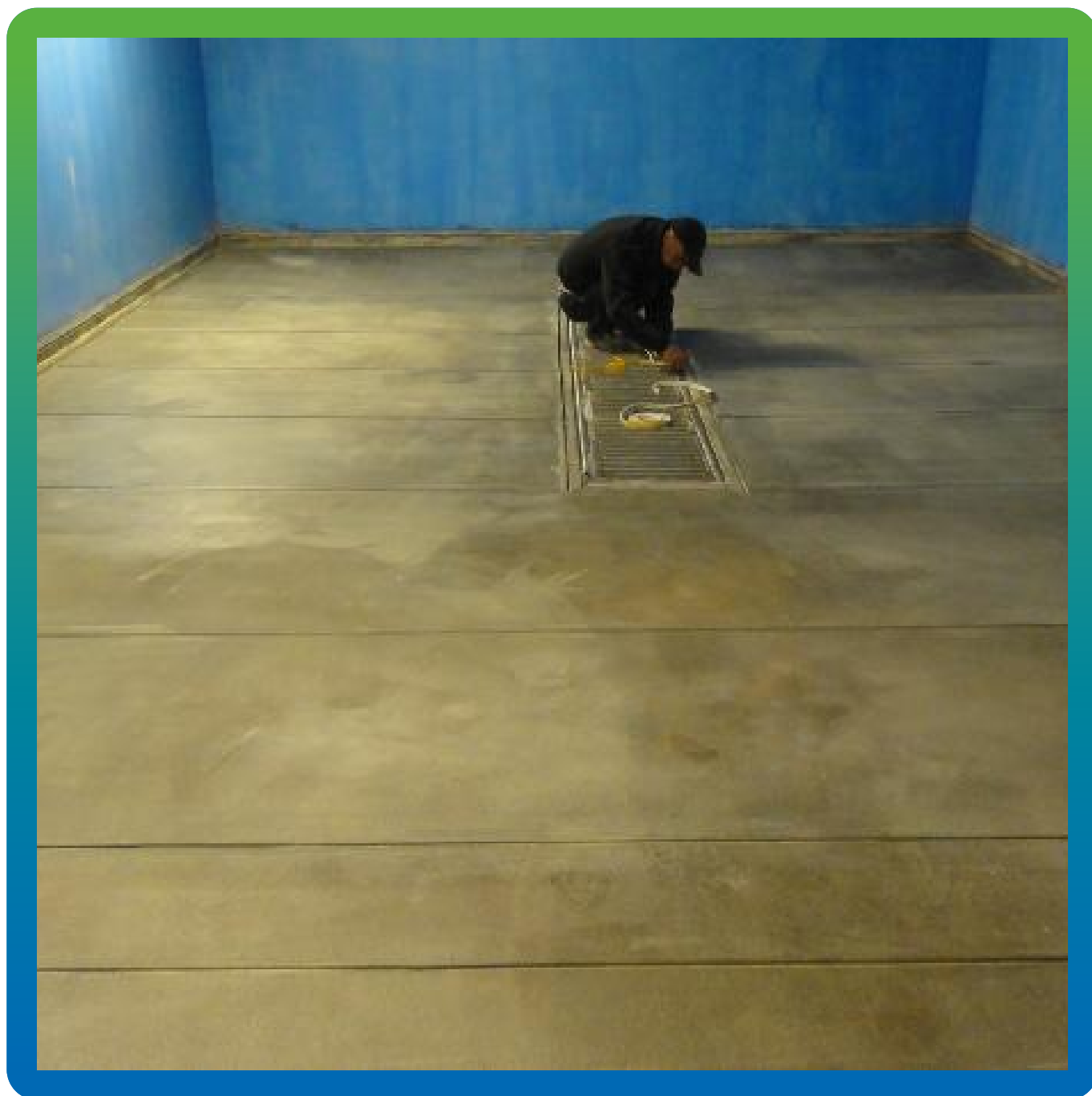
Укладка разделительного слоя из Вилотерма