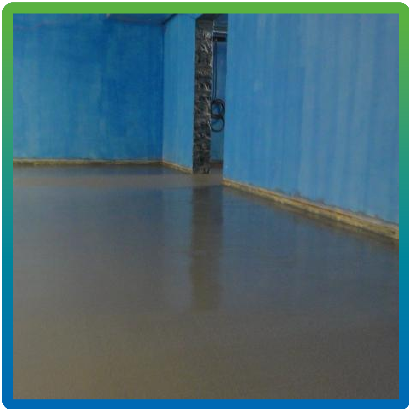
Вид уложенного покрытия ДенТоп ПМ605 Тровел