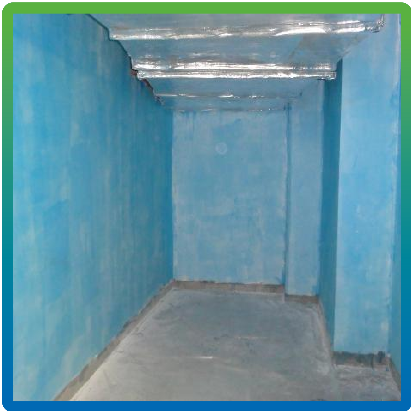
Вид нанесенного материала ДенсТоп Ак 221 в 1 слой