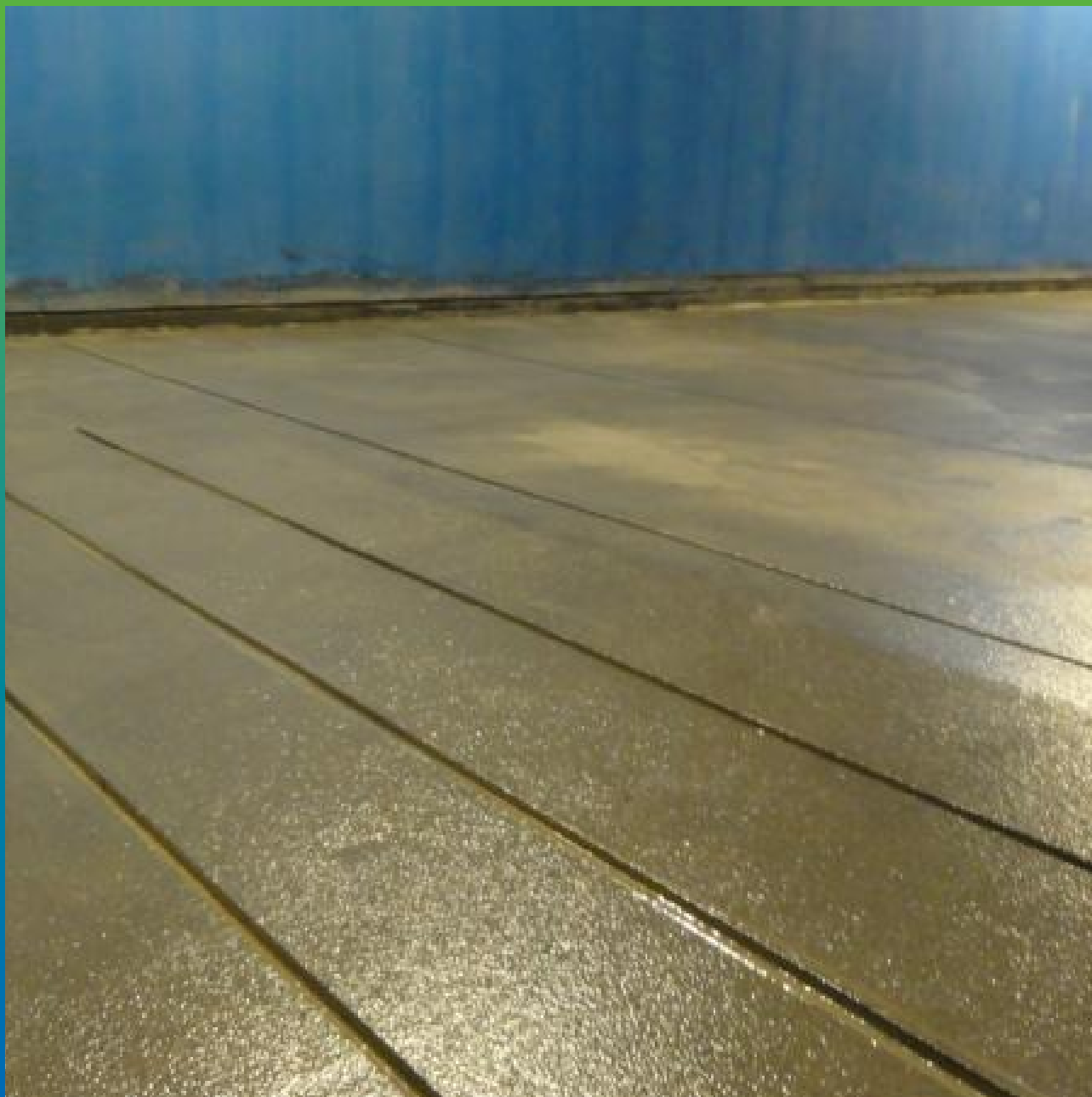
Вид загрунтованного основания с помощью ДенТоп ПМ 600