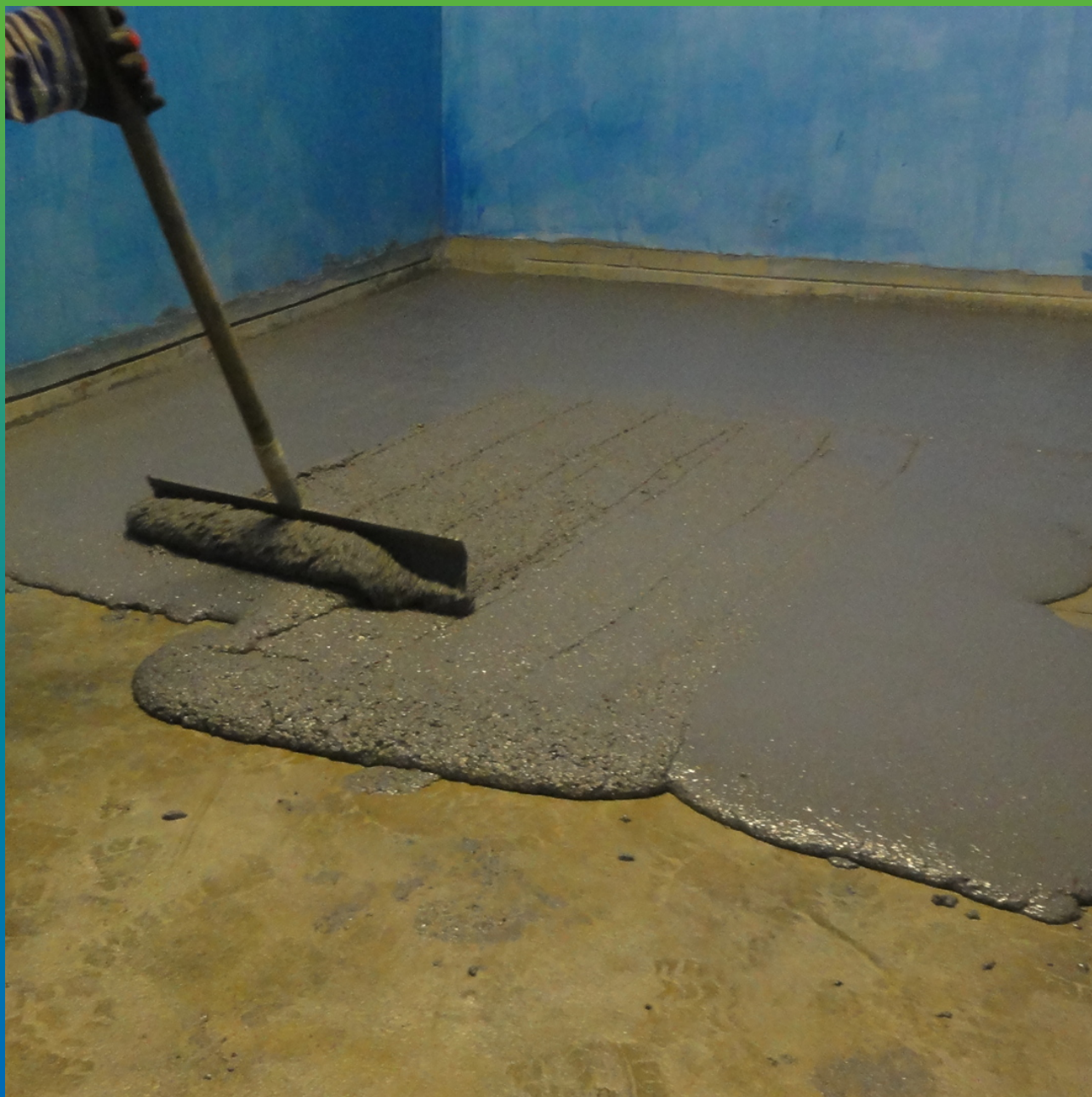
Нанесение ДенсТоп ПМ605 Тровел