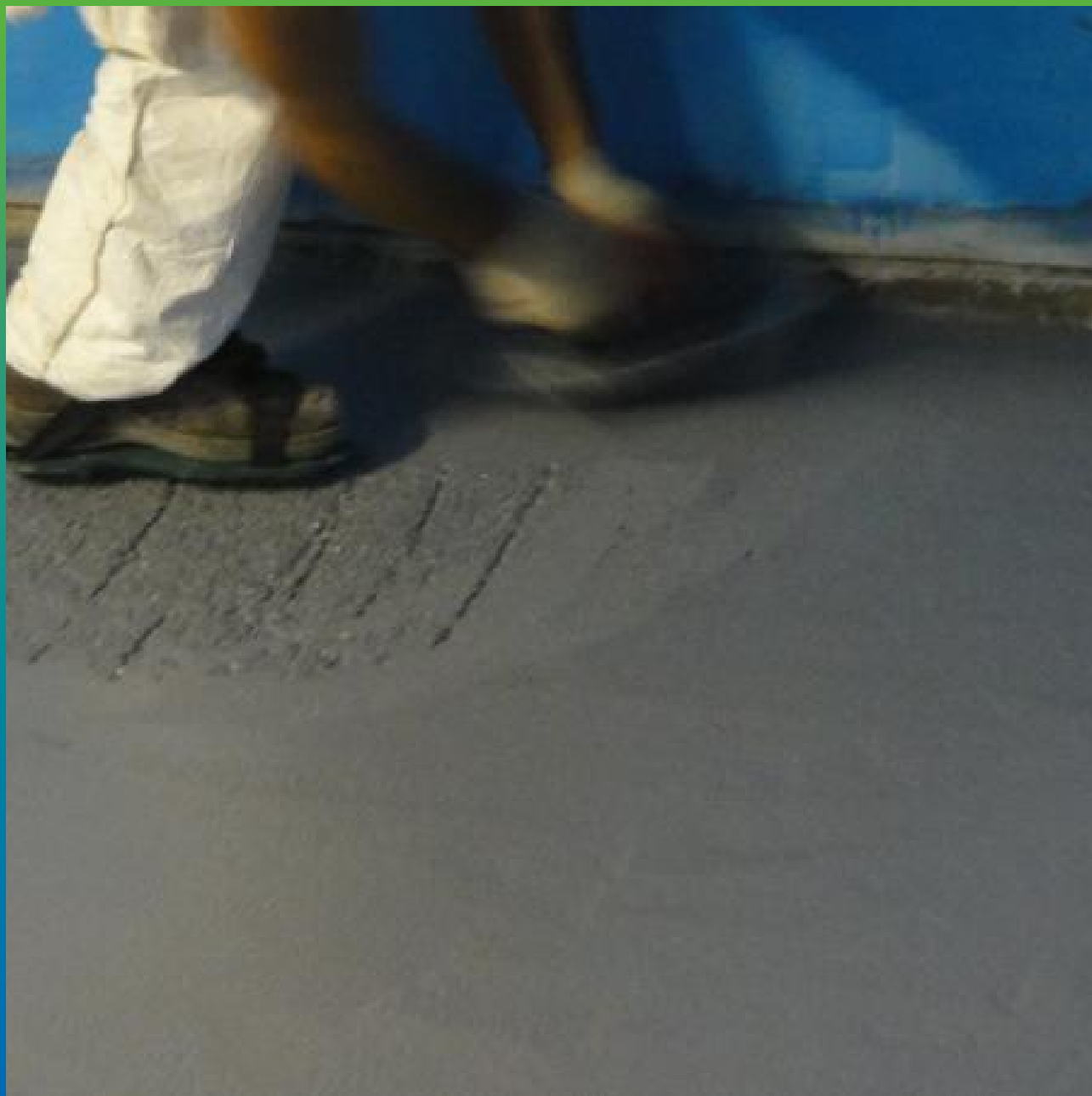
Заглаживание ДенТоп ПМ605 Тровел