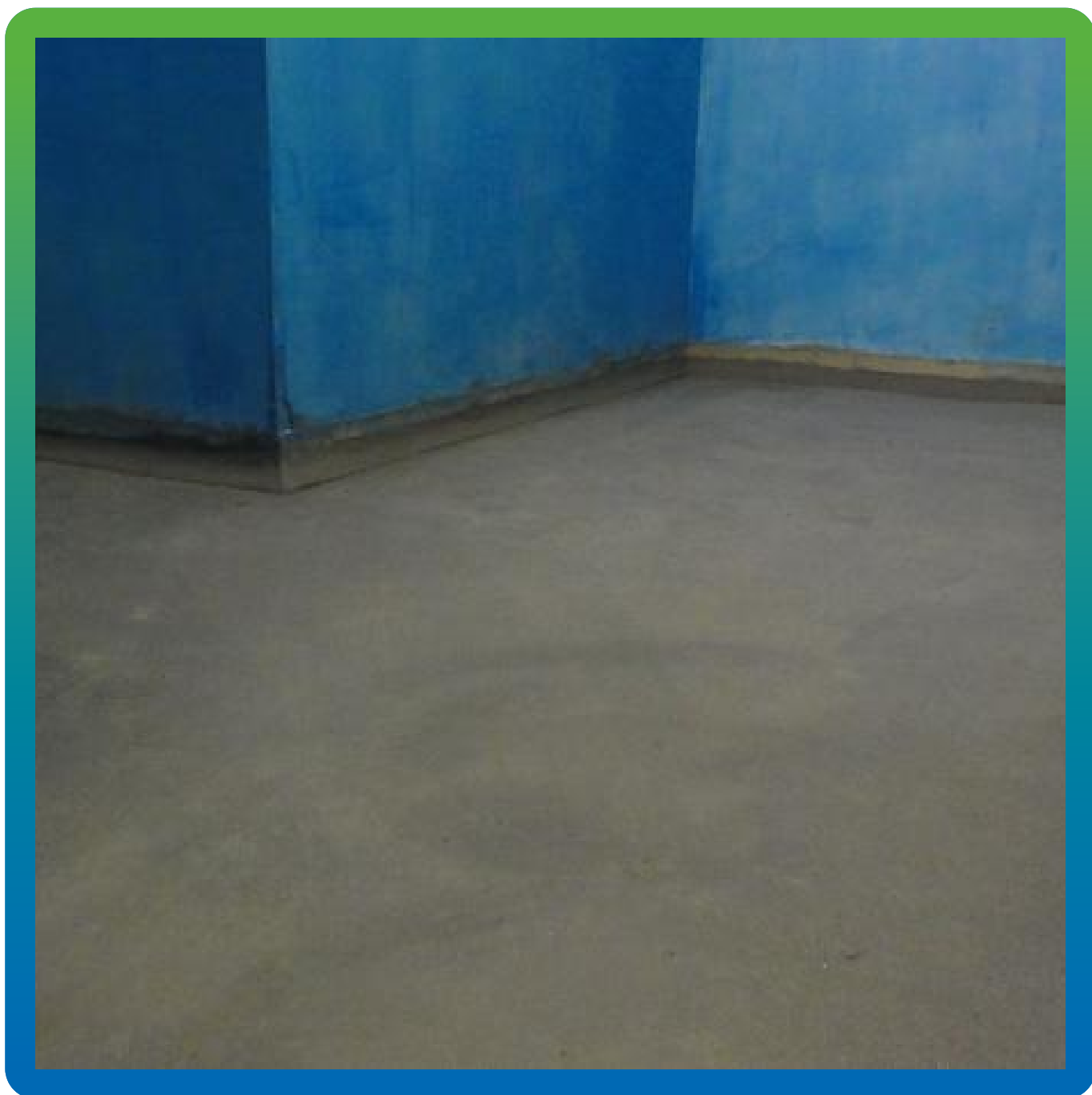
Устройство плинтусов с помощью ДенсТоп ПМ605 ФК