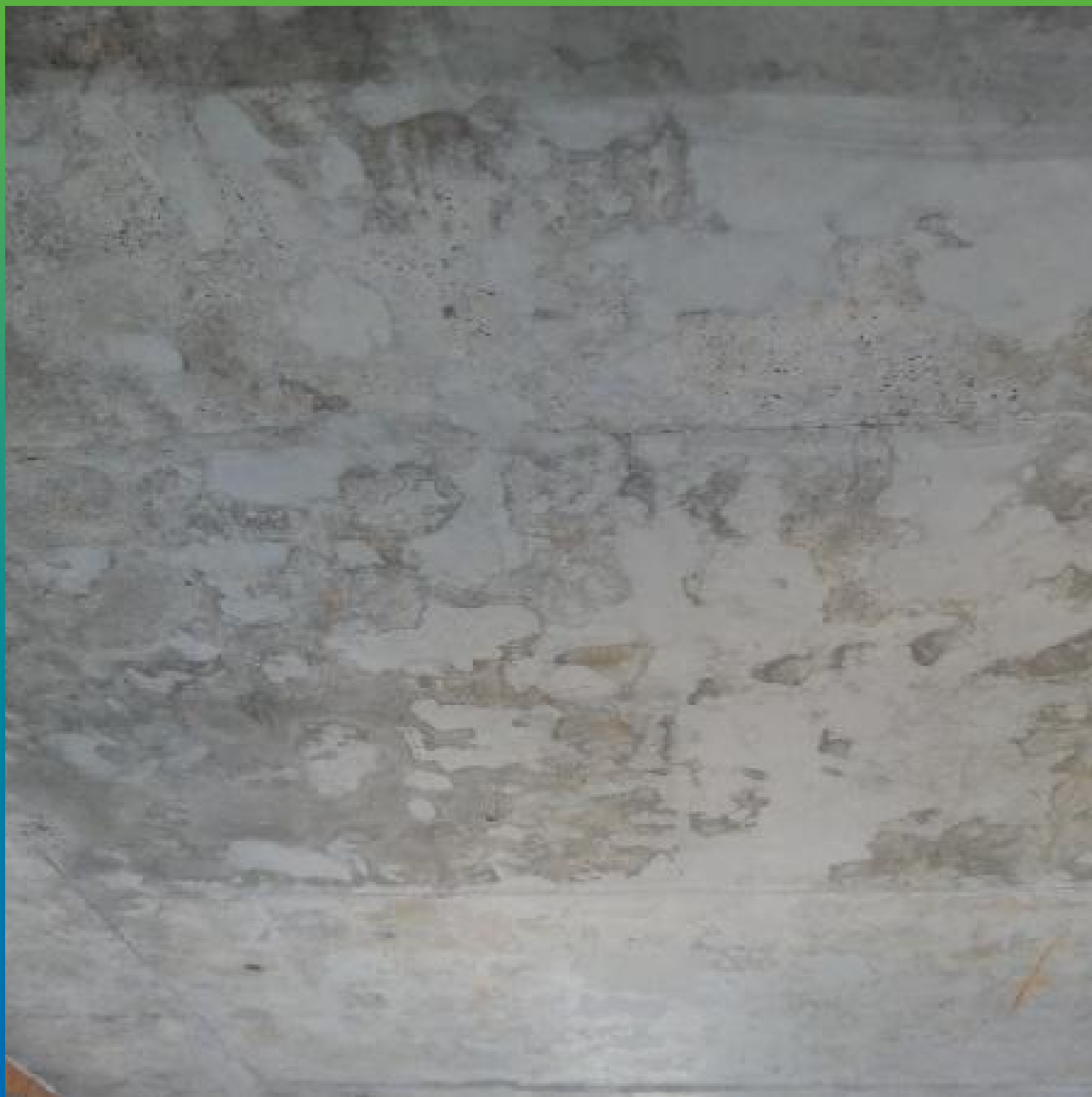
Дефекты на плите перекрытия