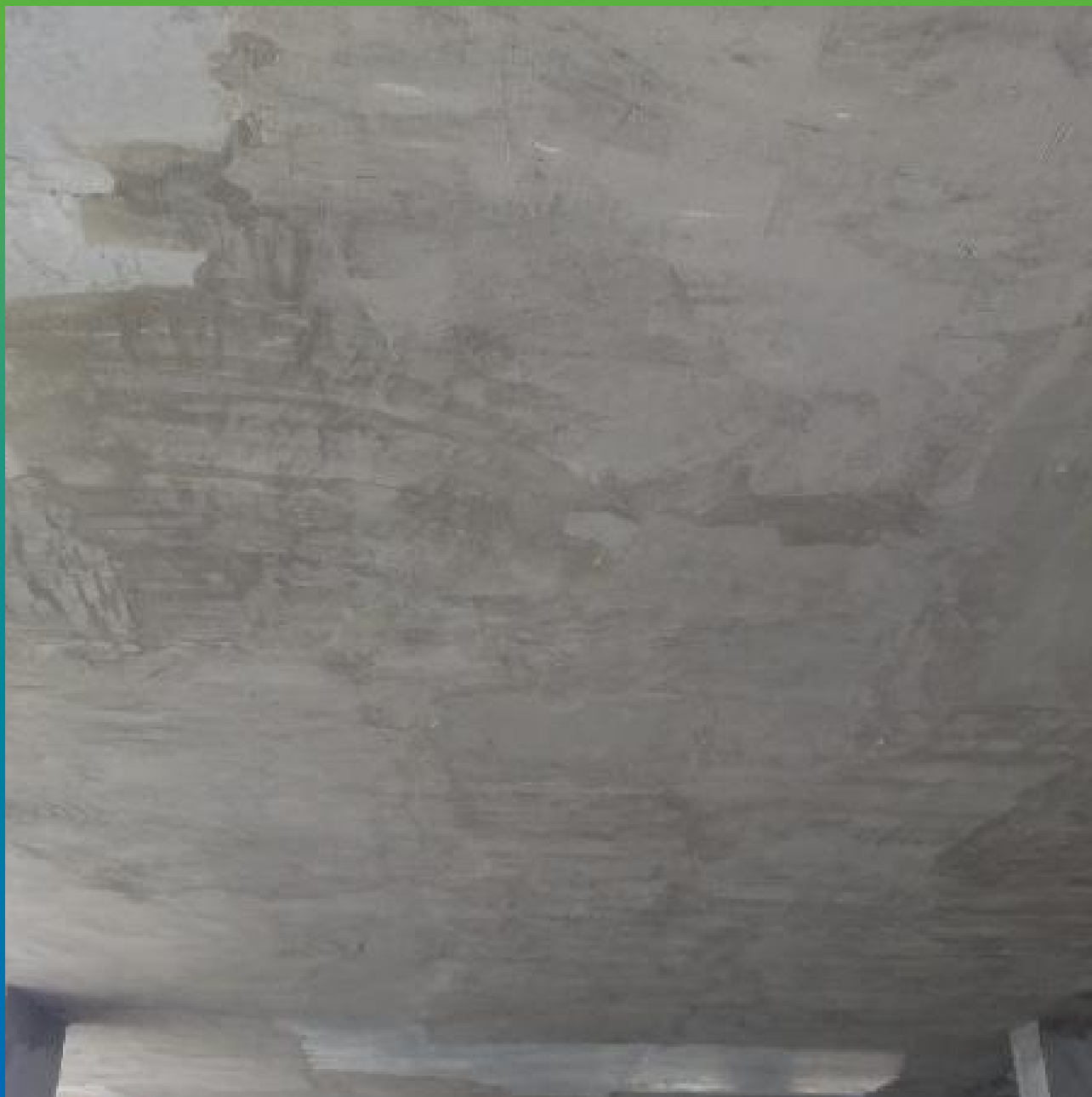
Финальный вид поверхности