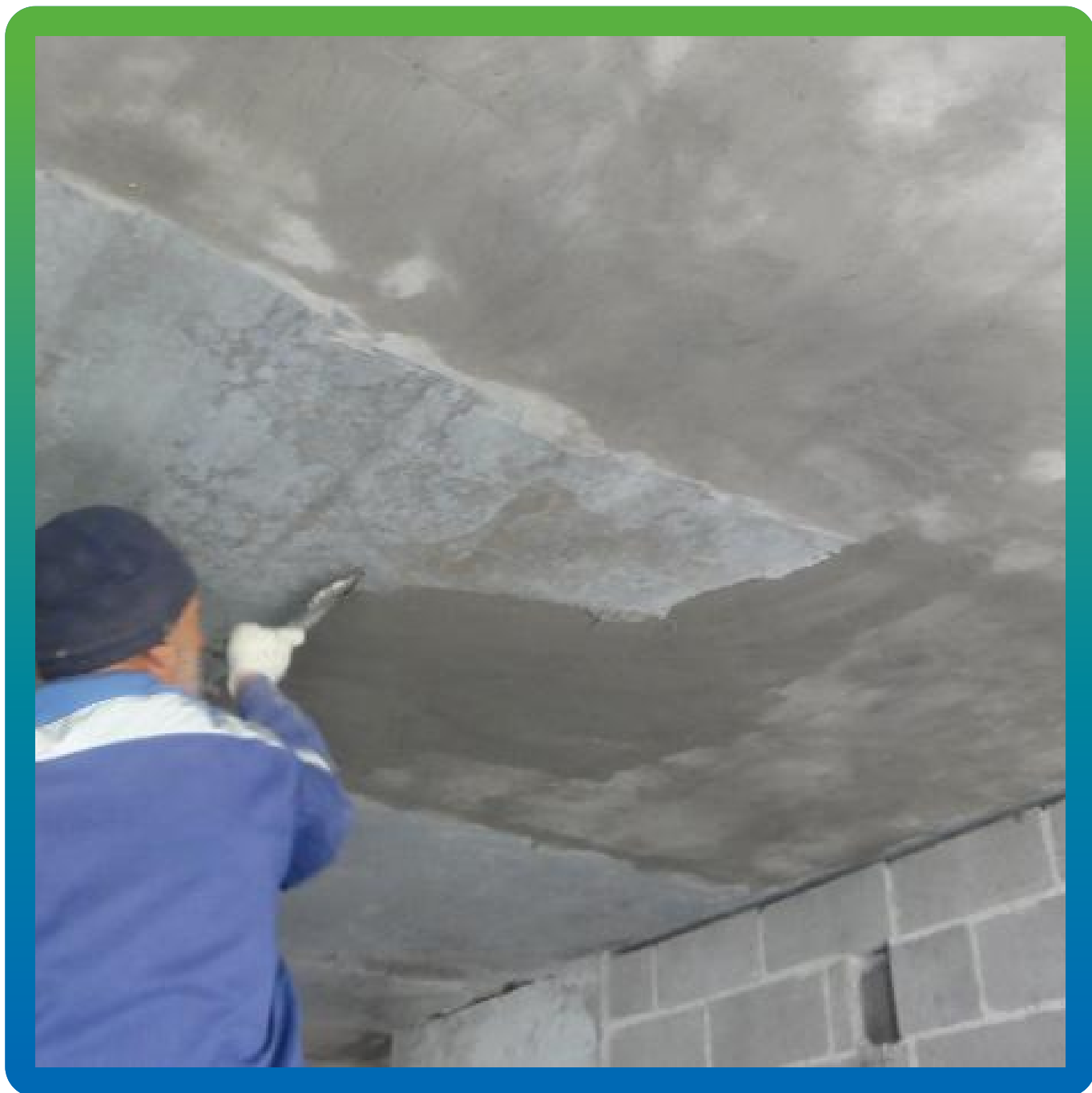
Нанесение Стармекс PM2