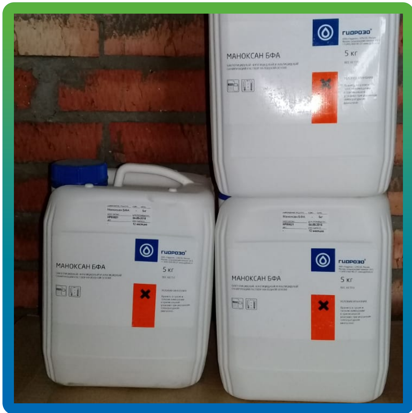
Маноксан БФА на объекте