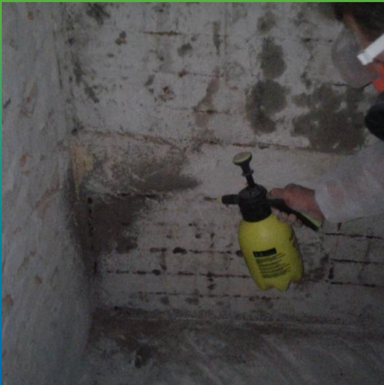
Локальное нанесение Маноксан БФА