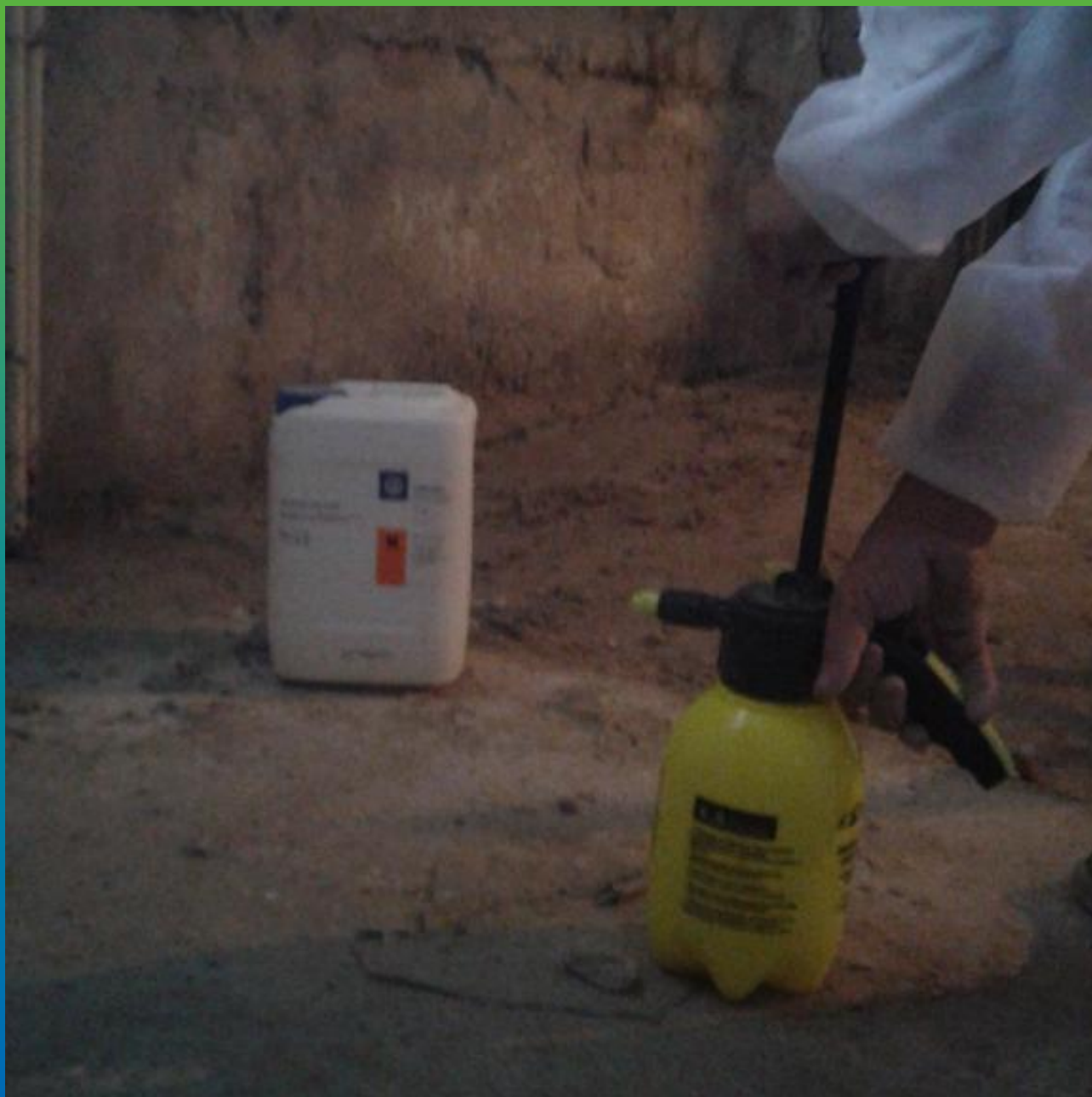
Подготовка к нанесению противогрибкового состава Маноксан БФА