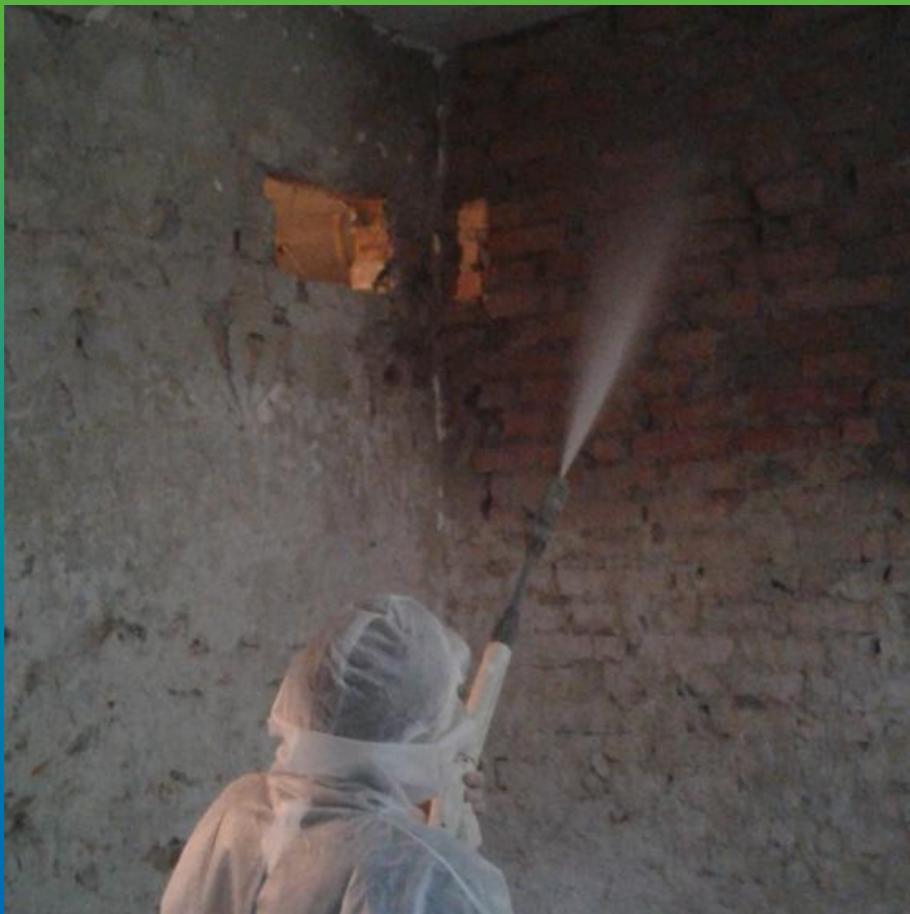
Сплошная обработка стен противогрибковым составом