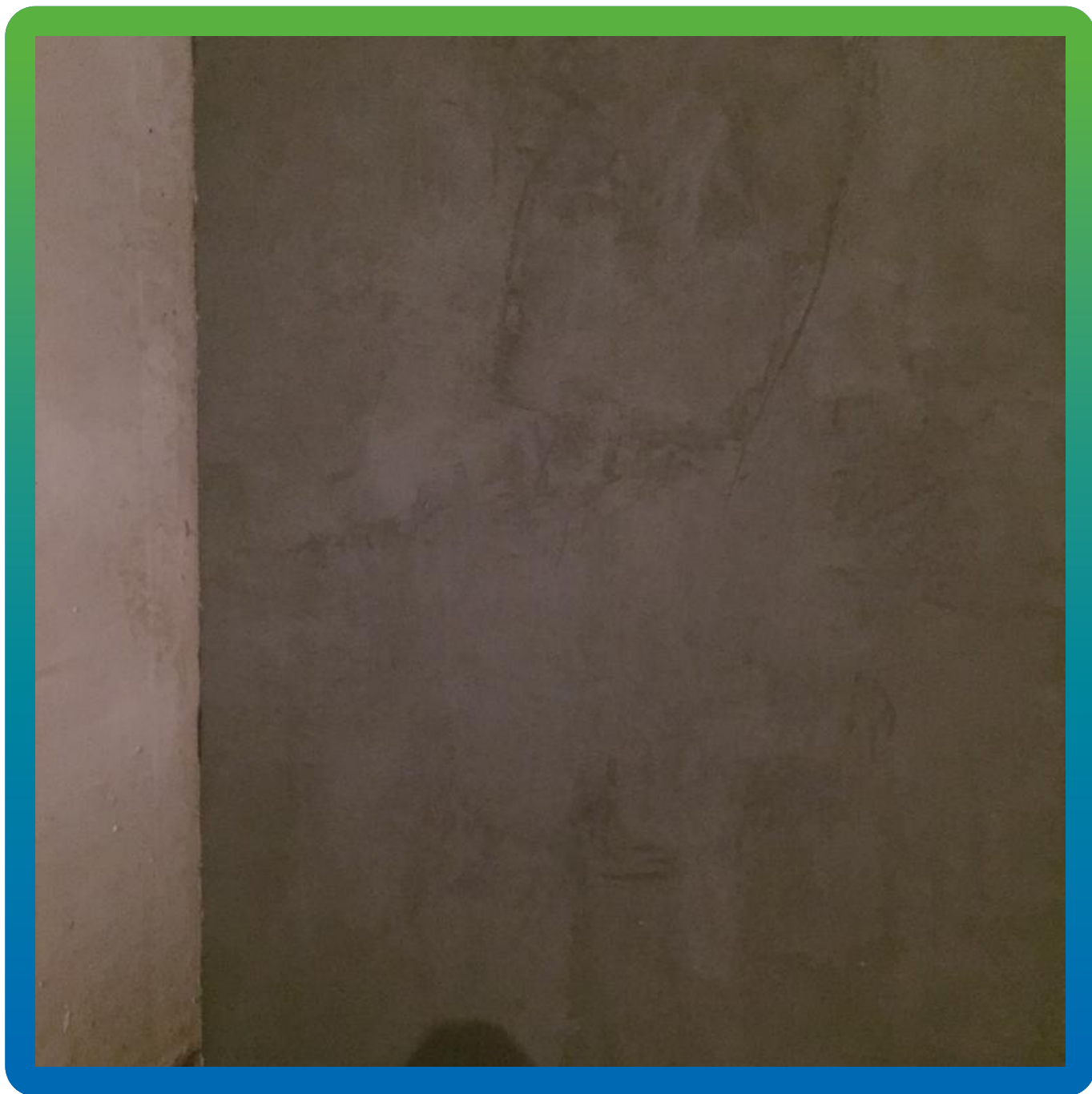
Стена после оштукатуривания ремонтным составом Стармекс РМЗ