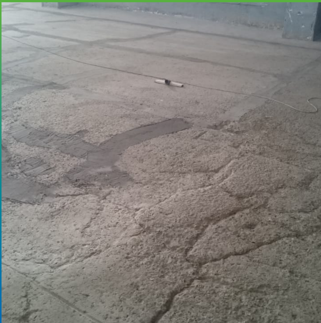
Локальная заделка трещин ремонтным составом