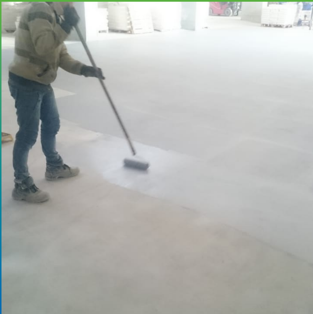
Нанесение паропроницаемого эпоксидного покрытия ДенсТоп ЭП 205