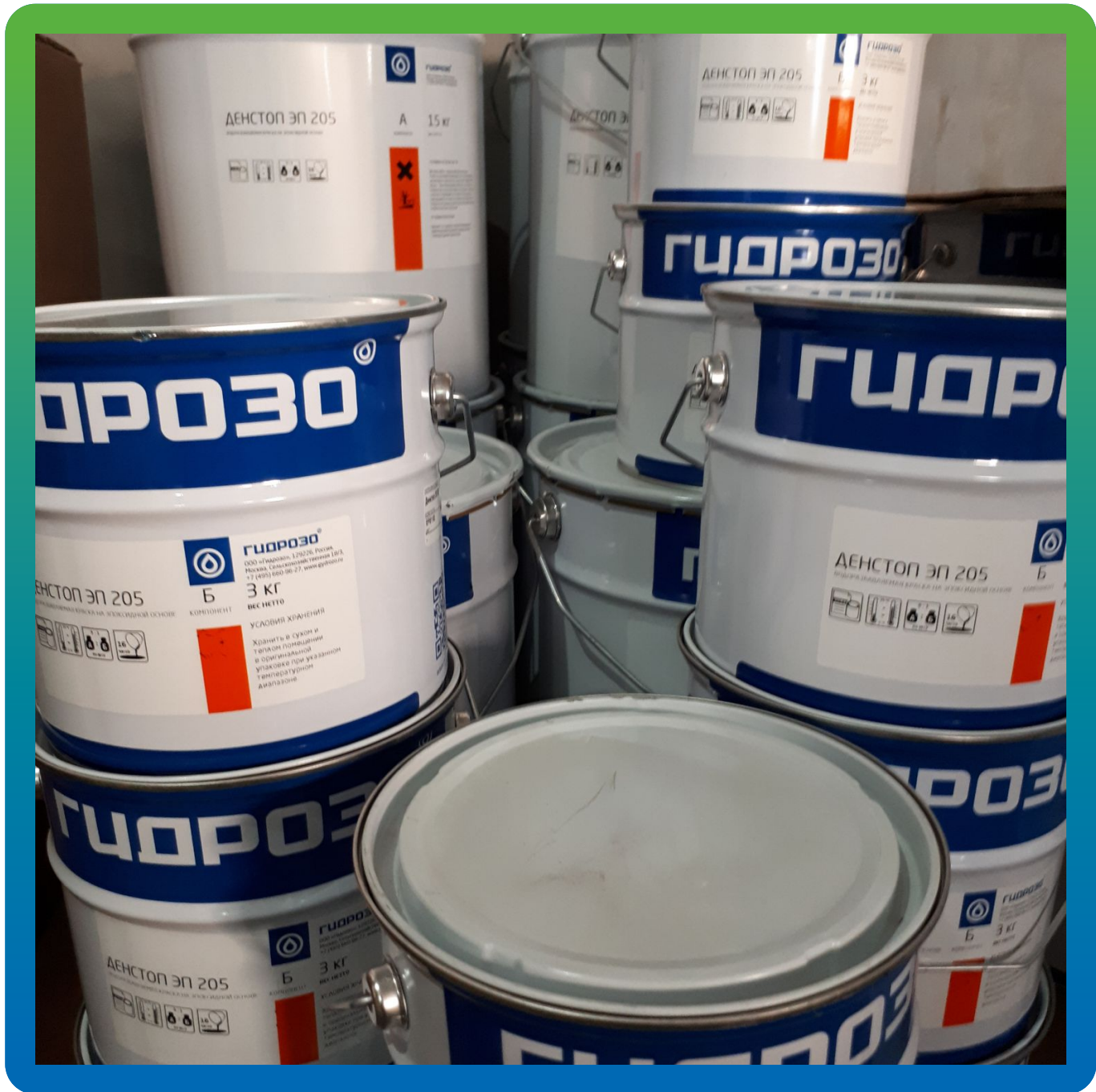
Материал ДенСтон ЭП 205