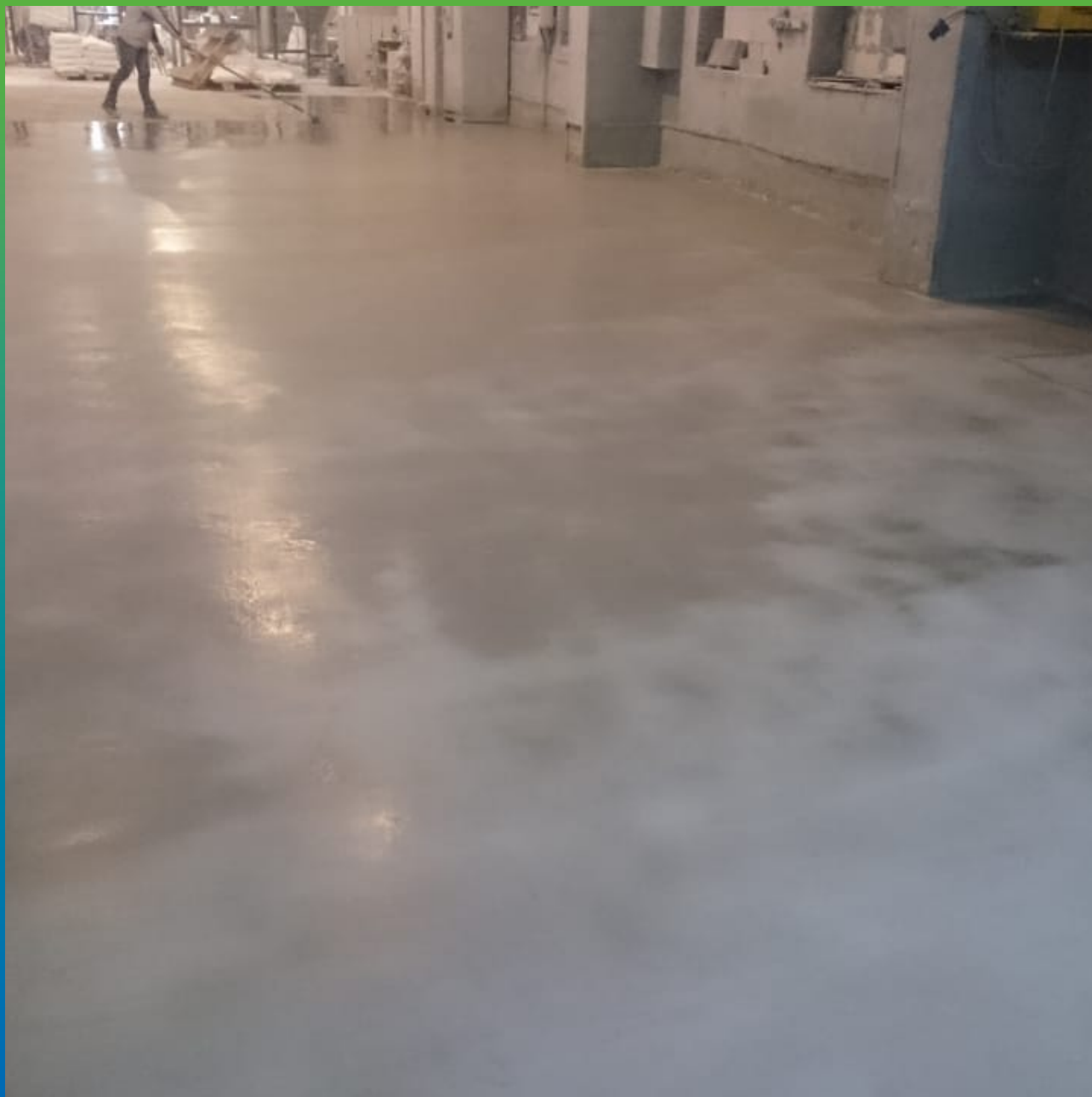
Накатка слоев ДенТоп ЭП 205