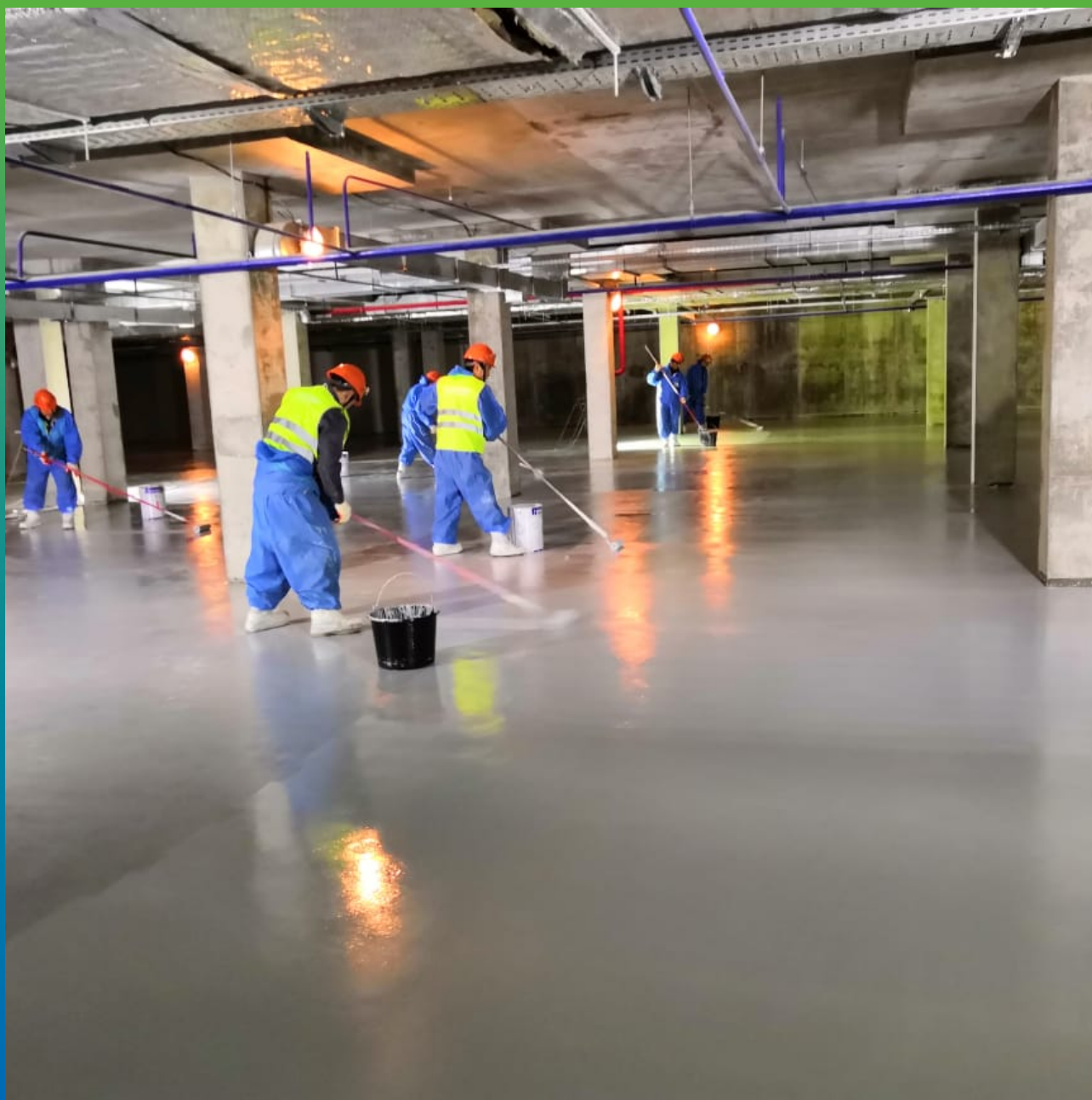
Нанесение ДенсТоп ЭП 501