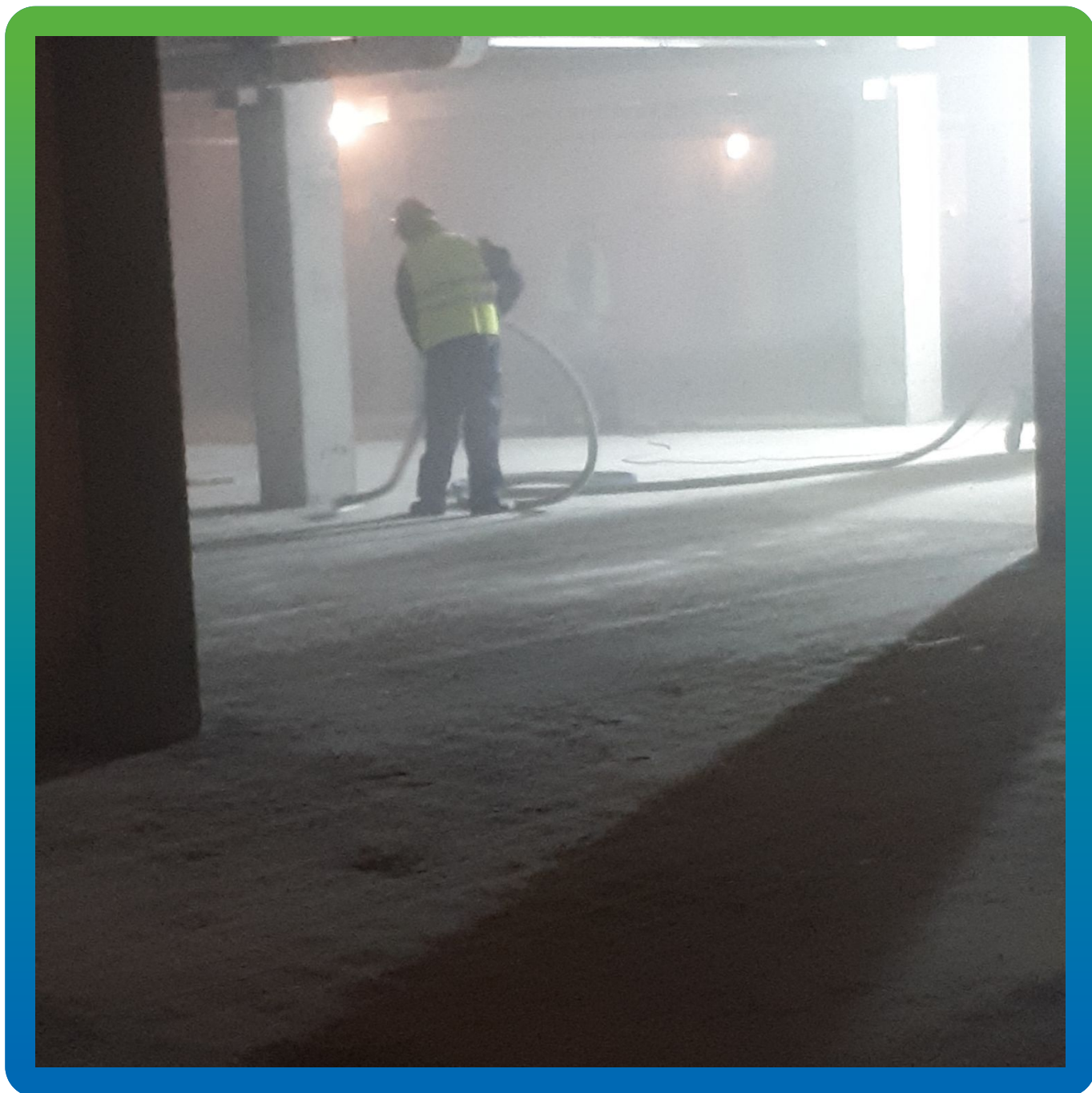
Подготовка основания - сборка пыли промышленным пылесосом