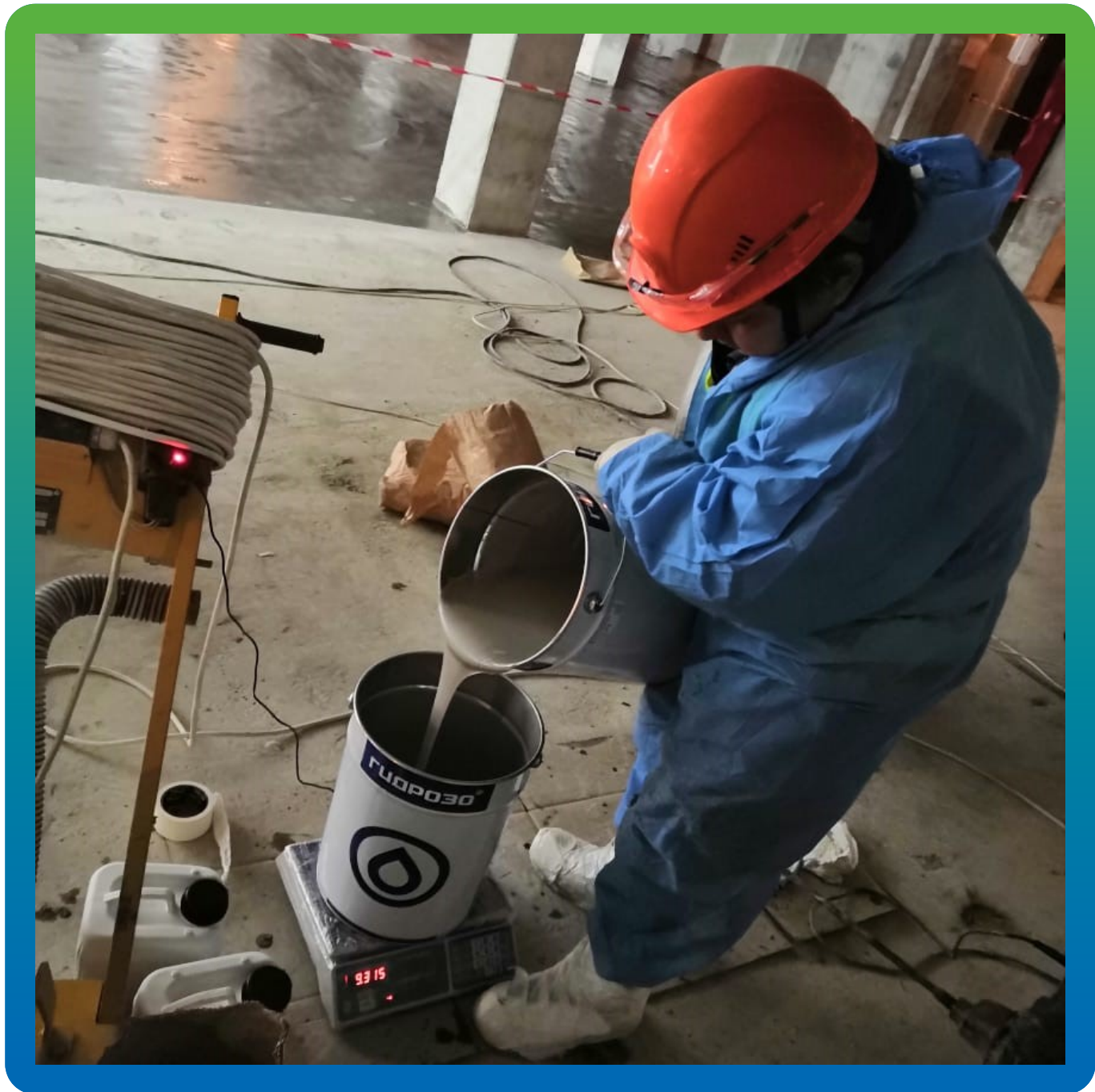
Взвешивание компонентов грунтовочного состава