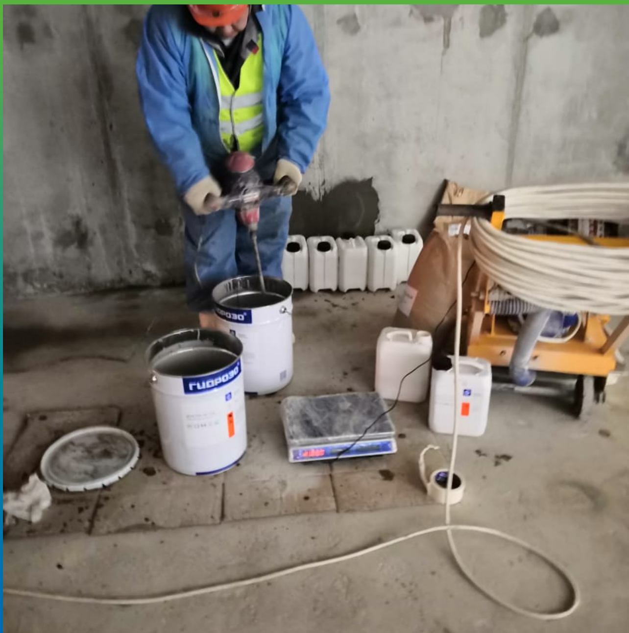
Смешивание компонентов А и Б грунтовочного состава ДенТоп ЭП 104