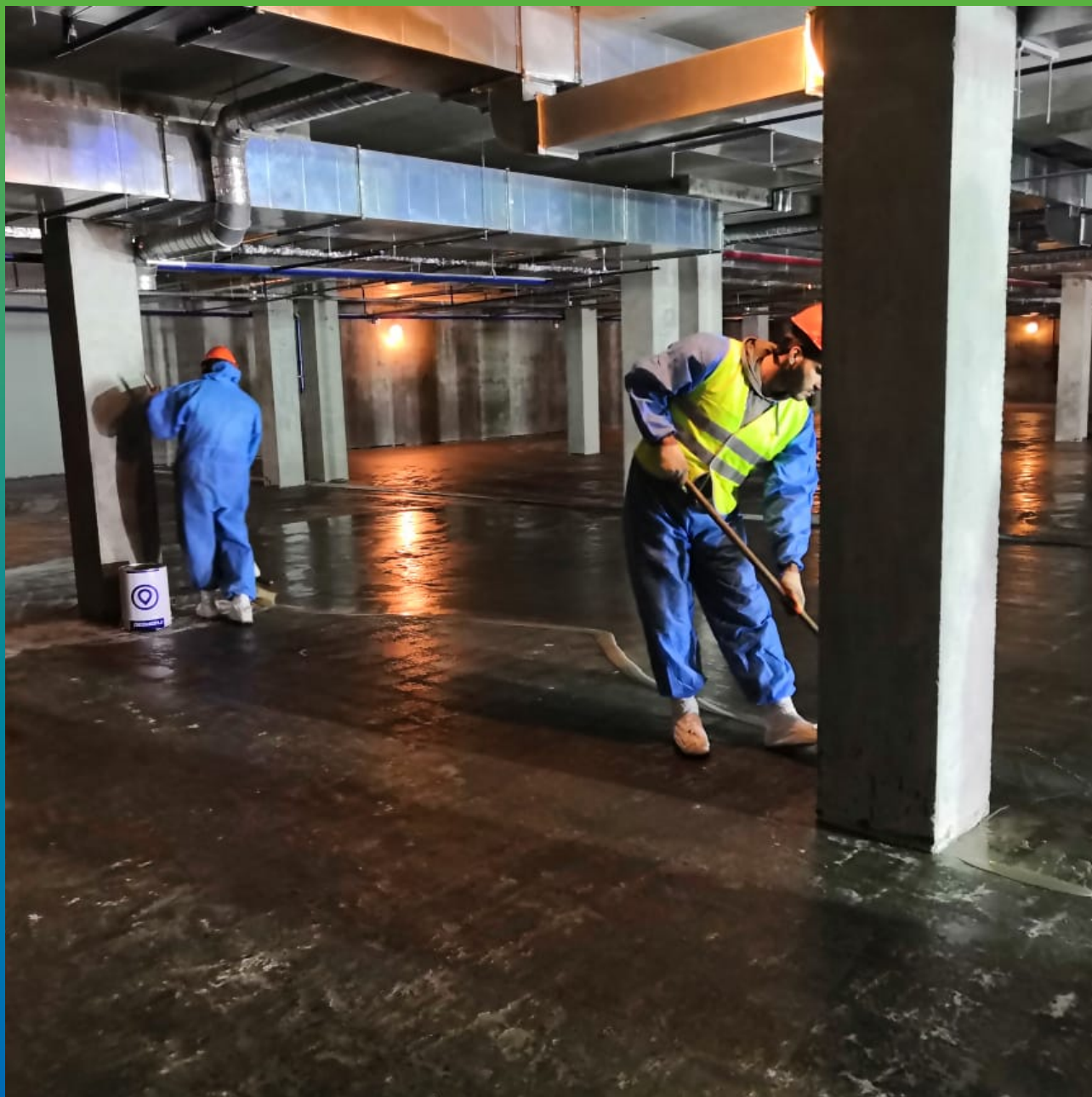
Распределение грунтовочного состава по площади паркинга