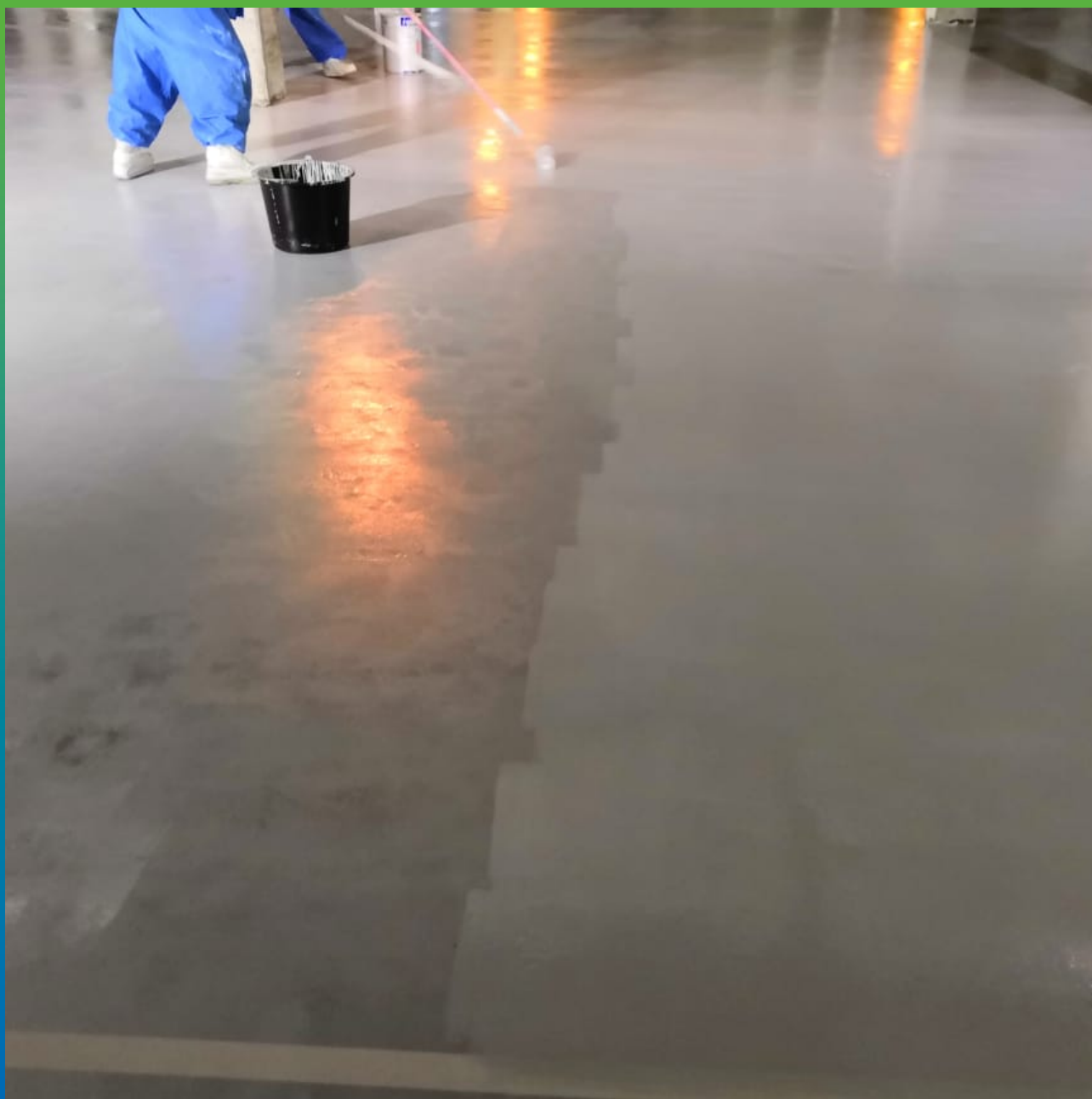
Накатка слоев базового эпоксидного покрытия ДенсТоп ЭП 501