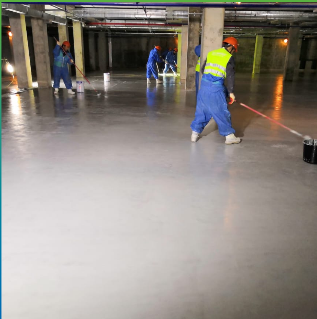
Нанесение финишного слоя ДенсТоп ЭП 501