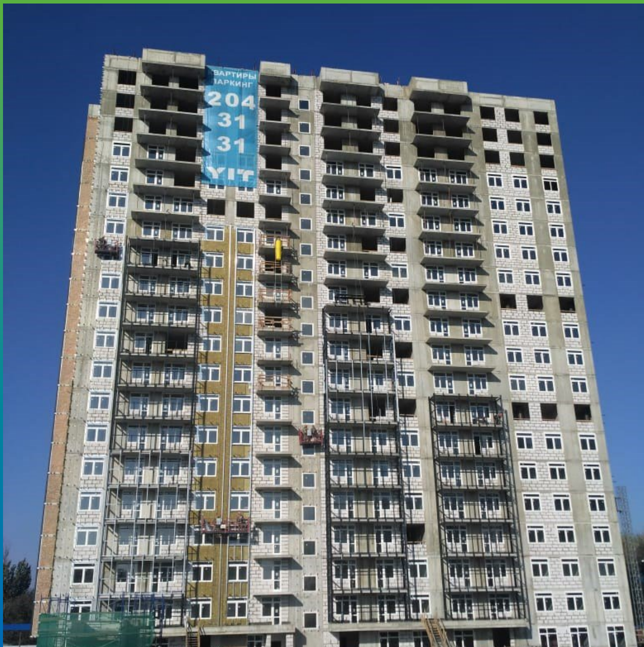
Общий вид на строящийся корпус ЖК Времена года