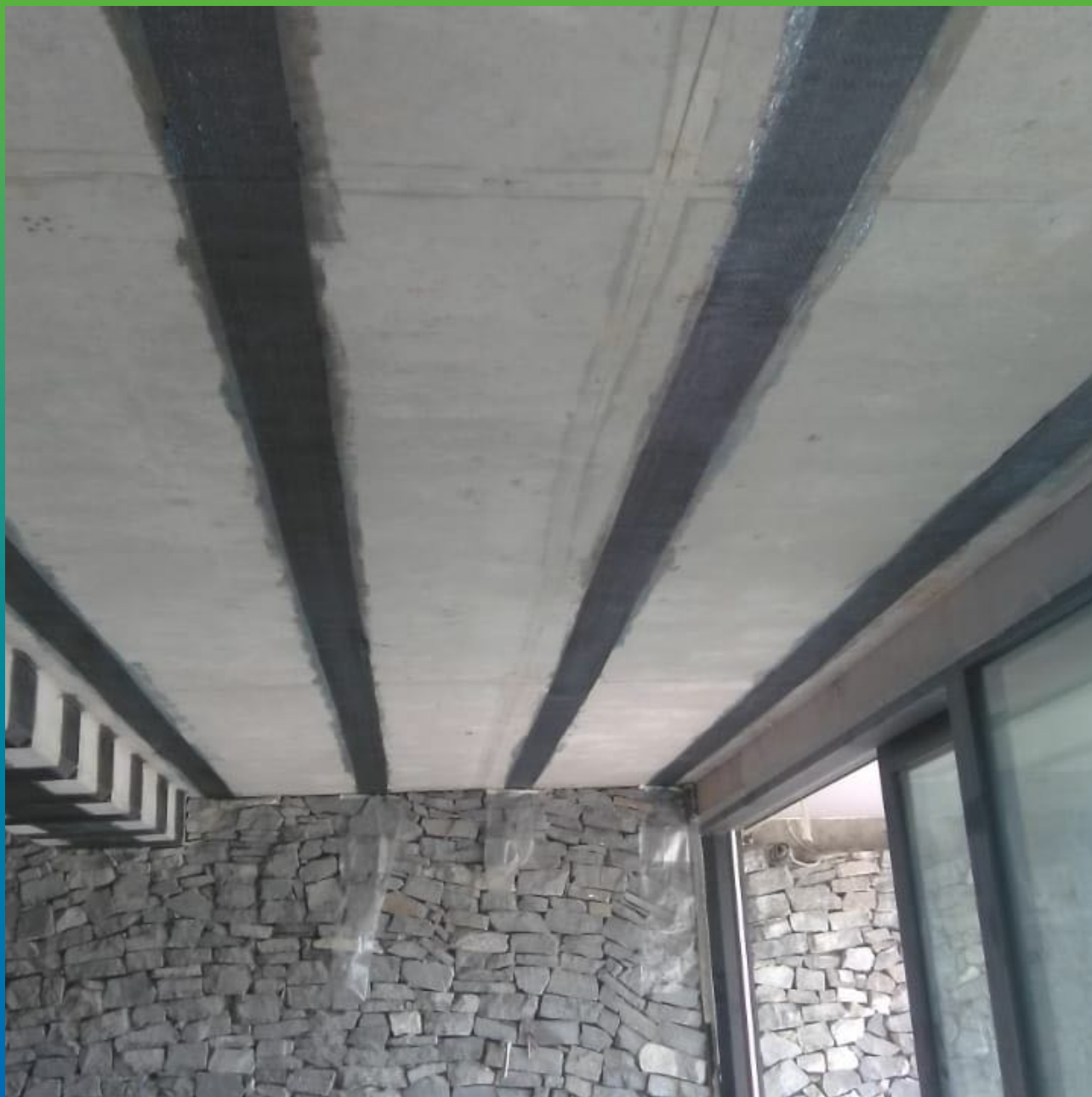
Итоговый вид плиты перекрытия, усиленной композитными материалами Армошел КВ 200 и Манопокс 183