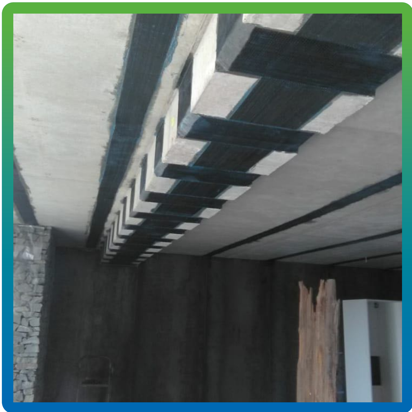
Усиление при помощи углеродных холстов Армошел KB 200