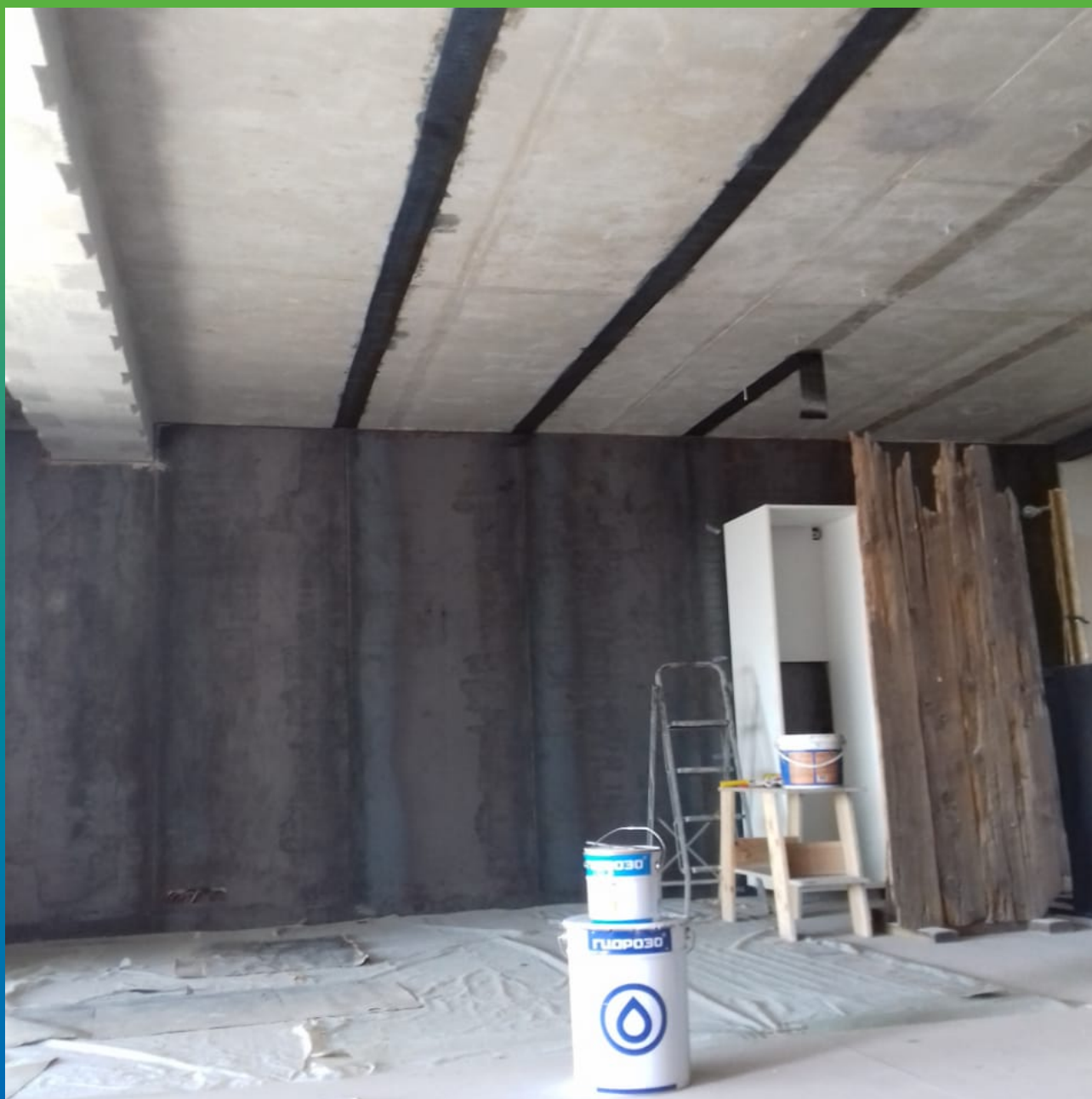
Эпоксидный клей Манопокс 183