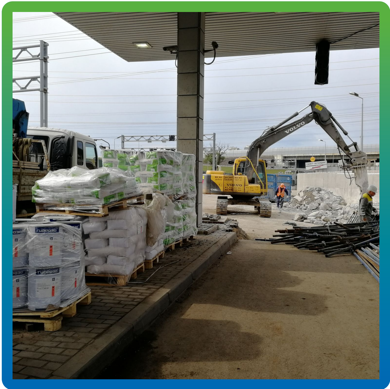
Поступление ремонтных и инъекционных материалов Гидрозо