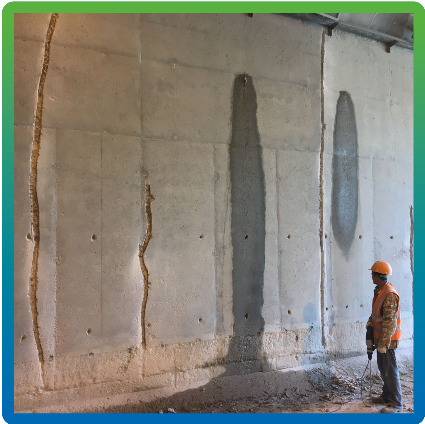
Подготовка и инъектирование полиуретановой смолы Манопур 143