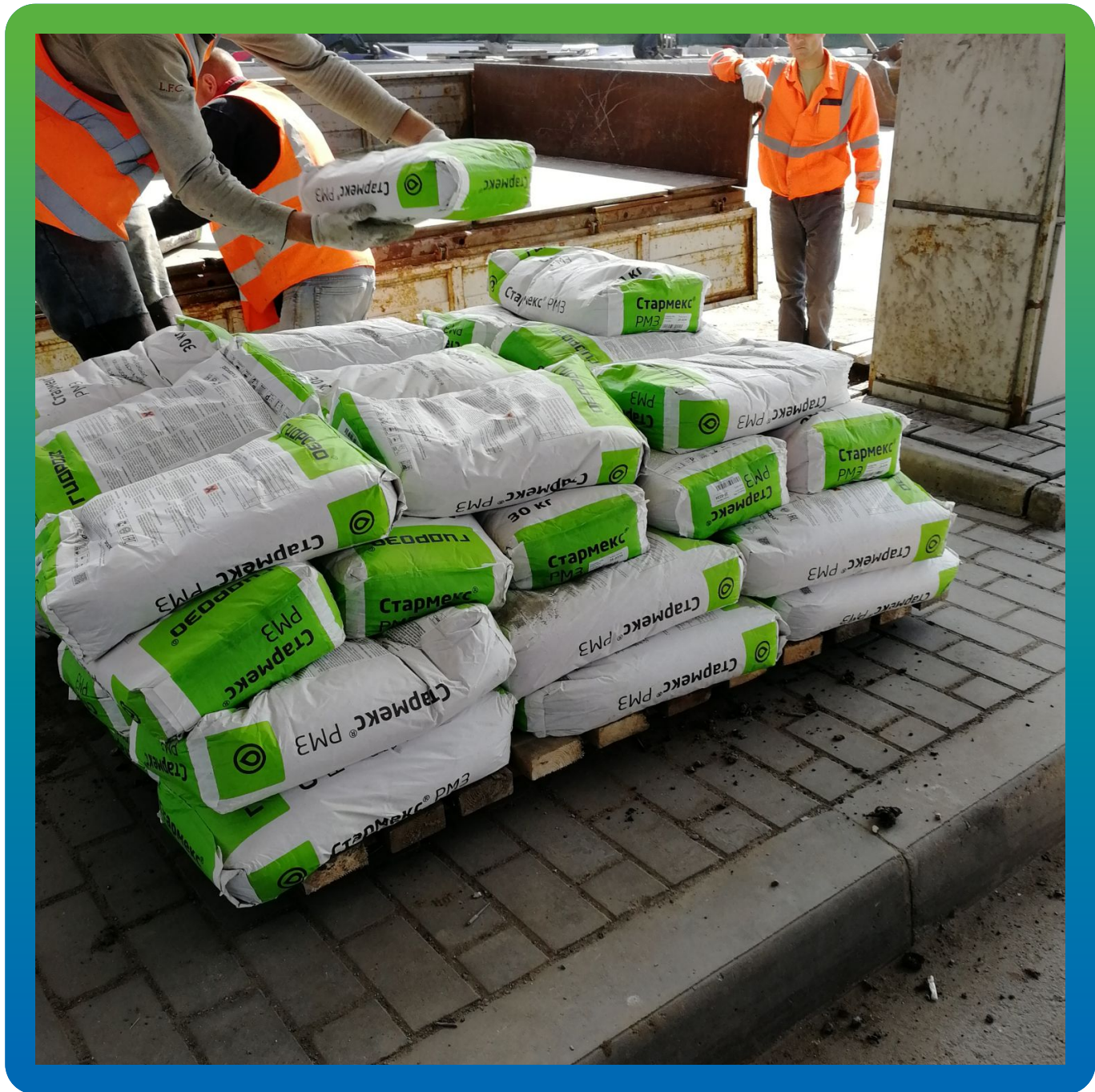
Поступление ремонтных и инъекционных материалов Гидрозо