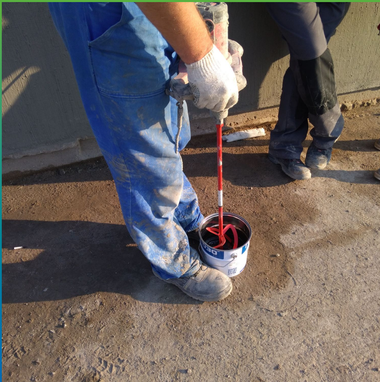
Смешивание компонента А полисульфидной мастики ДенсТоп ПС 391