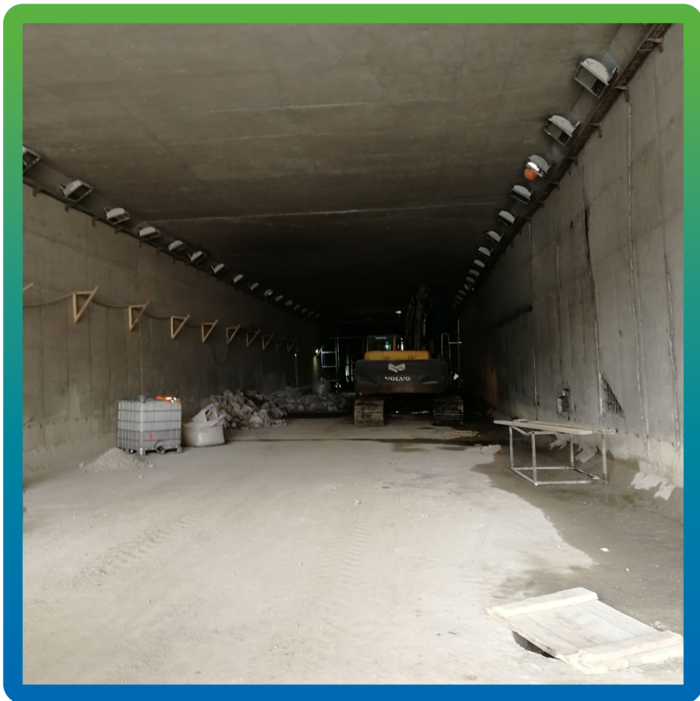
Подземная часть тоннеля