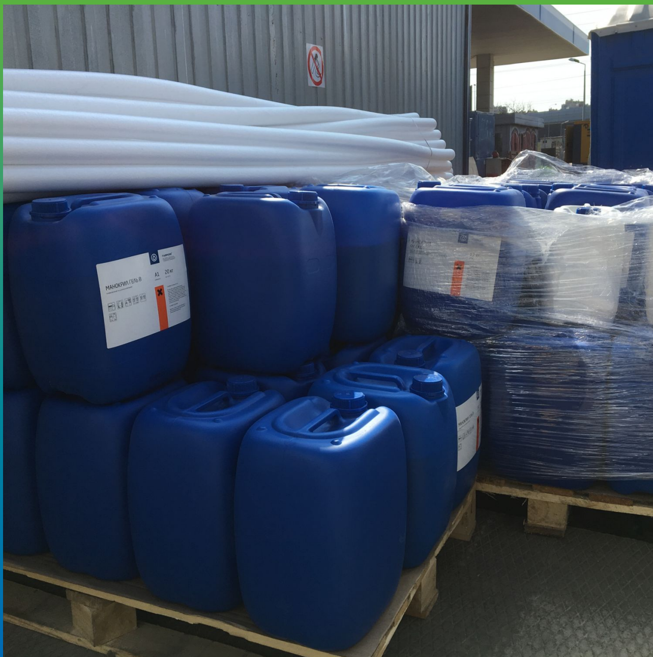
Поступление ремонтных и инъекционных материалов Гидрозо