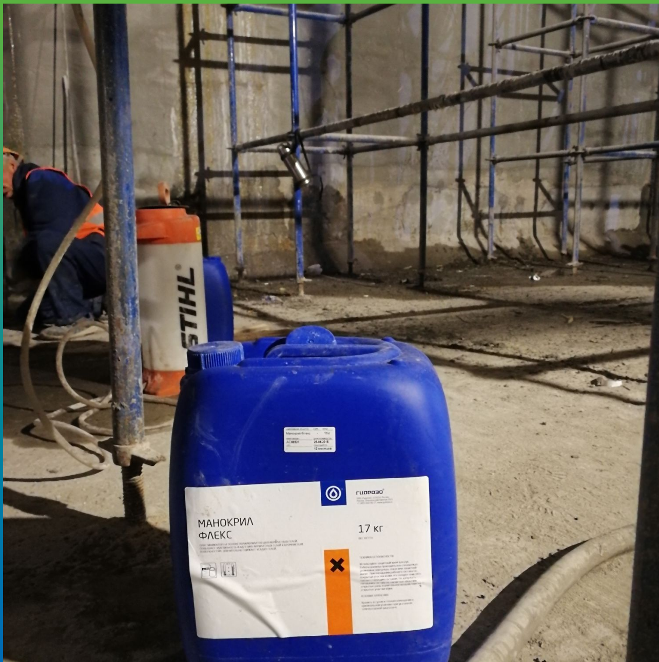
Инъектирование акрилатного геля Манокрил Гель В с добавкой Манокрил Флекс