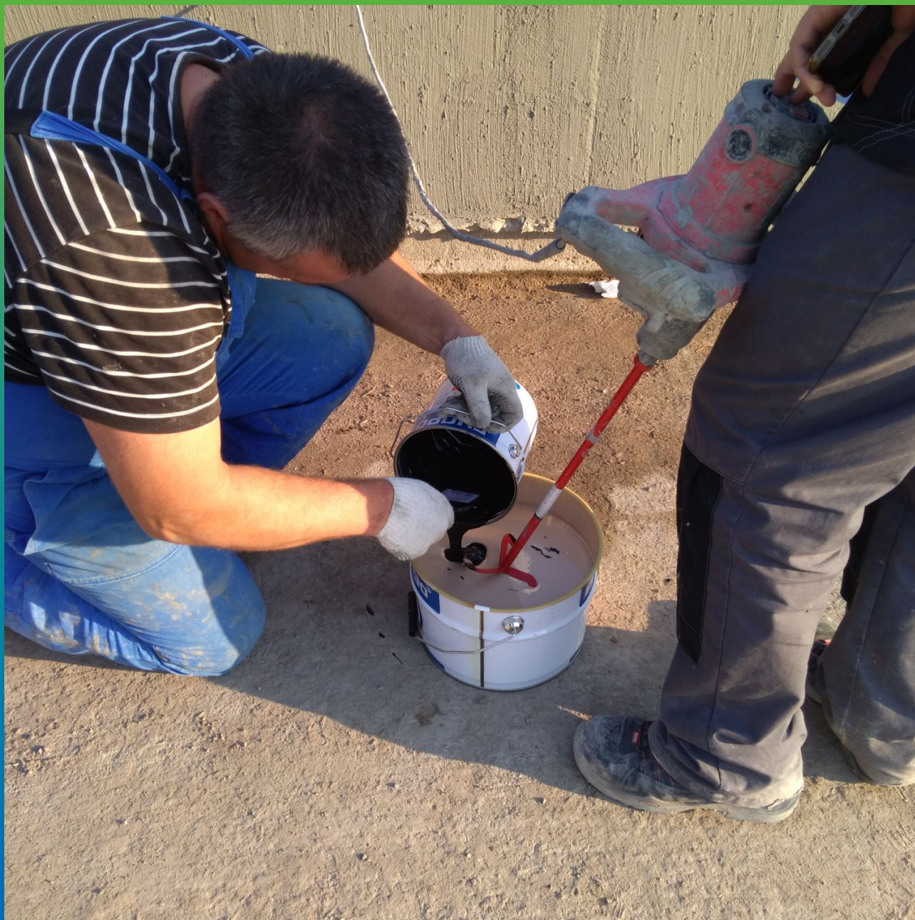
Смешивание компонентнов полисульфидной мастики ДенТоп ПС 391