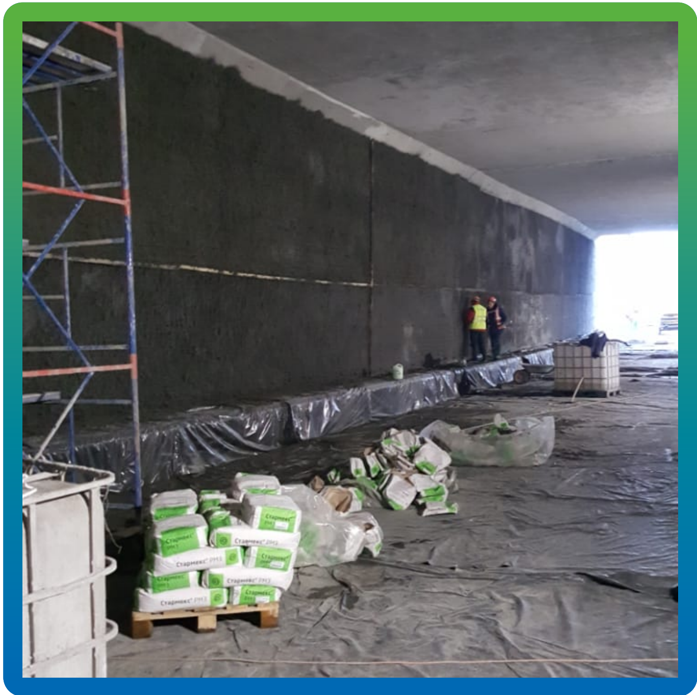
Механическое нанесение ремонтного состава Стармекс РМЗ