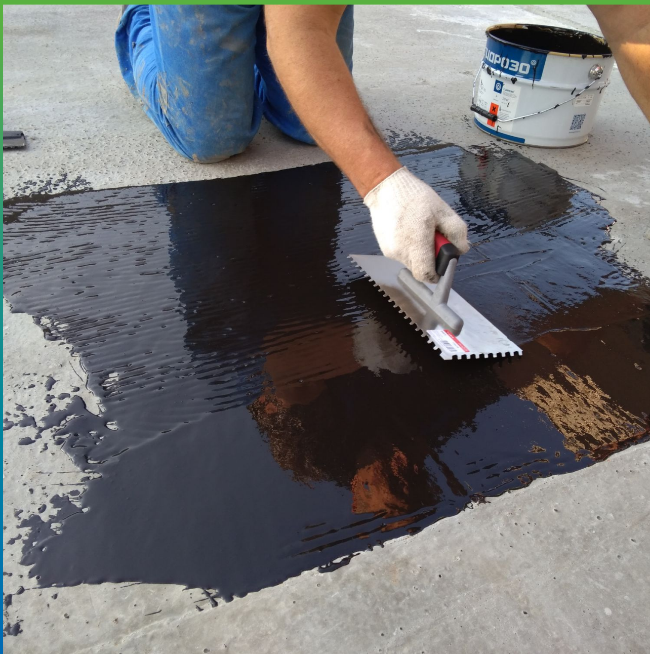
Нанесение гидроизоляционного покрытия на основе двухкомпонентной полисульфидной мастики холодного отверждения ДенСтол ПС 391