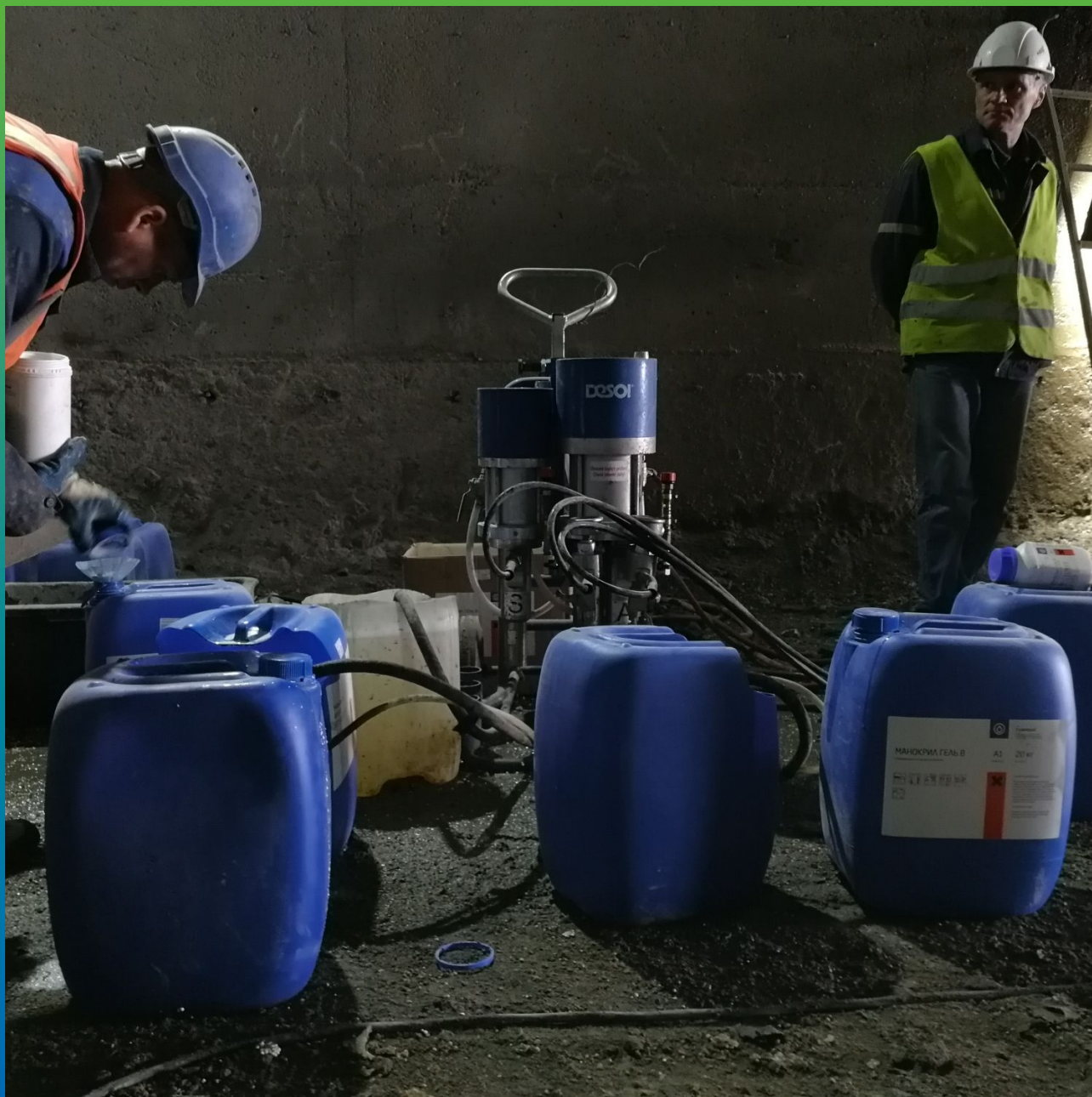
Инъектирование акрилатного геля Манокрил Гель В с добавкой Манокрил Флекс