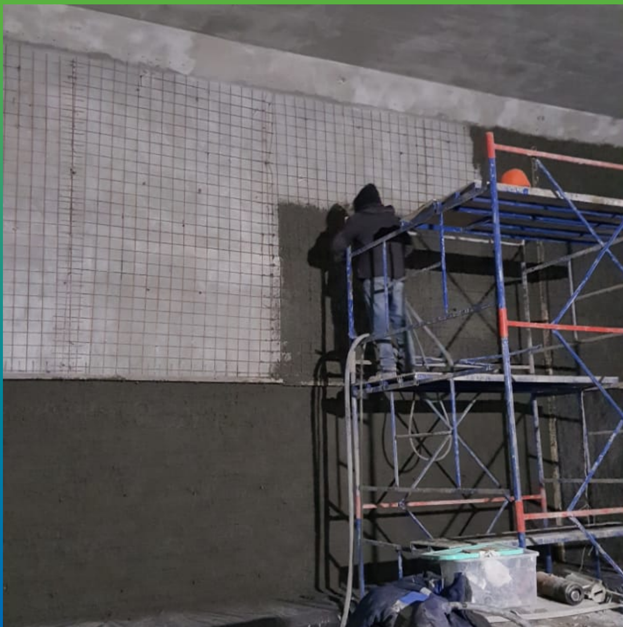
Механическое нанесение ремонтного состава Стармекс РМЗ