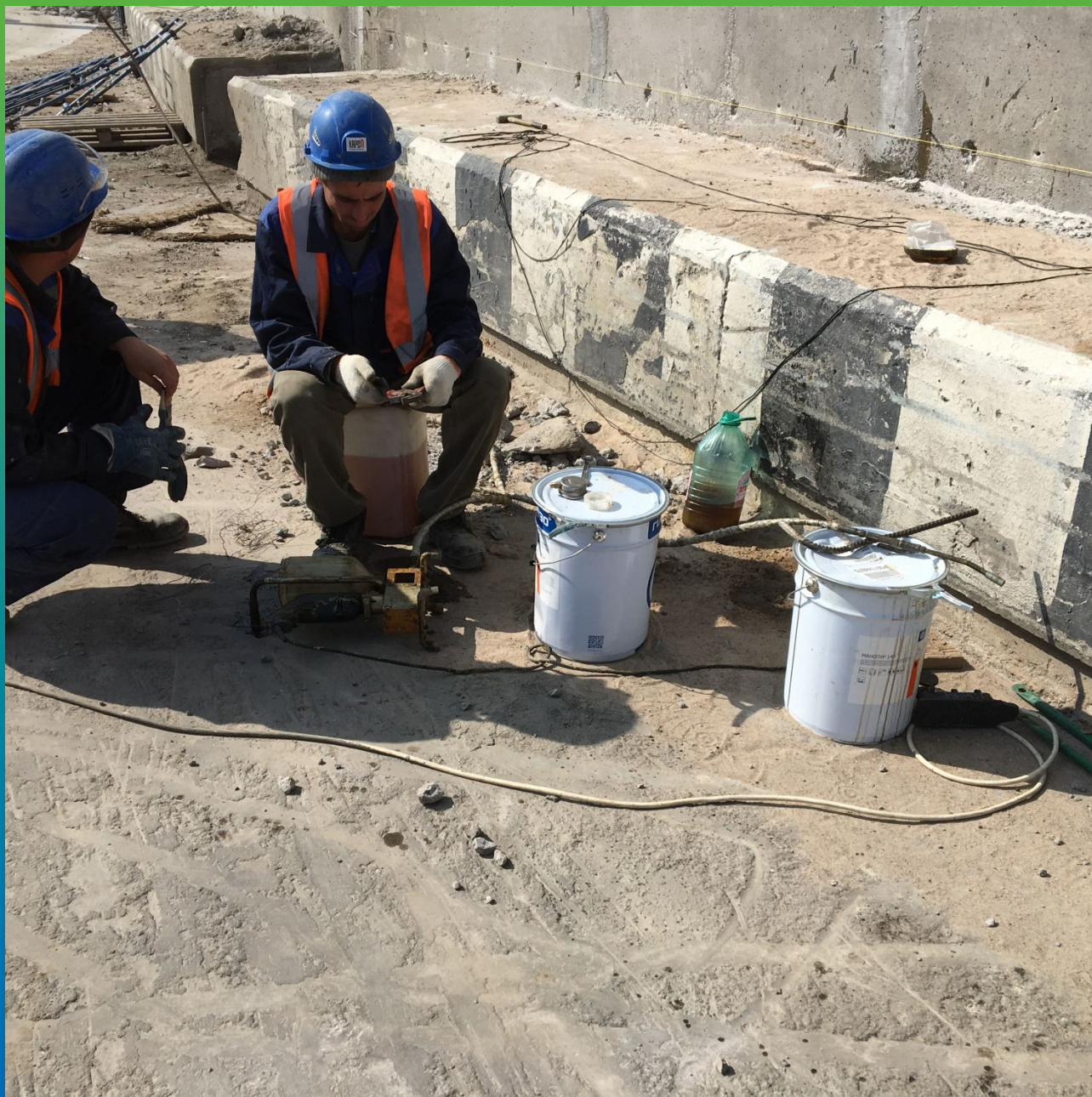
Подготовка и инъектирование полиуретановой смолы Манопур 143