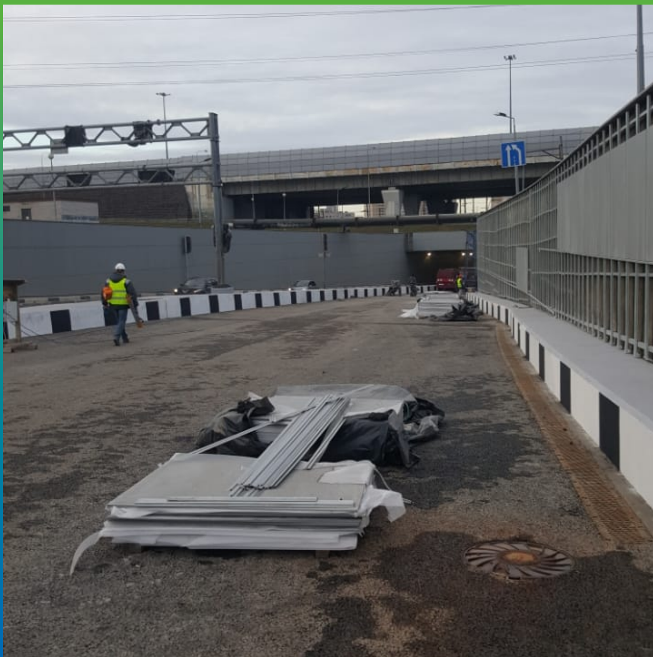
Общий вид тоннеля на завершающей стадии ремонта