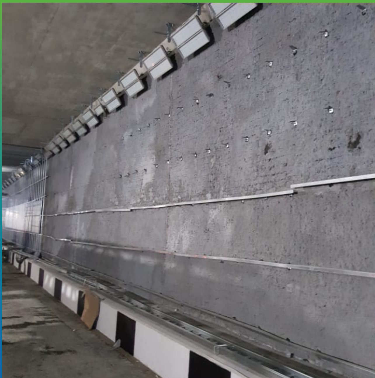
Нанесенный двухкомпонентное защитное покрытие ДенсТоп ЭП 205