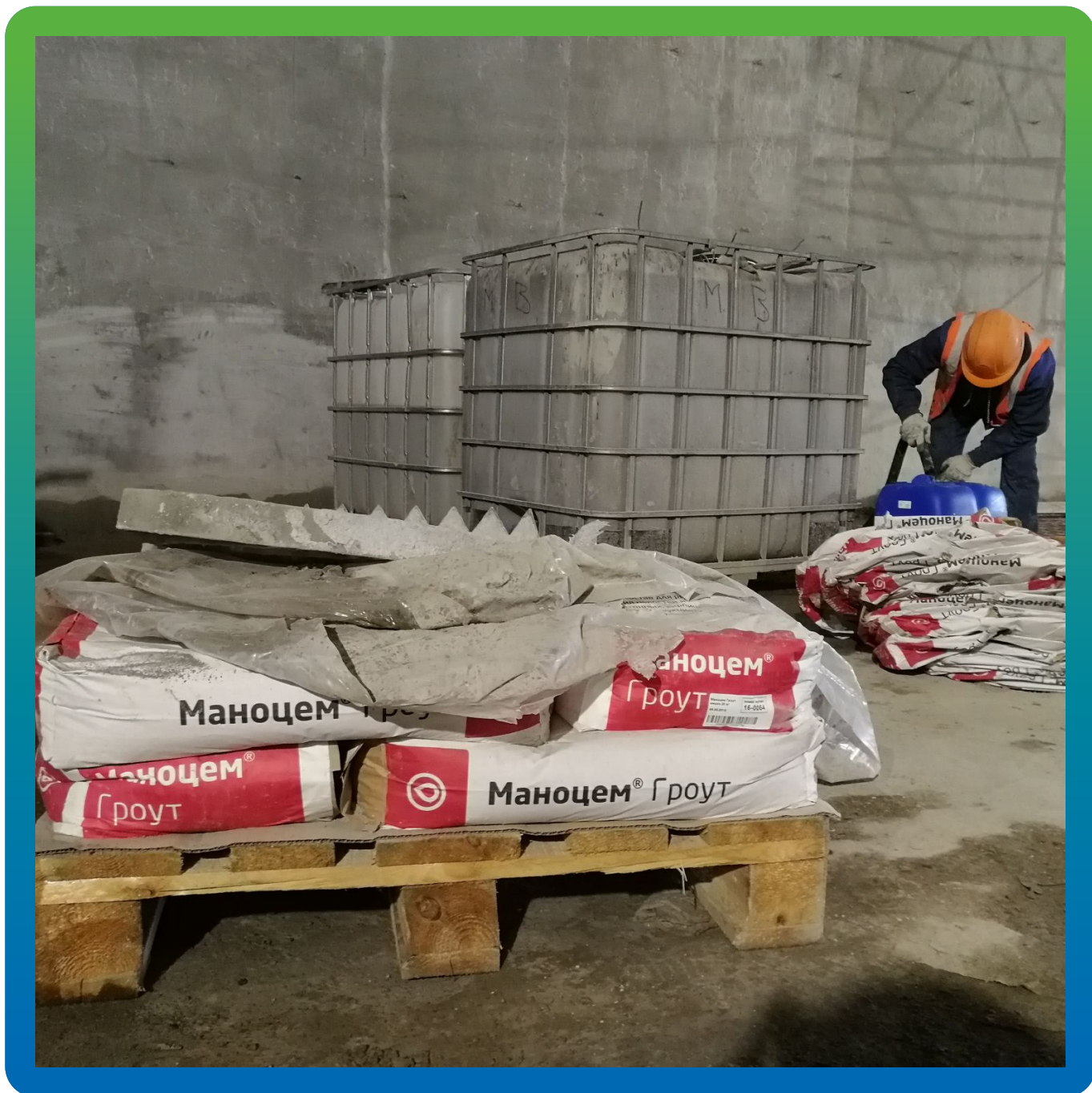
Инъектирование раствора на цементной основе Маноцем Грут