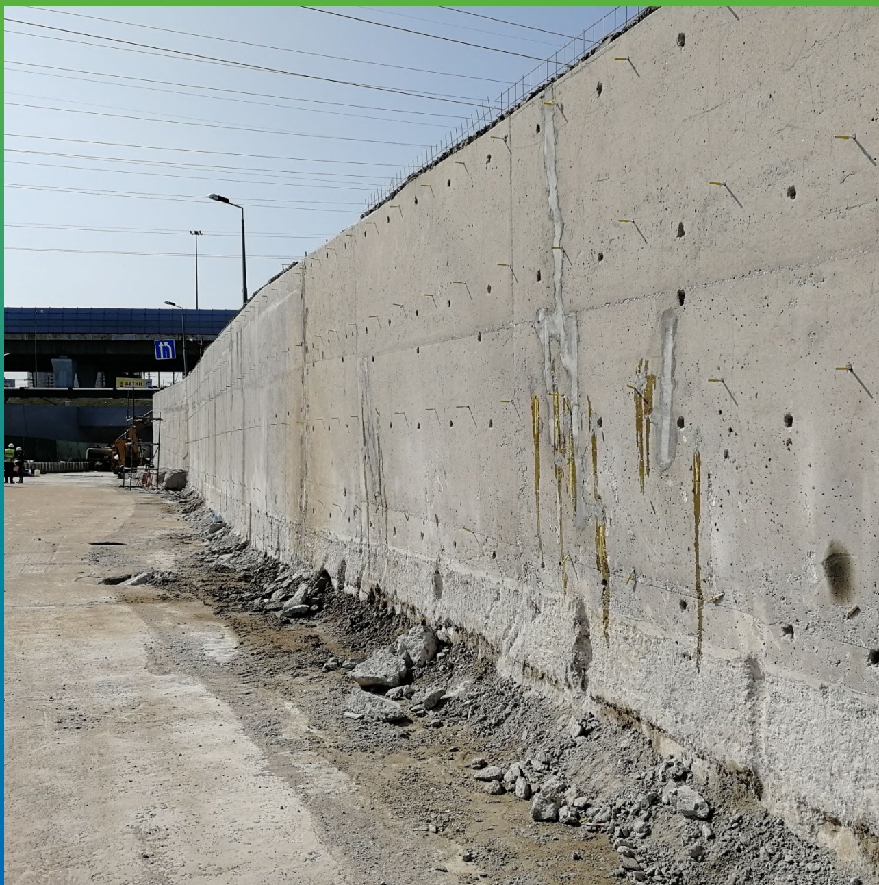
Подготовительные работы на тоннеле