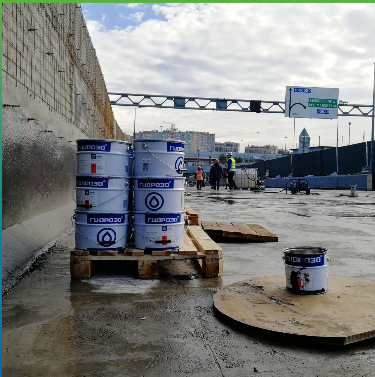
Двухкомпонентная полисульфидная мастика холодного отверждения ДенТоп ПС 391