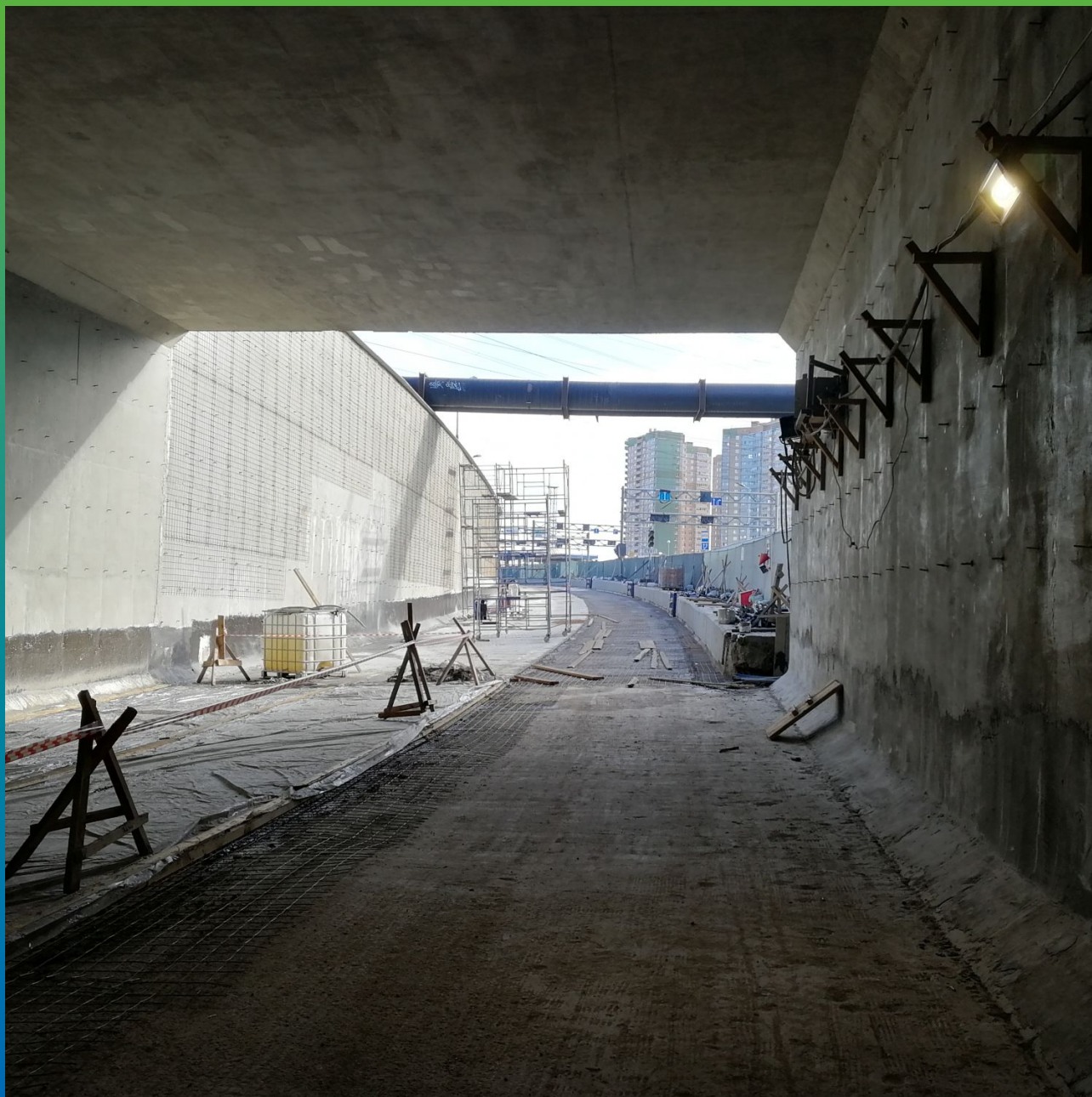
Общий вид тоннеля