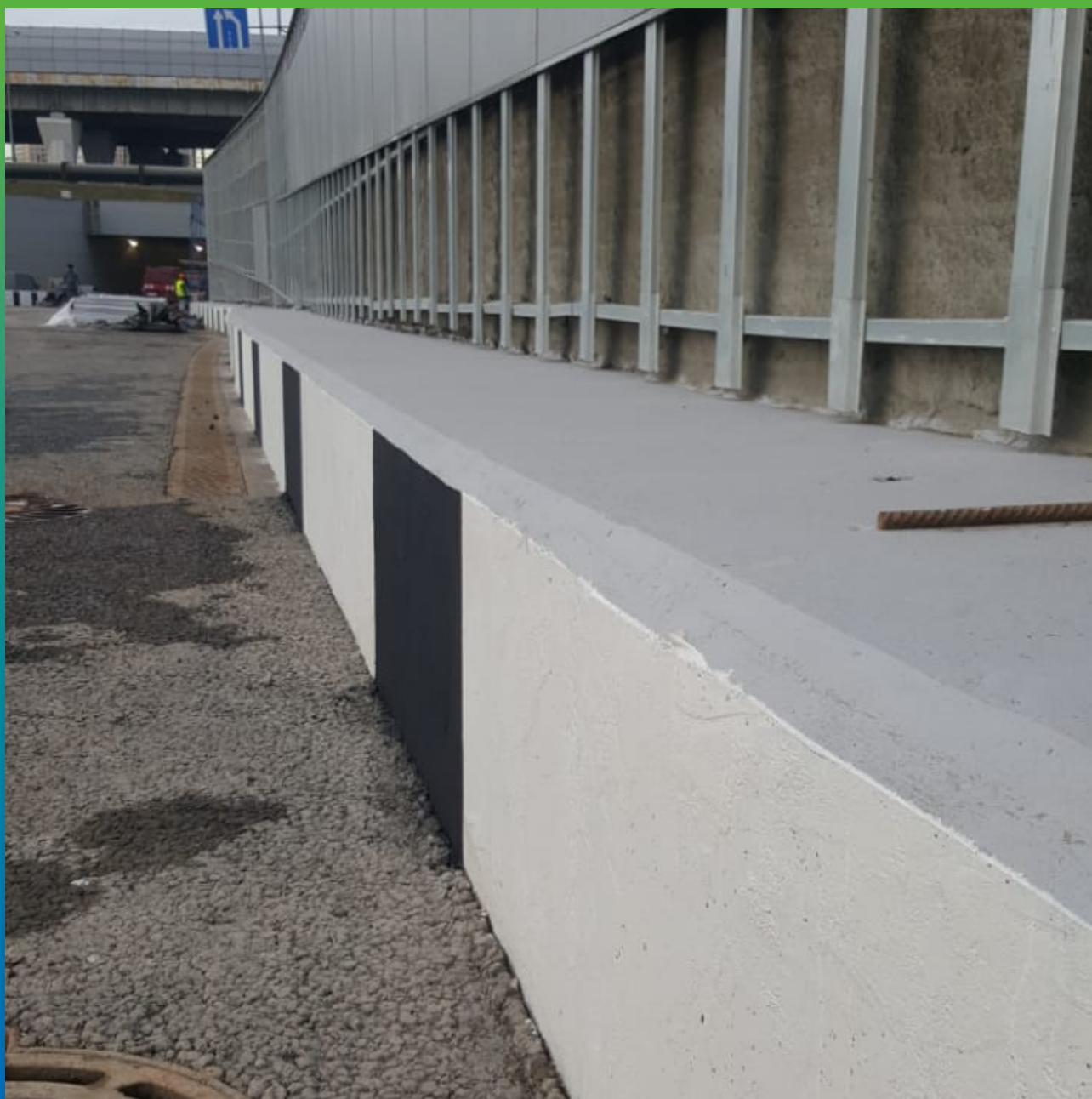
Общий вид тоннеля на завершающей стадии ремонта