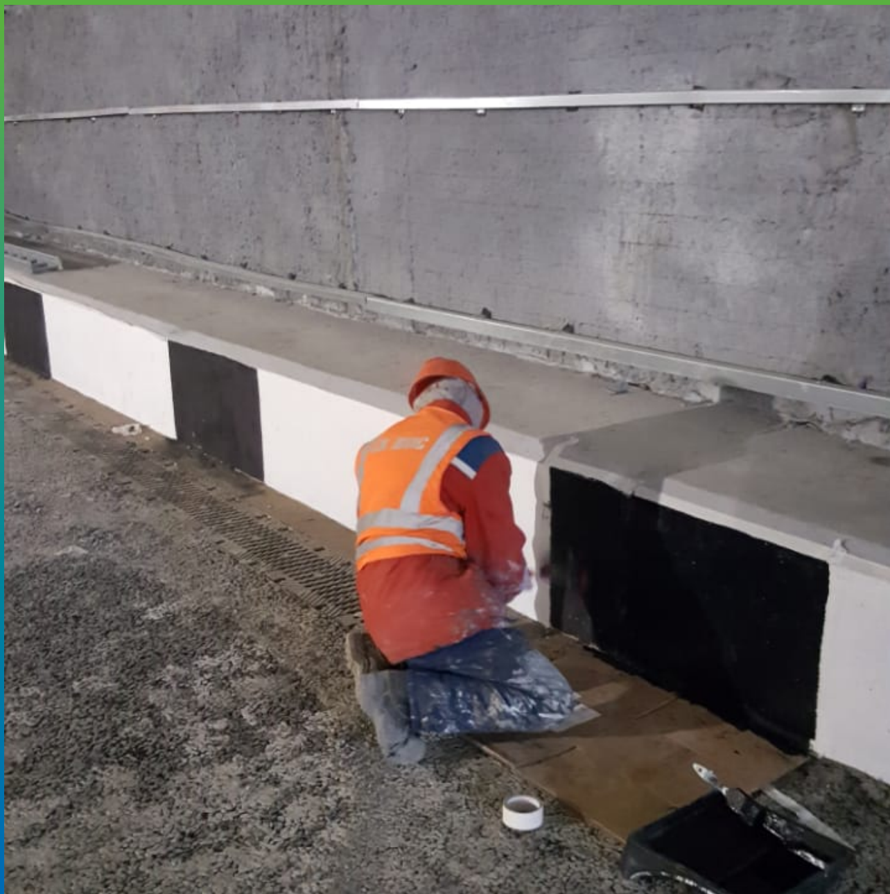
Нанесение двухкомпонентного защитного покрытия ДенТоп ЭП 205