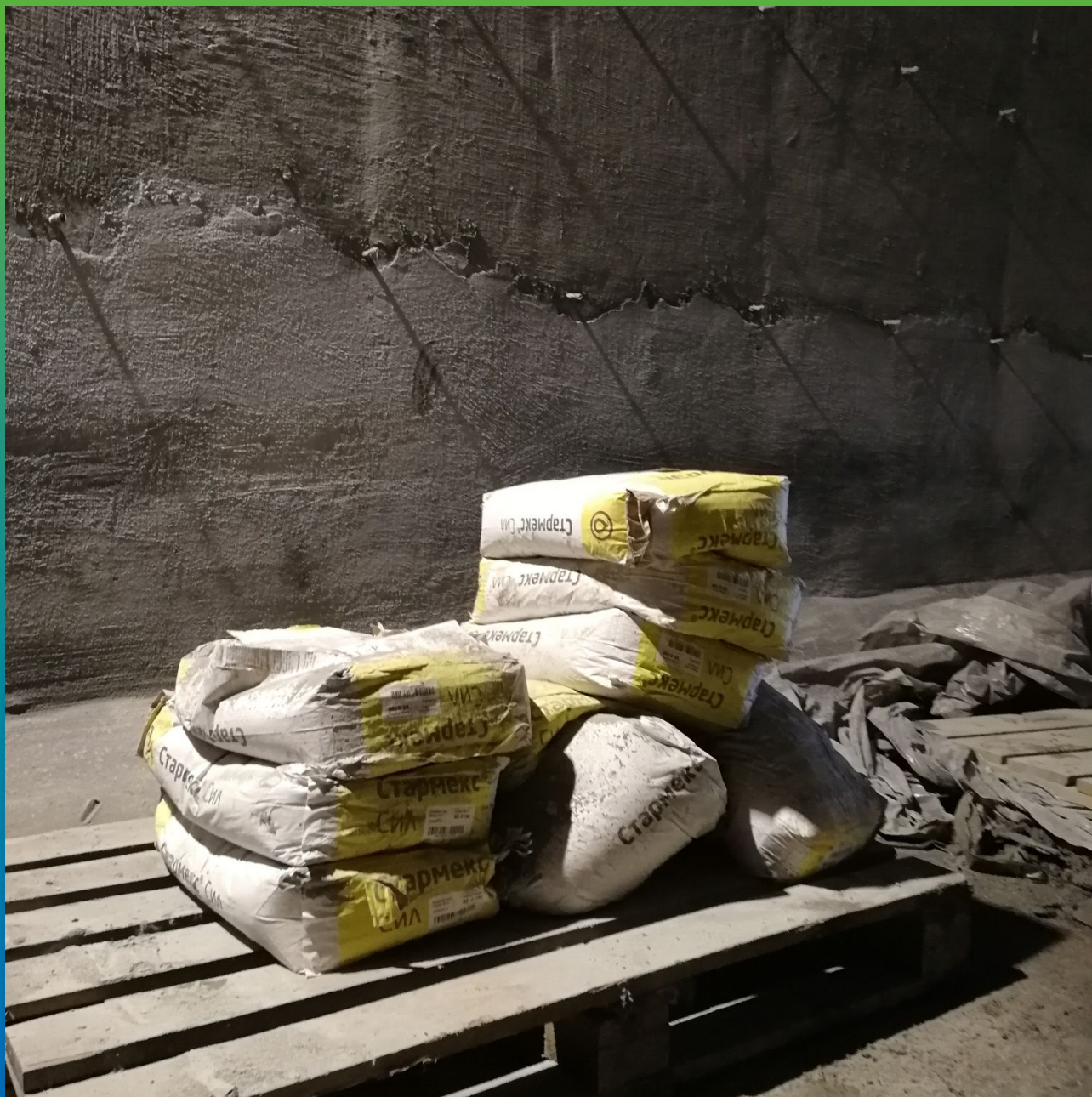
Применение гидроизоляционного материала Стармекс Сил