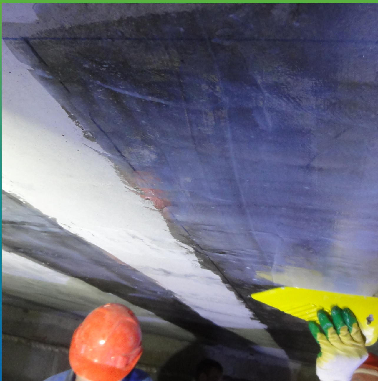
Нанесение основного слоя клея из Манопокс 372 загущенного с помощью Манопокс Тикс