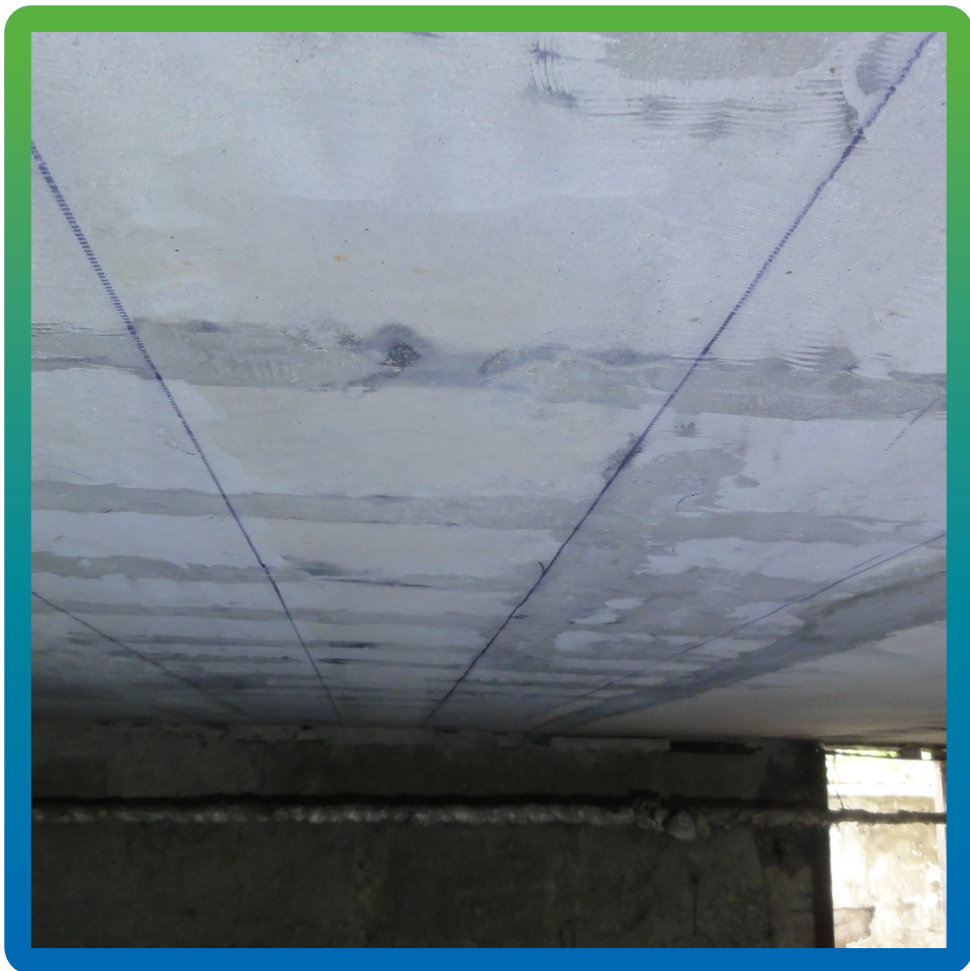
Вид отремонтированных плит перекрытия