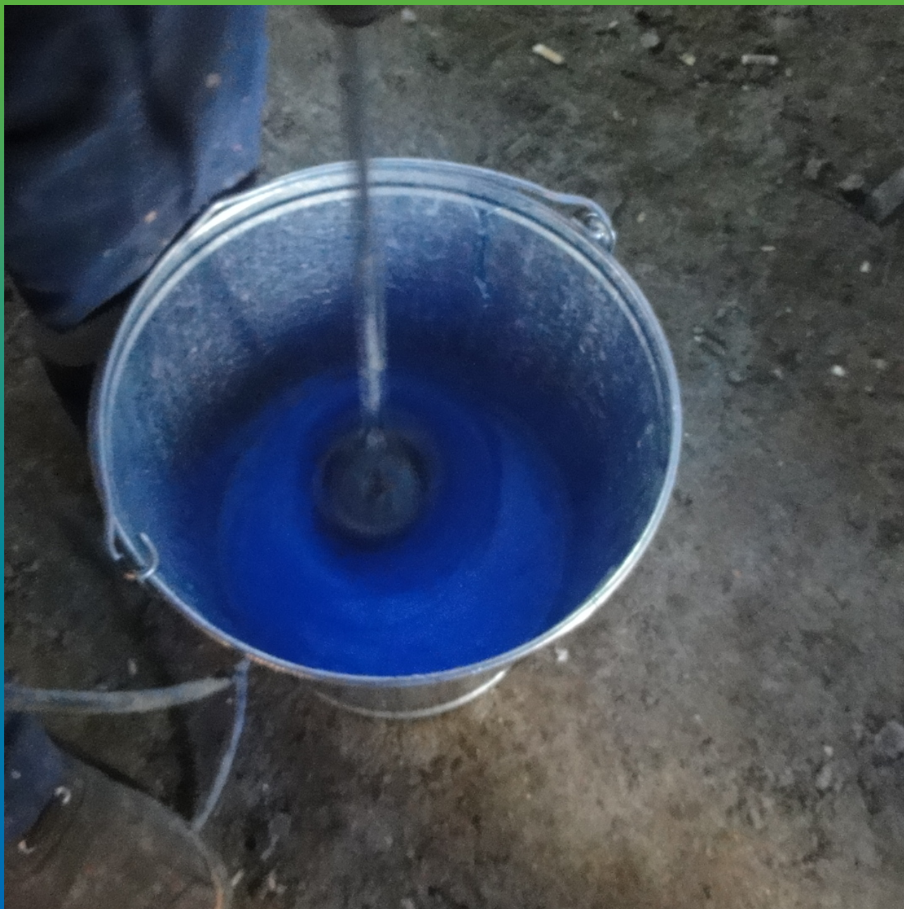
Затворение эпоксидного состава Манопокс 372