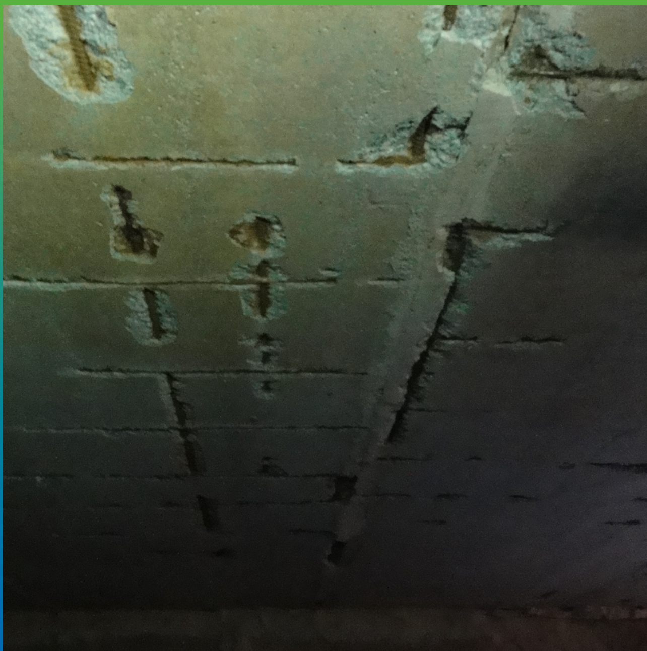
Дефекты в плитах перекрытия