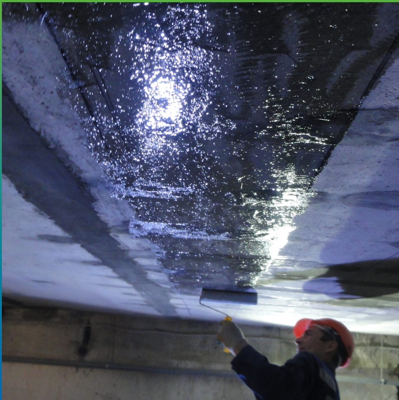
Грунтовка основания с помощью Манопокс 372