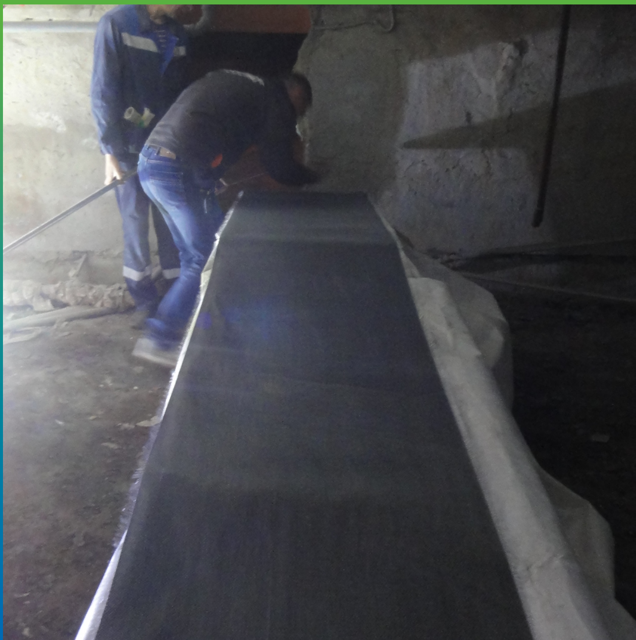
Раскрой углеродного холста Армошел KB200