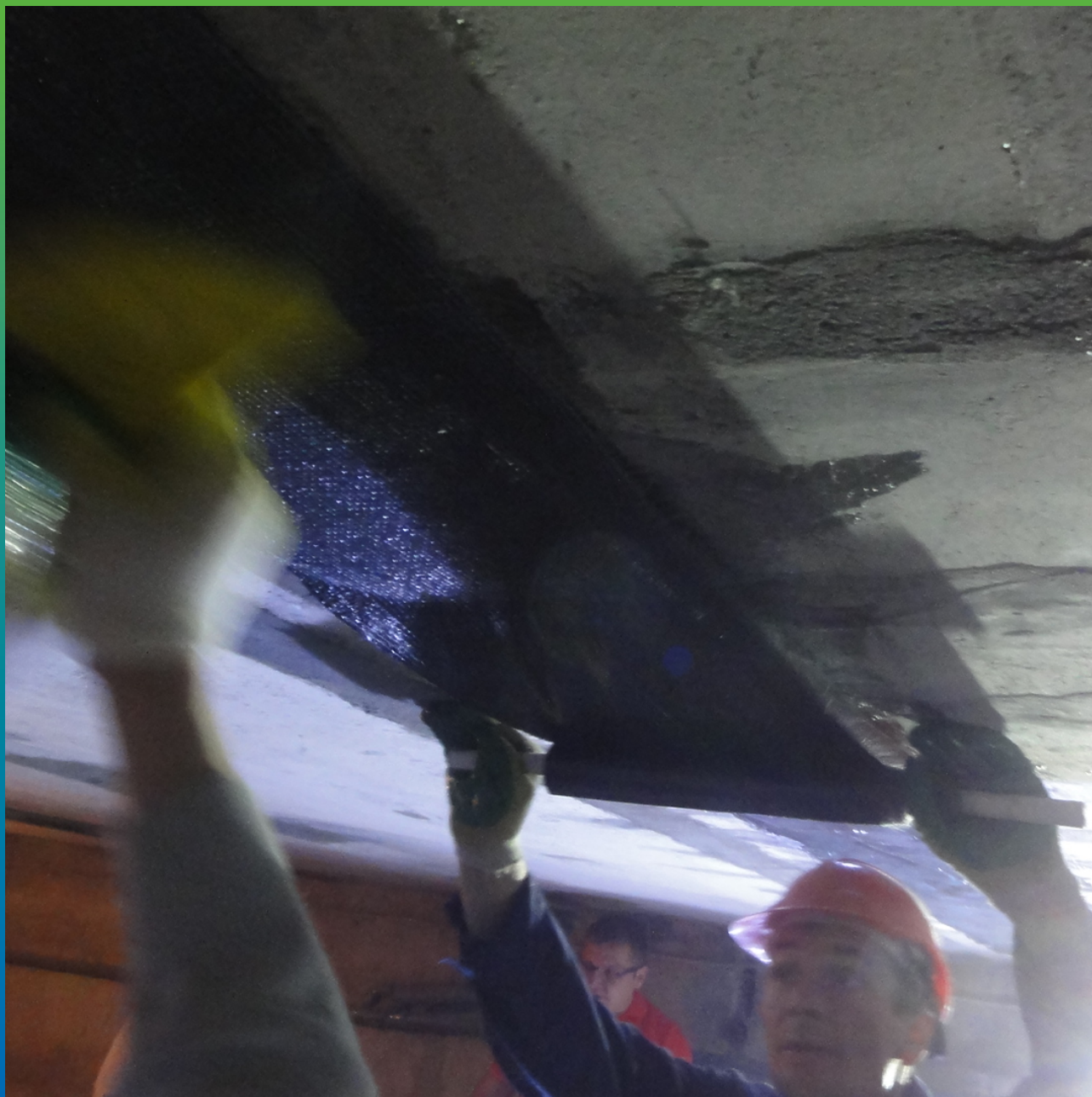
Приклейка холста Армошел KB200 к основанию