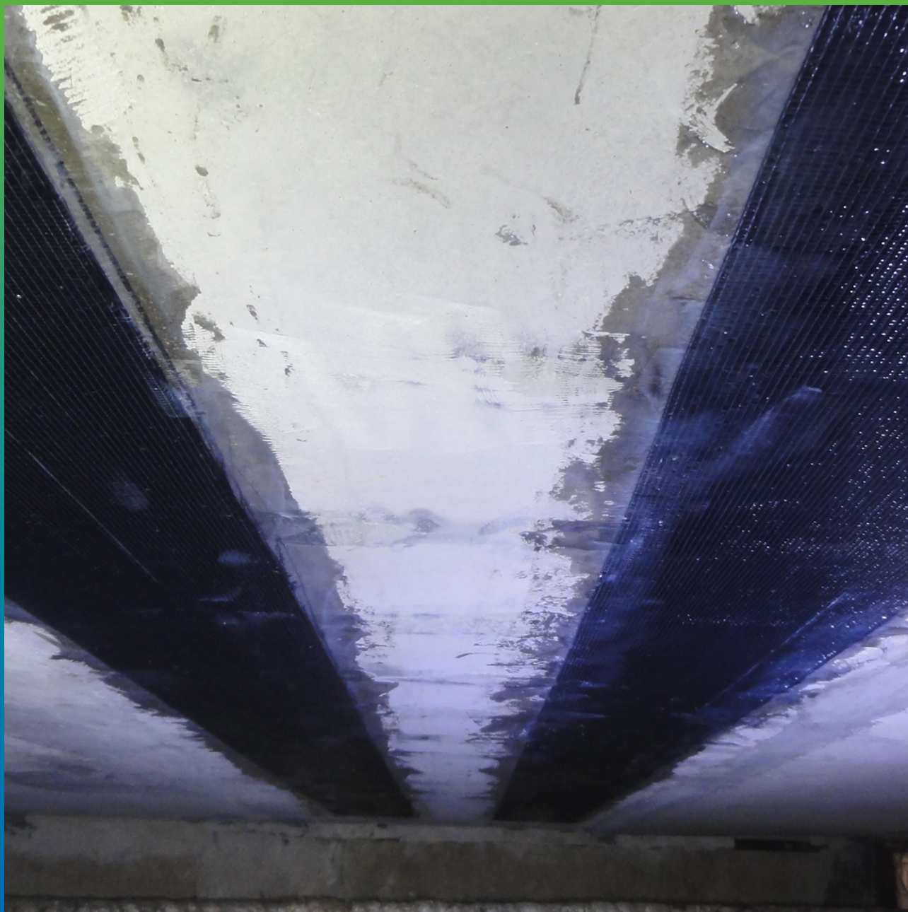
Финальный вид усиленного участка