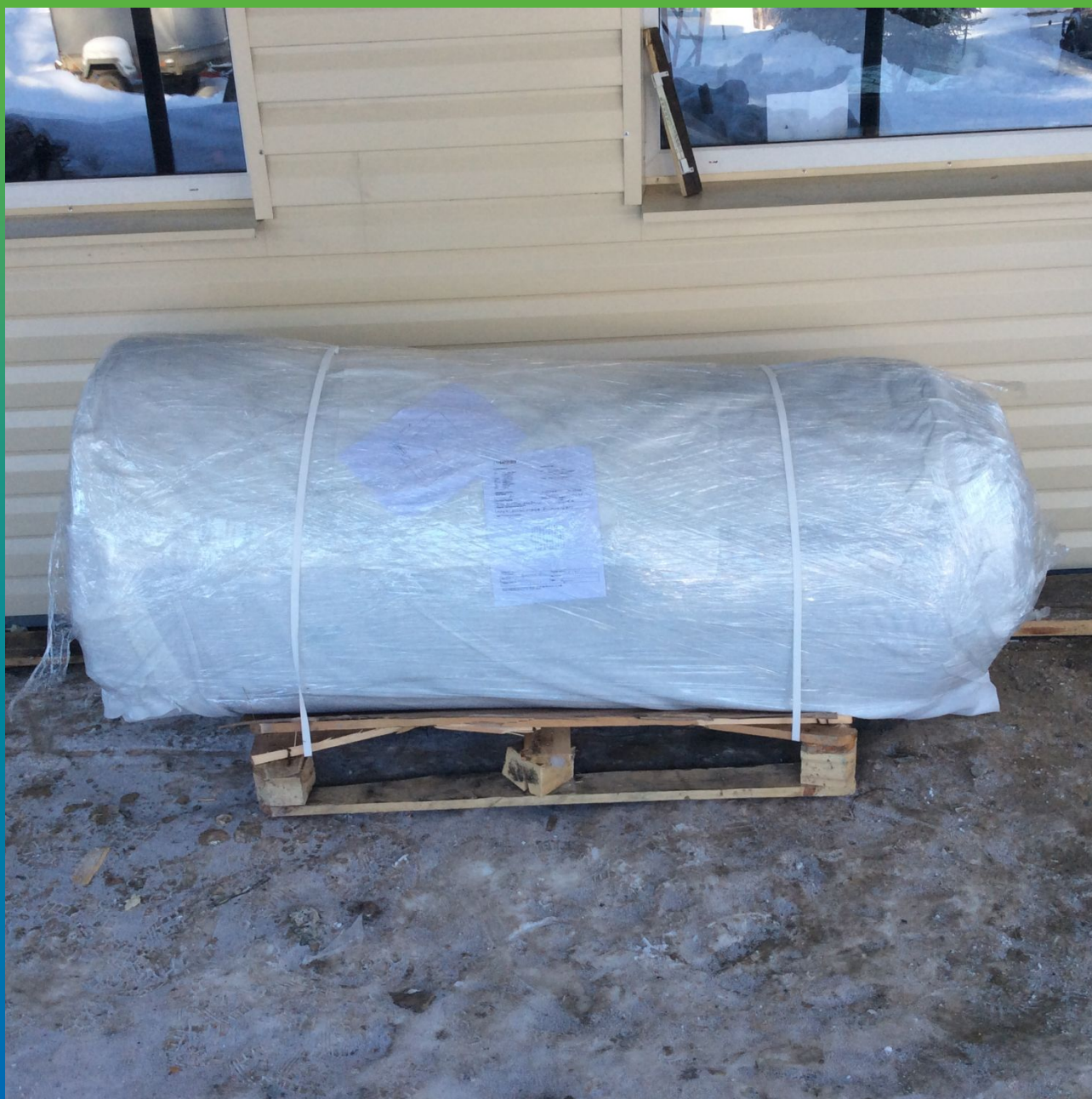
ЭПДМ мембрана Преласта СТ 1.2мм на объекте