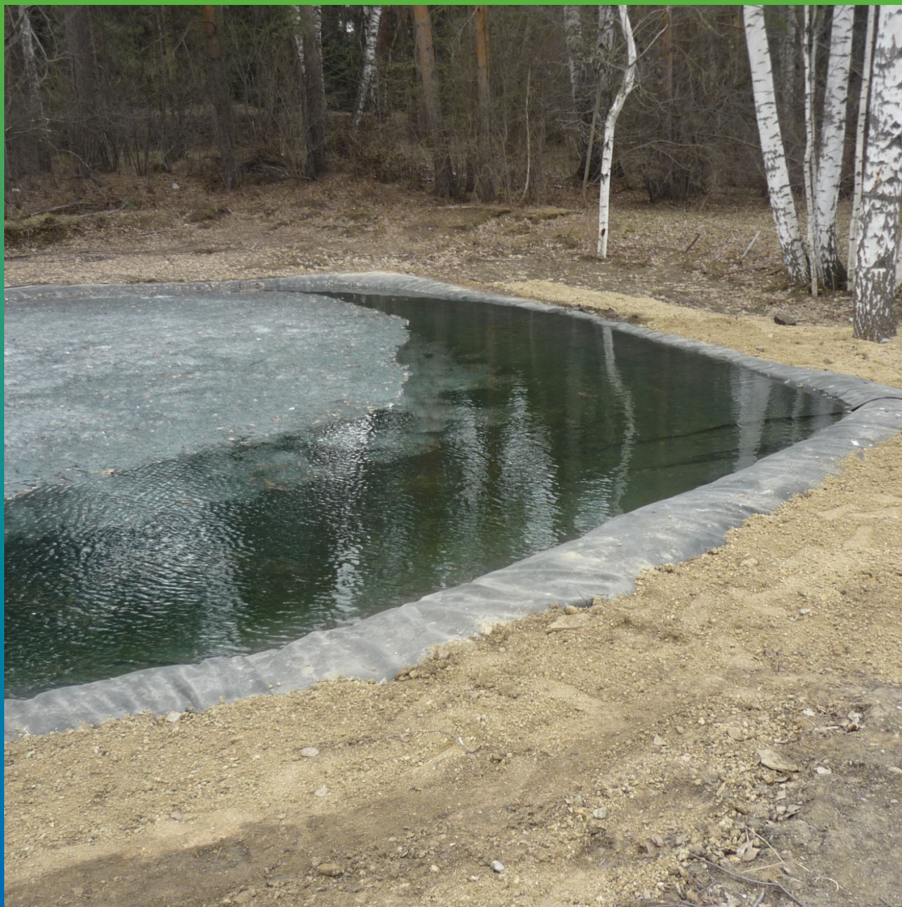
Финальный вид водоема