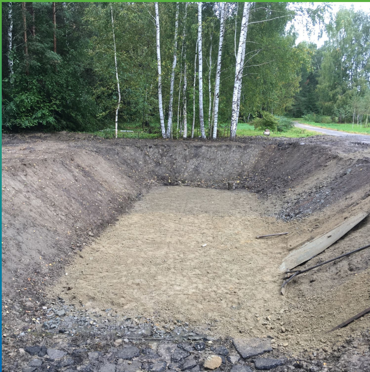
Вид выполненного котлована под водоем