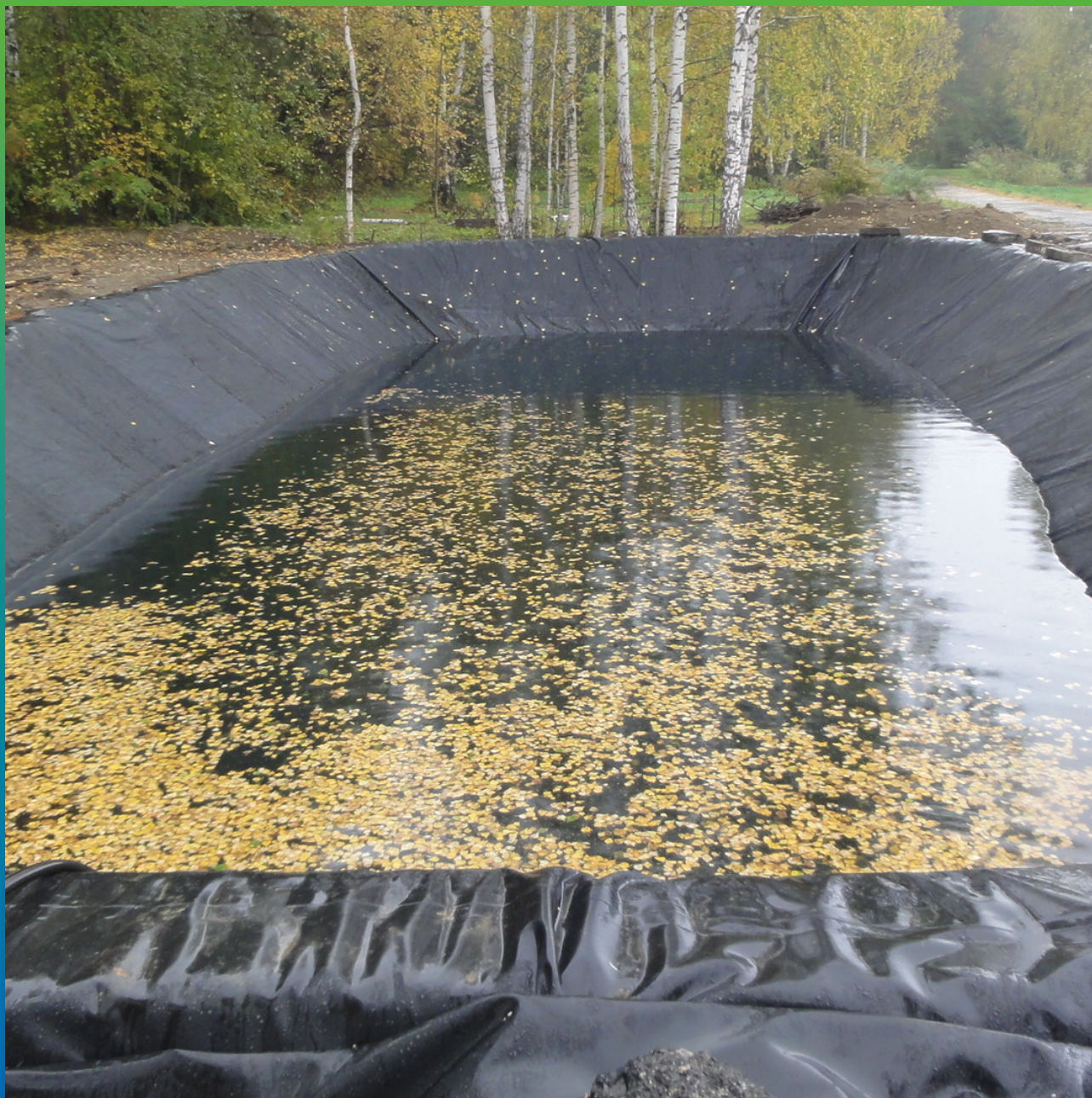
Вид уложенной ЭПДМ мембраны Прелести СТ 1.2мм