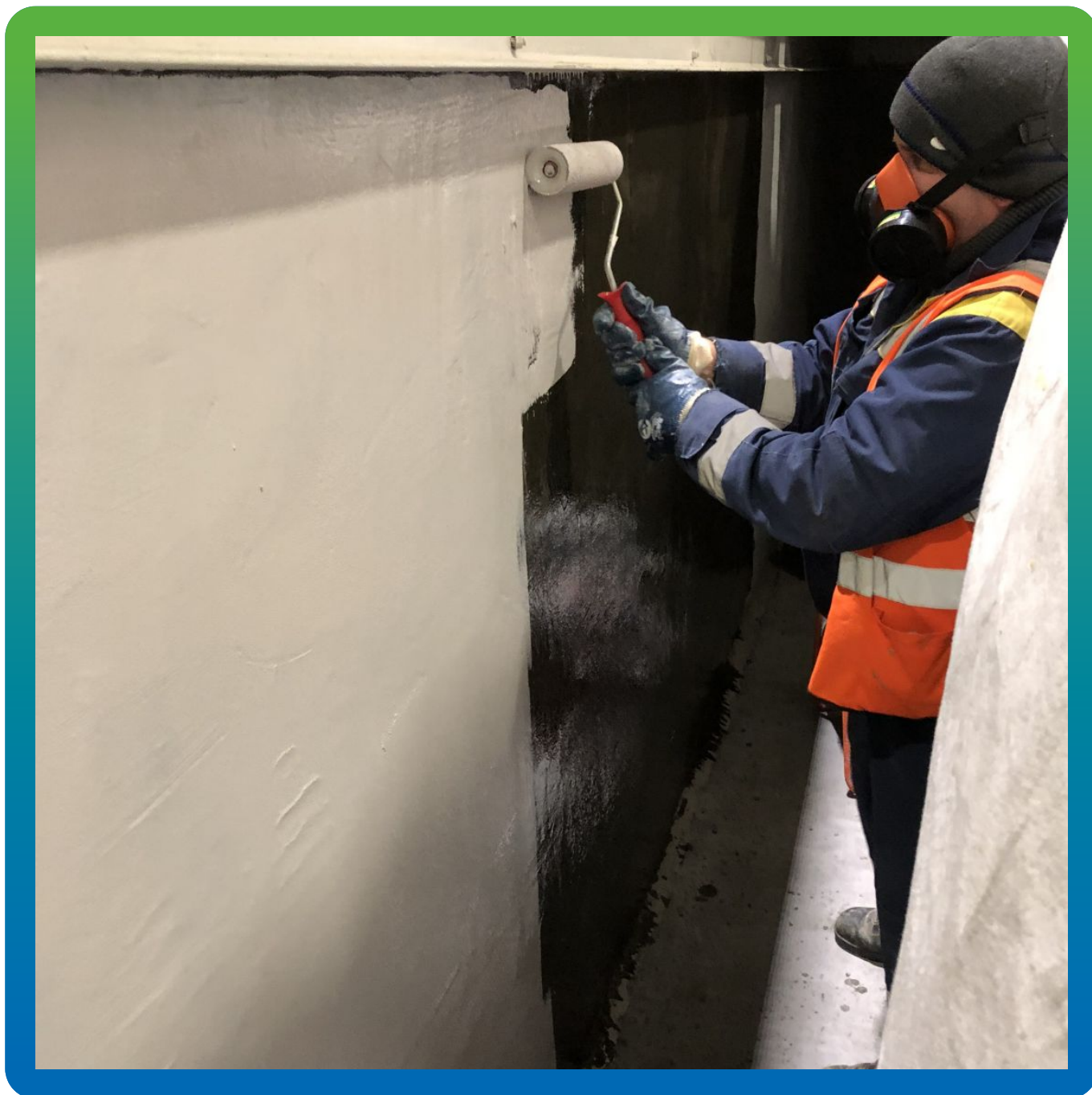
Производство работ. Нанесение ДенсТоп ПУ 227 Эластик на загрунтованное основание