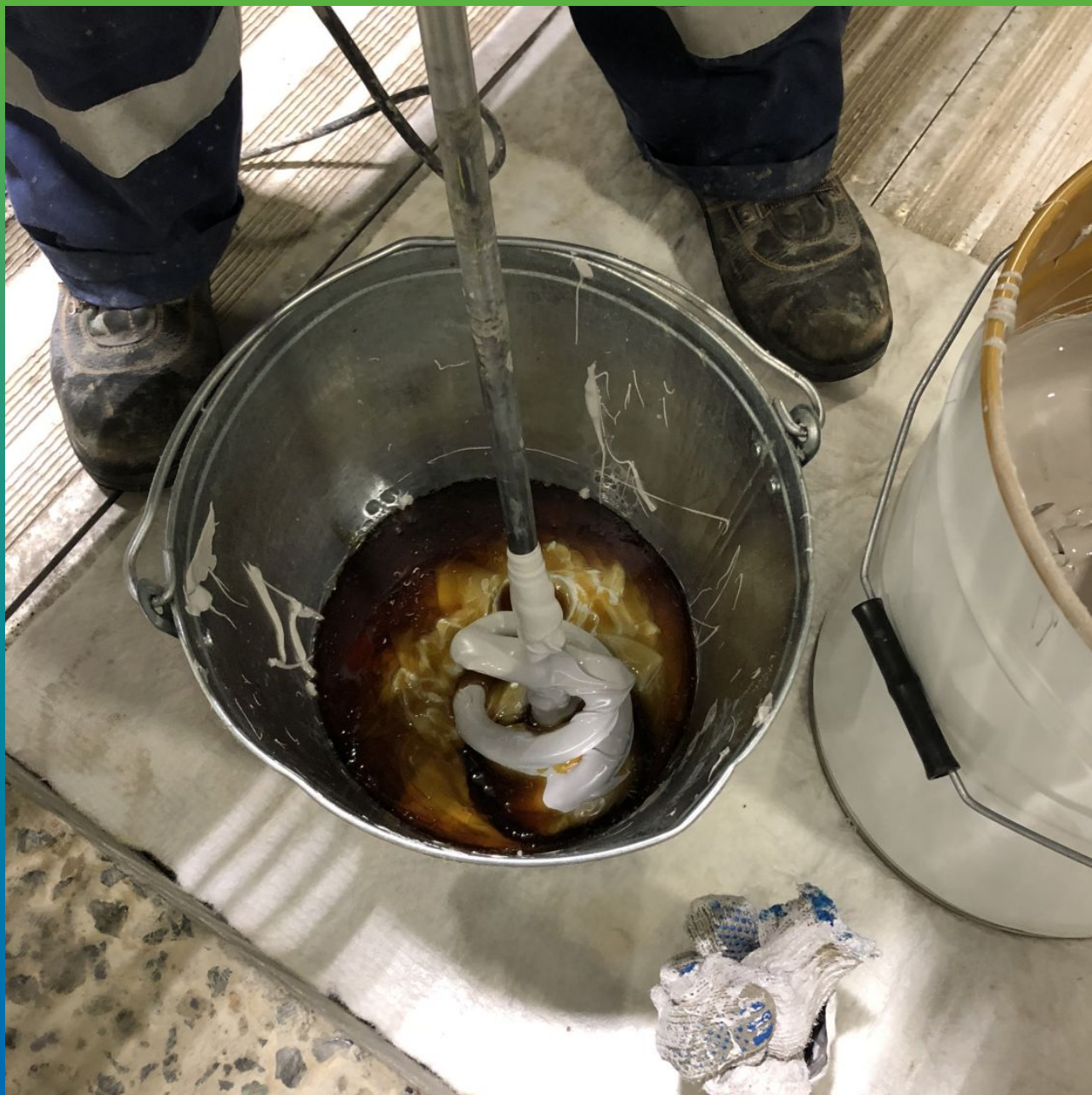
Подготовка материалов. Смешивание компонентов А и Б ДенсТоп ПУ 227 Эластик в пропорции по ТО