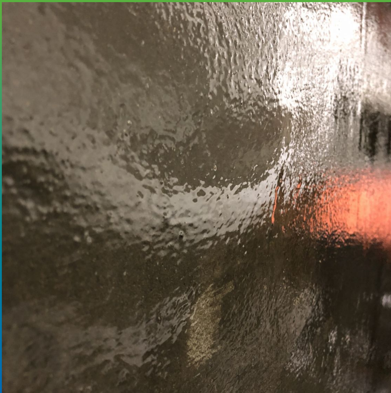
Внешний вид заржавленной поверхности