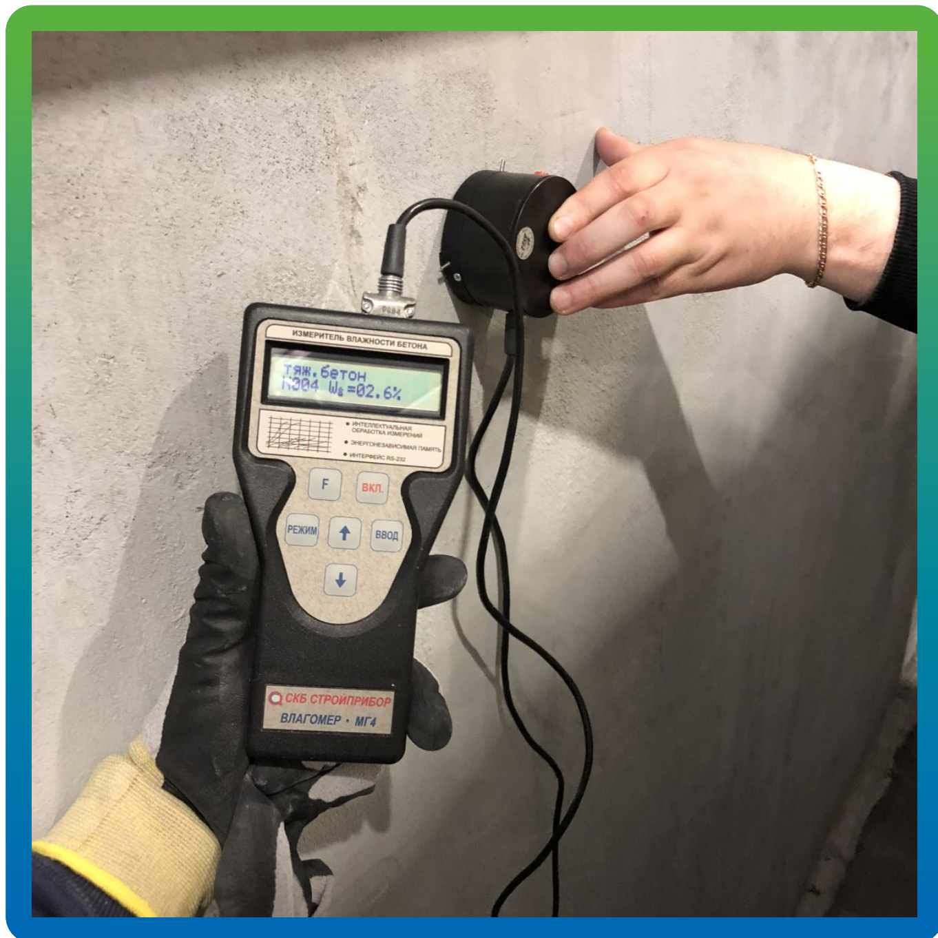
Подготовка основания. Замер влажности основания спец оборудованием