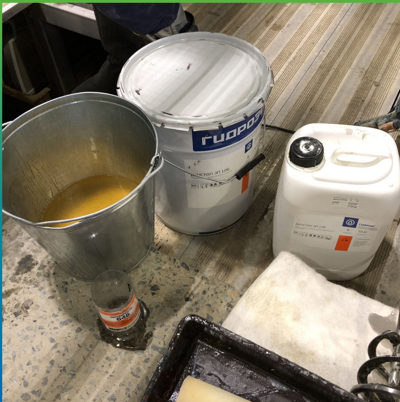
Материалы на объекте. Миксер и грунтовка на эпоксидной основе ДенСтон ЭП 106