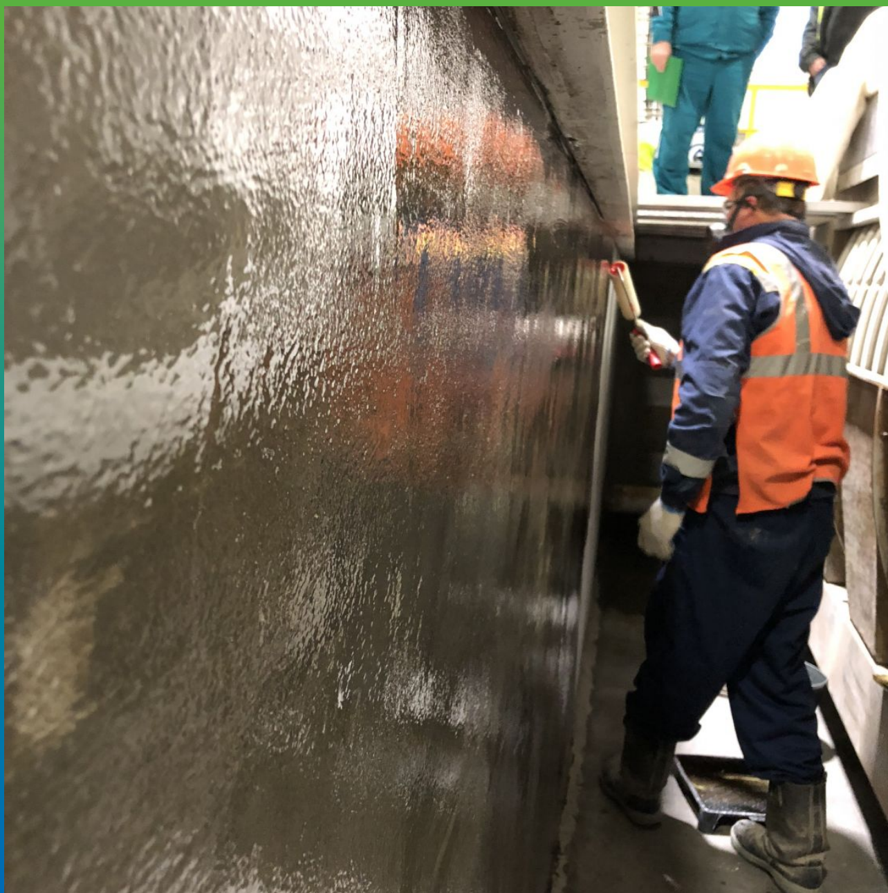
Процесс грунтования стены