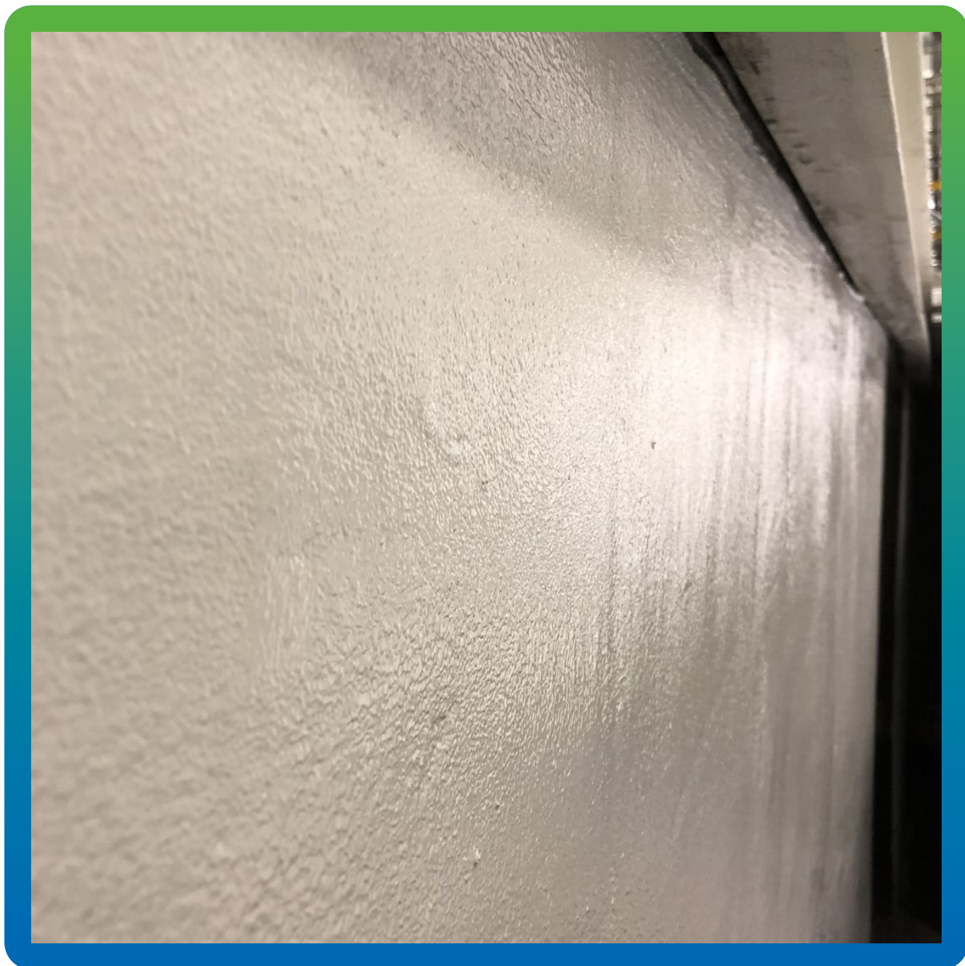
Финишный вид покрытия