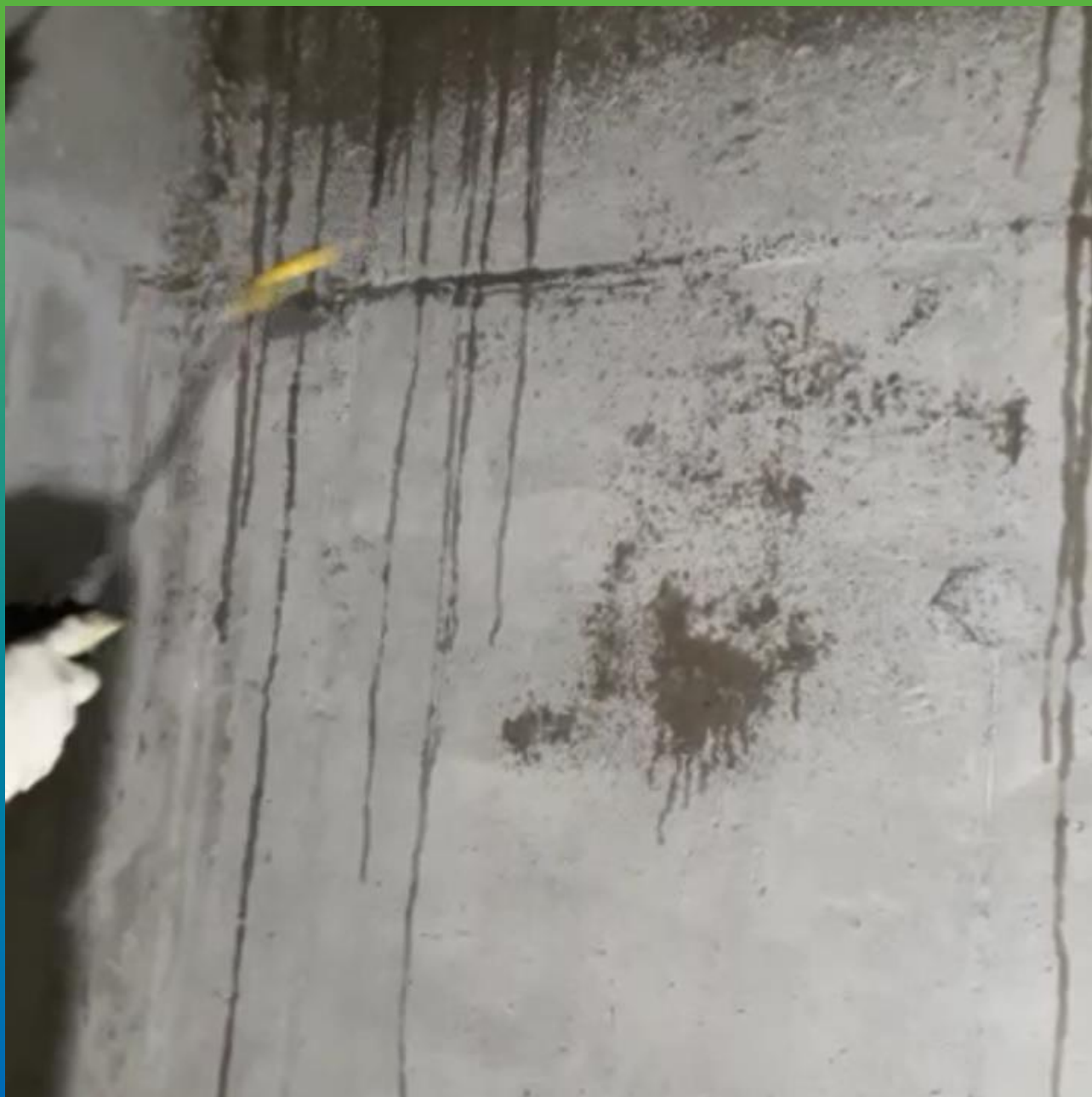
Смачивание поверхности резервуара