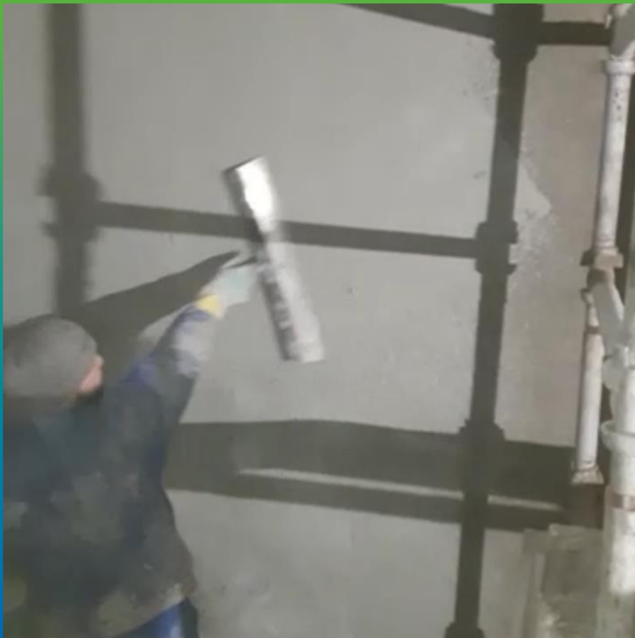
Разглаживание Стармекс Сил Флекс шпателем