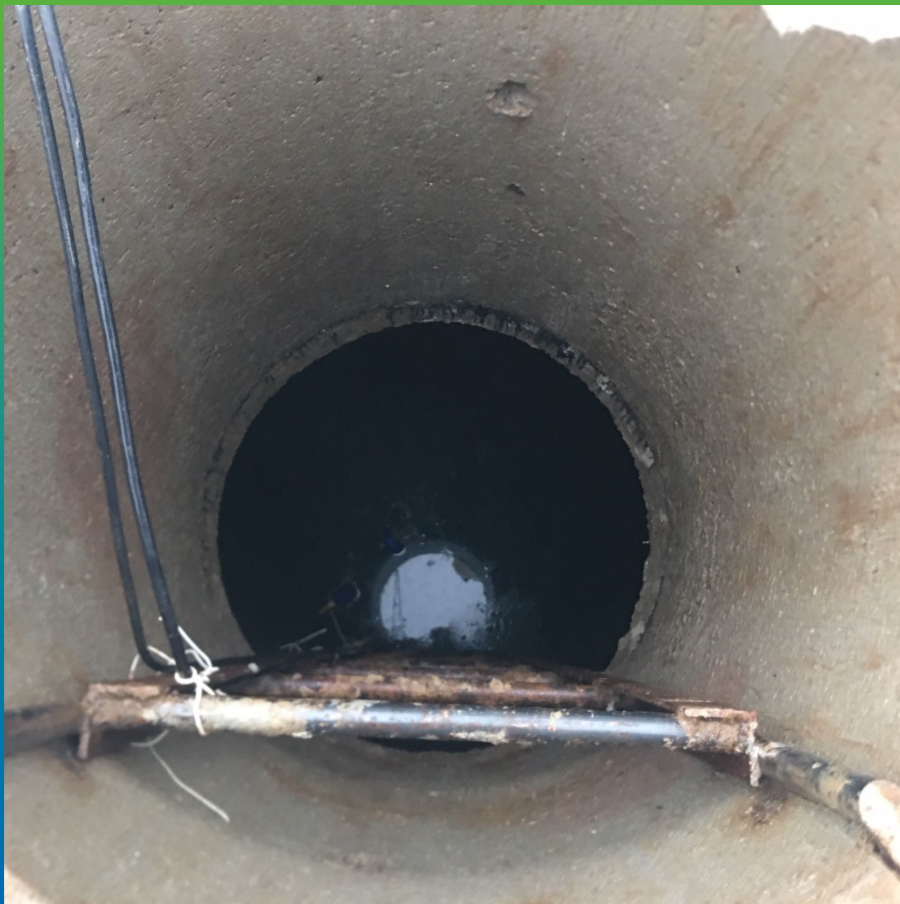
Резервуар в эксплуатации после ремонта