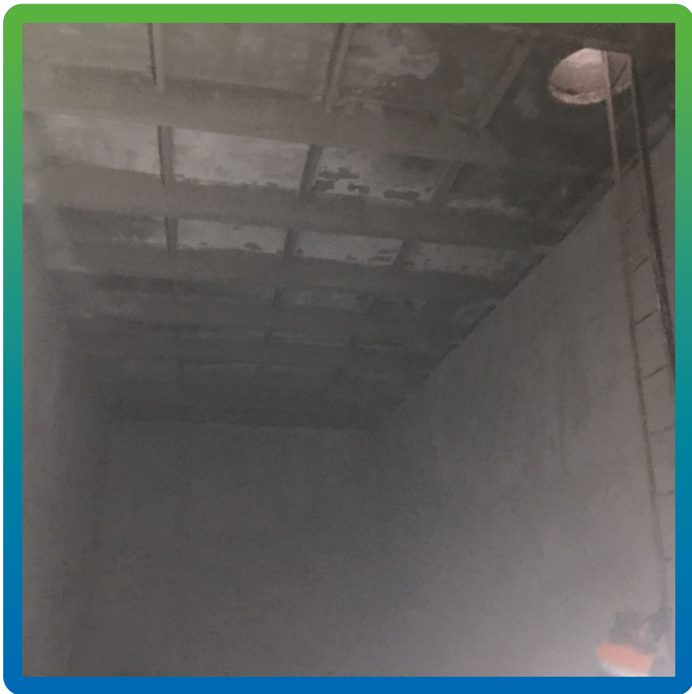
Вид резервуара изнутри