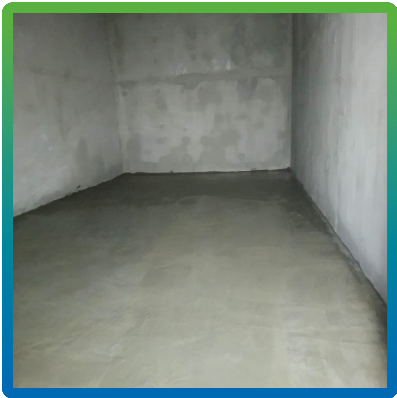
Резервуар после ремонта