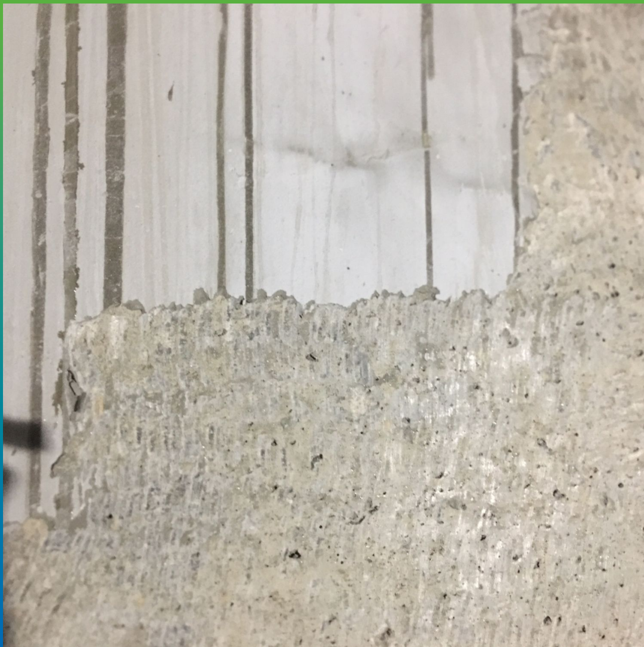
Удаление старой гидроизоляции с поверхности резервуара