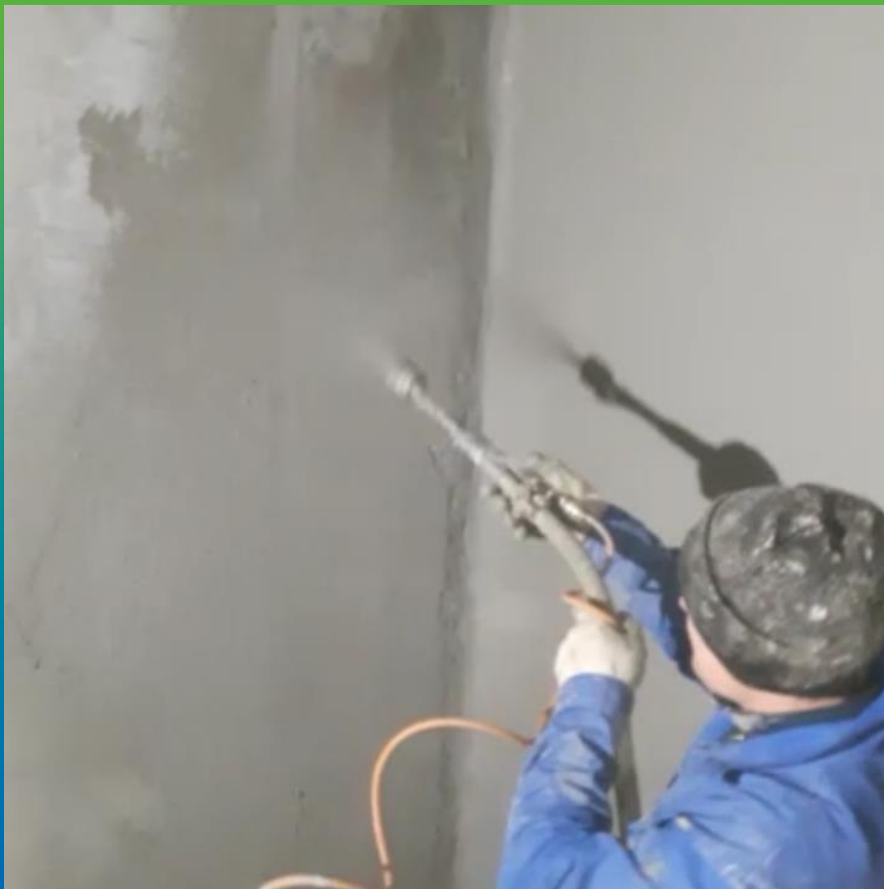
Механическое нанесение Стармекс Сил Флекс на поверхность резервуара