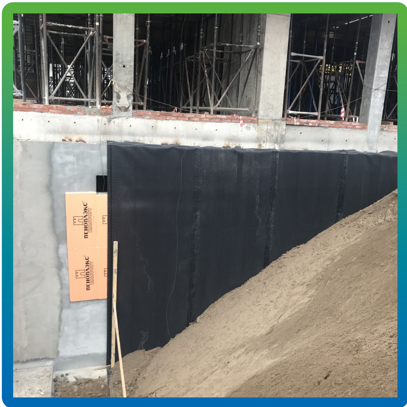
Готовый участок стен паркинга с обратной засыпкой.