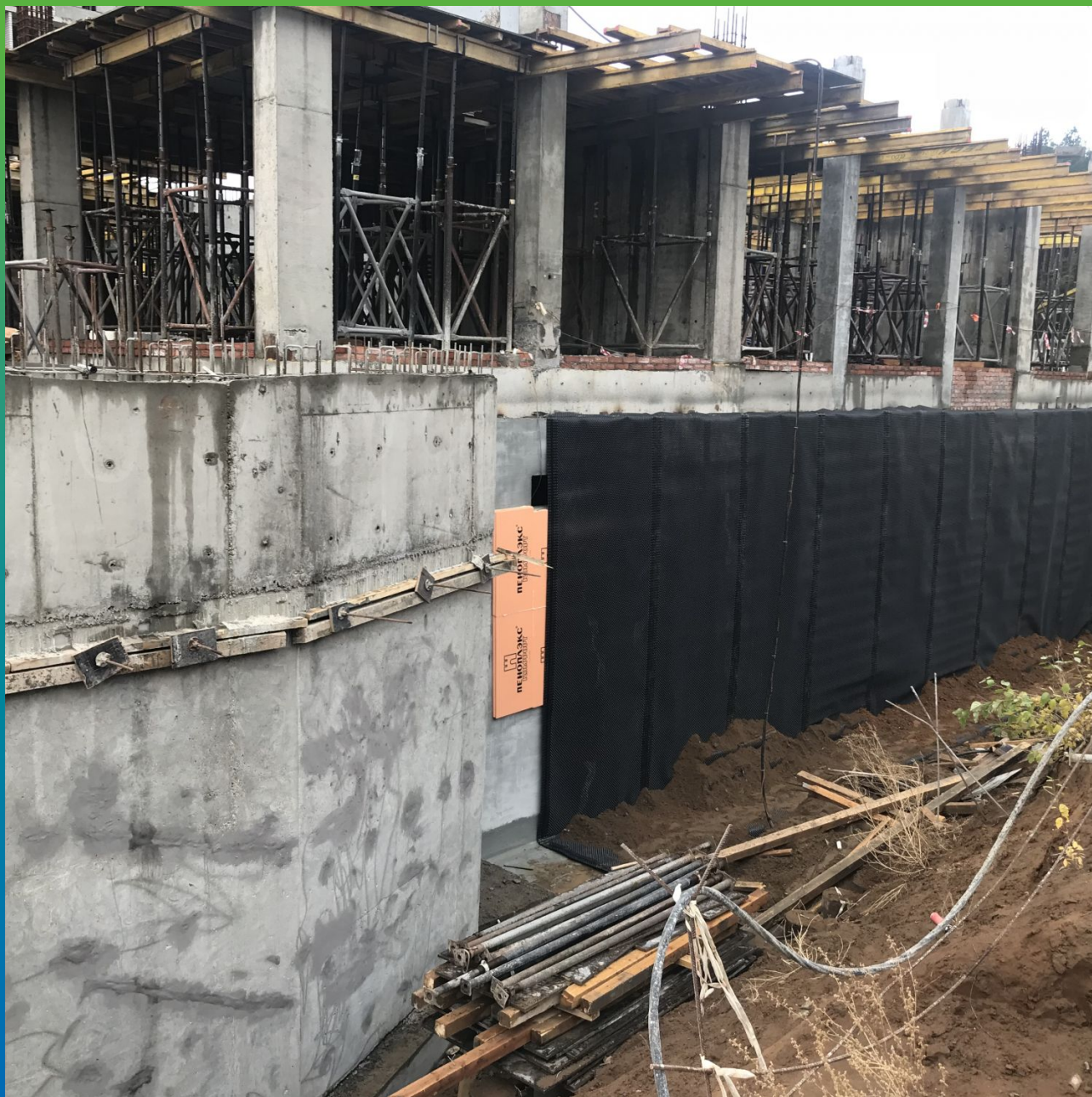
Защита гидроизоляционного покрытия дренажным полотном перед обратной засыпкой.