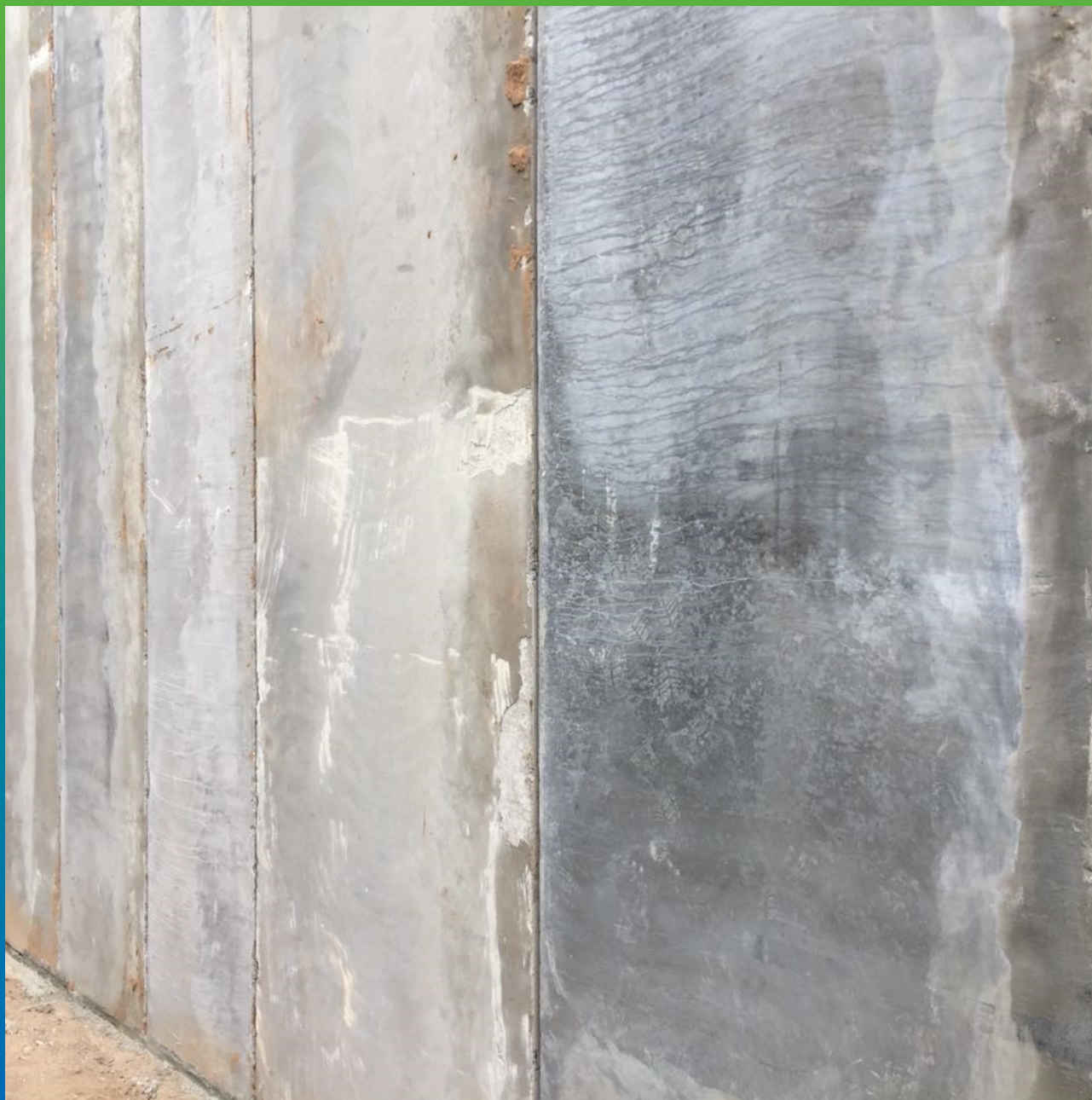
Подготовка стыка стена-пол для устройства галтели.