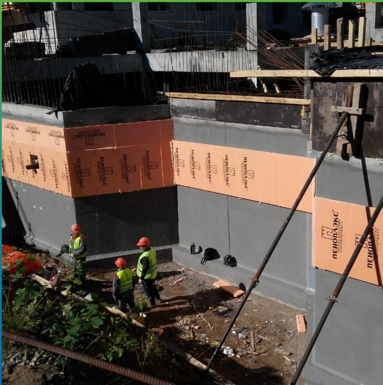
Монтаж утеплителя на гидроизоляционный состав.