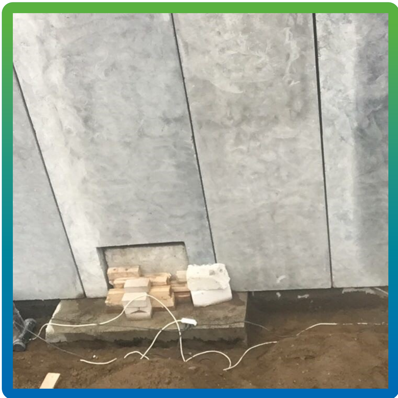
Готовое основание для проведения работ по гидроизоляции.