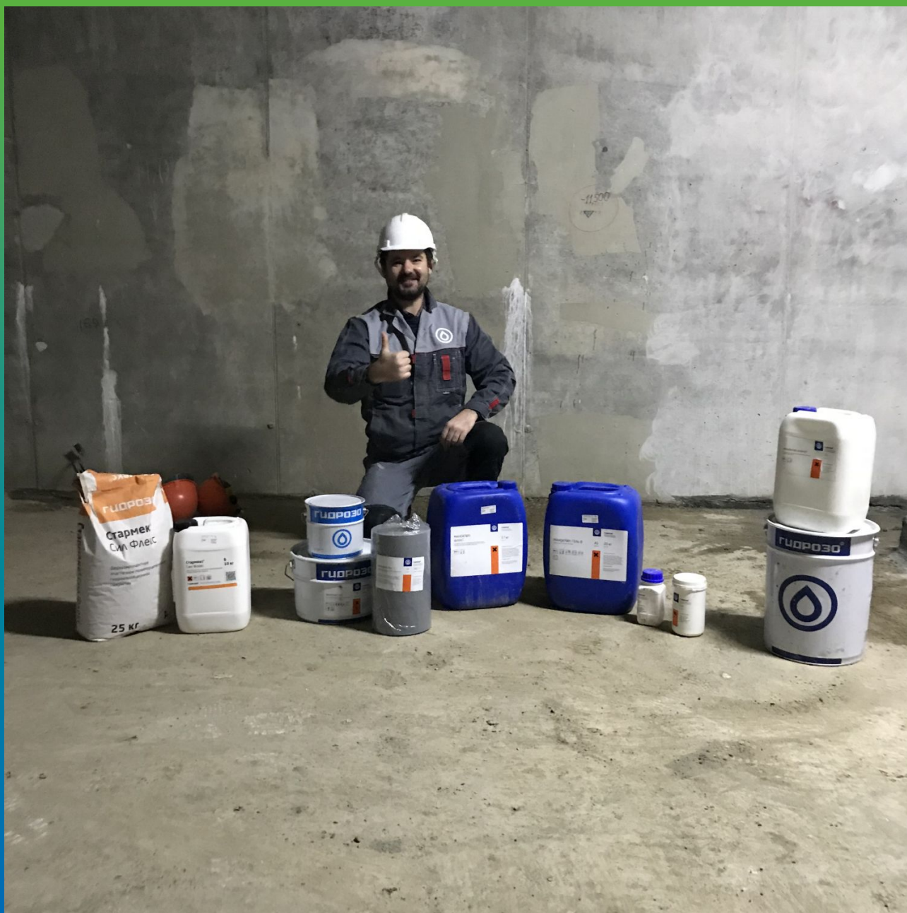
Технический специалист и материалы компании Гидрозо на объекте