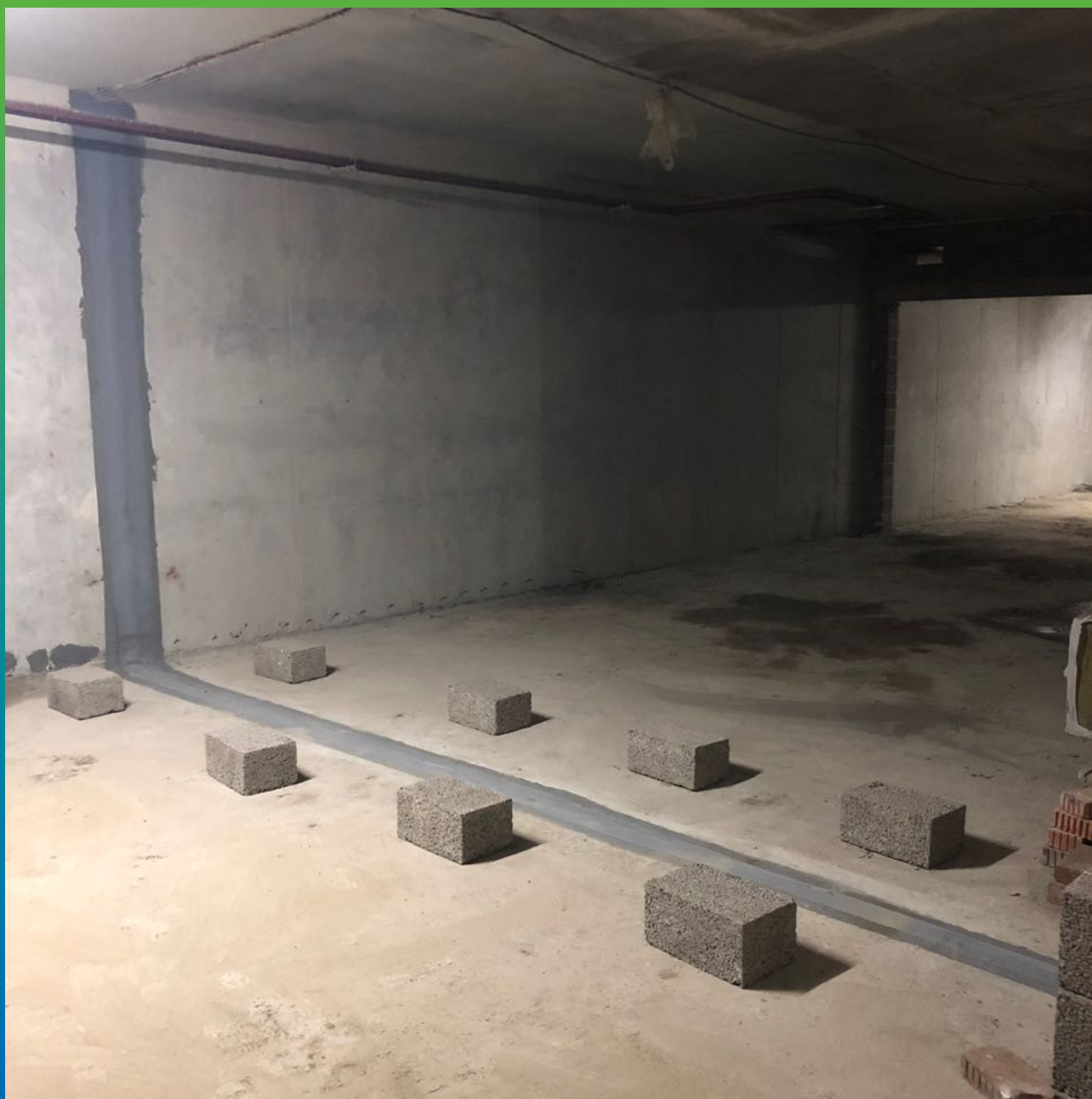
Выполненные работы по гидроизоляции деформационного шва