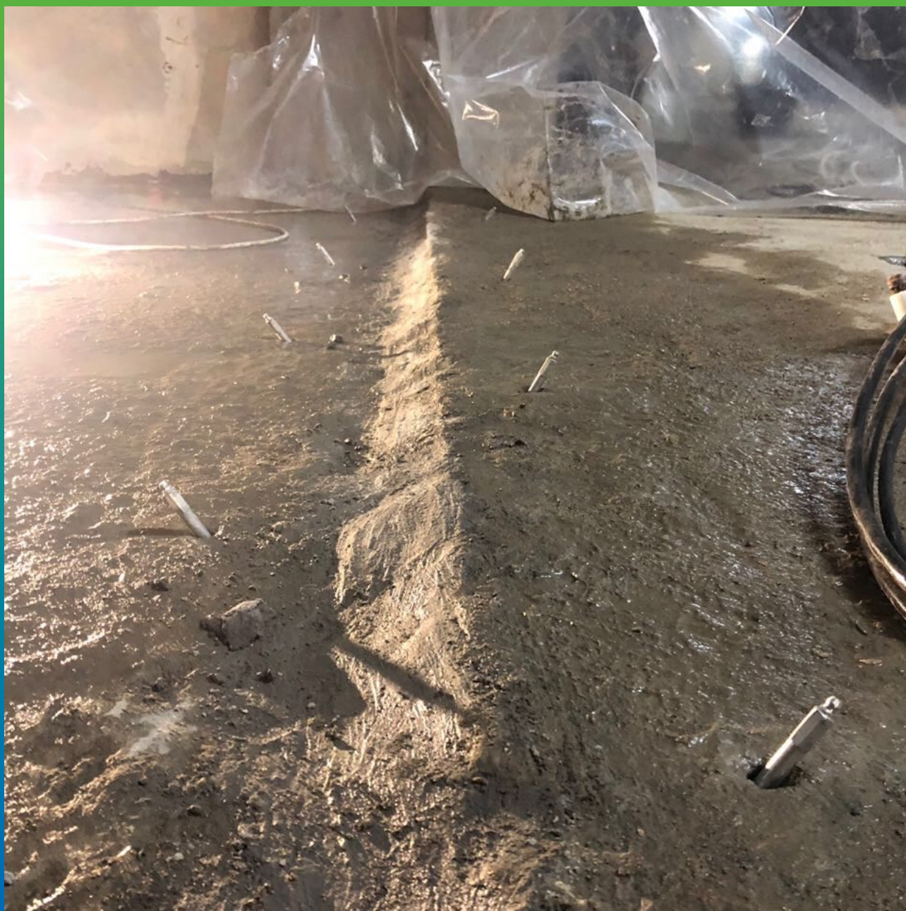
Шов, подготовленный к инъектированию