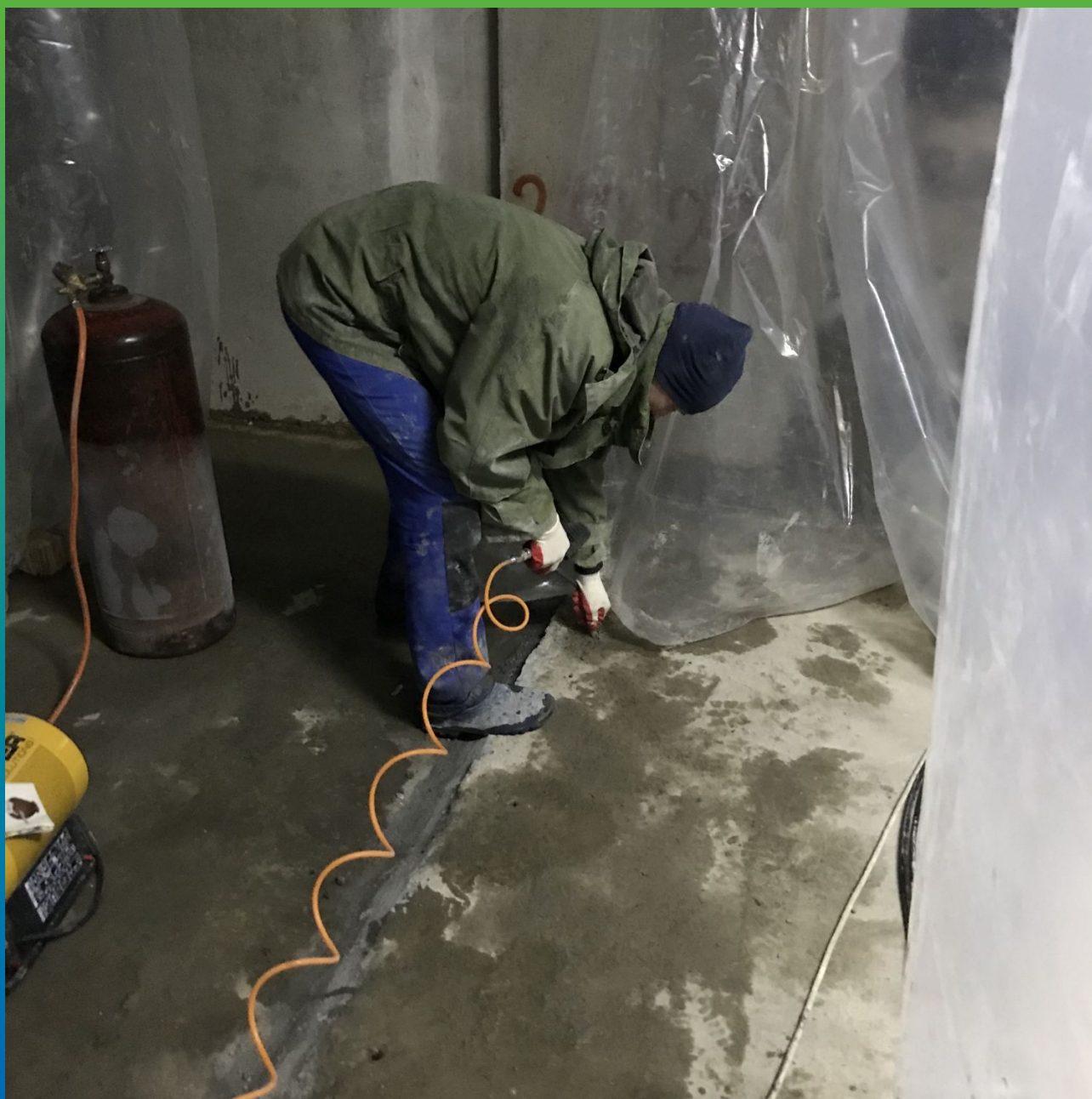
Очистка инъекционных каналов сжатым воздухом