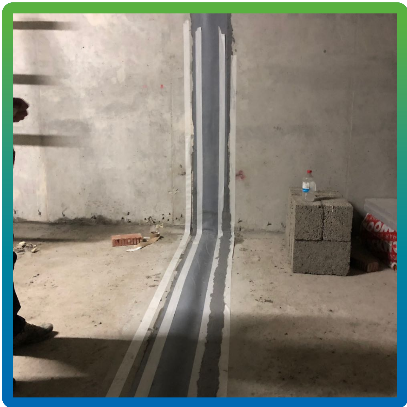
Монтаж системы Манодил Про