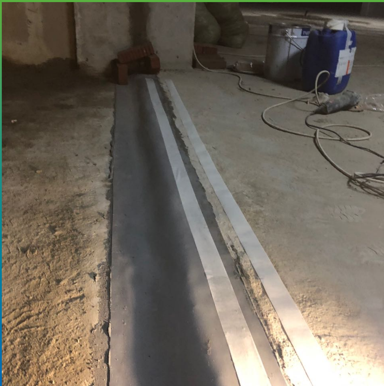
Монтаж системы Манодил Про после инъектирования геля