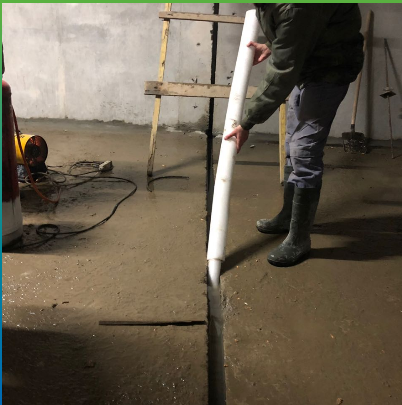
Монтаж вилатерма в полость деформационного шва