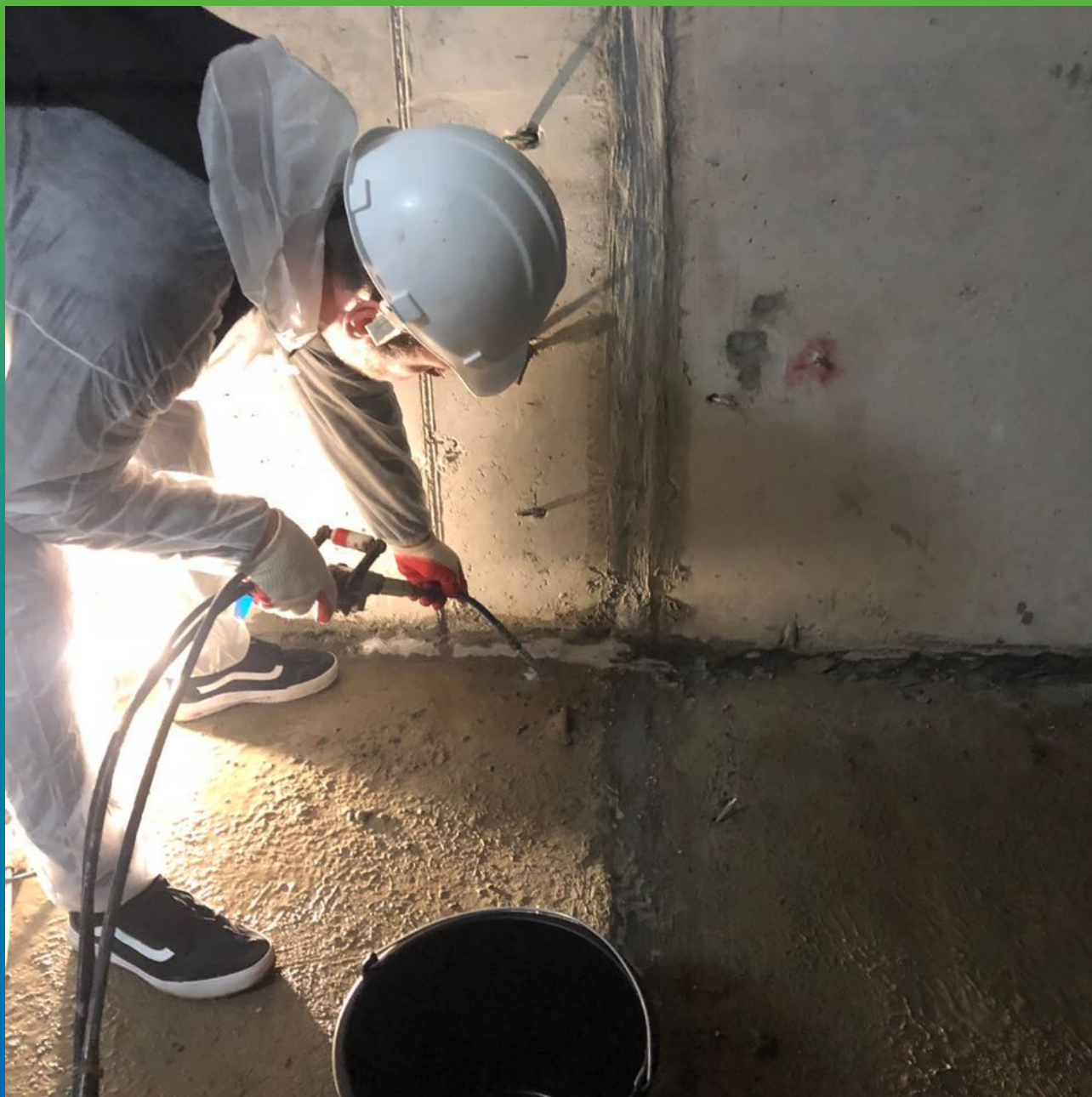
Инъектирование Манокрил Гель В