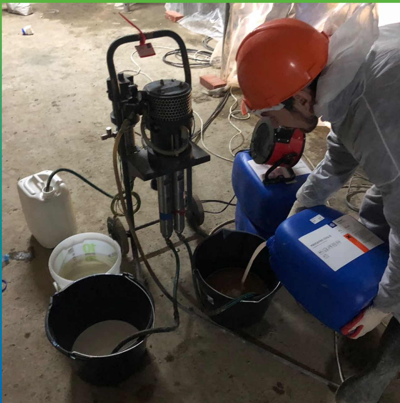
Смешивание компонентов инъекционного геля