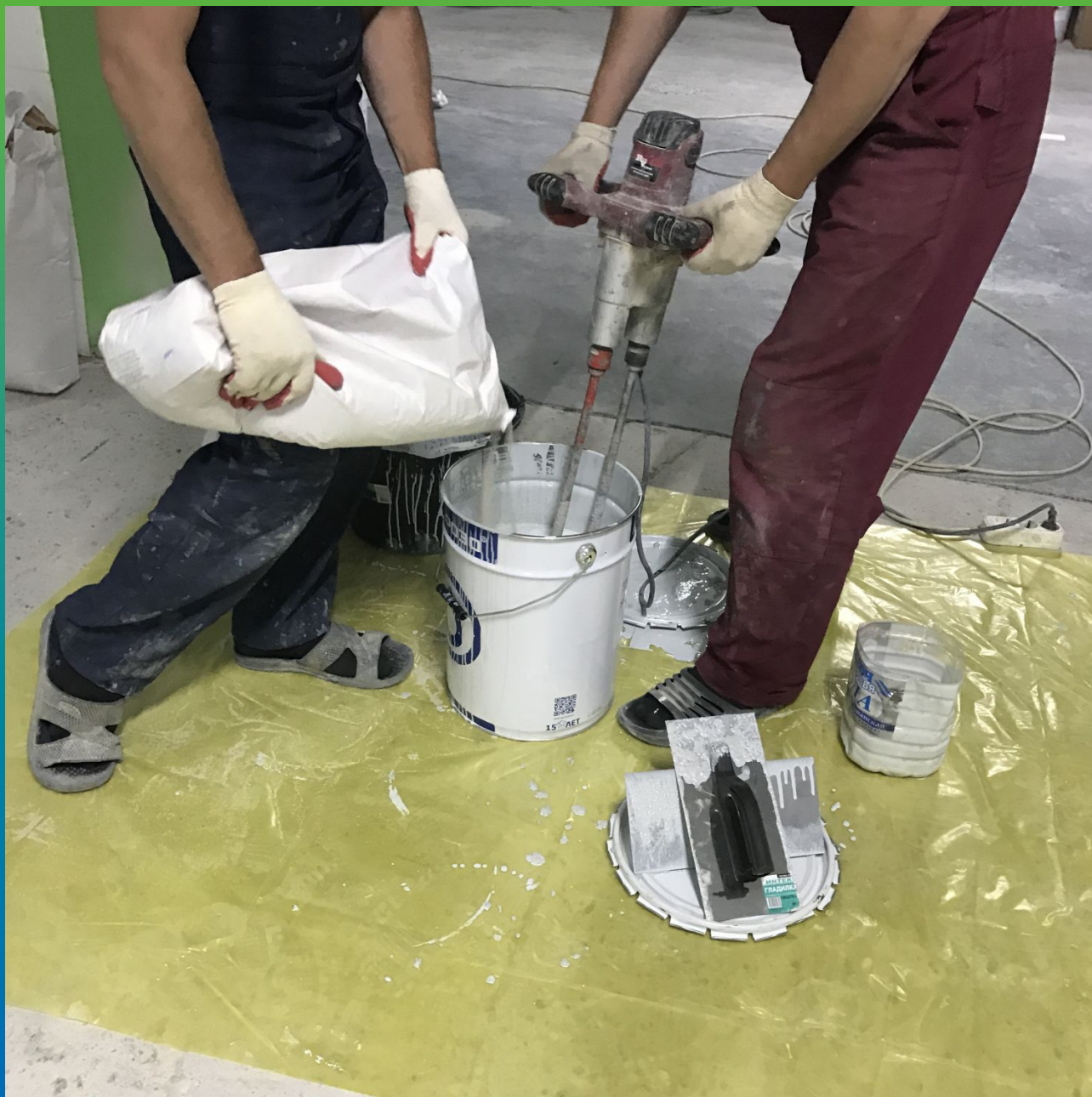
Наполнение состава ДенТоп ЭП 500 специальным наполнителем ДенТоп Филлер 004