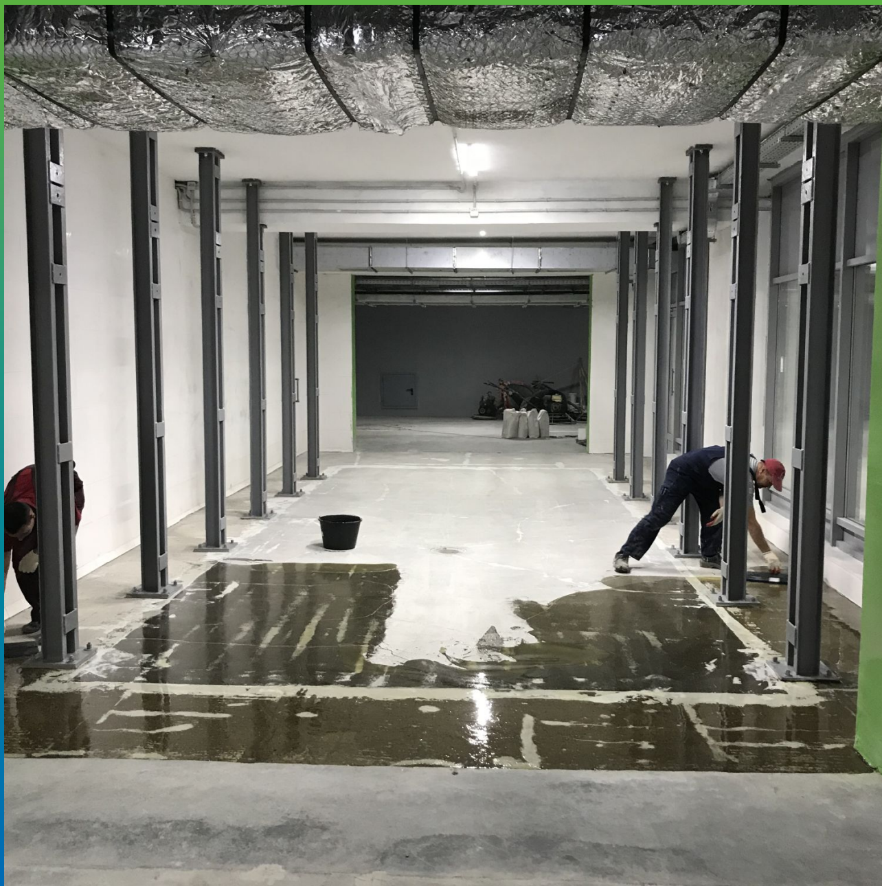
Грунтование поверхности составом ДенсТоп ЭП 106