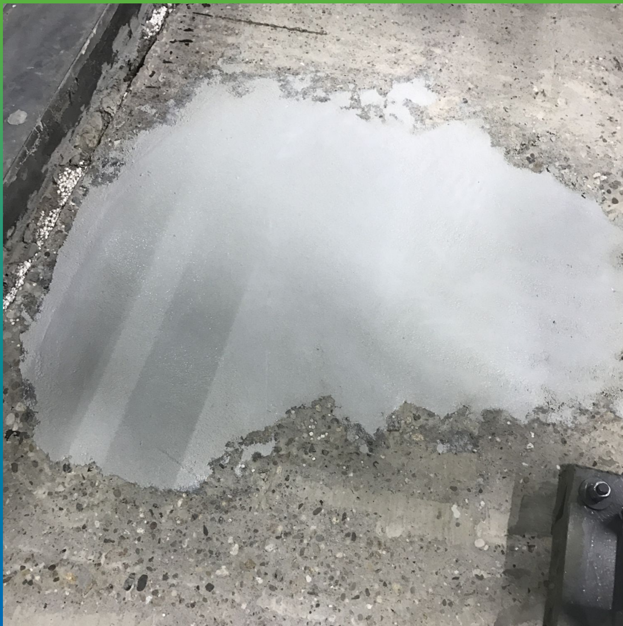
Ремонт дефектных участков пола автомойки составом ДенсТоп ЭП 500