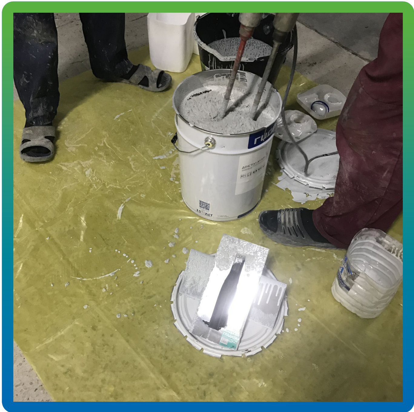
Замешивание состава ДенсТоп ЭП 500