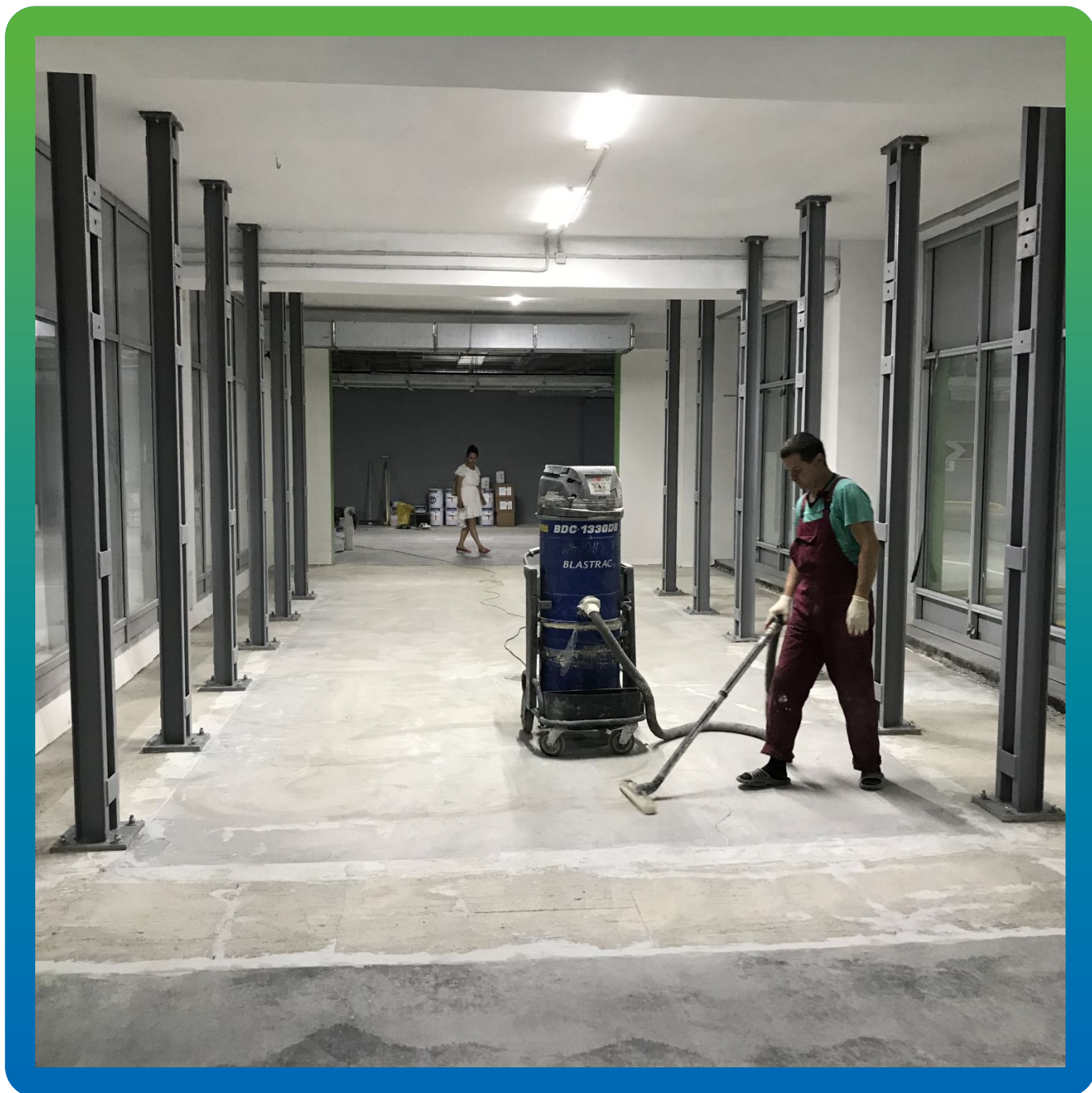
Подготовка пола перед проведением работ по устройству полимерного покрытия ДенсТоп ЭП 500