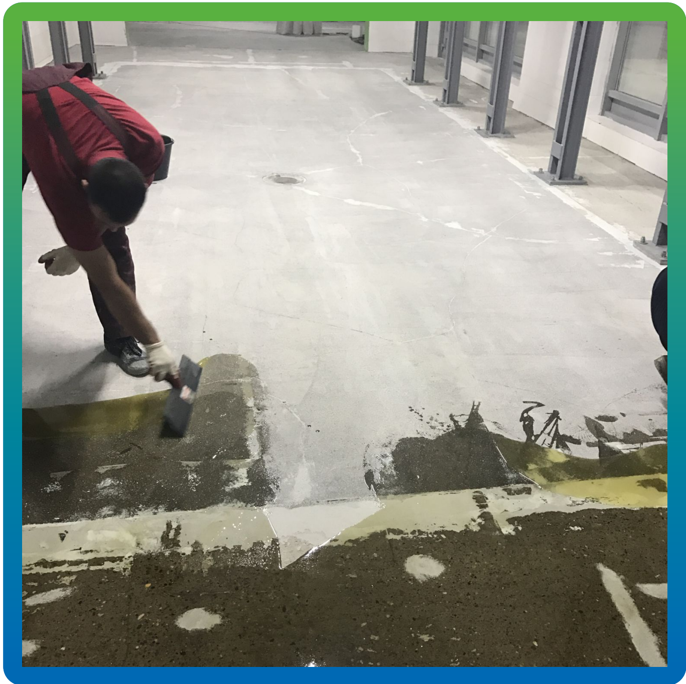
"Вытягивание" состава ДенсТоп ЭП 500 по поверхности пола