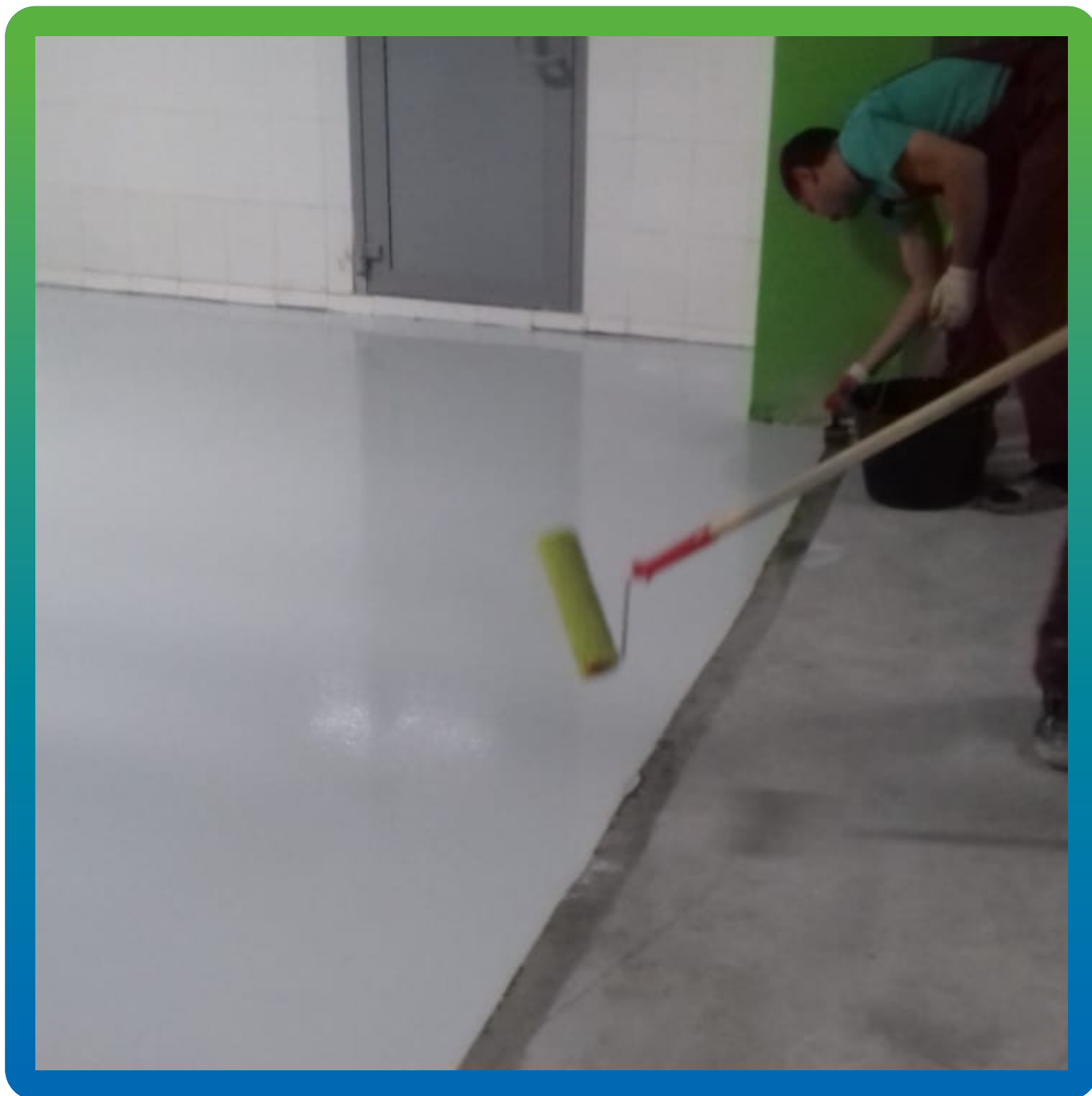
Нанесение финишного слоя спец. лака ДенсТоп ПУ 310