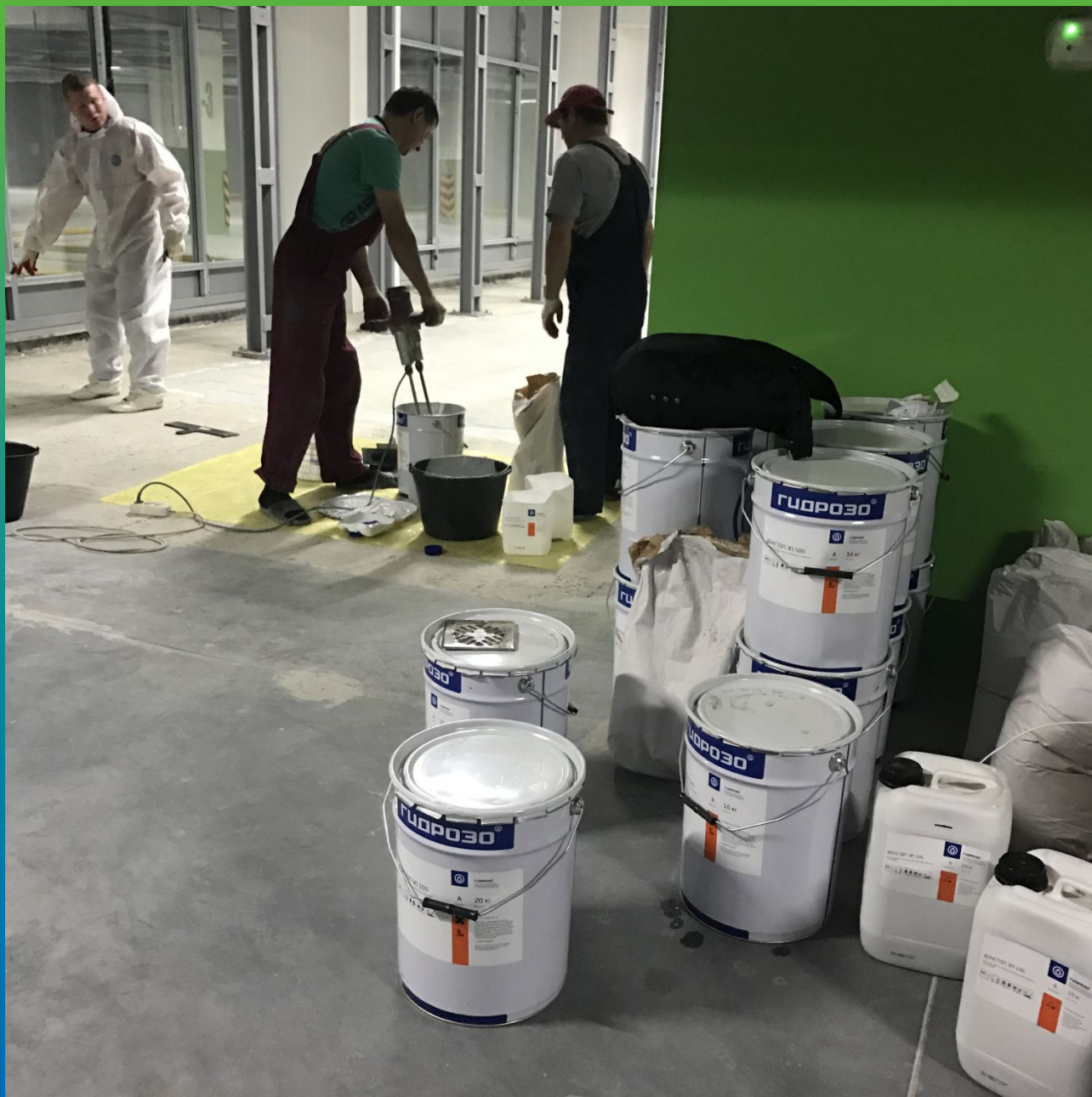
Замешивание состава ДенсТоп ЭП 500